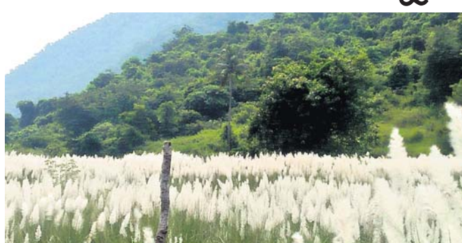
ଗଣିଆ ଅଞ୍ଚଳରେ କାଶତଣ୍ଡୀ ଫୁଲର ସମାର।