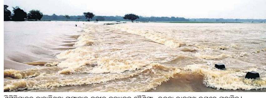
ଶିଳିପିପାଳରୁ ବାହାରିଥିବା ଗଙ୍ଗାହାର ନଦୀର ବନ୍ୟାକଳ ଦୈନିକ-ଉଦ୍ୟାନ ରାଜପଥ ଉପରେ ପ୍ରବାହିତ।