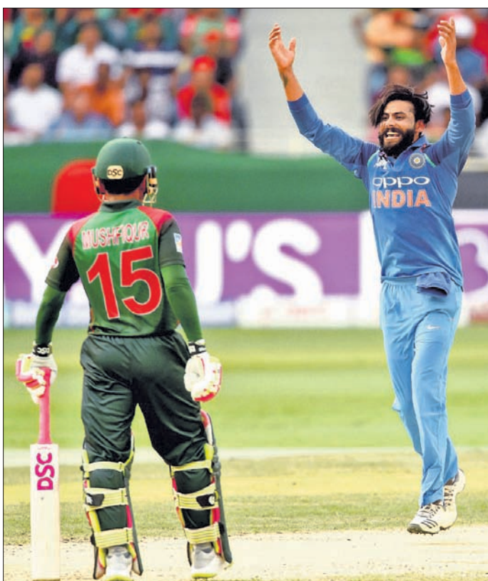
ଉଇକେଟ ହାସଲ ପରେ ଉଇକେଟ ରବୀନ୍ଦ୍ର ଜାଡେଜା (ଡାହାଣ) ।

ପ୍ରତ୍ୟାବର୍ତ୍ତନରେ ରବୀନ୍ଦ୍ର ଜାଡେଜାଙ୍କ ଦମ୍ଭାବର ବୋଲିଂ ଓ ଅଧିନାୟକ ରୋହିତ ଶର୍ମାଙ୍କ ଉପଯୋଗୀ ବ୍ୟାଟିଂ ବଳରେ ଭାରତ ଶୁକ୍ରବାର ଅନୁଷ୍ଠିତ ଏସିଆ କପ୍ ଫୁପର-୪ ପର୍ଯ୍ୟାୟର ପ୍ରଥମ ମ୍ୟାଚରେ ବାଂଲାଦେଶକୁ ୮୨ଟି ବଲ୍ ବାକି ଆଇ ୬ ଉଇକେଟରେ ଅତି ସହଜରେ ପରାସ୍ତ କରିଛି । ଏହା ପୂର୍ବରୁ ଭାରତ ଗୁପ୍ତ ପର୍ଯ୍ୟାୟରେ ହିନ୍ଦି ଓ ପାକିସ୍ତାନକୁ ହରାଇଥିଲା । ଚତୁର୍ଥ ଦିନ ବ୍ୟାଟିଂ ପାଇଁ ଆମନ୍ତ୍ରଣ ପାଇଥିବା ବାଂଲାଦେଶ ଭାରତୀୟ ବୋଲରଙ୍କ ସମ୍ମୁଖୀନ ହୋଇ ନ ପାରି ୪୯.୧ ଓଭରରେ ୧୨୩ ରନ କରି ଅଲଆଉଟ୍ ହୋଇଥିଲା । ଜବାବରେ ଭାରତ ୩୬.୨ ଓଭରରେ ୩ ଉଇକେଟ ହରାଇ ୧୭୪ ରନ କରି ବିଜୟ ହାସଲ କରିଛି । ୧୦୪ଟି ବଲର ସମ୍ମୁଖୀନ ହୋଇ ୫ ଚୋକା ଓ ୩ ଛକା ସହ ରୋହିତ ୮୩ ରନ କରି ଅପରାଜିତ ରହିବା ସହ ବିଜୟରେ ପ୍ରମୁଖ ଭୂମିକା ଗ୍ରହଣ କରିଛନ୍ତି । ଓପନର ଶିଖର ଧାଓନ ୪୦, ଅଧିତି ରାୟୁଡ୍ ୧୩ ଓ ଅଭିଜିତ ମହେନ୍ଦ୍ର ସିଂ ଧୋନୀ ୩୩ ରନ କରି ଆଉଟ୍ ହୋଇଥିଲେ । ଦାନେଶ କାଜିକ ୧ ରନ କରି ଅପରାଜିତ ରହିଥିଲେ । ବାଂଲାଦେଶ ତରଫରୁ ମାଣ୍ଡିଫି ମୋର୍ତ୍ତାଜା, ସାଜିବ ଅଲି ହାସନ ଓ ରୁବେଲ ହୋସେନ ଗୋଟିଏ ଲେଖାଏ ଉଇକେଟ ହାସଲ କରିଥିଲେ । ୨୯ ରନ ବ୍ୟୟ କରି ମୁଲ୍ୟାବାନ ୪ ଉଇକେଟ ନେଇଥିବା ଜାଡେଜାଙ୍କୁ ପ୍ରେୟାର ଅଫ