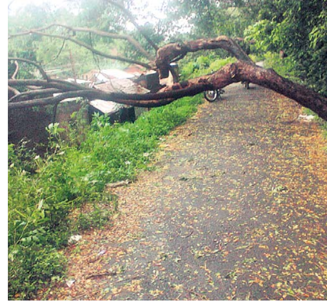
ଗଛପଡ଼ି ରାସ୍ତା ଅବରୋଧ ହୋଇଛି ।

ରାତି ୧୨ଟାଠାରୁ ଶୁକ୍ରବାର ସନ୍ଧ୍ୟା ସାଢ଼େ ୫ଟା ପର୍ଯ୍ୟନ୍ତ ବିଦ୍ୟୁତ୍ ସରବରାହ ବନ୍ଦ ରହିଥିଲା । ଏଥିଯୋଗୁ ଜଳ ଯୋଗାଣ ଅଞ୍ଚଳରେ ନ ଥିଲା । ବିଦ୍ୟୁତ୍ କାଟ ସମ୍ପର୍କରେ ବିଭାଗୀୟ ଅଧିକାରୀମାନଙ୍କୁ ଯୋଗାଯୋଗ କରାଯାଇଥିଲେ ମଧ୍ୟ