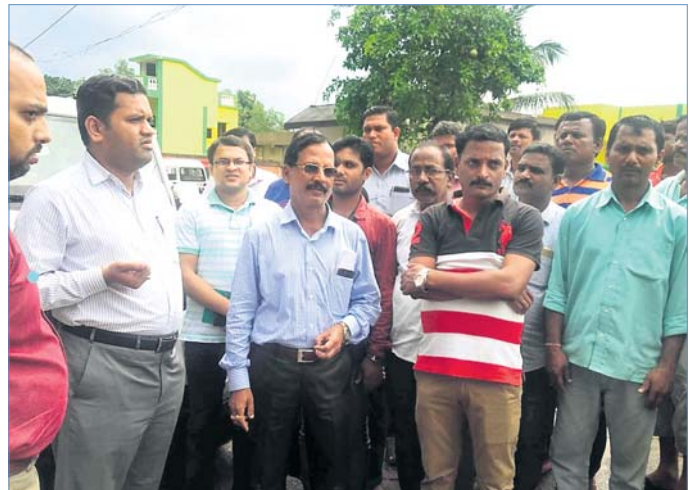
ଜିଲ୍ଲାପାଳ ବିଭୂତା ଗ୍ରାମ ପରିବର୍ତ୍ତନ କରୁଛନ୍ତି।