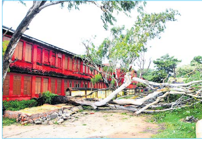
ଝଟକାତ୍ୟାରେ ପୁରୀ ସମ୍ବିଧ୍ୟାୟ ମହାବିଦ୍ୟାଳୟ ପରିସରରେ ୨ଟି ଗଛ ଉପୁଡ଼ି ପଡ଼ିଛି ।

ବାତ୍ୟା ଆଶଙ୍କା ଚଳିଥିଲେ ବି ଶୁକ୍ରବାର ଦିନତମାମ ପୁରୀରେ ପାଗ ମେଘୁଆ ରହିବା ସାଙ୍ଗକୁ ପବନ ଛାଡ଼ି ରହିଛି । ଲଘୁଚାପ ପ୍ରଭାବରେ ସମୁଦ୍ର ବି ଅଶାନ୍ତ ରହିଛି । ପ୍ରତି ୬ ସେକେଣ୍ଡରେ ୫୫୫ ଫୁଟ ଉଚ୍ଚରେ କୁଆର ଆସୁଛି । ସମୁଦ୍ର ସ୍ତର କମିବା ଲାଗି ପର୍ଯ୍ୟଟକ ସୁରକ୍ଷିତ ମଣ୍ଡାନାହାଛି । ଅନ୍ୟପକ୍ଷରେ ସମୁଦ୍ର ଅଶାନ୍ତ ରହିଥିବାରୁ ମତ୍ସ୍ୟଜୀବୀ ସମୁଦ୍ରକୁ ନ ଯାଇ ହାତବାନ୍ଧି ବସିଛନ୍ତି । ବଙ୍ଗୋପସାଗରରେ ସୃଷ୍ଟି ଲଘୁଚାପ ଅବପାତ ରୂପ ନେବା ପରେ ଝଟକାତ୍ୟା ହେବାର ଆଶଙ୍କା ରହିଥିଲା । ଏପରି କି ୬୦ରୁ ୮୦ କିମି ବେଗରେ ପବନ ବହିବାର ପୂର୍ବାନୁମାନ କରାଯାଇଥିଲା । କିନ୍ତୁ ଗୁରୁବାର ଦିନତମାମ ବର୍ଷା ଛାଡ଼ି ରହିଥିଲା । ରାତି ୧୦ଟା ପରଠାରୁ ପବନ ଆରମ୍ଭ ହୋଇଯାଇଥିଲା ।