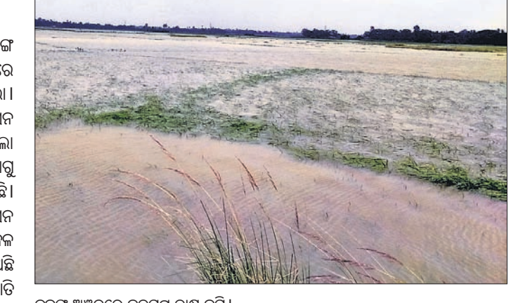
କୁଜଙ୍ଗ ଅଞ୍ଚଳରେ ଜଳମଗ୍ନ ଗଣ୍ଡା ଜମି।

ବୁଲ୍ ସପ୍ତାହ ତଳେ ୪୮ ଘଣ୍ଟା ଧରି କୁଜଙ୍ଗ ଅଞ୍ଚଳରେ ଲଘୁତାପ ଜନିତ ବର୍ଷାରେ ବ୍ୟାପକ ଅଞ୍ଚଳ ଜଳମଗ୍ନ ହୋଇଥିଲା। ସେହି ସବୁ ଅଞ୍ଚଳକୁ ଉଦ୍‌ବୃତ୍ତ ଜଳ ନିଷ୍ପାଦନ ହୋଇ ନ ଥିବାରୁ ୨ ଦିନ ହେଲା ପୂଣି ଲଘୁତାପ ଜନିତ ବର୍ଷା ହେବା ଯୋଗୁ ଅଞ୍ଚଳବାସୀଙ୍କ ଦୁର୍ଦ୍ଦଶା ବଢ଼ିଯାଇଛି।