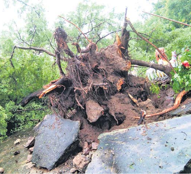
ପାଟରଞ୍ଜାପ୍ରସାଦ ଗ୍ରାମରେ ଗଛ ଭାଙ୍ଗି ପଡ଼ିଛି।

ପୂର୍ବ କେନ୍ଦ୍ରୀୟ ବଙ୍ଗୋପସାଗର ଓ ଏହାର ଆଖିପାଖରେ ସୃଷ୍ଟି ହୋଇଥିବା ଲଗୁତାପ ବାଟ୍ୟା 'ଡାଏ'ର ସାମାନ୍ୟ ପ୍ରଭାବ ନୟାଗଡ଼ ଜିଲ୍ଲାରେ ଦେଖିବାକୁ ମିଳିଥିଲା। ଜିଲ୍ଲାରେ ଗୁରୁତାର ରାତିରେ ଏହାର ପ୍ରଭାବରେ ବର୍ଷା ଓ ପବନ ବହିଥିଲା। ତେବେ ବିଶେଷ କିଛି କ୍ଷୟକ୍ଷତି ହୋଇ ନ ଥିବା ସୂଚନା ମିଳିଛି। ଜିଲ୍ଲାରେ ଗୁରୁତାର ସକାଳ ୮ଟାରୁ ଶୁକ୍ରବାର ସକାଳ ୮ଟା ପର୍ଯ୍ୟନ୍ତ ୪୯୬ ମିଲିମିଟର ବର୍ଷା ହୋଇଥିଲା। ଭାପୁର ବୁକ୍ରେ ୫୫.୨ ମିମି, ଦଶପଲ୍ଲୀରେ ୮୨.୬, ଗଣିଆରେ ୮୯, ଖଣ୍ଡପଡ଼ାରେ ୭୦.୫, ନୟାଗଡ଼ରେ ୩୧, ନୂଆଗାଁରେ ୫୮.୨ ମିମି, ଓଡ଼ଗାଁରେ ୩୯.୯ ଓ ଗଣପୁର ବୁକ୍ରେ ୬୯.୬ ମିମି ବର୍ଷା ରେକର୍ଡ଼ କରାଯାଇଛି। ଅନ୍ୟପକ୍ଷେ ବର୍ଷା ଯୋଗୁ ଗୁରୁତାର ରାତି ୧୧ଟାରୁ ଶୁକ୍ରବାର ସକାଳ ୮ଟା ପର୍ଯ୍ୟନ୍ତ ବିଦ୍ୟୁତ୍ ସରବରାଜ ବନ୍ଦ ରହିଥିଲା। ପବନରେ ନୟାଗଡ଼ ବୁକ୍ ବାଞ୍ଛିଆପଡ଼ା ପଞ୍ଚାୟତ ପାଟରଞ୍ଜା ପ୍ରସାଦ ଠାକୁରାଣୀଙ୍କ ନିକଟରେ ଥିବା କଇଁଆ ବନ୍ଧ ଭାଙ୍ଗିପଡ଼ିଥିଲା। ଗଛ ଚାରିପଟେ ଘର ଥିଲା ବେଳେ କୌଣସି କ୍ଷୟକ୍ଷତି ହୋଇନାହିଁ। ବାଟ୍ୟାର ପରିସ୍ଥିତିକୁ ଦେଖି ଶୁକ୍ରବାର ଜିଲ୍ଲାର ସମସ୍ତ କାର୍ଯ୍ୟାଳୟ