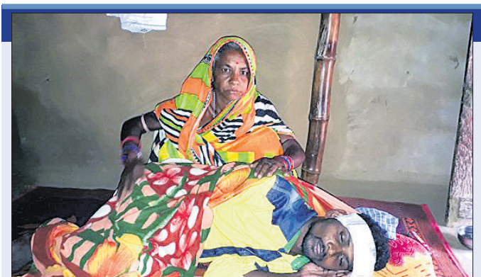
ମ୍ୟାଲେରିଆରେ ପୀଡ଼ିତ ଜଣାଯାଇଛନ୍ତି।