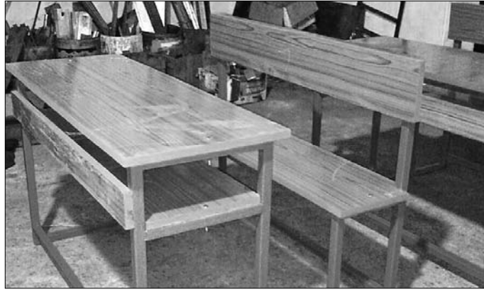
ସରକାରୀ ସ୍କୁଲକୁ ଆସିଥିବା ଚୌକି ଚେରୁଳୁ।