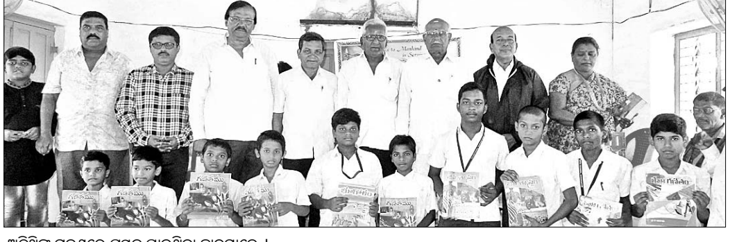
ଅତିଥିକ ଗହଣରେ ପୁସ୍ତକ ପାଇଥିବା ଛାତ୍ରମାନେ।