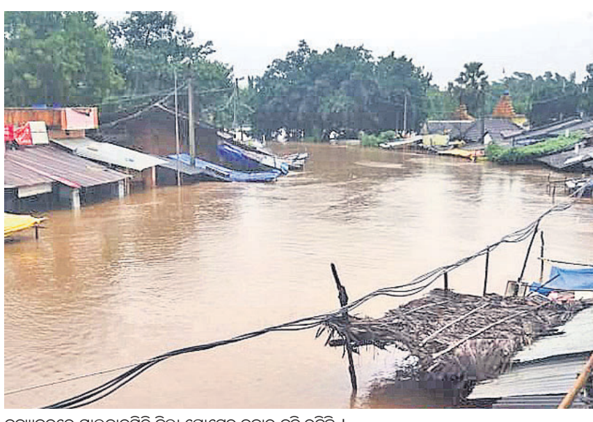
ବନ୍ୟାକଳରେ ମାଲକାନଗିରି ଜିଲ୍ଲା ପୋଡେରୁ ବନ୍ୟା ବୁଡି ରହିଛି।

ଭୁବନେଶ୍ୱର, ୨୧।୯ (ବୁଧବେ): ପୂର୍ବ କେନ୍ଦ୍ରୀୟ ଜଙ୍ଗଲପ୍ରଦାନ ଓ ଏହାର ଆଖପାଖ ଅଞ୍ଚଳରେ ସୃଷ୍ଟି ହୋଇଥିବା ବାତ୍ୟା 'ଡାଏ' ଦୁର୍ବଳ ହେବାରେ ଲାଗିଛି। ଗୁରୁବାର ମଧ୍ୟରାତ୍ରିରେ ସ୍ଥଳ ଭାଗ ଅତିକ୍ରମ କରିବା ପରେ ଏହା ଶୁକ୍ରବାର ଆଖ୍ୟନ୍ତରାଣ ଓଡ଼ିଶା ଓ ଛତିଶଗଡ଼ ଉପରେ ରହିଥିଲା। ଆଞ୍ଚଳିକ ପାଣିପାଗ କାର୍ଯ୍ୟାଳୟ ସ୍ୱତନ୍ତ୍ର ମିଳିତ୍ୱା ସୂଚନା ଅନୁଯାୟୀ ଡାଏ ଅବପାତରେ ପରିଣତ ହୋଇ ବିଦର୍ଭ ନିକଟରେ କେନ୍ଦ୍ରୀୟ