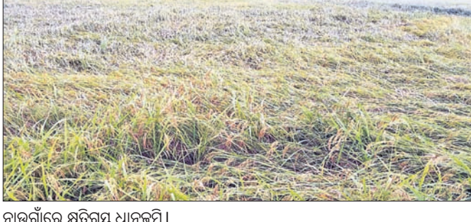
ନାଉଗାଁରେ କ୍ଷତିଗ୍ରସ୍ତ ଧାନଜମି।

୨ ଦିନ ହେବ ଲଘୁତାପ ଜନିତ ବର୍ଷା ଓ ପବନ ଲାଗି ରହିଛି। ଏହାର ପ୍ରଭାବରେ ନାଉଗାଁ ବ୍ଲକର ଦେବା ନଦୀ କୂଳବର୍ତ୍ତୀ ଅଞ୍ଚଳରେ ହୋଇଥିବା ଲଘୁ ଜାତୀୟ ପଞ୍ଚାୟତର ତ୍ରିଲୋଚନପୁର ଗ୍ରାମର ବହୁ ଅଂଶ ଜଳମଗ୍ନ ହୋଇଛି। ଆଉଓସିଏଲ ବାଲପାସ ରାସ୍ତାରେ ପାଣି ଜମିଥିବାରୁ ଯାତାୟତ ବାଧାପ୍ରାପ୍ତ ହୋଇଛି।