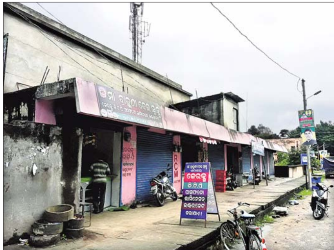
ମାର୍କେଟ କମ୍ପ୍ଲେକ୍ସରେ ସ୍କାକ୍ ବିକ୍ରି କରାଯାଉଛି।

ନୟାଗଡ଼ ବୁକ୍ ମାର୍କେଟ କମ୍ପ୍ଲେକ୍ସ ସ୍ୱୟଂସହାୟକ ଗୋଷ୍ଠୀ (ଏସ୍ଏଚ୍ଡି)ଙ୍କ ପାଇଁ ଥିଲା ବେଳେ ଏହି ଦୋକାନଗୁଡ଼ିକୁ ବ୍ୟବସାୟୀମାନେ ହାତେଇଛନ୍ତି। ଯେଉଁ ମାର୍କେଟ କମ୍ପ୍ଲେକ୍ସରେ ଏସ୍ଏଚ୍ଡି ମହିଳାମାନଙ୍କ ହାତ ତିଆରି ଜିନିଷ ବିକ୍ରି ହେବା କଥା ସେଠାରେ ବିକ୍ରି ହେଉଛି ସ୍କାକ୍, ଡେଇ, ଥଣ୍ଡା ଆଦି ମୃଦୁପାନୀୟ। ଖାଲି ସେତିକି ନୁହେଁ ସେଠାରେ କେନ୍ଦ୍ର ସେକ୍ସର ଖୋଲାଯିବା ସହ ତିନି ଓ ଏକ ଚେନ୍ଦ୍ର କମ୍ପାନୀ (ଆରସିଏଫ୍)ର ଜିନିଷ ମଧ୍ୟ ବିକ୍ରି ହେଉଛି। ଫଳରେ ଯେଉଁ ଉଦ୍ଦେଶ୍ୟ ନେଇ ଏହି ମାର୍କେଟ କମ୍ପ୍ଲେକ୍ସ ତିଆରି ହୋଇଥିଲା ତାହା ଫେଲ୍ ମାରିଥିବା ଆଲୋଚନା ହେଉଛି।