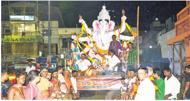
ଶ୍ରୀଗଣେଶଙ୍କୁ ବିସର୍ଜନ ପାଇଁ ନିଆଯାଉଛି । ପୁରୀ ଅଫିସ, ୨୧।୯

ବଡ଼ବାଣସ୍ଥିତ ଅଶୋକ ବଜାର ଗାଣପତ୍ୟ ସମିତିର ଭସାଣି ଉତ୍ସବ ଶୁକ୍ରବାର ଅନୁଷ୍ଠିତ ହୋଇଯାଇଛି । ସକାଳ ୯ଟାରେ ପୂଜାମଣ୍ଡପରେ ବିସର୍ଜନ ହୋଇ ସମ୍ପନ୍ନ ହୋଇଥିଲା । ଅଶୋକ ବଜାରର ସମସ୍ତ ବ୍ୟବସାୟୀ ଅପରାହ୍ଣରେ ପୂର୍ଣ୍ଣହୃଦରେ ଯୋଗ ଦେଇଥିଲେ । ସନ୍ଧ୍ୟା ୬ଟାରେ ଏକ ସୁସଜ୍ଜିତ ରଥରେ ଗଣେଶଙ୍କୁ ବିଜେ କରାଇ ବାଦ୍ୟବାଜଣା ସହ ବିସର୍ଜନ ଶୋଭାଯାତ୍ରାରେ ବାହାରିଥିଲେ । ପ୍ରଥମେ ଶ୍ରୀମନ୍ଦିର ନିକଟରେ ପହଞ୍ଚି ସେଠାରୁ ବାଜା ରୋଶିଣିରେ ମରିଚିକୋଟ ଛକ, ମାକେଟ ଛକ ବେଳ ଦେବାଦୀପରେ ମୂର୍ତ୍ତି ବିସର୍ଜନ କରିଥିଲେ । ଏଥିସହିତ ଅଶୋକ ବଜାର ଗାଣପତ୍ୟ ସମିତି ପକ୍ଷରୁ ଗତ ୯ଦିନ ଧରି ଚାଲିଥିବା ଗଣେଶ ପୂଜାର ସମାପ୍ତ ହୋଇଛି । ଚଳିତବର୍ଷ ସମିତି ପକ୍ଷରୁ ବାହୁବଳି ଡୋରଣ ପ୍ରସ୍ତୁତ ହୋଇଥିଲା । ଏହାସହିତ ପୂଜାମଣ୍ଡପରେ ପୁଷ୍ପରାସର ବଧ ଅନୁଷ୍ଠିତ ହୋଇଯାଇଛି । ସକାଳ ୯ଟାରେ ପୂଜାମଣ୍ଡପରେ ବିସର୍ଜନ ହୋଇ ସମ୍ପନ୍ନ ହୋଇଥିଲା । ଅଶୋକ ବଜାରର ସମସ୍ତ ବ୍ୟବସାୟୀ ଅପରାହ୍ଣରେ ପୂର୍ଣ୍ଣହୃଦରେ ଯୋଗ ଦେଇଥିଲେ । ସନ୍ଧ୍ୟା ୬ଟାରେ ଏକ ସୁସଜ୍ଜିତ ରଥରେ ଗଣେଶଙ୍କୁ ବିଜେ କରାଇ ବାଦ୍ୟବାଜଣା ସହ ବିସର୍ଜନ ଶୋଭାଯାତ୍ରାରେ ବାହାରିଥିଲେ । ପ୍ରଥମେ ଶ୍ରୀମନ୍ଦିର ନିକଟରେ ପହଞ୍ଚି ସେଠାରୁ ବାଜା ରୋଶିଣିରେ ମରିଚିକୋଟ ଛକ, ମାକେଟ ଛକ ବେଳ ଦେବାଦୀପରେ ମୂର୍ତ୍ତି ବିସର୍ଜନ କରିଥିଲେ । ଏଥିସହିତ ଅଶୋକ ବଜାର ଗାଣପତ୍ୟ ସମିତି ପକ୍ଷରୁ ଗତ ୯ଦିନ ଧରି ଚାଲିଥିବା ଗଣେଶ ପୂଜାର ସମାପ୍ତ ହୋଇଛି ।