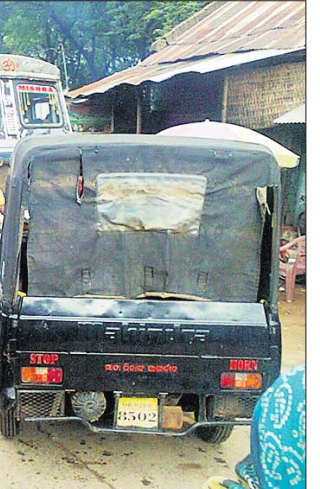
ଯାତ୍ରାପଦା ବଜାର ଛକରେ ଗ୍ରାମିକ ସମସ୍ୟା ।

ଜଗନ୍ନାଥ ସଂସ୍କୃତିର ଆଦିପାଠ କଣ୍ଟିଲୋ ନୀଳମାଧବ ଜାଉଳ ଏବଂ କଂସା ପିତଳ ବାସନ ଶିଳ୍ପ ପାଇଁ ରାଜ୍ୟ ତଥା ରାଜ୍ୟ ବାହାରେ ପ୍ରସିଦ୍ଧି ଲାଭ କରିଥିଲା । ଏହି ଶିଳ୍ପର ଶତାଧିକ କାରିଗର ସୁନିଆ ଦିନ କଂସାପିତଳର ନୃତ୍ୟ ଧରଣର ସାମଗ୍ରୀ ପ୍ରସ୍ତୁତ କରି ମହାଜନ ବା ସାହୁକାର ଓ ଶିଳ୍ପ