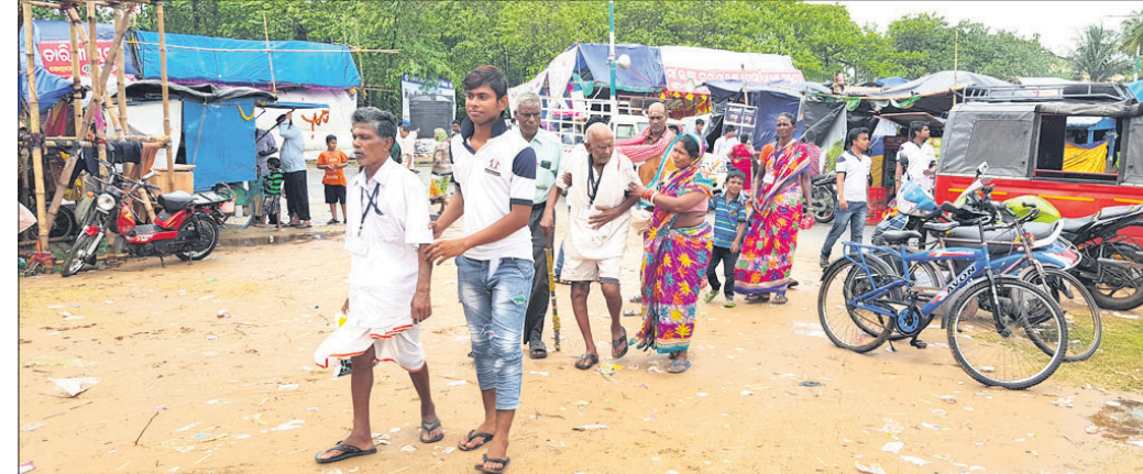
ଆହ୍ୱାନ କମ୍ପାଇନ୍ସର ସଦସ୍ୟମାନେ ବୃଦ୍ଧାବୃଦ୍ଧଙ୍କୁ ପାରାଦୀପର ବିଶ୍ୱକର୍ମା ପୂଜା ବୁଲି ଦେଖାଇଛନ୍ତି।

ପାରାଦୀପ ମଧୁବନ ଅଞ୍ଚଳରେ ସ୍ୱେଚ୍ଛାସେବୀ ଅନୁଷ୍ଠାନ ଆହ୍ୱାନ କମ୍ପାଇନ୍ସର ସଦସ୍ୟମାନେ ଶୁକ୍ରବାର ବାଲିଝରା ବୃଦ୍ଧାଗ୍ରମରେ ଥିବା ଅନ୍ଧୋବାସୀଙ୍କୁ ବିଶ୍ୱକର୍ମା ପୂଜା ବୁଲାଇ ଦେଖାଇଛନ୍ତି। ବୃଦ୍ଧାବୃଦ୍ଧମାନେ ପ୍ରତ୍ୟେକ ତୋରଣ ବୁଲି ଦେଖିବା ସହ ପ୍ରସାଦ ସେବନ କରିଥିଲେ। ଯୁବବର୍ଗଙ୍କ ଏହି କାର୍ଯ୍ୟ ପାଇଁ ସେମାନଙ୍କୁ ବୃଦ୍ଧାବୃଦ୍ଧମାନେ ଆଶୀର୍ବାଦ କରିଥିଲେ। ଏହି ଅବସରରେ ବୃଦ୍ଧାବୃଦ୍ଧଙ୍କୁ ଔଷଧ ଓ ବସ୍ତ୍ର ପ୍ରଦାନ କରାଯାଇଥିଲା।