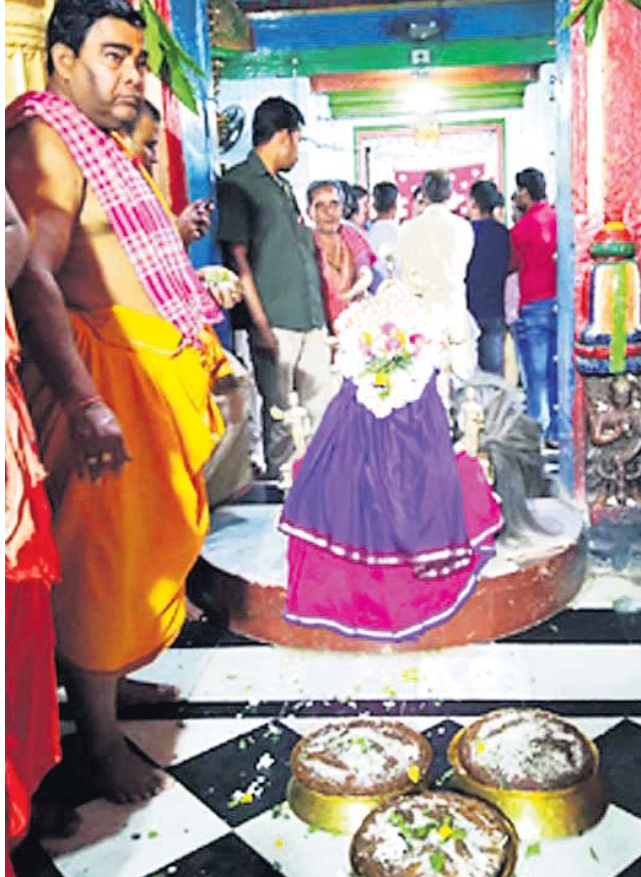
ଶ୍ରୀଜୀଉଙ୍କୁ ସୁନାଥାଳିରେ କାକରା ଭୋଗ ଲାଗି କରାଯାଇଛି।

ନୟାଗଡ଼ ଜିଲ୍ଲା ଓଡ଼ଗାଁରେ ବିଜେ ଶ୍ରୀରଘୁନାଥଜୀଉଙ୍କ ପାଠରେ ସୁନାଥାଳିରେ ଶ୍ରୀଜୀଉଙ୍କୁ ସ୍ୱପ୍ନ କାକରା ପିଠା ଲାଗି ହୋଇଛି। ଭାଦ୍ରବ ମାସ ଶୁକ୍ଳପକ୍ଷ ଦ୍ୱାଦଶୀ ତିଥିରେ ସୁନାଥାଳି ଓ ବାମନ ଜନ୍ମ ମହୋତ୍ସବ ଶୁକ୍ରବାର ମଧ୍ୟାହ୍ନରେ ପାଳିତ ହୋଇଛି। ଏହି ଦିନରେ ଗଜପତି ମହାରାଜାଙ୍କ ନାମରେ ନୂତନ ଅଙ୍କ ପ୍ରଦର୍ଶନ କରାଯାଇ ୧୪୨୬ ସାଲର ଅଭିମାନ ହୋଇଛି। ଏହି ନୂତନ ଓଡ଼ିଆ ବର୍ଷ ଚାଳନାକୁ ସୁନାଥାଳି କୁହାଯାଇଥାଏ। ଏହି ଦିନ ବାମନ ଜନ୍ମ ଅବସରରେ ପରମ୍ପରା ଅନୁସାରେ ଶ୍ରୀଜୀଉମାନେ ନୂତନ ପାଟ ବସ୍ତ୍ର, ବନାରସା ପୋଷାକ, ସୁବର୍ଣ୍ଣ ପୁଚ୍ଚର ସହିତ ନାନାଦି ଅଳଙ୍କାରରେ ଭୂଷିତ ହୋଇ ଅଗଣିତ ଶ୍ରଦ୍ଧାଳୁଙ୍କୁ ଦର୍ଶନ ଦେଇଥିଲେ। ସକାଳ ଧୂପ ଅଢ଼େ ପୁନିଆଁ ପାଳନ ନିମିତ୍ତ ଶ୍ରୀଜୀଉଙ୍କ ବିଜେ ପ୍ରତିମା ଆଜ୍ଞା ମାଳ ପାଇ ସୁବର୍ଣ୍ଣ ଖଲିରେ ବିଜେ କରି ଉଡ଼ି ସିଂହାସନରେ ଆଳିତ ପ୍ରଦାନ ପୂର୍ବକ ଦ୍ୱାରପାଳ ଦ୍ୱାର ନିକଟରେ ସୁବର୍ଣ୍ଣ ସିଂହାସନ ଉପରେ ଉପବେଶନ କରିଥିଲେ। ସେବାୟତଙ୍କ ଗହଣରେ ଶ୍ରୀଜୀଉଙ୍କୁ ଶୋଭା ଉପଚାର ବିଧିରେ ସ୍ୱତନ୍ତ୍ର ଭାବେ ପ୍ରସ୍ତୁତ ୩ ବାଡ଼ କାକରା ରାଜ ଭୋଗ (ପିଠା) ୩ଟି ସୁବର୍ଣ୍ଣ ଆଳିରେ ନୈବେଦ୍ୟ ଅର୍ପଣ କରାଯାଇଥିଲା। ବର୍ଷକରେ ଥରେ ବାମନ ଦ୍ୱାଦଶୀ ତିଥିରେ ଶ୍ରୀଜୀଉଙ୍କୁ ସୁବର୍ଣ୍ଣ ଆଳିରେ ଏହି ବିଶେଷ ଗହଣରେ ପ୍ରତିମା ଦିନରୁ ପ୍ରକଟିତ ଥିବା ମନ୍ଦିର ଇତିହାସକୁ ଜଣାଯାଏ। ଏହା ସହିତ ଶ୍ରୀଜୀଉଙ୍କ ସେବାରେ ଥିବା ଛତିଶଶା