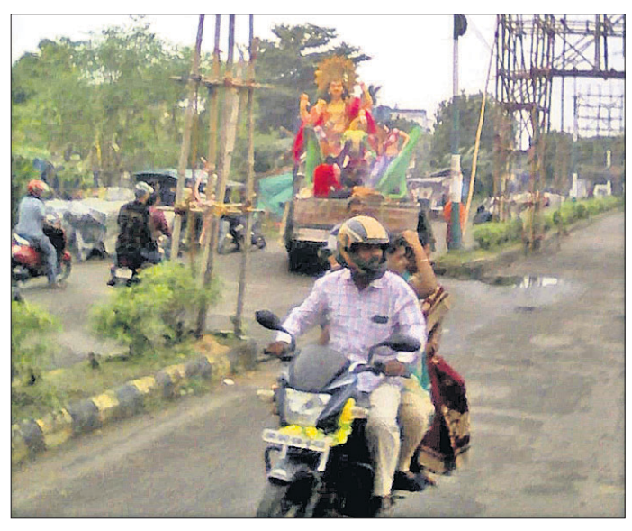
ପାରାଦୀପରେ ଭସାଣି ଶୋଭାଯାତ୍ରାରେ ଯାଉଥିବା ଏକ ମେଡ଼।

ଜଗନ୍ନାଥ ଗ୍ରନ୍ଥ ମାଲିକ ସଂଘ, ଜିଲ୍ଲା ଗ୍ରନ୍ଥ ମାଲିକ ସଂଘ, ଡ଼ିଏମ୍ ମାଲିକ ସଂଘ ସମେତ ୧୦ରୁ ଊର୍ଦ୍ଧ୍ୱ ସଂଘ ରବିବାର ଭସାଣି ଉତ୍ସବ କରିବେ। ଶୁକ୍ରବାର ଯଦିଓ ସେକଲ ଲଗାଣ ବର୍ଷା ହୋଇନାହିଁ, ତେବେ ପବନର ବେଗ ପୂର୍ବ ଭଳି ଅଧିକ ରହିଛି। ଏହା ସତ୍ତ୍ୱେ ପୂଜା ସମ୍ପନ୍ନ ହୋଇନାହିଁ।