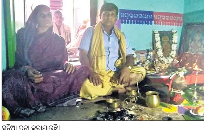
ସୁନିଆ ପୂଜା କରାଯାଉଛି ।

ଶୁକ୍ରବାର ବାମନ ଜନ୍ମ ଦିବସକୁ କଣ୍ଟିଲୋ ନୀଳମାଧବ ଜାଉଳ ପାଠରେ ପାରମ୍ପରିକ ରୀତିରେ ପାଳନ କରାଯାଇଛି । ଉତ୍କଳୀୟ ସଂସ୍କୃତି ଓ ସାମାଜିକ ଚଳଣିରେ ଏହି ପର୍ବକୁ ସୁନିଆ ବା ଅଙ୍କ ପର୍ବ ବୋଲି କୁହାଯାଇଥାଏ । 'ଅଙ୍କ' ପର୍ବ ପ୍ରଚଳିତ ପ୍ରାଚୀନ ପରମ୍ପରା ଓ ଐତିହ୍ୟ ଦୃଷ୍ଟିରୁ ବେଶ୍ ଗୁରୁତ୍ୱ ବହନ କରିଆସିଛି । ଓଡ଼ିଶାରେ ଓଡ଼ିଆ ପାଞ୍ଜି ଆରମ୍ଭ ହୁଏ ବିଷୁବ ସଂକ୍ରାନ୍ତି ବା ପଣା ସଂକ୍ରାନ୍ତିଠାରୁ । ଏହି ଦିନଟି ଓଡ଼ିଆଙ୍କ ନବବର୍ଷ ଭାବରେ ସାଧାରଣରେ ଗୃହୀତ ହୋଇଛି । ମାତ୍ର ଓଡ଼ିଶାରେ ରାଜକୀୟ ନବବର୍ଷ ଆରମ୍ଭ ହୁଏ କାନ୍ତବ ଶୁକ୍ଳପକ୍ଷ ଦ୍ୱାଦଶୀ ଦିଅଁ ଅର୍ଥାତ୍ ବାମନ ଜନ୍ମ ଦିବସ ବା ସୁନିଆ ଦିନରେ । ସୂଚନାଯୋଗ୍ୟ ଯେ, ସୁନିଆ ହେଉଛି ଓଡ଼ିଆ ରାଜାଙ୍କର ରାଜତ୍ୱ ଅଙ୍କ ଗଣନା ବର୍ଷର ପ୍ରଥମ ଦିନ । ରାଜାରାଜୁଡ଼ା ଅମଳରେ ଏହି ଦିନଠାରୁ ରାଜ୍ୟ ଆଦାୟ ଆରମ୍ଭ ହୋଇଥାଏ ଏବଂ ଅଙ୍କବର୍ଷ ଅନୁସାରେ ଗଣନା କରାଯାଏ । ଏହି ଦୃଷ୍ଟିରୁ ସୁନିଆ ହେଉଛି ରାଜା, ପ୍ରଜା ଉଭୟଙ୍କର ବର୍ଷ ଆରମ୍ଭର ଦିବସ । ଧାନ ଅମଳ ପରେ ପ୍ରଜାଙ୍କଠାରୁ ରାଜ୍ୟ ଆଦାୟ ସୁନିଆ ପାଇଁ ରାଜା ବା ଜମିଦାରମାନେ ଏହି ଅଙ୍କ ବର୍ଷର ଆରମ୍ଭ ଆଜିର ଦିନଠାରୁ କରିଥିଲେ । ଏହି ଦିନ ପ୍ରଜାମାନେ ରାଜାମାନଙ୍କୁ ବିଭିନ୍ନ ଭେଡ଼ି ବା ଉପହାର ପ୍ରଦାନ କରୁଥିଲେ । ବାମନ ଜନ୍ମଦିନ ଗୋଟିଏ ସୁନା ମୋହର