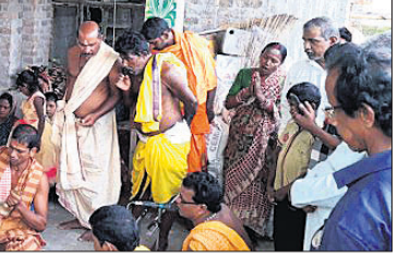
ରତ୍ନମୁଦ ସ୍ଥାପନ ନିମନ୍ତେ ଯଜ୍ଞ କରାଯାଉଛି।

ବାଲି, ଅଧିକ ନାୟକ ଓ ହାତିବନ୍ଧୁ ସାହୁଙ୍କ ପରିଚାଳନାରେ ସମସ୍ତ କାର୍ଯ୍ୟ ସମ୍ପନ୍ନ ହୋଇଥିଲା। ପ୍ରାରମ୍ଭରେ ପୂର୍ବରୁ ପୂଜା, କଳସ ସ୍ଥାପନ, ଆହ୍ୱାନ ପୂଜା ଓ ଲକ୍ଷ୍ମୀପୂଜା ପରେ ବନକାଗ କାର୍ଯ୍ୟକ୍ରମ ସମ୍ପନ୍ନ ହୋଇଛି।