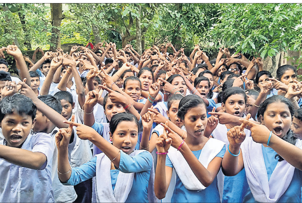
ପ୍ଲାଷ୍ଟିକ ପୁସ୍ତକ ଓଡ଼ିଶା ଅଭିଯାନରେ ସାମିଲ ହୋଇଥିବା ଛାତ୍ରଛାତ୍ରୀ।

ବର୍ଷା ପବନ ଯୋଗୁ ଫୁଟୁପାଠି ବ୍ୟବସାୟୀମାନେ ହାନିଗ୍ରା ହୋଇଛନ୍ତି। ସେମାନଙ୍କ ଅସୁବିଧା ପ୍ରସଙ୍ଗରେ ବ୍ୟବସାୟୀମାନେ ପ୍ରତିବାଦ କରିବାକୁ ହେଲେ ସମ୍ପଦ ବିଭାଗ ଦେଖାଇବାକୁ ପଡ଼ିଛି।