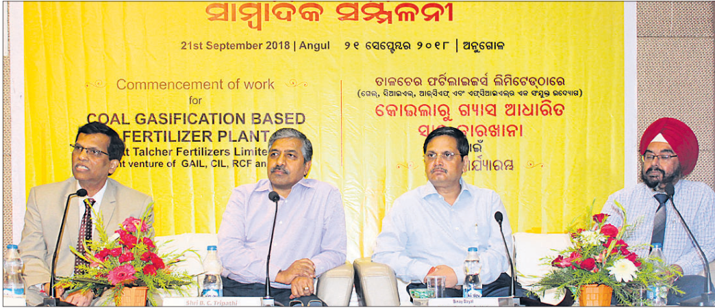
ତାଳଚେର ଫର୍ଟିଲାଇଜର୍ ପକ୍ଷରୁ ଅନୁଗୋଳଠାରେ ଆୟୋଜିତ ଖବରଦାତା ସମ୍ମିଳନୀ।