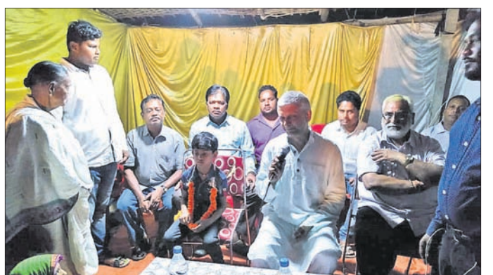
ଆୟୋଜିତ ସଭାରେ ଏମ୍ପି ତଥାଗତ ସତପଥୀ ମହିଳାମାନଙ୍କ ସହ ଆଲୋଚନା କରୁଛନ୍ତି।

ଆୟୋଜିତ ସଭାରେ ଏମ୍ପି ତଥାଗତ ସତପଥୀ ସେମାନଙ୍କ ଅଭିଯୋଗ ତଥା ସମସ୍ୟା ଶୁଣିଥିଲେ। ଦୀର୍ଘ ଦିନ ହେଲା ଆନ୍ଦୋଳନ ସତ୍ତ୍ଵେ ବାଦି ପୁରଣ ନ ହେବା, ଗତ ୧୭ ତାରିଖରେ ପୋଲିସ୍ ୫ ମହିଳା ଓ ୨ ଜଣ ଯୁବକଙ୍କୁ ଜବରଦସ୍ତି ଉଠାଇନେବା, ସେମାନଙ୍କ ଚେଷ୍ଟା ଭାଙ୍ଗିଦେବା ଆଦି ନେଇ ଆନ୍ଦୋଳନକାରୀ ମହିଳା ଏ ନେଇ ଶୁକ୍ରବାର ମହିଳାଗୋଷ୍ଠୀଙ୍କ ପକ୍ଷରୁ ଆୟୋଜିତ ଏକ ସଭାରେ