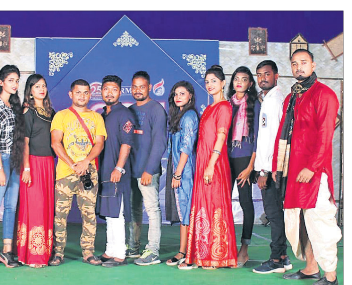
କାର୍ଯ୍ୟକ୍ରମରେ ଅଂଶଗ୍ରହଣ କରିଥିବା ଯୁବତୀଯୁବକମାନେ।

ଅନୁଗୋଳ ଅଫିସ, ୨୧।୯ ନାଲକୋଠାରେ ଚାଲିଥିବା ସରସ ମେଳାରେ ଶୁକ୍ରବାର ଅନୁଗୋଳର ଯୁବତୀ ଯୁବକଙ୍କୁ ନେଇ ଏକ ଫ୍ୟାଶନ ଶୋ ଆୟୋଜନ କରାଯାଇଥିଲା। ଭଲିକ ଭଲି ନୂତନ ଡିଜାଇନର ପୋଷାକ ପରିଧାନ କରି ଯୁବତୀ ଯୁବକମାନେ ରାସ୍ତାରେ ଚାଲିଥିଲେ। ଏହି ଶୋରେ ସିଲ୍‌ଲ ଓ ମିଳ୍ କ୍ୟାଟ ଓକ୍ ଦେଖିବାକୁ ମିଳିଥିଲା। ଏହି କାର୍ଯ୍ୟକ୍ରମକୁ ସରସମେଳା ଆୟୋଜନ କରିଥିବାବେଳେ ଷ୍ଟେଡିଂ ପ୍ରଦୁର୍ଗର ପରିଚାଳନା କରିଥିଲା।