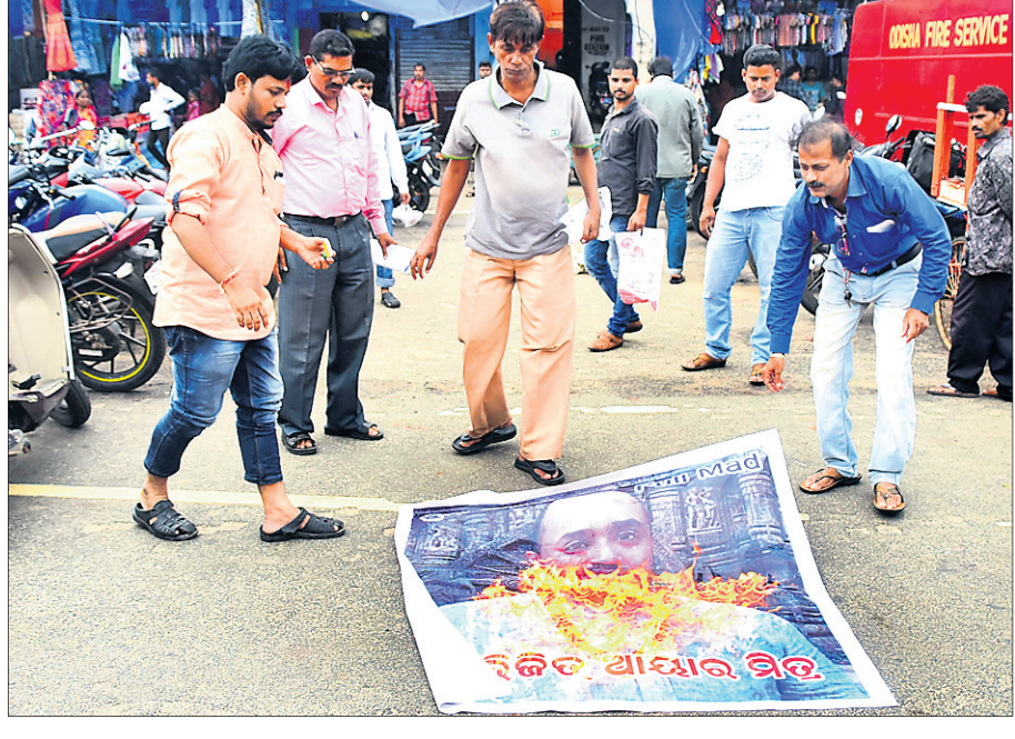
ଅଭିଭୂତ ଆନ୍ଦରଳ ଫଟୋ ଥିବା ଫ୍ଲେକ୍ସ ପୋଡ଼ାଯାଇଛି ।