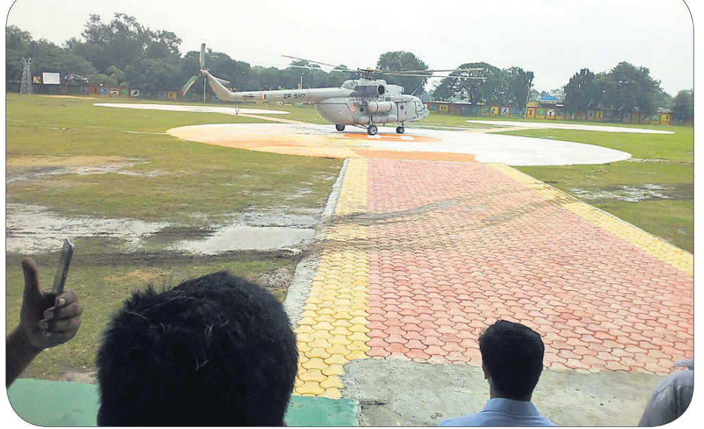
ତାଳଚେର ବ୍ଲକ୍ ତାଳମଣ୍ଡଳ ଷ୍ଟାଡିୟମ୍ରେ ହେଲିକପ୍ଟର ବାହୁସେନାର ହେଲିକପ୍ଟର ଅବତରଣ କରିଛି।