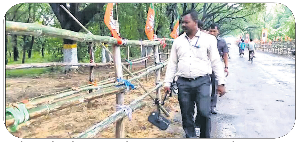
ବକ୍ସି ଜଗବନ୍ଧୁ ଷ୍ଟାଡିୟମ୍‌କୁ ଯିବା ରାସ୍ତାରେ ମେଟାଲ ଡିଟେକ୍ଟର ଦ୍ଵାରା ପୁରସ୍କା ବ୍ୟବସ୍ଥା ଯାଞ୍ଚ କରାଯାଇଛି।