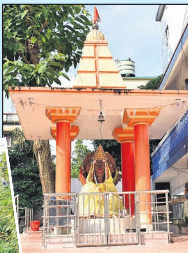
— ବିପୋର୍ଟ: କ୍ୟୋଡିରଞ୍ଜନ ମହାପାତ୍ର