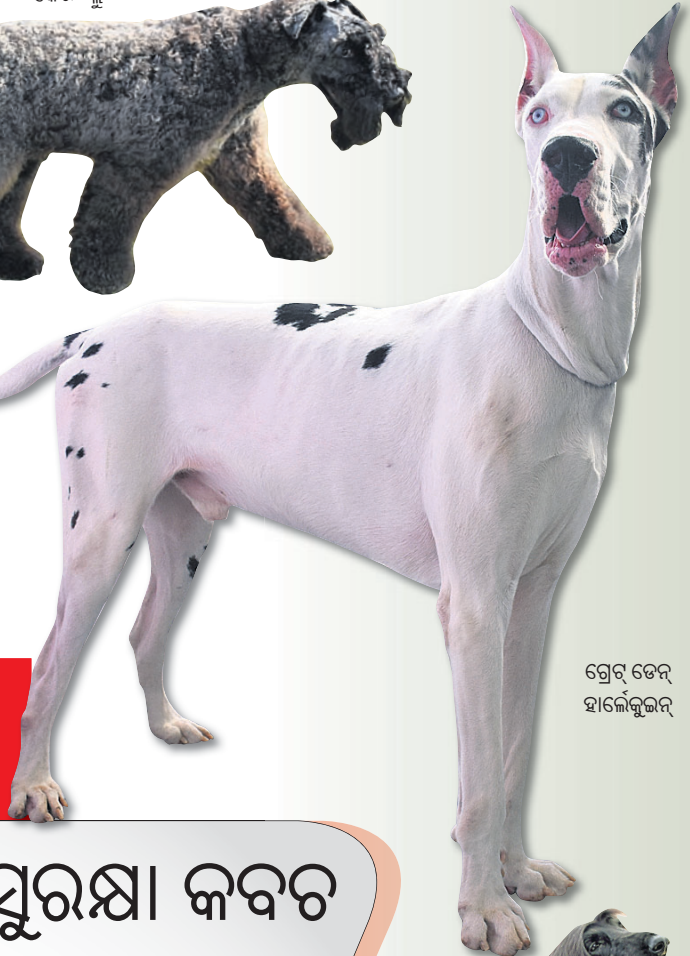
ଗ୍ରେଟ୍ ଡେନ୍ ହାଇକେକ୍ସଲର୍