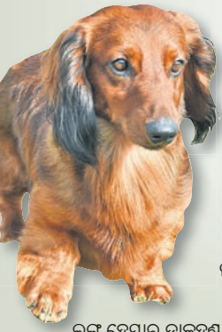
ଲଙ୍କ ହେୟାର ଡାକ୍ସହୁଣ୍ଡ