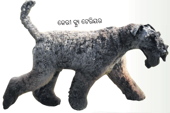
କେରା ବ୍ଲ୍ୟୁ ଟେରିୟର