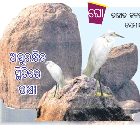
ଅସୁରକ୍ଷିତ ସ୍ଥିତିରେ ପକ୍ଷୀ

ପକ୍ଷୀ ସମ୍ଭାର : ଲକ୍ଷ୍ୟ ଥିଲା ଚିଲିକା। ହେଲେ ବାଟରେ ଘୋଡ଼ାହାଡ଼ ଜଳଭଣ୍ଡାର ଅନୁକୂଳ ପରିବେଶ ଓ ଖାଦ୍ୟସମ୍ଭାର ଦେଖି ଏଠାକୁ ଚାଲିଆସୁଛନ୍ତି ଅନେକ ବିଦେଶୀଗତ ପକ୍ଷୀ। ଗତ ବର୍ଷ ଶୀତଋତୁରେ ଘୋଡ଼ାହାଡ଼ ଜଳଭଣ୍ଡାରରେ ଅନେକ ବିରଳ ପ୍ରଜାତିର ପକ୍ଷୀଙ୍କ ସମାଗମ ହୋଇଥିଲା, ଯାହାକି ପ୍ରକୃତିପ୍ରେମୀଙ୍କୁ ଆକୃଷ୍ଟ କରିଥିଲା। ଏହି ଜଳଭଣ୍ଡାରର ପ୍ରାକୃତିକ ପରିବେଶରେ ଏବେ ଉଡି ବୁଲୁଛନ୍ତି ହଂସ ଓ ବଗଳାତୀୟ ବିଭିନ୍ନ ଦୁଆ କିସମର ପକ୍ଷୀ। ପରିବ୍ରାଜକ ପକ୍ଷୀମାନଙ୍କ ମଧ୍ୟରେ ରହିଛନ୍ତି ପାଣ୍ଡରା ପୁଆଳ, ବୁରୁମା, ବେଶାଡ଼ାହୁକ, ଜଟିଆ ଗେଣ୍ଡି ଓ ଛୋଟ ଏରା ଆଦି। ଏମାନେ ଚୁଷ୍ଟ, ସୁରୋପ ଭଳି ସୁବୁର ଅଞ୍ଚଳକୁ ଚିଲିକା ଅଭିମୁଖେ ଉଡି ଆସିଥାନ୍ତି ବୋଲି ଗବେଷକ ଅନୁଭବ କର କୌଣସି କହିଛନ୍ତି। ତେବେ ସାମୟିକ ଭ୍ରମଣ ଭଳି ଘୋଡ଼ାହାଡ଼ ଜଳଭଣ୍ଡାରରେ ଏମାନେ କିଛି ଦିନ ବିତାଉଛନ୍ତି। ବିଗତ କିଛି ବର୍ଷ ହେବ ଏହି ଦୃଶ୍ୟ ସ୍ଥାନୀୟ ବାସିନ୍ଦା ଓ ପକ୍ଷୀପ୍ରେମୀଙ୍କୁ ଆକୃଷ୍ଟ କରୁଛି। ଜଳଭଣ୍ଡାରର ଉପରମୁଣ୍ଡ ପୁରୁଣାପାଣି ଚରଭଙ୍ଗ ଗ୍ରାମ ନିକଟରେ ନଦୀର ସନ୍ତସନ୍ତୀ ଚୂଣ୍ଡାଭୂମିରେ ଏଭଳି ପକ୍ଷୀଙ୍କୁ ଠାବ କରାଯାଇଛି। ଏହା ସେମାନଙ୍କ ପାଇଁ ନିରାପଦ ଓ ଖାଦ୍ୟ ପ୍ରଚୁର ଅଞ୍ଚଳ ବୋଲି ବିବେଚନା କରାଯାଉଛି। ଚଳିତ ବର୍ଷ ମଧ୍ୟ ୨୯ ପ୍ରଜାତିର ୧ ହଜାର ୧୯ ପକ୍ଷୀ ରହିଥିବା ନେଇ ଗଣନା କରାଯାଇଥିଲା ।