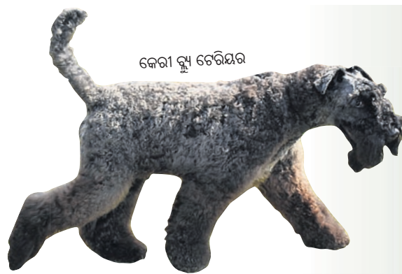
କେରୀ ବ୍ଲ୍ୟୁ ଚେରିୟର