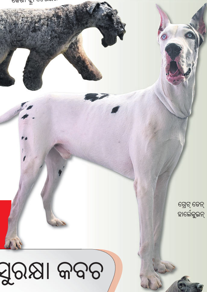
ଗ୍ରେଟ୍ ଡେନ୍ ହାଇକେକ୍ସଲର୍