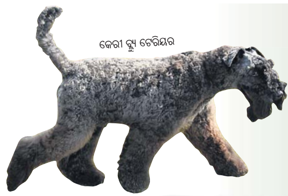
କେରୀ ବ୍ଲ୍ୟୁ ଚେରିୟର