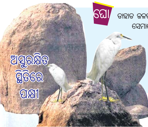
ଅସୁରକ୍ଷିତ ଭୂମିରେ ପକ୍ଷୀ

ପକ୍ଷୀ ସମ୍ଭାର : ଲକ୍ଷ୍ୟ ଥିଲା ଚିଲିକା। ହେଲେ ବାଟରେ ଘୋଡ଼ାହାଡ଼ ଜଳଭଣ୍ଡାର ଅନୁକୂଳ ପରିବେଶ ଓ ଖାଦ୍ୟସମ୍ଭାର ଦେଖି ଏଠାକୁ ଚାଲିଆସୁଛନ୍ତି ଅନେକ ବିଦେଶୀଗତ ପକ୍ଷୀ। ଗତ ବର୍ଷ ଶୀତଋତୁରେ ଘୋଡ଼ାହାଡ଼ ଜଳଭଣ୍ଡାରରେ ଅନେକ ବିରଳ ପ୍ରଜାତିର ପକ୍ଷୀଙ୍କ ସମାଗମ ହୋଇଥିଲା, ଯାହାକି ପ୍ରକୃତିପ୍ରେମୀଙ୍କୁ ଆକୃଷ୍ଟ କରିଥିଲା। ଏହି ଜଳଭଣ୍ଡାରର ପ୍ରାକୃତିକ ପରିବେଶରେ ଏବେ ଉଡି ବୁଲୁଛନ୍ତି ହଂସ ଓ ବଗଳାତୀୟ ବିଭିନ୍ନ ଦୁଆ କିସମର ପକ୍ଷୀ। ପରିବ୍ରାଜକ ପକ୍ଷୀମାନଙ୍କ ମଧ୍ୟରେ ରହିଛନ୍ତି ପାଣ୍ଡରା ପୁଆଳ, ବୁରୁମା, ବେଶାଡ଼ାହୁକ, ଜଟିଆ ଗେଣ୍ଡି ଓ ଛୋଟ ଏରା ଆଦି। ଏମାନେ ଚୁଷ୍ଟ, ସୁରୋପ ଭଳି ସୁବୁର ଅଞ୍ଚଳକୁ ଚିଲିକା ଅଭିମୁଖେ ଉଡି ଆସିଥାନ୍ତି ବୋଲି ଗବେଷକ ଅନୁଭବ କର କୌଣସି କହିଛନ୍ତି। ତେବେ ସାମୟିକ ଭ୍ରମଣ ଭଳି ଘୋଡ଼ାହାଡ଼ ଜଳଭଣ୍ଡାରରେ ଏମାନେ କିଛି ଦିନ ବିତାଉଛନ୍ତି। ବିଗତ କିଛି ବର୍ଷ ହେବ ଏହି ଦୃଶ୍ୟ ସ୍ଥାନୀୟ ବାସିନ୍ଦା ଓ ପକ୍ଷୀପ୍ରେମୀଙ୍କୁ ଆକୃଷ୍ଟ କରୁଛି। ଜଳଭଣ୍ଡାରର ଉପରମୁଣ୍ଡ ପୁରୁଣାପାଣି ଚରଭଙ୍ଗ ଗ୍ରାମ ନିକଟରେ ନଦୀର ସନ୍ତସନ୍ତୀୟା ଚୂଣ୍ଡାଭୂମିରେ ଏଭଳି ପକ୍ଷୀଙ୍କୁ ଠାବ କରାଯାଇଛି। ଏହା ସେମାନଙ୍କ ପାଇଁ ନିରାପଦ ଓ ଖାଦ୍ୟ ପ୍ରଚୁର ଅଞ୍ଚଳ ବୋଲି ବିବେଚନା କରାଯାଉଛି। ଚଳିତ ବର୍ଷ ମଧ୍ୟ ୨୯ ପ୍ରଜାତିର ୧ ହଜାର ୧୯ ପକ୍ଷୀ ରହିଥିବା ନେଇ ଗଣନା କରାଯାଇଥିଲା ।