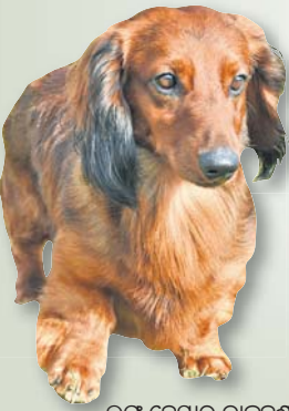
ଲଙ୍ଗ୍ ହେୟାର ଡାକ୍ସହୁଣ୍ଡ