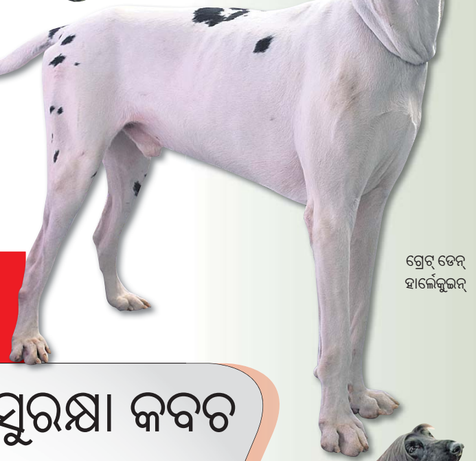
ଗ୍ରେଟ୍ ଡେନ୍ ହାଇକୋକ୍ସର