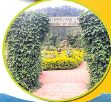
ପ୍ରସ୍ତୁତି: ଅରୁଣ ସାହୁ, ଦାରିଙ୍ଗବାଡ଼ି