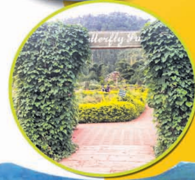
ପ୍ରସ୍ତୁତି: ଅରୁଣ ସାହୁ, ଦାରିଙ୍ଗବାଡ଼ି