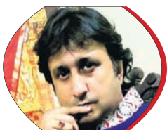
ରାତି ଅଧରେ ଶୁଟି ଗାଡ଼ି ଅନ୍ଧାରରେ ଓହ୍ଲାଇଦେଲା