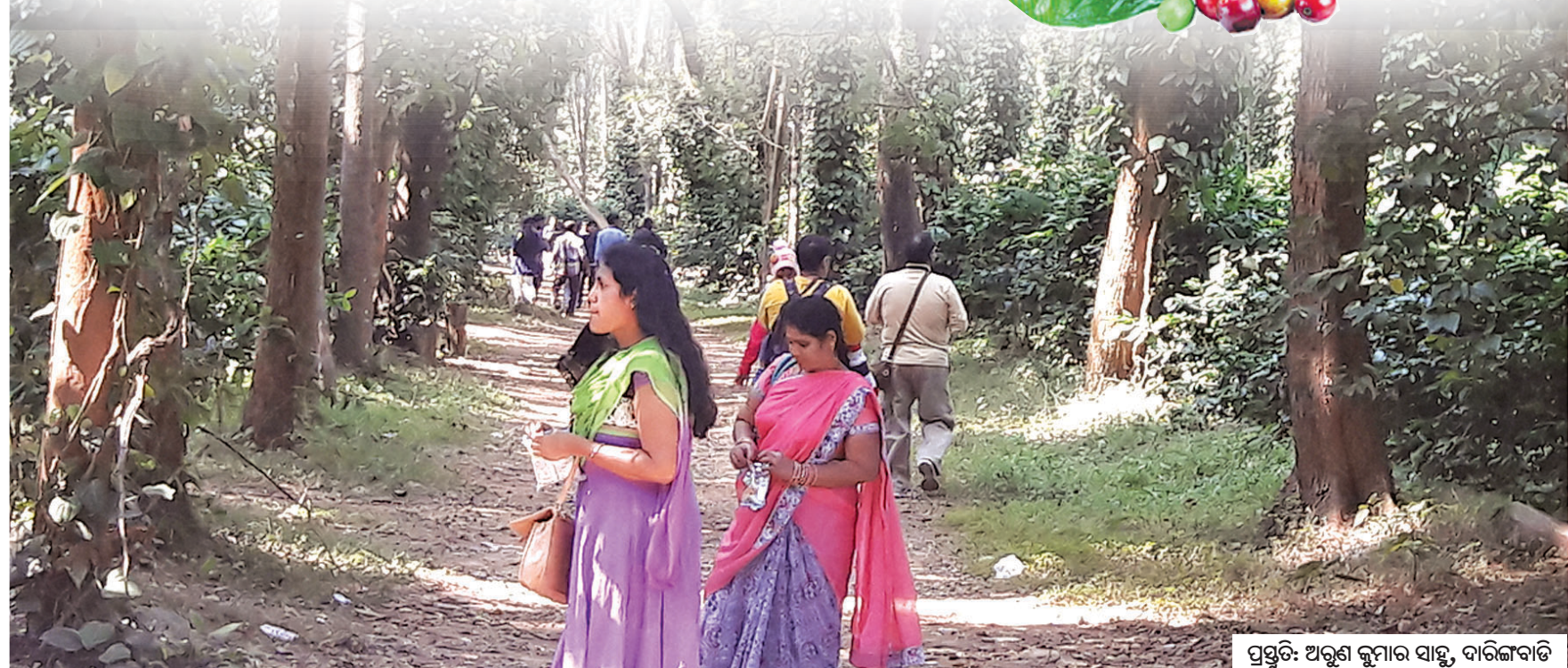
ପ୍ରସ୍ତୁତି: ଅରୁଣ କୁମାର ସାହୁ, ଦାରିଙ୍ଗବାଡ଼ି