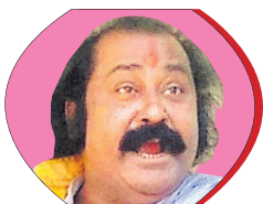
ବିଳମ୍ବ ପାଇ ବିଜୁବାବୁଙ୍କୁ ଜରିମାନା କରିଥିଲି