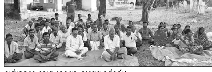
କାର୍ଯ୍ୟକ୍ରମରେ ଯୋଗ ଦେଇଥିବା କଂଗ୍ରେସ କର୍ମକର୍ତ୍ତା।