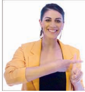
STEPHANIE RICE Swimmer - Olympic Medallist