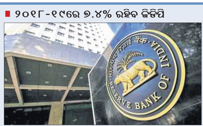
୨୦୧୮-୧୯ରେ ୭.୪% ରହିବ ଜିଡିପି

ଯାହା ଆଶାକରାଯାଇଥିଲା, ଠିକ୍ ତାହା ହିଁ ହେଲା। ଗଭୀର ଉଚ୍ଚିତ ପତେଲଙ୍କ ଅଧିକାରରେ ୧ ସପ୍ତାହକୁ ନେଇ ଗଠିତ ଭାରତୀୟ ରିଜର୍ଭ ବ୍ୟାଙ୍କ (ଆର୍ଭିଆଇ) ମୁଦ୍ରା କମିଟି ବର୍ତ୍ତମାନ ପାଇଁ ରେପୋ ରେଟକୁ ୭.୫%ରେ ଅପରିବର୍ତ୍ତନ ରଖିଛନ୍ତି।