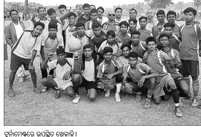
ଚୁନାମେଷ୍ଟରେ ଉପସ୍ଥିତ ଖେଳାଳି।