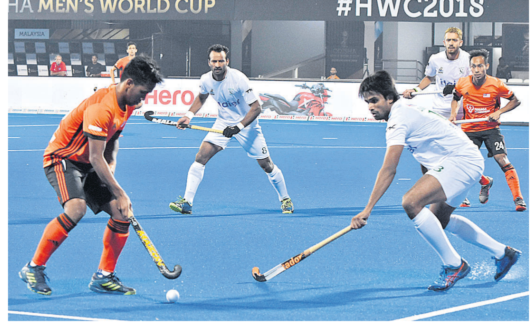
ମାଲେସିଆ-ପାକିସ୍ତାନ ମଧ୍ୟରେ ରୁଧିର ଅନୁଷ୍ଠିତ ମ୍ୟାଚ ।

ହକି ବିଶ୍ୱକପର କଳିଙ୍ଗ ଷ୍ଟାଡିୟମରେ ରୁଧିର ଅନୁଷ୍ଠିତ ମାଲେସିଆ-ପାକିସ୍ତାନ ପୁଲ୍ 'ଡି' ମ୍ୟାଚ ୧-୧ ଗୋଲରେ ଡ୍ର ରହିଛି । ଫଳରେ ଦୁଇ ଦଳ ପଏଣ୍ଟ ଭାଗ କରିଛନ୍ତି । ତେଣୁ ଏଥିରୁ ଗୋଟିଏ ଦଳ ପୁଲ୍ ପର୍ଯ୍ୟାୟକୁ ବିଦାୟ ନେବା ନିଶ୍ଚିତ ହୋଇଛି । ଅନ୍ୟପକ୍ଷରେ ଏହି ମ୍ୟାଚର ଫଳାଫଳ ନେଦରଲାଣ୍ଡକୁ ଫାଇଦାରେ ମଧ୍ୟ ରଖୁଛି । କାରଣ ପୁଲ୍ 'ଡି'ରେ ଜର୍ମାନୀ ୨ ମ୍ୟାଚରୁ ୬ ପଏଣ୍ଟ ସହିତ ଟେବୁଲର ଶୀର୍ଷରେ ରହିଥିବାବେଳେ ନେଦରଲାଣ୍ଡ ସମାନ ମ୍ୟାଚରୁ ୩ ପଏଣ୍ଟ ପାଇଥିବାକୁ ସିଧାସଳଖ କ୍ୱାର୍ଟର ଫାଇନାଲ ପ୍ରବେଶ ସମ୍ଭାବନା ଉଜ୍ଜୀବିତ କରିଛି । ଅନ୍ୟପକ୍ଷରେ ପାକିସ୍ତାନ ଓ ମାଲେସିଆ ୧ ପଏଣ୍ଟ ଲେଖାଏ ପାଇଥିବାବେଳେ ମାଲେସିଆ ଶେଷ ମ୍ୟାଚର ଫଳାଫଳ ଉପରେ ନିର୍ଭର କରିବା ପୁଲ୍ ଡ୍ରରେ ତୃତୀୟ ଓ ତୃତୀୟ ସ୍ଥାନୀୟ ଦଳ କ୍ରମ୍ ଓଭର ଖେଳିବାକୁ ଯୋଗ୍ୟ ବିବେଚିତ ହେବେ । ୪୪ ମିନିଟରେ ଦଳ ପୁଲ୍ ପର୍ଯ୍ୟାୟକୁ ବିଦାୟ ନେବ । ତେଣୁ ନେଦରଲାଣ୍ଡ ୩ ପଏଣ୍ଟ ପାଇ ସାମିଲ ହେବ । ଅତିକମ୍ରେ ପୁଲ୍ ପର୍ଯ୍ୟାୟରୁ ବାଦ୍ ପଡ଼ିବା ସମ୍ଭାବନାକୁ ଏଡ଼ାଇ ଦେଇ ପାରିଛି । ମାଲେସିଆ ଏହାର ପ୍ରଥମ ମ୍ୟାଚରେ ନେଦରଲାଣ୍ଡଠାରୁ ୦-୨ ଗୋଲରେ ହାରିଥିଲା । ସେହିପରି ପାକିସ୍ତାନ ୦-୧ ଗୋଲରେ ଜର୍ମାନୀଠାରୁ ପରାସ୍ତ ହୋଇଥିଲା । ପାକିସ୍ତାନ ଏହାର ଶେଷ ପୁଲ୍ ମ୍ୟାଚରେ ୯ ଡିସେମ୍ବର ନେଦରଲାଣ୍ଡକୁ ଭେଟିବ । ସେହିଦିନ ମାଲେସିଆ ଓ ଜର୍ମାନୀ ମଧ୍ୟରେ ମୁକାବିଲା ହେବ । ବିଶ୍ୱ ରାକିଟ୍‌ସ୍ ୧୨ ନମ୍ବର ମାଲେସିଆ ଓ ୧୩ ନମ୍ବର ବ୍ୟାକ୍‌ସ୍‌ପ୍ରା ପାକିସ୍ତାନ ସମକକ୍ଷ ଦଳ ହୋଇଥିବାରୁ ଆରମ୍ଭରୁ ପରସ୍ପର ଉପରେ ଚାପ