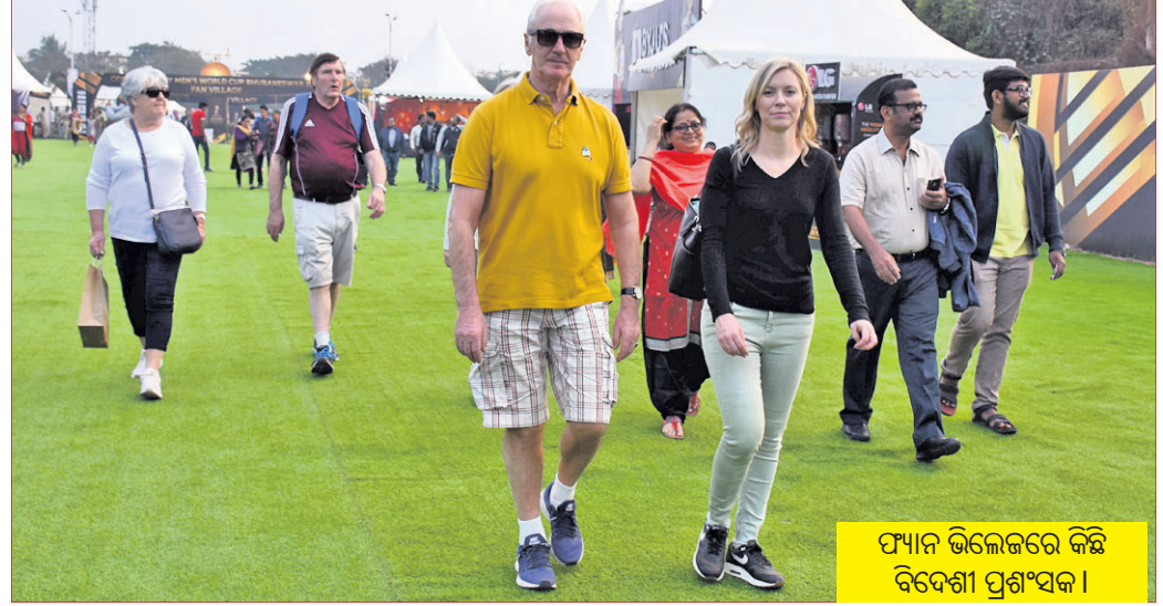
ଫ୍ୟାନ ଭିଲେଜରେ କିଛି ବିବେଶୀ ପ୍ରଶଂସକ ।