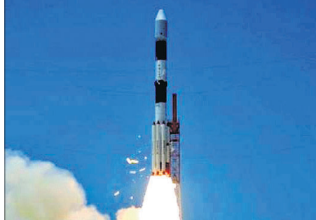
ପୃଥିବୀର କକ୍ଷପଥରେ ସ୍ଥାପନ କରିପାରିଥିଲା। ଭାରତ ଦ୍ୱାରା ନିର୍ମିତ ସବୁଠାରୁ ଉଚ୍ଚନିଆ ଓ ଶକ୍ତିଶାଳୀ

ଭାରତୀୟ ମହାକାଶ ଗବେଷଣା ସଂସ୍ଥା (ଇସ୍ରୋ) ଦ୍ୱାରା ନିର୍ମିତ ସବୁଠାରୁ ଉଚ୍ଚନିଆ ସାଟେଲାଇଟ୍ ଜିଏସ୍ଏଟି-୧୧କୁ ବ୍ୟୁତ୍ପାଦନା ପ୍ରକଳ୍ପରେ ସମ୍ପୂର୍ଣ୍ଣ ସଫଳତାରେ ସହିତ ଲଞ୍ଚ କରାଯାଇଛି। ଏହି ଉପଗ୍ରହ ବ୍ରହ୍ମପୁର ସେବାକୁ ବ୍ୟବହାର କରିବ। ପ୍ରୋକ୍ସିମାସ୍-୧ ନାମକ ଉପଗ୍ରହକୁ ଭାରତୀୟ ସ୍ଥାନୀୟ ସମୟ (ମଙ୍ଗଳବାର-ବ୍ୟୁତ୍ପାଦନା ରାତି) ୨ଟା ୩୫ମିନିଟରେ ଏରିଏନ-୫ ରକେଟ୍ରେ ଅକ୍ସିଡ଼ାୟୋଗ କରାଯାଇଥିଲା। ଦୀର୍ଘ ୩୩ମିନିଟ୍ ପରେ ଉକ୍ତ ରକେଟ୍ ଜିଏସ୍ଏଟି-୧୧କୁ