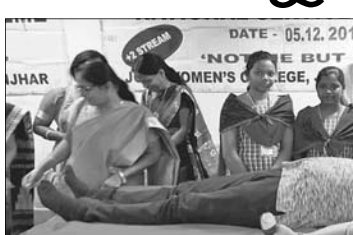
କଣେ ବୋଲୁଥିବା ବନ୍ଧୁ ଦେଉଛନ୍ତି ।