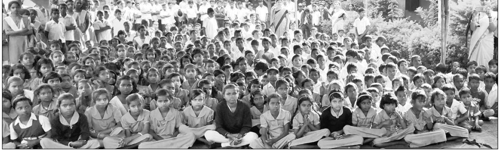
ଉଦ୍‌ଘାଟନା ଉତ୍ସବରେ ଉପସ୍ଥିତ ଛାତ୍ରାଛାତ୍ରୀ।