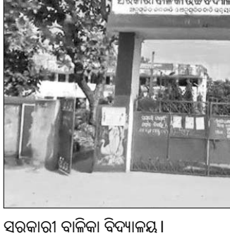
ସରକାରୀ ବାଲିକା ବିଦ୍ୟାଳୟ।

ପରିବାର ଲୋକ ଛାତ୍ରାନ୍ତରାସରେ ଛାଡ଼ି ଆସିଥିଲେ କହୁଛନ୍ତି। ଅନ୍ୟ ପକ୍ଷରେ ରେବଣାପଲ୍ଲୀପାଳାଠାରେ ଥିବା ଏସିଟି, ଏସସି ବିଭାଗ ଅଧୀନରେ ପରିଚାଳିତ ସରକାରୀ ବାଲିକା ବିଦ୍ୟାଳୟର ଜଣେ ୧୦ମ ଶ୍ରେଣୀ ଛାତ୍ରୀ ନିଖୋଜ ହୋଇଛନ୍ତି। ଏ ନେଇ ଛାତ୍ରାଙ୍କ ପରିବାର ଲୋକ ଦୈତାରୀ ଥାନାରେ ଲିଖିତ ଏତଲା ଦେଇଛନ୍ତି। ପୋଲିସ ବିଦ୍ୟାଳୟକୁ ଯାଇ ଘଟଣାର ତଦନ୍ତ ଆରମ୍ଭ କରିଥିଲେ। ନିଖୋଜ ଘଟଣା ଉତ୍ତର୍ୟ ଘେରରେ ରହିଛି। ଗତ ଅକ୍ଟୋବର ୩୦ରେ ଛାତ୍ରୀକୁ