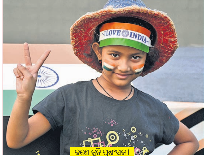
ଜଣେ କୁନି ପ୍ରଶଂସକ ।