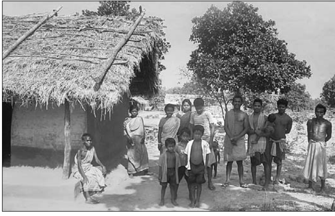
ଅଙ୍ଗନୂଆଡ଼ି ଶିଶୁଙ୍କ ସହ ଗ୍ରାମବାସୀ।

ଆଦିବାସୀ ବହୁଳ ଚେଳକୋଇ ଅଞ୍ଚଳରେ ଶିଶୁ ପ୍ରକଳ୍ପ ବିଭାଗ ପକ୍ଷରୁ ଚାଲିଥିବା ଅଙ୍ଗନୂଆଡ଼ି କେନ୍ଦ୍ରର ଭିତ୍ତିଭୂମି ସହ ନିକଟ ଗୃହ ନ ଥିବାରୁ ଛାତ୍ରାଛାତ୍ରୀ ହଇଜା ହେଉଛି। ଅଧିକାଂଶ କେନ୍ଦ୍ର ଗ୍ରାମ ପାଖ, କୁଚ ଗୃହ, ବିଦ୍ୟାଳୟ ଓ କଳାଳୟ ପୂରଣା ଗୃହରେ ପାଠପଢ଼ା ଚାଲିଛି। ଉକ୍ତ ଅଞ୍ଚଳ ଥିବା ୧୮୫ ଅଙ୍ଗନୂଆଡ଼ି କେନ୍ଦ୍ର, ୪୬ ମିନି ଅଙ୍ଗନୂଆଡ଼ି କେନ୍ଦ୍ରରେ ସମସ୍ୟା ଦେଖା ଦେଇଛି। ସମସ୍ତ କେନ୍ଦ୍ର ଅଧୀନରେ ୧୦ ହଜାରରୁ ଊର୍ଦ୍ଧ୍ୱ ଶିଶୁ ରହିଛନ୍ତି। ୨ ହଜାରରୁ ଊର୍ଦ୍ଧ୍ୱ ଗର୍ଭବତୀ ମହିଳା ପୁଷ୍ଟିକର ଖାଦ୍ୟ ଓ ଔଷଧ ପାଇବାକୁ ବଞ୍ଚିତ ହୋଇଥିବା ଅଭିଯୋଗ କରାଯାଇଛି। ବିଭାଗ ପକ୍ଷରୁ ନିକଟ ଗୃହ କରାଯାଇ