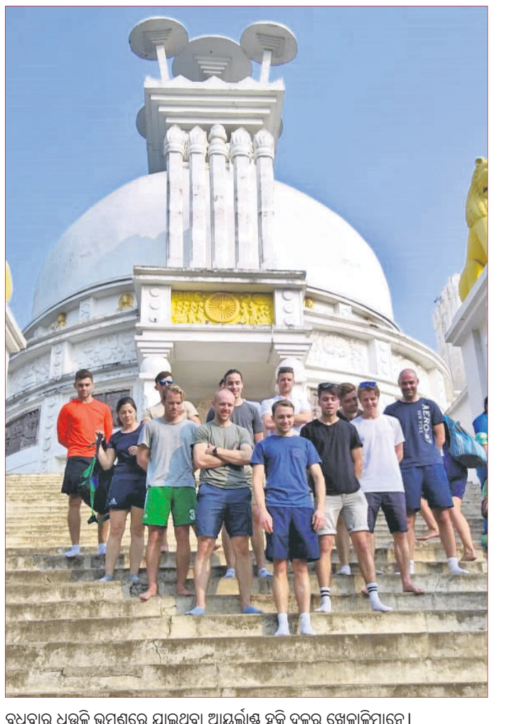
ରୁଧିର ଅନୁଷ୍ଠିତ ମ୍ୟାଚରେ ଯାଇଥିବା ଆୟର୍ଲ୍ୟାଣ୍ଡ ହକି ଦଳର ଖେଳାଳିମାନେ ।