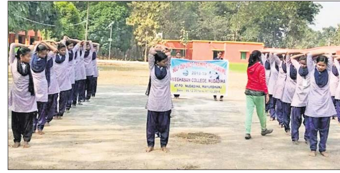
ଛାତ୍ରୀମାନେ ଆତ୍ମସୁରକ୍ଷା ତାଲିମ ଗ୍ରହଣ କରୁଛନ୍ତି।

କରିଥିଲେ। ସେମାନଙ୍କ ମଧ୍ୟରୁ ଯୋଗ୍ୟତା ଭିତ୍ତିରେ ୧୩ ଟି କମ୍ପାନୀରେ ୩୫୨ ଜଣ ନିୟୁତ୍ତ ପାଇଥିଲେ। ଏହା ସହିତ ୨୮୩ ଜଣ ବେକାର ମୁବତାମୁବକ ବିଭିନ୍ନ ପ୍ରକାର ତାଲିମ ନେବା ପାଇଁ ଯୋଗ୍ୟ ବିବେଚିତ ହୋଇଥିଲେ। ସେମାନଙ୍କ ମଧ୍ୟରୁ ୨୬୨ ଜଣ ହଜାର ମୁବତାମୁବକ ବିଭିନ୍ନ ପ୍ରକାର ତାଲିମ ନେବା ପାଇଁ ଯୋଗ୍ୟ ବିବେଚିତ ହୋଇଥିଲେ। ସେମାନଙ୍କ ମଧ୍ୟରୁ ୨୦୧୪ ରେ ୨୧ ଜଣ, ୨୦୧୫ ରେ ୫୪୭, ୨୦୧୬ ରେ ୧୨ ଜଣ, ୨୦୧୭ରେ ୨୪ ଜଣ ଏବଂ ୨୦୧୮ ରେ ୫୫ ଜଣ ସରକାରୀ ଚାକିରି ପାଇଛନ୍ତି।