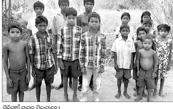
ସିଲିସୁଆଁ ଗ୍ରାମର ପିଲାମାନେ।

ଗାଁର ନାଁ ସିଲିସୁଆଁ ମୁଣ୍ଡାସାହି। ଏଠି ଶତପ୍ରତିଶତ ଆଦିବାସୀ ଲୋକ ବସବାସ କରନ୍ତି। ଦେଶ ସାଧାରଣ ହେବାର ଅନେକ ବର୍ଷ ପରେ ବି ସେମାନେ ଅବହେଳିତ ଜୀବନ ବିତାଉଛନ୍ତି। ଗ୍ରାମରେ ଉନ୍ନତିର ସାମାନ୍ୟତମ ଝଲକ ଦେଖିବାକୁ ମିଳିନାହିଁ। ଗାଁକୁ ଗମନାଗମନର ସୁବିଧା ନାହିଁ। ଲୋକଙ୍କ ଆର୍ଥିକ ଉନ୍ନତି ହୋଇପାରୁନି। ଏହି ଗ୍ରାମ କେନ୍ଦୁଝର ସଦର ବ୍ଲକ ଗୋପାଳାପୁର ପଞ୍ଚାୟତ ଅଧୀନରେ ରହିଛି। ୭ ଶହରୁ ଊର୍ଦ୍ଧ୍ୱ ଲୋକ ବସବାସ କରୁଛନ୍ତି। ଆଦିବାସୀ ହୋଇଥିବାରୁ ସରକାରଙ୍କ ସମସ୍ତ ଯୋଜନା ସେମାନଙ୍କ ପାଖରେ ପହଞ୍ଚିପାରିନାହିଁ ବୋଲି କହିଛନ୍ତି। ପଞ୍ଚା ରାସ୍ତା ନ ଥିବାରୁ ବର୍ଷା ଦିନରେ ଆଖୁସ କାଟୁଥିବା ଯାତାୟତ କରିବାକୁ ପଡ଼ୁଛି। ଲୋକେ ଭଙ୍ଗା କୁଡ଼ିଆରେ ଜୀବନ ବିତାଉଛନ୍ତି। ୬୦ ପ୍ରତିଶତ ଲୋକଙ୍କୁ ମିଳିତ ରାଶନ କାର୍ଡ। ଅନେକ ବୃଦ୍ଧାବୁଦ୍ଧ