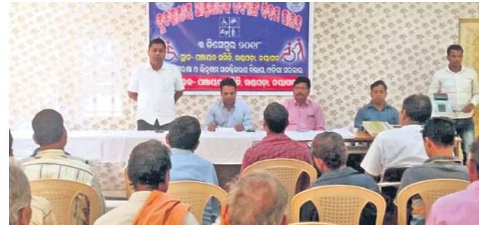
କାର୍ଯ୍ୟକ୍ରମରେ ଉପସ୍ଥିତ ବିଧାୟକ ଓ ଅନ୍ୟମାନେ।

ବିଶ୍ୱ ଭିକ୍ଷା ଦିବସ ଅବସରରେ ଖଣ୍ଡପଡ଼ା ସହରାଞ୍ଚଳସ୍ଥିତ ପଠାଣି ସାମାଜିକ ଶାସ୍ତ୍ରୀୟ ଅଧ୍ୟାପକ ସଂଘ ପକ୍ଷରୁ ଅନ୍ତର୍ଜାତୀୟ ଭିକ୍ଷା ଦିବସ ପାଳିତ ହୋଇ ଯାଇଛି।