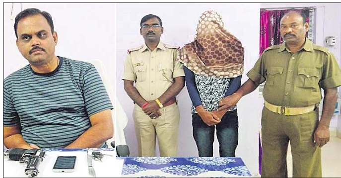
ଗିରଫ ଅଭିଯୁକ୍ତ ଓ ଜବତ ମାଉଜର, ହୁରି।

୨୦୧୫ରୁ ଅନ୍ୟାୟ ୨୫୦୦ ଡକ୍ଟର ଓ ଚୋରୀ ମାମଲାରେ ସମ୍ପୃକ୍ତ ଥିବା ଜଣେ ଆନ୍ଧ୍ର ଜିଲ୍ଲା ଲୁଚେରାକୁ ଓଡ଼ିଶା ପୋଲିସ ଗିରଫ କରି ରୁଧିରା କୋର୍ଟ ଚାଲାଣ କରିଛି।