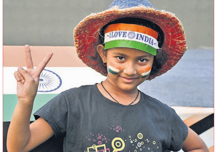
କିଶୋରୀ ଶ୍ରୀମନ୍ଦିର ପ୍ରସିଦ୍ଧ ।