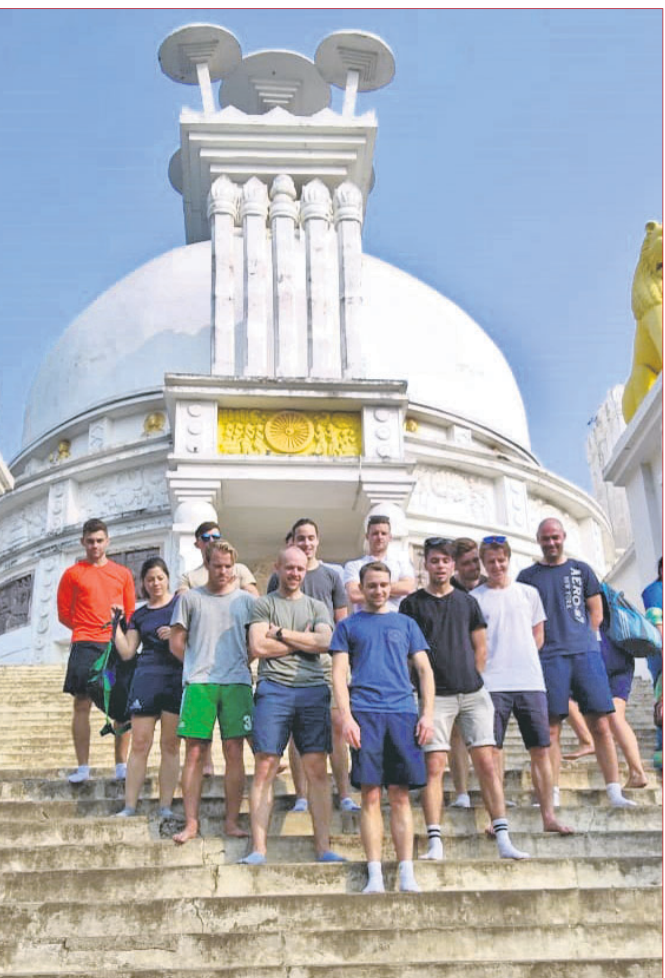
ରୁଧିର ଅନୁଷ୍ଠିତ ମ୍ୟାଚରେ ଯାଇଥିବା ଆୟର୍ଲ୍ୟାଣ୍ଡ ହିନ୍ଦି ବିଶ୍ୱକପ ଖେଳାଳିମାନେ ।