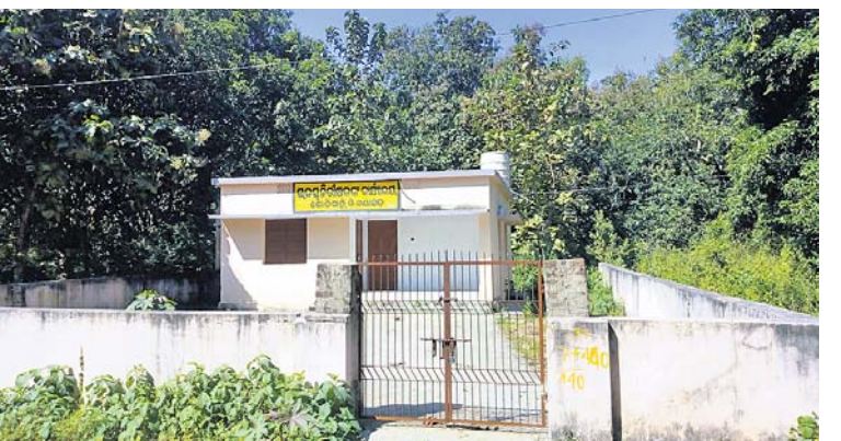
ରାଜ୍ୟ ନିରୀକ୍ଷକଙ୍କ ନୂତନ କାର୍ଯ୍ୟାଳୟ।

ରାଜ୍ୟ ସରକାର ସମସ୍ତ ସରକାରୀ କାର୍ଯ୍ୟାଳୟର ଭିଡିଓଗ୍ରାଫି କିପରି ସୁଦୃଢ଼ ହେବ ସେ ଦିଗରେ ଗୁରୁତ୍ୱ ଦେଉଛନ୍ତି।