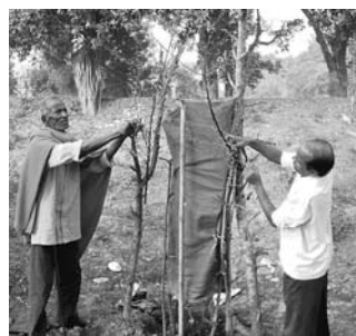
ବୃକ୍ଷରୋପଣ ପରେ ସହାୟ ଆବଶ୍ୟକ କରାଯାଇଛି । ପାଇଛି । ଆୟୋଜିତ ଏହି କାର୍ଯ୍ୟକ୍ରମରେ

ମତବ୍ୟକ୍ତ କରିଥିଲେ । ସେହିପରି ଫସଲରେ ରାସାୟନିକ ପଦାର୍ଥ ପ୍ରୟୋଗ କରାଯିବା ଯୋଗୁ ମାଟି ଜୁମାଣି ବିଷାକ୍ତ ହେବାରେ ଲାଗିଛି । ଅପରପକ୍ଷେ ପରମାଣୁ ବୋମାର ପ୍ରୟୋଗ ଯୋଗୁ ମାଟି ଭୟଙ୍କର ଭାବେ ବିଷାକ୍ତ ହେଉଛି । ଏକ ସଚେତନତା ଶିବିର ଅନୁଷ୍ଠିତ ହୋଇଯାଇଛି । ବୃକ୍ଷର ଅଭାବ, ଖଣିଜାଦାନ, କ୍ୟାଲ୍‌ସିୟମ୍ ସହର ଓ ରାସ୍ତା ନିର୍ମାଣ ଲାଗି ପ୍ରତିଦିନ ମୃତ୍ତିକା କ୍ଷୟ ହେବାରେ ଲାଗିଛି ବୋଲି ଗଛସାର