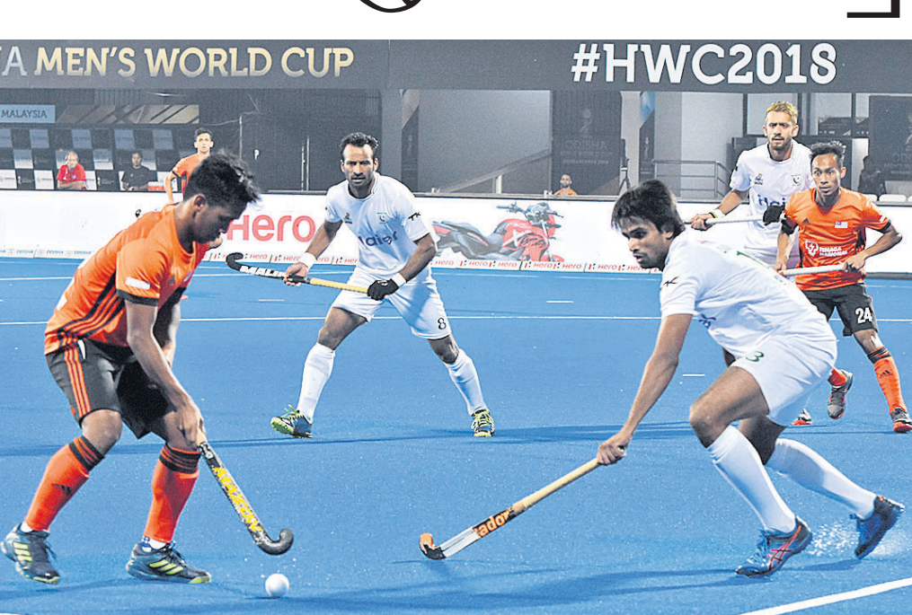
ମାଲେସିଆ-ପାକିସ୍ତାନ ମଧ୍ୟରେ ରୁଧିର ଅନୁଷ୍ଠିତ ମ୍ୟାଚ ।

ଭୁବନେଶ୍ୱର, ୫୧୧୨ (ବ୍ରାହ୍ମା ପ୍ରତିନିଧି) ହିନ୍ଦି ବିଶ୍ୱକପର କଳିଙ୍ଗ ଷ୍ଟାଡିୟମରେ ରୁଧିର ଅନୁଷ୍ଠିତ ମାଲେସିଆ-ପାକିସ୍ତାନ ପୁଲ୍ 'ଡି' ମ୍ୟାଚ ୧-୧ ଗୋଲରେ ଡ୍ର ରହିଛି । ଫଳରେ ଗୋଲ ଦଳ ପଏଣ୍ଟ ଭାଗ କରିଛନ୍ତି । ତେଣୁ ଏଥିରୁ ଗୋଟିଏ ଦଳ ପୁଲ୍ ପର୍ଯ୍ୟାୟକୁ ବିଦାୟ ନେବା ନିଶ୍ଚିତ ହୋଇଛି । ଅନ୍ୟପକ୍ଷରେ ଏହି ମ୍ୟାଚର ଫଳାଫଳ ନେଦରଲାଣ୍ଡକୁ ଫାଇଦାରେ ମଧ୍ୟ ରଖିଛି । କାରଣ ପୁଲ୍ 'ଡି'ରେ ଜର୍ମାନୀ ୨ ମ୍ୟାଚରୁ ୬ ପଏଣ୍ଟ ସହିତ ଟେବୁଲର ଶୀର୍ଷରେ ରହିଥିବାବେଳେ ନେଦରଲାଣ୍ଡ ସମାନ ମ୍ୟାଚରୁ ୩ ପଏଣ୍ଟ ପାଇଥିବାରୁ ସିଧାସଳଖ କ୍ୱାର୍ଟର ଫାଇନାଲ ପ୍ରବେଶ ସମ୍ଭାବନା ଉଜ୍ଜୀବିତ କରିଛି । ଅନ୍ୟପକ୍ଷରେ ପାକିସ୍ତାନ ଓ ମାଲେସିଆ ୧ ପଏଣ୍ଟ ଲେଖାଏ ପାଇଥିବାବେଳେ ନେଦରଲାଣ୍ଡ ୨ ମ୍ୟାଚରୁ ୨ ମ୍ୟାଚ୍ ଉପରେ ନିର୍ଭର କରିବା ପୁଲ୍ ଡ୍ରରେ ହିତାଚ୍ଛନ୍ନ ହୋଇଛି । ତେଣୁ ପର୍ଯ୍ୟାୟକୁ ବିଦାୟ ନେବା ତେଣୁ ନେଦରଲାଣ୍ଡ ୩ ପଏଣ୍ଟ ପାଇ ସାରିଥିବାରୁ ଅତିକମରେ ପୁଲ୍ ପର୍ଯ୍ୟାୟକୁ ବାଦ୍ ପଡ଼ିବା ସମ୍ଭାବନାକୁ ଏଡ଼ାଇ ଦେଇ ପାରିଛି । ମାଲେସିଆ ଏହାର ପ୍ରଥମ ମ୍ୟାଚରେ ନେଦରଲାଣ୍ଡଠାରୁ ୦-୧ ଗୋଲରେ ହାରିଥିଲା । ସେହିପରି ପାକିସ୍ତାନ ୦-୧ ଗୋଲରେ ଜର୍ମାନୀଠାରୁ ପରାସିତ ହୋଇଥିଲା । ପାକିସ୍ତାନ ଏହାର ଶେଷ ପୁଲ୍ ମ୍ୟାଚରେ ୯ ଚାରିଖରେ ନେଦରଲାଣ୍ଡକୁ ଭେଦିବ । ସେହିଦିନ ମାଲେସିଆ ଓ ଜର୍ମାନୀ ମଧ୍ୟରେ ଯୁଦ୍ଧାବଳୀ ହେବ । ବିଶ୍ୱ ରାୟାଳିଆରେ ୧୨ ନମ୍ବର ମାଲେସିଆ ଓ ୧୩ ନମ୍ବର ପାକିସ୍ତାନ ସମକକ୍ଷ ଦଳ ହୋଇଥିବାରୁ ଆରମ୍ଭରୁ ପରସ୍ପର ଉପରେ ଗାପ