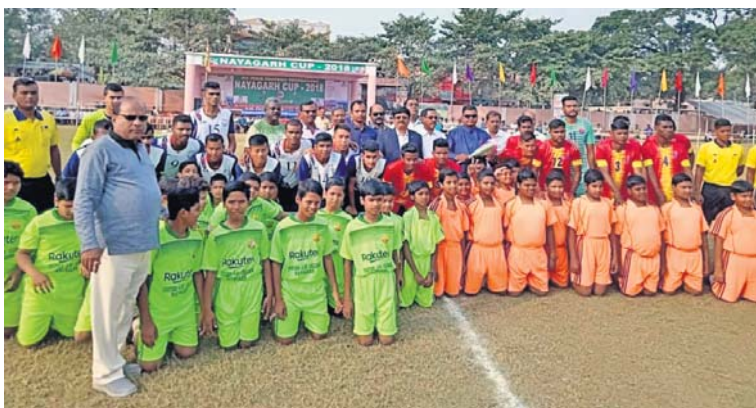
ଅତିଥିମାନଙ୍କ ସହିତ ଭଉଁସ ଦଳର ଖେଳାଳିମାନେ।

୭୮୬ ଯୁବ କୁଳ ସିୟୁରିଆ ଓ ଜିଲା ଆଧିକାରୀଙ୍କ ଆୟୋଜିତ ଫିଲିଟ ଆନୁଷ୍ଠାନରେ ନୟାଗଡ଼ ଖେଳପଡ଼ାରେ ସର୍ବଭାରତୀୟ ଫୁଟବଲ ଚୁନାମେଣ୍ଟ ବାହୁରିଯାଇଛି।