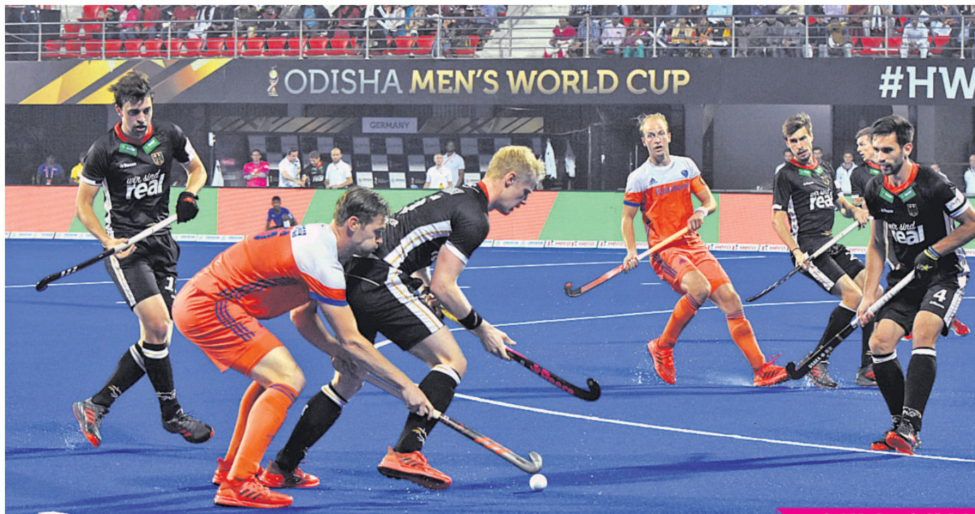
ଜର୍ମାନୀ ଓ ନେଦରଲାଣ୍ଡ ମଧ୍ୟରେ ରୁଧିର ଅନୁଷ୍ଠିତ ମ୍ୟାଚର ଏକ ସଂଘର୍ଷପୂର୍ଣ୍ଣ ମୁହୂର୍ତ୍ତ ।