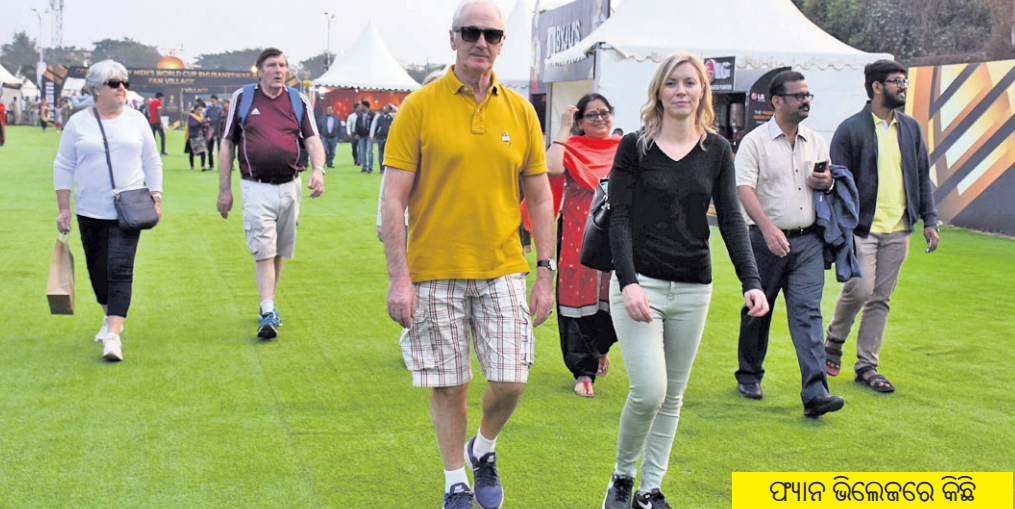
ଫ୍ୟାନ ଭିଲେଜରେ କିଛି ବିବେଶୀ ପ୍ରସିଦ୍ଧ ।