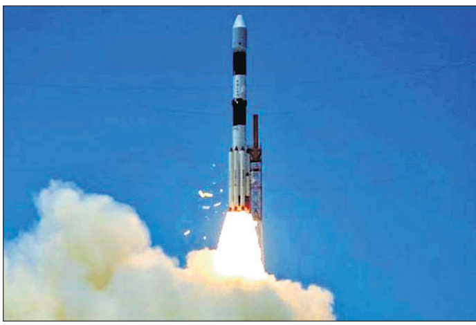
ରକେଟ୍ ଜିଏସ୍‌ଟି-୧୧କୁ ପୃଥିବୀର ଭାରତ ଦ୍ୱାରା ନିର୍ମିତ ସବୁଠାରୁ ଓଜନିଆ କକ୍ଷପଥରେ ସ୍ଥାନ କରି ପାରିଥିଲା। ଓ ଶକ୍ତିଶାଳୀ ସାତେଲାଇଟ୍

ଭାରତୀୟ ମହାକାଶ ଗବେଷଣା ସଂସ୍ଥା (ଇସ୍ରୋ) ଦ୍ୱାରା ନିର୍ମିତ ସବୁଠାରୁ ଓଜନିଆ ସାତେଲାଇଟ୍ ଜିଏସ୍‌ଟି-୧୧କୁ ରୁପସାର ଫ୍ରେଜ୍‌ଗ୍ରାଏନା ଉତ୍ତ୍ରେୟଣ ସ୍ଥଳକୁ ଏରିଏନଏସ୍‌ଏ ରକେଟ୍ ଯୋଗେ ସଫଳତାର ସହିତ ଲଞ୍ଚ୍ କରାଯାଇଛି।