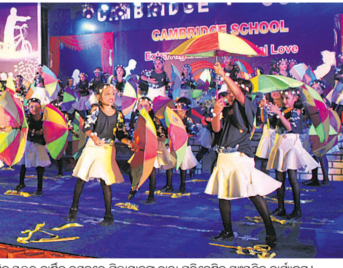
ବୁଧବାର କଟକ କ୍ୟାଣ୍ଟନମେଣ୍ଟ ରୋଡ୍ରେ ଚଳିଥିବା ସ୍ମରଣ ବାର୍ଷିକ ଉତ୍ସବରେ ପିଲାମାନଙ୍କ ଦ୍ୱାରା ପରିବେଷିତ ସଂସ୍କୃତିକ କାର୍ଯ୍ୟକ୍ରମ।

କଟକ ସହର, ୫।୧୨ (ଡି.ଏନ୍.ଏ.) ୨୧ ଦଫା ଦାବି ପୂରଣ ନ ହେବା ପ୍ରତିବାଦରେ ବୁଧବାର କିଶନ ନଗର ବିକାଶ ମଞ୍ଚ ପକ୍ଷରୁ ଘାନ୍ତା ଚହସିଲ କାର୍ଯ୍ୟାଳୟ ଘେରାଉ କରାଯାଇଥିଲା।