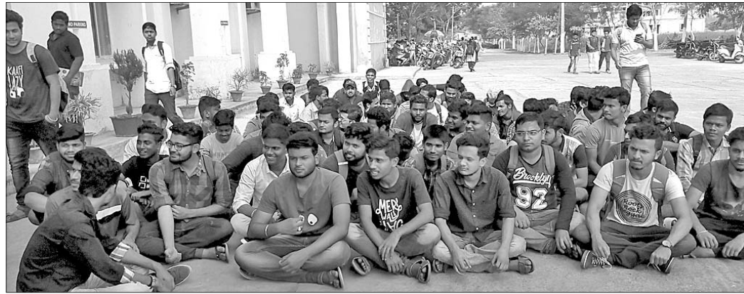
ଛାତ୍ରମାନେ କଲେଜ ପରିସରରେ ଧାରଣା ଦେଇଛନ୍ତି ।

ବ୍ରହ୍ମପୁର ଉପକଣ୍ଠ ପାଠକ ପାଠାଳୟ ମହାରାଜା ଜିଉନିନ୍‌ସର୍ କଲେଜର ୯ ଛାତ୍ରଙ୍କୁ ମଙ୍ଗଳବାର ରାତିରେ ମାତ୍ର ମାରାଯାଇଥିବା ଅଭିଯୋଗ ହୋଇଛି ।