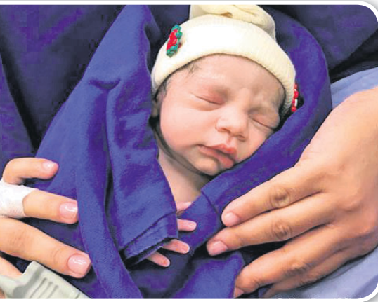
ମହିଳାଙ୍କ ଜରାୟୁ କାଢ଼ି ଅନ୍ୟ ଥିବାକୁ ଚାକ୍ଷୁରେ ଗର୍ଭାଶୟ ମହିଳାଙ୍କଠାରେ ପ୍ରତିରୋଧିତ କରାଯାଇ ପାରିବ। ଉକ୍ତ ମହିଳା ଲାଡ଼ିନିଆପେରିକାରେ ଏହା ହେଉଛି ଗର୍ଭଧାରଣ କରିବାକୁ ଅସମର୍ଥ ପ୍ରଥମ ଗର୍ଭାଶୟ ପ୍ରତିରୋଧିତ।

ବିଶ୍ୱରେ ପ୍ରଥମ କରି ଜଣେ ବ୍ରାଜିଲିଆନ୍ ମହିଳା ପ୍ରତିରୋଧିତ ଗର୍ଭାଶୟରୁ ଏକ ଶିଶୁଜନ୍ମା ଜନ୍ମ କରିବାକୁ ସମର୍ଥ ହୋଇଛନ୍ତି। ଜଣେ ମୃତ ମହିଳାଙ୍କ ଗର୍ଭାଶୟ ଉକ୍ତ ମହିଳାଙ୍କଠାରେ ପ୍ରତିରୋଧିତ କରାଯାଇଥିଲା। ମୃତ ମହିଳାଙ୍କଠାରୁ ଦାନରୂପେ ଗ୍ରହଣ କରାଯାଇଥିବା ଗର୍ଭାଶୟ କାର୍ଯ୍ୟକରିବା ସମ୍ଭବ ବୋଲି ଏଥିରୁ ସ୍ପଷ୍ଟ ହୋଇଛି। ଯେଉଁ ମହିଳାଙ୍କର ଜରାୟୁ ଗର୍ଭଧାରଣ କରିବାକୁ ଅସମର୍ଥ ସେମାନେ ଜୀବନ୍ତ ମହିଳାଙ୍କଠାରୁ ଗର୍ଭାଶୟ ଲୋଡ଼ିବା ଆବଶ୍ୟକ ନାହିଁ। ତେବେ ପରିବାର ସଦସ୍ୟ ରହିଲେ ମୃତ