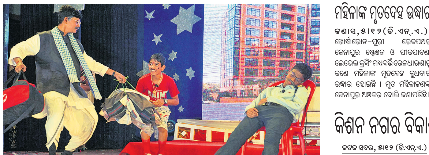
କଟକ ଶହୀଦ ଭବନରେ ରାଜାବରିତା ଡିଏସି ପଦ୍ମିନୀ ସ୍ମରଣ ବାର୍ଷିକ ଉତ୍ସବରେ ବୁଧବାର ଉଦ୍ଘାଟନା ସମାବେଶରେ ପରିବେଷିତ ନାଟକ 'ଅତିଥି ତୁମ୍ଭେ କ'ଣ ଜାଣେ'ର ଏକ ଦୃଶ୍ୟ।