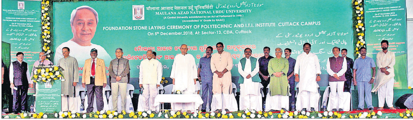
ମୌଲାନା ଆଜାଦ ଜାତୀୟ ଉର୍ଦ୍ଦୁ ବିଶ୍ୱବିଦ୍ୟାଳୟ କ୍ୟାମ୍ପସ୍ ଉଦ୍ଘାଟନ କାର୍ଯ୍ୟକ୍ରମରେ ମୁଖ୍ୟମନ୍ତ୍ରୀ ନବାନ ପଟ୍ଟନାୟକଙ୍କ ସମେତ ଅନ୍ୟ ଅତିଥିମାନେ।

ଗୋଳା, ୫।୧୨ (ଡି.ଏନ୍.ଏ.): ଗୋଳା-ଗୋଳା ଛକ କମିଟି ଗୋଳା ଶିକ୍ଷାର୍ଥୀ ବାହିନୀ ଗଠନ ହୋଇଛି।