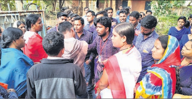
ରୁକ୍ମିଣୀ ଚୌରସରେ ଉଦ୍ଦେଶ୍ୟ।

ଛେଡ଼ିପଦା, ୭୧୨(ସ.ପ୍ର.) ଶିକ୍ଷକ ଯୋଗ୍ୟତା ମାନଦଣ୍ଡ ତୟନ କ୍ଷେତ୍ରରେ ଗଣଶିକ୍ଷା ବିଭାଗ ଅବହେଳା କରିଥିବା ଅଭିଯୋଗ କରି ଛେଡ଼ିପଦା ରୁକ୍ମିଣୀ ଚୌରସରେ ୯ ଦିନ ହେଲେ ଆନ୍ଦୋଳନ କରାଯାଇଥିବା ଜିଲ୍ଲା ଶିକ୍ଷା ଓ ପ୍ରଶିକ୍ଷଣ ପ୍ରତିଷ୍ଠାନ(ଡିଆଇଇଟି) ଛାତ୍ରୀଛାତ୍ର ଓ ଏମ୍‌ଆଇଓଏସ୍ (ନ୍ୟାଶନାଲ ଇନଷ୍ଟିଚ୍ୟୁଟ ଅଫ୍ ଓପନ ସ୍କୁଲ)ର ଛାତ୍ରୀଛାତ୍ରଙ୍କ ମଧ୍ୟରେ ଶୁକ୍ରବାର ଧସ୍ତାଧସ୍ତି ହୋଇଛି।