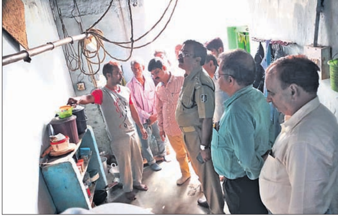
ଘଟଣାସ୍ଥଳରେ ତିତିଏମ୍‌ଏସ୍ ସହ ଅନୁଧ୍ୟାନ କରୁଛନ୍ତି।

ତାଳଚେର ପୌରାଞ୍ଚଳ ସଦର ଥାନା ସମ୍ମୁଖସ୍ଥ ଶାନ୍ତିଲତା ବାଇକ୍ ବାସଭବନ ଚଟାଣ ରୁଧିବାର ୪ ଫୁଟ ଦବିଯିବା ପରେ ସହରବାସୀଙ୍କ ସୁରକ୍ଷା ଓ ଭୁତକ ଖଣିରେ ବାଲି ପିଲି ଦାବିରେ ଗୁରୁବାରଠାରୁ ଅନିର୍ଦ୍ଦିଷ୍ଟ କାଳ ପାଇଁ ଦିଆଯାଇଥିବା ତାଳଚେର ବନ୍ଦ ତାଳଚେର ସେପରି ପ୍ରଭାବ ଶୁକ୍ରବାର ଦେଖିବାକୁ ମିଳିନାହିଁ।