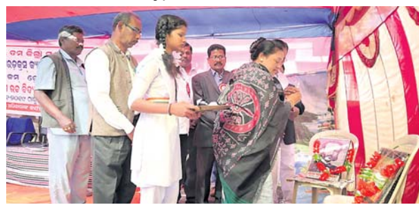
କାର୍ଯ୍ୟକ୍ରମକୁ ପୁଷ୍ପ ଅତିଥି ଭବ୍ୟାଚରଣ କରୁଛନ୍ତି ।