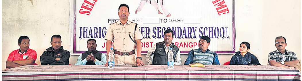
ଛାତ୍ରମାନଙ୍କୁ ଆନୁସୂରକ୍ଷା ସମ୍ପର୍କରେ ଅଭିଯୋଗ ପରାମର୍ଶ ଦେଉଛନ୍ତି ।