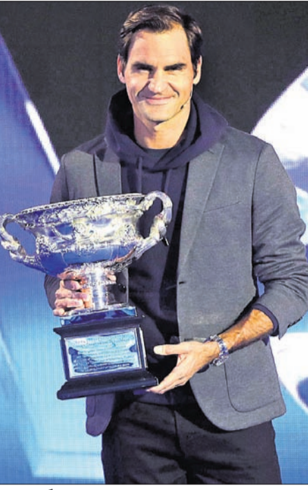
ଅଷ୍ଟ୍ରେଲିଆନ୍ ଓପନ୍ ଚେନିସ୍କୁ ଚାମ୍ପିୟନଶିପ୍ ପାଇଁ ଅପିଏଲ୍‌ଲୁ ହୁଁ ସର୍ବୁତ୍ତମ ମେଲବୋର୍ନଠାରେ ଚୁକ୍ତୁବାର ଗତଥରର ପୁରୁଷ ଚାମ୍ପିୟନ ନୋଭାକ ଫେଡେରର ନର୍ମାନ୍ ବୁକ୍ ଟ୍ୟାଲେଣ୍ଟ କମ୍ ଏବଂ ମହିଳା ଚାମ୍ପିୟନ କାରୋଲିନ୍ ଓଜନିଆକି ଚାପ୍‌ରେ ଅଖଣ୍ଡ ମେମୋରୀଆ କମ୍ ସହ।