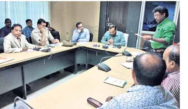
ବୈଠକରେ ଜିଲାପାଳଙ୍କ ସମେତ ଅଧିକାରୀମାନେ ଉପସ୍ଥିତ ଅଛନ୍ତି।