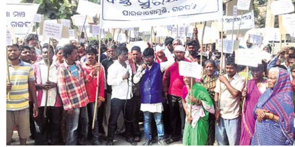
ମଞ୍ଚ ସଦସ୍ୟମାନେ ଜିଲ୍ଲାପାଳଙ୍କ କାର୍ଯ୍ୟାଳୟ ଯେରାଉ କରିଛନ୍ତି ।

ଗଜପତି ଜିଲ୍ଲାର ପାରଳାଖେମୁଣ୍ଡି ବସ୍ତି ସୁରକ୍ଷା ମଞ୍ଚ ପକ୍ଷରୁ ସ୍ଥାୟୀ ଜମିପତ୍ତା ପ୍ରଦାନ ଓ ବିଦ୍ୟୁତ୍ ସଂଯୋଗ ସମେତ ବିଭିନ୍ନ ଦାବି ନେଇ ଗୁରୁବାର ଜିଲ୍ଲାପାଳଙ୍କ କାର୍ଯ୍ୟାଳୟ ଯେରାଉ କରାଯାଇଛି । ଏଥିସହ ଅତିରିକ୍ତ ଜିଲ୍ଲାପାଳଙ୍କୁ ଦାବିପତ୍ର ପ୍ରଦାନ କରାଯାଇଛି । ସେହିପରି ରାଜ୍ୟପାଳ, ନଗର ଭକ୍ତର ମନ୍ତ୍ରୀ, ନଗର ଭକ୍ତର ସଚିବଙ୍କ ନିକଟକୁ ଦାବି ପତ୍ରର ନକଲ ପ୍ରୋତ୍ସାହନ କରାଯାଇଛି । ଆସନ୍ତା ସପ୍ତାହ ମଧ୍ୟରେ ଦାବିପତ୍ରର ନ ହେଲେ ବତପଦାରେ ଆୟୋଜନ କରାଯିବ ବୋଲି ତେଜାବଳୀ ଦିଆଯାଇଛି । ମଞ୍ଚ ଆବାହକ ସ୍ୱଳ୍ପିତ ପ୍ରଧାନ କହିଛନ୍ତି ଯେ, ଗତ ତିନି