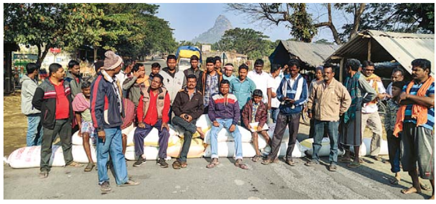
କୋରକୋଣ୍ଡାରେ ଚାଷୀମାନେ ରାସ୍ତା ଉପରେ ଧାନବସ୍ତ୍ର ରଖି ରାସ୍ତାରୋକୋ କରିଛନ୍ତି।