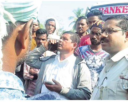
ପାଣ୍ଡିପାଣିରେ ଚାଷୀଙ୍କ ସହ ପ୍ରଶାସନିକ ଅଧିକାରୀ ଆଲୋଚନା କରୁଛନ୍ତି।