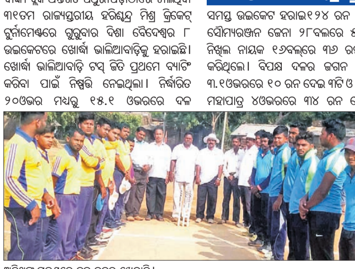
ଅତିଥିକ୍ ଗହଣରେ ତୁଳ ଦଳର ଖେଳାଳି।

ବାଙ୍କୀ, ୧୦୧୧ (ସି.ପି.) ବାଙ୍କୀ ରୁକ୍ଷ ଅନ୍ତର୍ଗତ ପଥୁରାପଡାଠାରେ ଚାଲିଥିବା ୩୧ତମ ରାଜ୍ୟସ୍ତରୀୟ ହରିଶ୍ଚନ୍ଦ୍ର ମିଶ୍ର କ୍ରିକେଟ୍ ଟୁର୍ନାମେଣ୍ଟରେ ଚୁକ୍ତୁବାର ଦିଶା ବୈଦେଶ୍ୱର ୮ ଉଇକେଟରେ ଖୋର୍ଦ୍ଧା ଭାଲିଆବାଡ଼ିକୁ ହରାଇଛି। ଖୋର୍ଦ୍ଧା ଭାଲିଆବାଡ଼ି ଚମ୍ପିୟନ ପ୍ରଥମେ ବ୍ୟାଟିଂ କରିବା ପାଇଁ ନିଶ୍ଚିତ ନେଇଥିଲା। ନିର୍ଦ୍ଧାରିତ ୨୦ଓଭର ମଧ୍ୟରୁ ୧୫୫ ଓଭରରେ ଦଳ