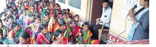
ଶିକ୍ଷା ବିକାଶ କାର୍ଯ୍ୟକ୍ରମରେ ଯୋଗଦେଇଥିବା ଅତିଥି ଓ ଗ୍ରାମବାସୀ।