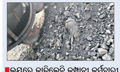
ଉତ୍ତରରେ କାଢ଼ିଲେନି କମ୍ପାନୀ କର୍ମଚାରୀ

ପାରାଦୀପ ବନ୍ଦରରେ ପଶ୍ୟ ପରିବହନ ବେଳେ ଏକ ମୃତ ବାଘୁହା ଜାହାଜ ଯୋଗେ ବିଦେଶକୁ ଚାଲିଯିବାକୁ କ୍ଷମା ପ୍ରଦାନ କରାଯାଇଛି । ସେହି ଫଳରେ ଏବେ ସୋମ ଆଲ ନିକିଆରେ ଭାଇଗାଲ ହୋଇଛି । ଗତ ୫ ଡିସେମ୍ବର ଏହି ବାଘୁହା ଜାହାଜରେ ଲୋଡ୍ କରାଯାଇଛି । ବନ୍ଦର ନିଷିଦ୍ଧାଞ୍ଚଳ କେସିଡି (କରମଚାନ୍ଦ ଆପର) କମ୍ପାନୀ ପୂର୍ବରୁ ଏହି ବୃକ୍ଷ ଉତ୍ତୋଳନ ହୋଇଛି । କେଉଁ ଏକ ଖଣିରୁ କୋଇଲା ଉତ୍ତୋଳନ ବେଳେ ଏହି ବାଘୁହା ସେଥିରେ ମିଳିଛି । ସେହି କୋଇଲା ଚେନରେ ଆସି ଖଲାସ ହେବା ପରେ ଏହା ଜଣାପଡ଼ିଥିଲା । କୋଇଲା ପୂର୍ବରୁ କାମ କରୁଥିବା ଶ୍ରମିକ ଏହା ଦେଖି କମ୍ପାନୀ କର୍ମଚାରୀକୁ