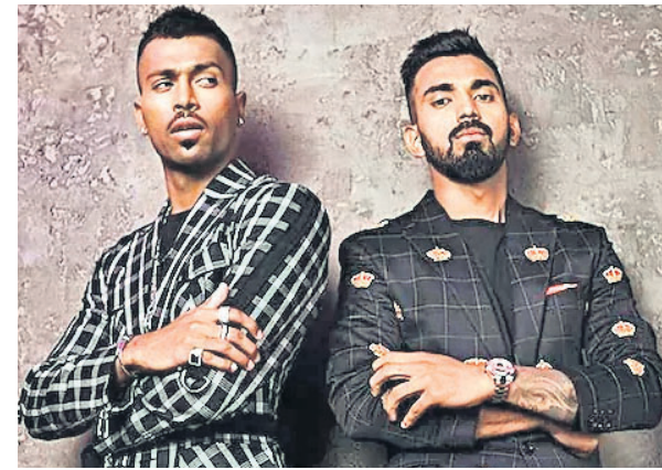
ହାର୍ଦ୍ଦିକ ପାଣ୍ଡ୍ୟା ଓ ଲୋକେଶ ରାହୁଲ।

ଏକ ରିୟାଲିଟି ଟିଭି ଶୋ'ରେ ମହିଳାଙ୍କ ପ୍ରତି ବିବାଦୀୟ ଟିପ୍ପଣୀ ଦେଇ ବିବାଦ ଘେରକୁ ଚାଲି ଆସିଥିବା ଦୁଇ ଭାରତୀୟ ଯୁବ କ୍ରିକେଟର ହାର୍ଦ୍ଦିକ ପାଣ୍ଡ୍ୟା ଓ ଲୋକେଶ ରାହୁଲଙ୍କୁ ଶେଷରେ ଏହା ମହଙ୍ଗା ପଡ଼ିଛି। ଅଲ୍‌ରାଉଣ୍ଡର ପାଣ୍ଡ୍ୟା ଓ ବ୍ୟାଟ୍‌ମ୍ୟାନ ରାହୁଲ ୨ଟି ଲେଖାଏଁ ଦିନିକିଆରୁ ବାସନ୍ଦ ହେବାର ସମ୍ଭାବନା ରହିଛି।