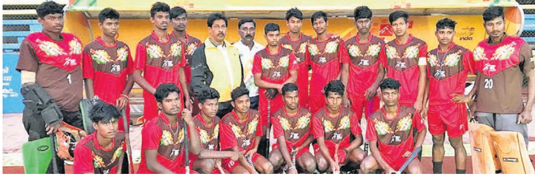
ବିଜୟ ଓଡ଼ିଶା ହକି ଦଳ।