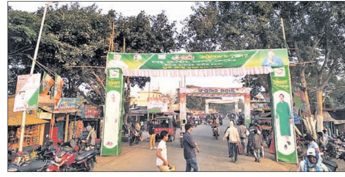
ରାଜନଗର ରୁକ୍ମିଣୀ ସମାଜସେବୀ ସମାଜରେ ଲାଗିଥିବା ପୋଷ୍ଟର ।

କେନ୍ଦ୍ରାପଡ଼ା ଜିଲ୍ଲାର ସରୁଠୁ ସହଯୋଗୀଙ୍କ ରାଜନଗର ନିର୍ବାଚନମଣ୍ଡଳର ରାଜନୈତିକ ବାତାବରଣ ଧାରା ଧାରା ଭଙ୍ଗ ହେବାରେ ଲାଗିଛି । ନିର୍ବାଚନ ଯେତେ ପାଖେ ଆସୁଛି, ଭୋଟରମାନଙ୍କୁ ନିଜ ସପକ୍ଷରେ ଆଣିବା ପାଇଁ ଆଶାୟୀ ପ୍ରାର୍ଥୀମାନଙ୍କ ଆଖିକୁ ନିଏ ଏକପ୍ରକାର ହଇଜା ହୋଇଛି ।