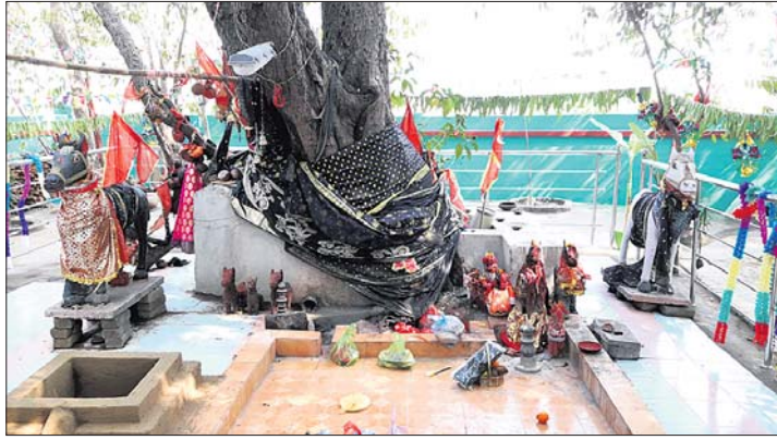
ମା' ଭୂଇଁଆଣୀଙ୍କ ପୀଠ ।

ନୟାଗଡ଼ ଜିଲ୍ଲା ଓଡ଼ିଶା ଭୂମି ସେବା ପଞ୍ଚାୟତ କାନିକଟା (ପଥରୀ) ଗ୍ରାମପଞ୍ଚାୟତ ଭୂଇଁଆଣୀ ପୀଠରେ ଗୁରୁବାର ଆରମ୍ଭ ହୋଇଛି ମଜର ଯାତ୍ରା।