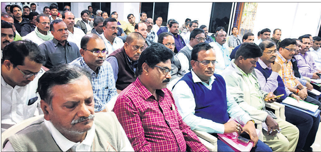
ବୈଠକରେ ପ୍ରଶାସନିକ ଅଧିକାରୀ ଓ ଅନ୍ୟମାନେ ।