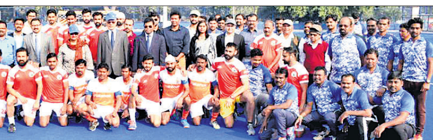
ଅତିଥିଙ୍କ ସହ ଭୁଲ୍ ଦଳର ଖେଳାଳିମାନେ।