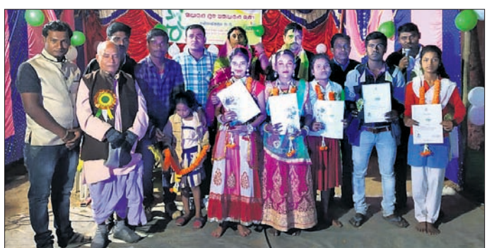
ରାଜନଗର ରୁକ୍ମିଣୀ ସମାଜସେବୀ ସମାଜରେ ଅନୁଷ୍ଠିତ କାର୍ଯ୍ୟକ୍ରମରେ ଅତିଥି ଓ ଅନ୍ୟମାନେ ।