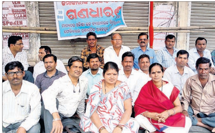
ଗୋଲଡେନ୍ ଲ୍ୟାଣ୍ଡ ଶିଳ୍ପକ୍ରମ ଜମାକାରୀ ଧାରଣା ଦେଇଛନ୍ତି।

ଚିଟଫଣ୍ଡ ସଂସ୍ଥା ଗୋଲଡେନ୍ ଲ୍ୟାଣ୍ଡ ଶିଳ୍ପକ୍ରମ ଜମାକାରୀ ମିଳିତ ମଞ୍ଚର ଧାରଣା ରବିବାର ୨୦ ଦିନରେ ପଢ଼ାଉଛି।