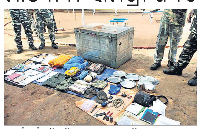
ଗନ୍ଧମାର୍ଜନ ପର୍ବତରୁ ସିଆରସିଏଟ୍ ମହାନମାନେ ଜବତ କରିଥିବା ମାଓବାଦୀଙ୍କ ସାମଗ୍ରୀ।