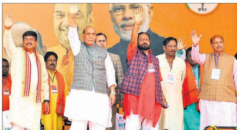
ଭଦ୍ରକ ରାଣାଚୋଲାଠାରେ ଆୟୋଜିତ ଭାରତୀୟ ସମାଜପକ୍ଷର ଉପସ୍ଥିତ କେନ୍ଦ୍ରମନ୍ତ୍ରୀ ରାଜନାଥ ସିଂ, ଧର୍ମେନ୍ଦ୍ର ପ୍ରଧାନ ଓ ଦଳର ଅନ୍ୟ ନେତୃମଣ୍ଡଳ।