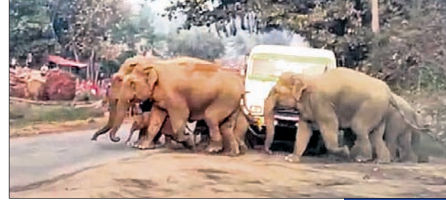
ହାତୀପଲ ଜାତୀୟ ରାଜପଥ ପାର ହେଉଛନ୍ତି।