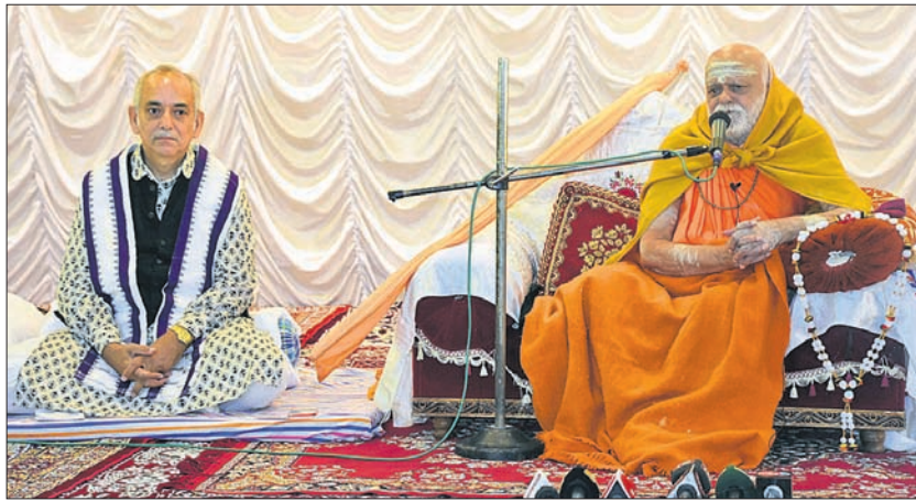
ଶ୍ରୀମନ୍ଦିର ଶୁଖିଲା ଓ ସମାଧାନ ବୈଠକରେ ଉପସ୍ଥିତ ମହାରାଜା ଏବଂ ଶଙ୍କରାଚାର୍ଯ୍ୟ ।

ଶିକ୍ଷା, ରକ୍ଷା, ସଂସ୍କୃତି, ସେବା, ଧର୍ମ ଓ ମୋକ୍ଷର କେନ୍ଦ୍ର ହେଉଛି ଶ୍ରୀମନ୍ଦିର । ଚର୍ଚ୍ଚିତ ଧର୍ମ ଧାରଣାରେ ଉପସ୍ଥିତ ଥିବା ସମସ୍ତଙ୍କୁ ସମାଧାନ କରିବା ପାଇଁ ଶ୍ରୀମନ୍ଦିରର ଶୁଖିଲା ପ୍ରଶ୍ନର ସମାଧାନ ଆବଶ୍ୟକ ହେବ । ଶ୍ରୀମନ୍ଦିରର ଶୁଖିଲା ପ୍ରଶ୍ନର ସମାଧାନ ଆବଶ୍ୟକ ହେବ । ଶ୍ରୀମନ୍ଦିରର ଶୁଖିଲା ପ୍ରଶ୍ନର ସମାଧାନ ଆବଶ୍ୟକ ହେବ । ଶ୍ରୀମନ୍ଦିରର ଶୁଖିଲା ପ୍ରଶ୍ନର ସମାଧାନ ଆବଶ୍ୟକ ହେବ ।