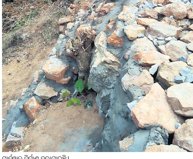
ଗାର୍ଡ଼ିଂ ନିର୍ମାଣ କରାଯାଇଛି।