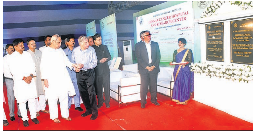
ପୁଖ୍ୟମନ୍ତ୍ରୀ ନବୀନ ପଟ୍ଟନାୟକ ଓ ଚାଟା ଗ୍ରନ୍ଥ ଅଧ୍ୟକ୍ଷ ରତନ ଏନ. ଚାଟା କ୍ୟାନ୍ସର ହସ୍ପିଟାଲର ଭିଡିଓସ୍ତର ଦେଖିଛନ୍ତି।