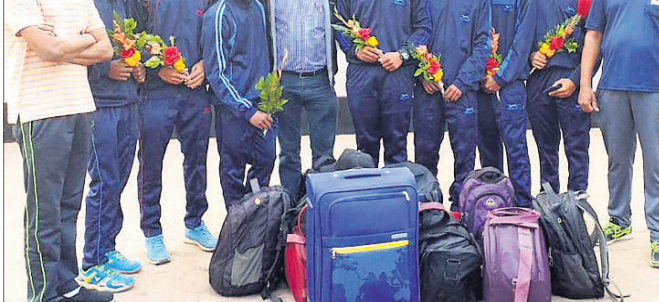
କୋଚ୍ ଗହଣରେ ବିଶ୍ଵବିଦ୍ୟାଳୟର ଖେଳାଳିମାନେ ।