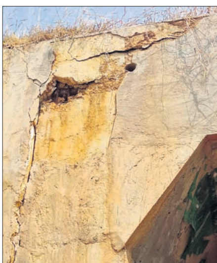
ରେଳ ଓଭରବ୍ରିଜରେ ସୃଷ୍ଟି ହୋଇଥିବା ପାଟ।

ଖୋର୍ଦ୍ଧା-ବଲାଙ୍ଗୀର ରେଳପଥ କାର୍ଯ୍ୟ ଚାଲିଥିବାବେଳେ ଏହାର ଏକ ଓଭରବ୍ରିଜରେ ପାଟ ସୃଷ୍ଟି ହୋଇଛି। ଏହା ଦେଖିବାକୁ ମିଳିଛି ନୟାଗଡ଼ ଜିଲ୍ଲା ନୂଆଗାଁ ବ୍ଲକ୍ ଡେକୋରା ପଞ୍ଚାୟତ ମଧୁବନଠାରେ। ନୟାଗଡ଼ ରେଳଷ୍ଟେସନଠାରୁ ନୂଆଗାଁ ପର୍ଯ୍ୟନ୍ତ ୨୧ କିଲୋମିଟର ରେଳପଥ ନିର୍ମାଣ କାର୍ଯ୍ୟ ମାର୍ଚ୍ଚ ୨୦୧୮ ସୁଦ୍ଧା ଶେଷ କରିବା ପାଇଁ ରେଳଫେର ଯୋଜନା ରହିଥିଲା। କିନ୍ତୁ ମଇ ଗତିରେ କାର୍ଯ୍ୟ ଚାଲିଥିବାବେଳେ ଏହା ଶେଷ ହୋଇପାରି ନାହିଁ। ଏଭଳି ସ୍ଥିତିରେ ନିର୍ମାଣର କାର୍ଯ୍ୟ ଯୋଗୁ ମଧୁବନସ୍ଥିତ ଓଭରବ୍ରିଜ କାନ୍ଧରେ ପାଟ ସୃଷ୍ଟି ହୋଇ ଚାଲିଥିବା ଅବସ୍ଥାରେ ପହଞ୍ଚିଲାଣି। ଏପରି କି କଂକ୍ରିଟ ଖସି ରତ୍ନ ଦେଖାଯାଇଛି। ଏଭଳି ଅବସ୍ଥାରେ ଏହି ରେଳପଥରେ ଯଦି ଟ୍ରେନ ଗଢ଼ିବ ତେବେ ବ୍ରିକ୍ ଚ୍ୟୁରୁଡ଼ିବା ଆଶଙ୍କା କରୁଛି ମଧୁବନ ଗ୍ରାମବାସୀ। ସେମାନେ ଦାବି କରୁଛନ୍ତି ଯେ, ତାହାକୁ ପୁଣି ନୂଆରେ ନିର୍ମାଣ କରାଯାଉ। ଯଦି ମରାମତି କରାଯାଏ ତା'ହେଲେ ଭବିଷ୍ୟତରେ ଗ୍ରାମବାସୀ