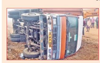
ବନ୍ତଳା, ୨୧୨ (ଡି.ଏନ.ଏ.)

କଟକ-ସମ୍ବଲପୁର ୫୫ ନମ୍ବର ଜାତୀୟ ରାଜପଥର ହସ୍ତପା ଥାନା ଲୁହାମୁଣ୍ଡା ଛକଠାରେ ଗୁରୁତାର ଭୋର ସମୟରେ ମାଟ୍ରିକ୍ ପ୍ରଶ୍ନପତ୍ର ନେଇ ଯାଉଥିବା ଏକ କଣ୍ଠେନର ଓଲଟିପଡ଼ିଛି। ବଡ଼ ଭୋରରୁ କଣ୍ଠେନର(ନଂ. ଟିଏନ୍