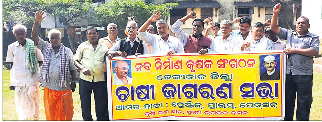
ଦେଶାନ୍ତରରେ ନବନିର୍ମାଣ କୃଷକ ସଂଗଠନ ପକ୍ଷରୁ ବନ୍ଦ ପାଳିତ।

ପ୍ରାଣସ୍ୱ, ପ୍ରେଷ୍ଟିକ୍ ଏବଂ ପେନ୍‌ସନ ଦାବିରେ ନବନିର୍ମାଣ କୃଷକ ସଙ୍ଗଠନ ପକ୍ଷରୁ ଦିଆଯାଇଥିବା ବନ୍ଦ ତାକରା ପ୍ରଭାବ ପଡ଼ିଛି ଦେଶାନ୍ତର ଜିଲ୍ଲାରେ।