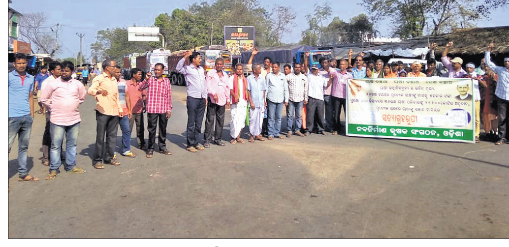
ବନ୍ତଳାଠାରେ ସଙ୍ଗଠନ ପକ୍ଷରୁ ରାସ୍ତାରେକୋ କରାଯାଇଛି।