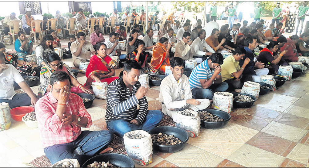
ଅଭିଷେକ କାର୍ଯ୍ୟରେ ଅଂଶଗ୍ରହଣ କରିଥିବା ଶ୍ରଦ୍ଧାଳୁମାନେ।

ଦେଶାନ୍ତର ଅଫିସ, ୨୧୧୨: ଦେଶାନ୍ତର ଜିଲ୍ଲା କପିଳାସ ନିକଟ ଶ୍ରୀବତ୍ସାପୁରୀ ସାଲ ଶ୍ରୀଗୁମରେ ଚାଲିଥିବା ସର୍ବଭାରତୀୟ ସାଲଭେଜ୍ ସମ୍ମିଳନୀର ତୃତୀୟ ଦିବସ।