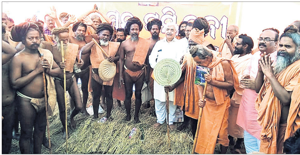
ଧର୍ମସଭାରେ ଏକାଠି ହୋଇଥିବା ସାଧୁସଛମାନେ।

ମହିମା ଧର୍ମ ବିଶ୍ୱର ଅନ୍ୟତମ ଶ୍ରେଷ୍ଠ ଧର୍ମ। 'ଜୀବେ ଦୟା' ଏହାର ମୂଳମନ୍ତ୍ର। ଜୀବନକାଳେ ମଙ୍ଗଳ କାମନା କରିବା ଏହି ଧର୍ମ ଶିକ୍ଷା ଦିଏ।