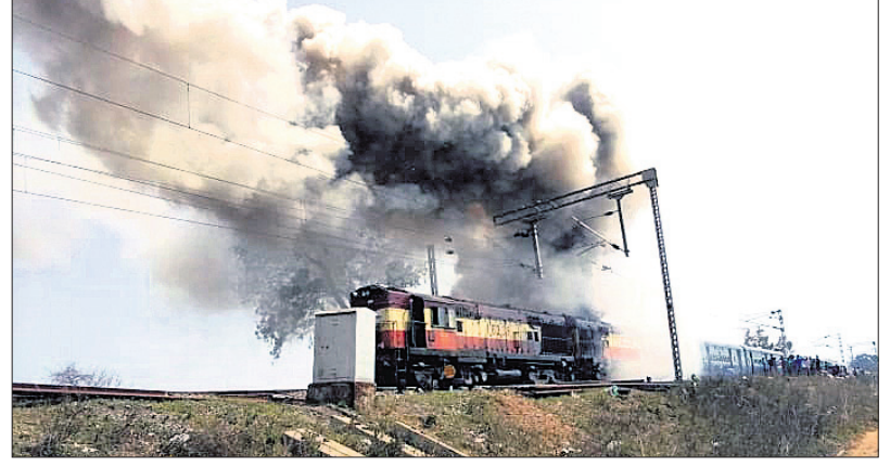
ତ୍ରେନ ଇଞ୍ଜିନରୁ ବାହାରୁଥିବା ଧୂଆଁ। ଲାଠୋର, ୨୧.୧୨ (ବି.ଏନ.ଏ.) ବଲାଙ୍ଗୀର ଜିଲ୍ଲା ହରିଶଙ୍କର ରୋଡ଼ ରେଳଷ୍ଟେଶନ ନିକଟ ସିଗ୍ନାଲ ପାଖରେ ଗୁରୁବାର ଏକ ଏକପ୍ରେସ୍ ତ୍ରେନ ଇଞ୍ଜିନରୁ ପ୍ରବଳ ଧୂଆଁ ବାହାରୁ ଥିବା ଦେଖିବାକୁ ମିଳିଥିଲା। ଫଳରେ ଯାତ୍ରୀମାନେ ଭୟଭୀତ ହୋଇ ତ୍ରେନରୁ ଓହ୍ଲାଇ ପଡ଼ିଥିଲେ। ସୂଚନା ଅନୁଯାୟୀ ସାପ୍ତାହିକ ତ୍ରେନ ନଂ. ୧୮୫୭୪ ବିଶାଖାପାଟଣା-ଭରତ କା କୋଟି ଏକପ୍ରେସ୍ ଗୁରୁବାର ମଧ୍ୟାହ୍ନ ୧୨.୩୦ରେ ବିଶାଖାପାଟଣା ଯାଉଥିବା ବେଳେ ହରିଶଙ୍କର ରୋଡ଼ ଷ୍ଟେଶନ ନିକଟରେ ହଠାତ୍ ଇଞ୍ଜିନରୁ ଧୂଆଁ ବାହାରିବା ସହ ତେଲ ନିର୍ଗତ ହୋଇଥିଲା। ଏହାଦେଖି ଚାଳକ ତ୍ରେନକୁ ଅଟକାଇ ଦେଇଥିଲେ। ଯାତ୍ରୀମାନେ ବି ଭୟଭୀତ ହୋଇ ତ୍ରେନରୁ ଓହ୍ଲାଇ ଦୂରସ୍ଥାନକୁ ଚାଲି ଯାଇଥିଲେ। ପରେ ଧୂଆଁ କମିଯିବା ପରେ ତ୍ରେନଟି ଗତବ୍ୟ ସ୍ଥଳକୁ ଯାଇଥିଲା।