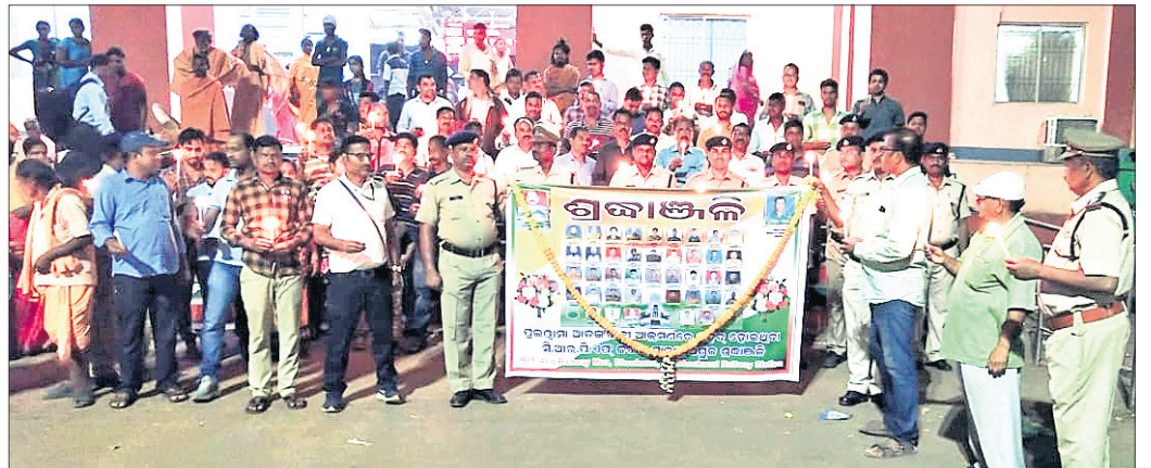
ଦେଶାନ୍ତର ରେଳଓ୍ୱେପକ୍ଷରୁ ଶହାଦ ଯବାନଙ୍କୁ ଶ୍ରଦ୍ଧାଞ୍ଜଳି ଛାପନ କରାଯାଇଛି।

ଦେଶାନ୍ତର ଅଫିସ, ୨୧୧୨: ପୁଲ୍ଲଖୀମାନେ ଆଡ଼କବାଦୀଙ୍କ ଆତ୍ମତ୍ୟାଗୀ ଆକ୍ରମଣରେ ଶହାଦ ଯବାନଙ୍କୁ ଯବାନଙ୍କୁ ରୁଧିବାର