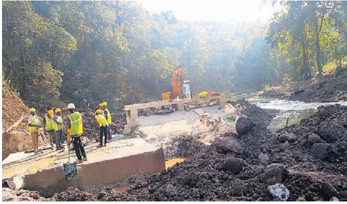
ଯୋଡ଼ା ସୁନା ନଦୀରେ କମ୍ପାନୀ ବନ୍ଧ ଭଙ୍ଗାଯାଇଛି।

ନଦୀରେ ଜଳସଂଚୟ ହୁଏ ହେବା ସହିତ ସୁନା ନଦୀରୁ ଭୂମି ଗୋଲିଆ-କୁମୁଦୁପାଣି, ଏହାକୁ ବୃତ୍ତ ବିରୋଧ କରାଯାଇଥିଲା। ଯୋଡ଼ା ବ୍ଲକ୍ ଓ ସହରର ଜୀବନରେଖା କୁହାଯାଉଥିବା ସୁନା ନଦୀରେ ଇନ୍ଦ୍ରାଜିତ ଫେଲ୍ଡ୍ ବନ୍ଧ ନିର୍ମାଣ କରି ଏହାର ଜଳକୁ ନିଜ ଖଣି ଓ ଶିଳ୍ପ କାର୍ଯ୍ୟରେ ଲାଗାଇବାକୁ ଚାହାନ୍ତି କମ୍ପାନୀର ଉଦ୍ଦେଶ୍ୟ ରଖିଥିଲା। ମାତ୍ର ବନ୍ଧ ନିର୍ମାଣ ହେଲେ ତିନିସପ୍ତାହୀ ସୁନା ନଦୀରେ ଜଳସଂଚୟ ହୁଏ ହେବା ସହିତ ସୁନା ନଦୀରୁ ଭୂମି ଗୋଲିଆ-କୁମୁଦୁପାଣି, ଏହାକୁ ବୃତ୍ତ ବିରୋଧ କରାଯାଇଥିଲା। ଯୋଡ଼ା ବ୍ଲକ୍ ଓ ସହରର ଜୀବନରେଖା କୁହାଯାଉଥିବା ସୁନା ନଦୀରେ ଇନ୍ଦ୍ରାଜିତ ଫେଲ୍ଡ୍ ବନ୍ଧ ନିର୍ମାଣ କରି ଏହାର ଜଳକୁ ନିଜ ଖଣି ଓ ଶିଳ୍ପ କାର୍ଯ୍ୟରେ ଲାଗାଇବାକୁ ଚାହାନ୍ତି କମ୍ପାନୀର ଉଦ୍ଦେଶ୍ୟ ରଖିଥିଲା। ମାତ୍ର ବନ୍ଧ ନିର୍ମାଣ ହେଲେ ତିନିସପ୍ତାହୀ ସୁନା ନଦୀରେ ଜଳସଂଚୟ ହୁଏ ହେବା ସହିତ ସୁନା ନଦୀରୁ ଭୂମି ଗୋଲିଆ-କୁମୁଦୁପାଣି, ଏହାକୁ ବୃତ୍ତ ବିରୋଧ କରାଯାଇଥିଲା।