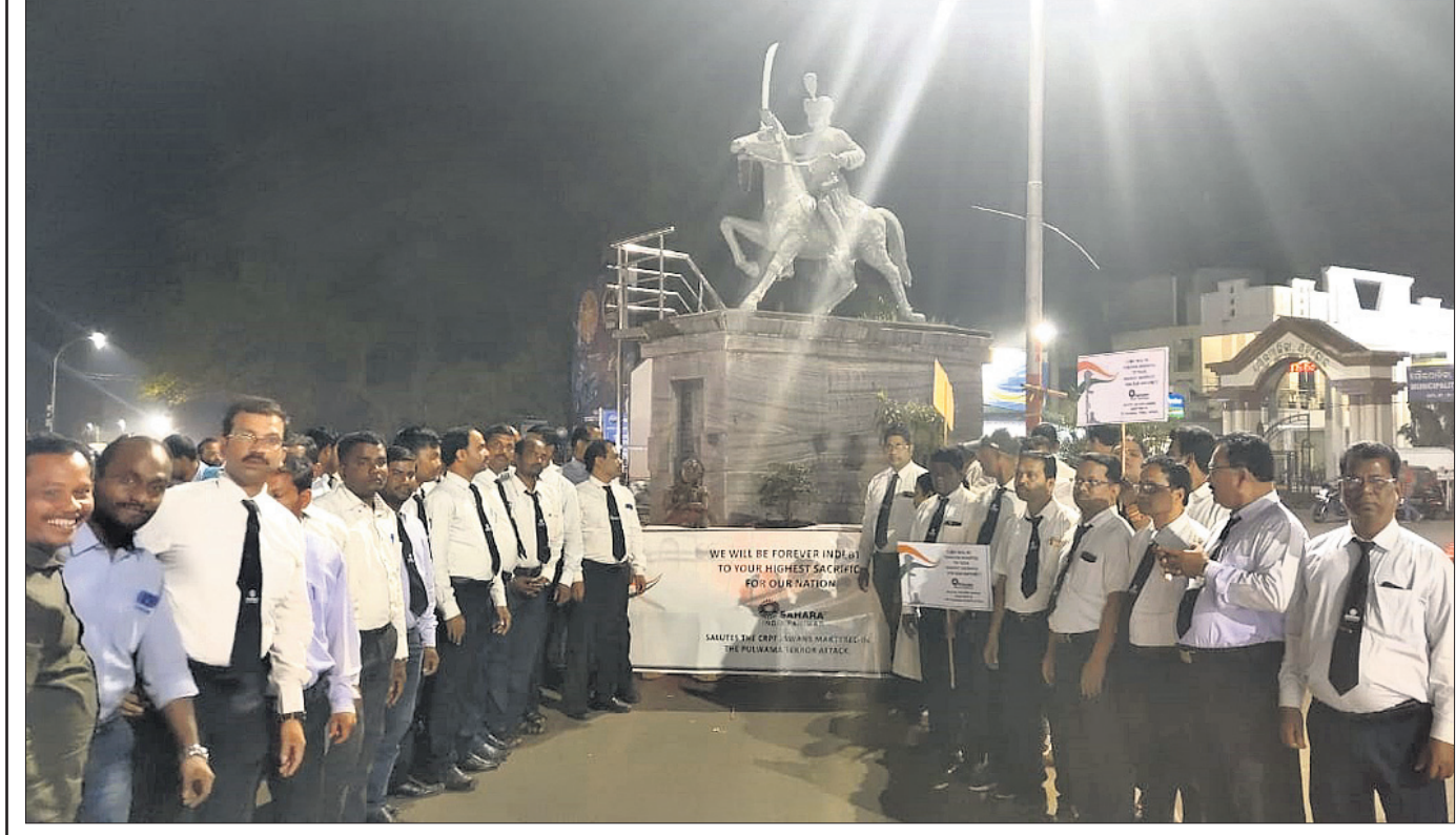
ଅନୁଗୋଳଠାରେ ସାହାରା ଇଣ୍ଡିଆ ପରିବାର ପକ୍ଷରୁ ପୁଲଫୁଲ ଶହାଦତ୍ତ ଶ୍ରଦ୍ଧାଞ୍ଜଳି ଦିଆଯାଇଛି।