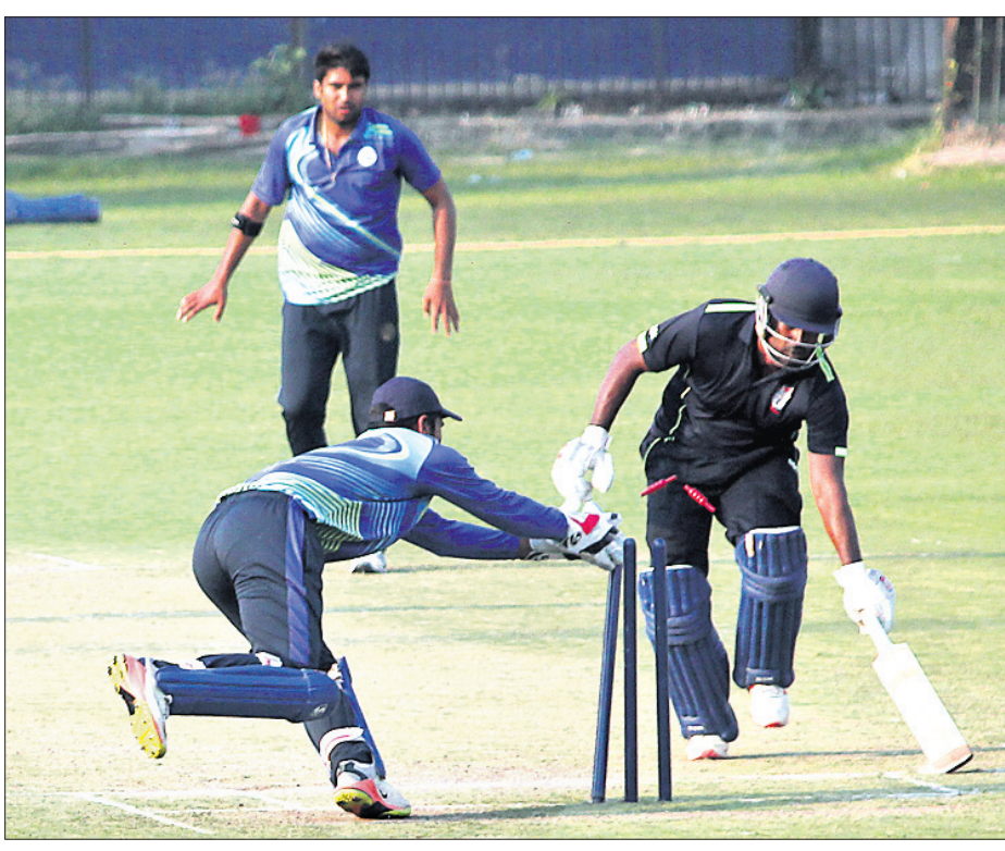
ଓଡ଼ିଶା ଓ ହରିୟାଣା ମ୍ୟାଚରେ ଅନୁଷ୍ଠିତ ମ୍ୟାଚ ।

କଟକ ଅଫିସ୍, ୨୨୧୨ ଭାରତୀୟ କ୍ରିକେଟ୍ କଣ୍ଠେଇ ବୋର୍ଡ (ବିସିଆଇ) ଆନୁକୁଲ୍ୟରେ କଟକରେ ଚାଲିଥିବା ଯଯଦ ପୁସ୍ତକ ଅକ୍ସିଡିଟିଂ ୨୦ ଟୁର୍ନାମେଣ୍ଟ ଗ୍ରୁପ୍-ଡିର ଲିଗ ପର୍ଯ୍ୟାୟ ମ୍ୟାଚରେ ଓଡ଼ିଶା ଲଗାତାର ଦ୍ୱିତୀୟ ପରାଜୟ ବରଣ କରିଛି ।