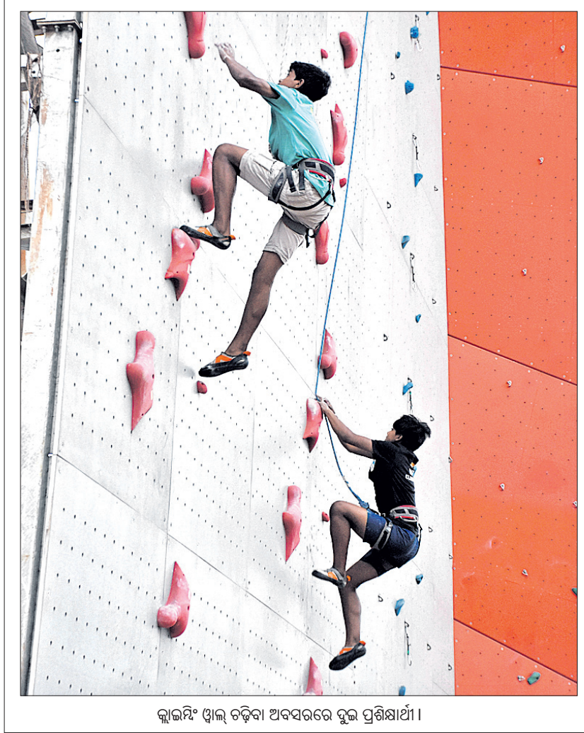
କ୍ଲାଉଡିଂ ପ୍ଲାନ ଚଢ଼ିବା ଅବସରରେ ଦୁଇ ପୁଣ୍ୟମନ୍ତ୍ରୀ ।

ସଂକ୍ଷିପ୍ତ ସ୍ଵୋର ଇଲ୍‌ଏଜ୍ ମହିଳା ଦଳ: ୪୩.୩ ଓଭରରେ ୧୬୧/ଅଲଆଉଟ୍ (ସ୍କୋର-୮୫; ଝୁଲଣ ଗୋସ୍ୱାମୀ-୪୮/୩୦, ଶିଖା ପାଣ୍ଡେ-୪୧/୧୮)।