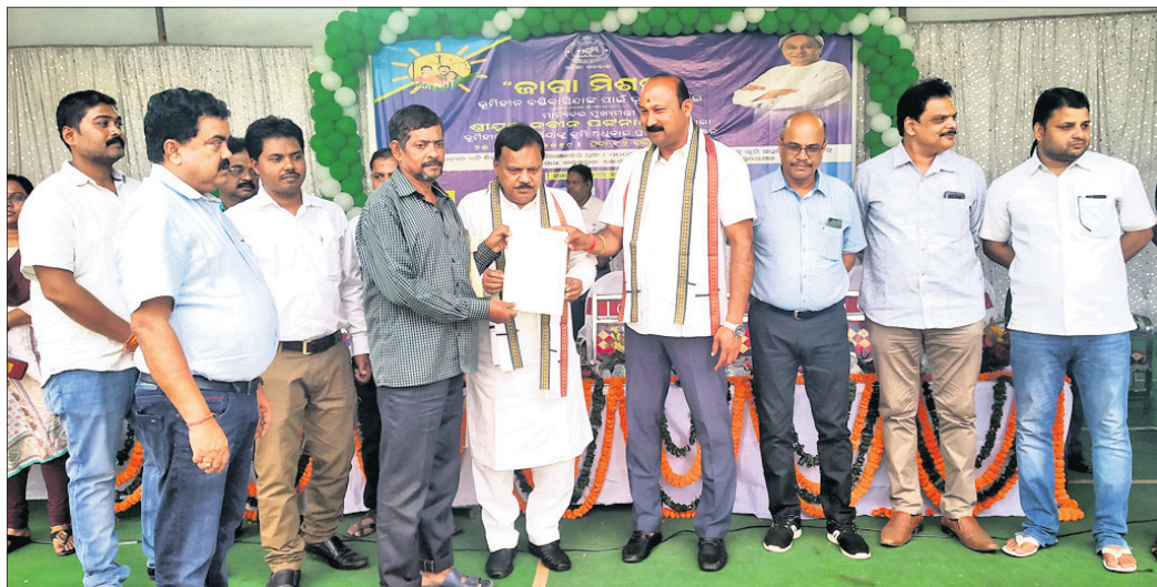
ବିଧାୟକ ହିତାଧିକାରୀଙ୍କୁ ପତ୍ର ଦିଆଯାଇଛି।