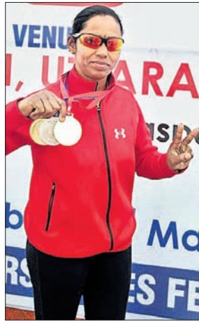
ପଦକ ସହ ପାର୍ଟୀ ସେଠା

ନ୍ୟାଶନାଲ ମାଷ୍ଟର ଗେମ୍ ପାର୍ଟୀକୁ ୨ ସ୍ୱର୍ଣ୍ଣ, ୧ ରୌପ୍ୟ