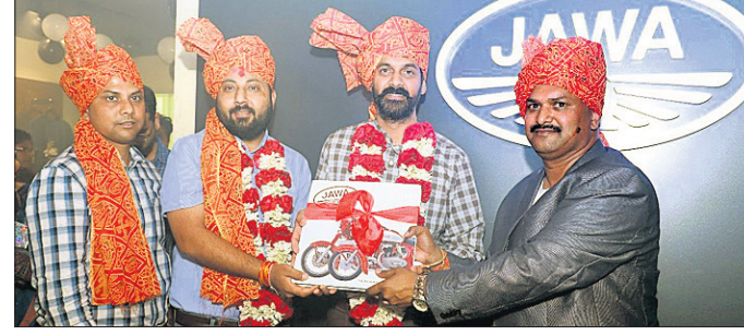
ଭୁବନେଶ୍ୱର, ୨୭-୨ (ବ୍ୟବସାୟ) ଡିଲିଭେରୀ ସମୟରେ କ୍ୱାସିକ ଲିଜେଣ୍ଡ ଜାତୀୟ ଟିମ୍ମର ସଭ୍ୟମାନଙ୍କର ସମାବେଶ