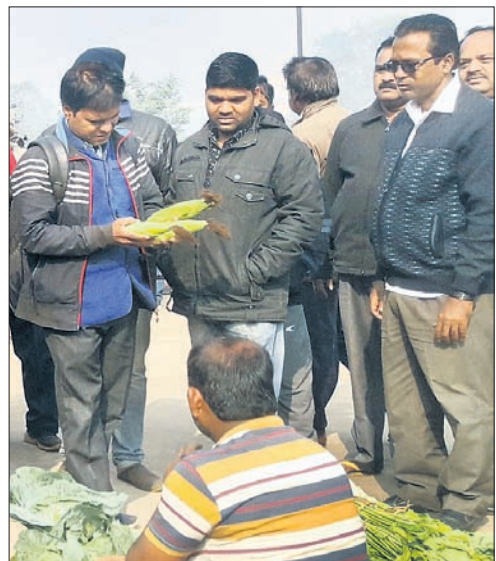
ସାପ୍ତାହିକ ହାଟରେ ବ୍ୟବସାୟୀ।