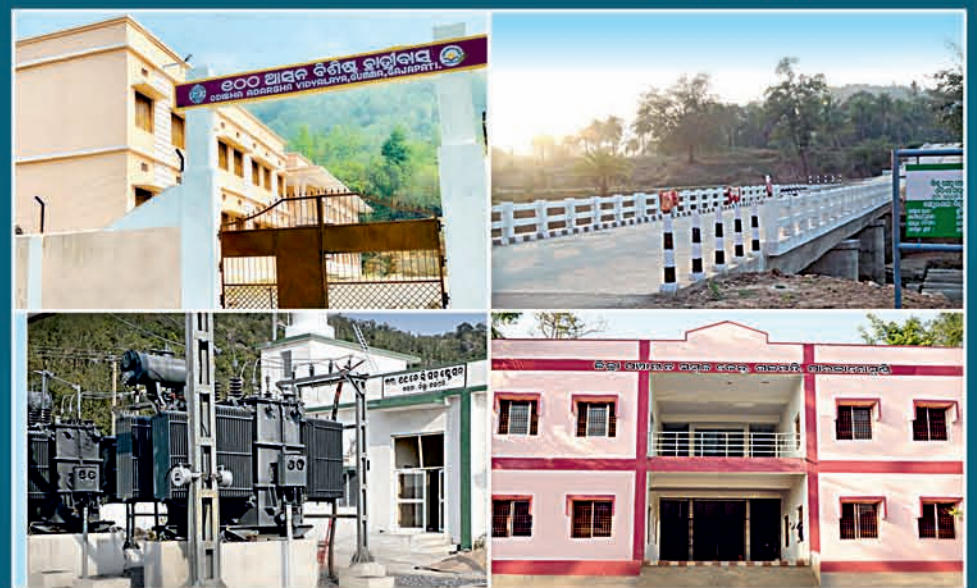
ଉଚ୍ଚ କାର୍ଯ୍ୟକ୍ରମରେ ବହୁ ସଂଖ୍ୟାରେ ଯୋଗଦେବା ପାଇଁ ବିନମ୍ର ଅନୁରୋଧ

କାଶୀନଗର ଓ ଗୁମ୍ମା ବୁକ୍ସ ୧୦୩ଟି ଗ୍ରାମ ପାଇଁ ୧୯୦ କୋଟି ଟଙ୍କାର, ମୋହନା ବୁକ୍ସ ପାଇଁ ୨୧୪ କୋଟିରୁ ଉର୍ଦ୍ଧ୍ୱ ଟଙ୍କାର ମେଗା ପାଇପ୍ ଜଳ ଯୋଗାଣ ପ୍ରକଳ୍ପ ଏବଂ ମହେନ୍ଦ୍ରନୟା ଜଳସେଚନ ପ୍ରକଳ୍ପ ସହିତ ପାରଳାଖେମୁଣ୍ଡି, ଗୋଷାଣୀ, ଗୁମ୍ମା, କାଶୀନଗର ବୁକ୍ସ ଓ ଏନ୍.ଏ.ସି ଅଞ୍ଚଳ, ମୋହନା, ନୂଆଗଡ଼, ରାୟଗଡ଼ ଏବଂ ଆର୍.ଉଦୟଗିରି ବୁକ୍ସ ଅଞ୍ଚଳରେ ସମୁଦାୟ ୫୮୨ କୋଟି ୪୦ ଲକ୍ଷ ଟଙ୍କାର ୭୮୩ଟି ଜନ କଲ୍ୟାଣକାରୀ ପ୍ରକଳ୍ପର ଭିତ୍ତିପ୍ରସ୍ତର ସ୍ଥାପନ