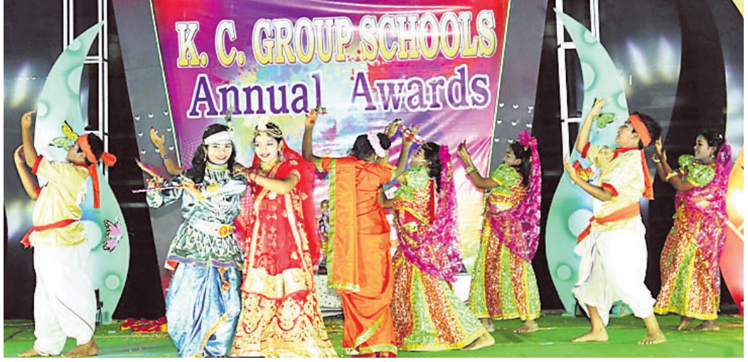
ଛାତ୍ରାଛାତ୍ରୀମାନେ ସାଂସ୍କୃତିକ କାର୍ଯ୍ୟକ୍ରମ ପରିବେଷଣ କରୁଛନ୍ତି ।