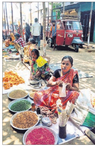
ଯାତ୍ରାସ୍ଥଳରେ ଶୋଭାଯାତ୍ରା ବଣା ବେପାରୀଙ୍କ ପକ୍ଷରା ।