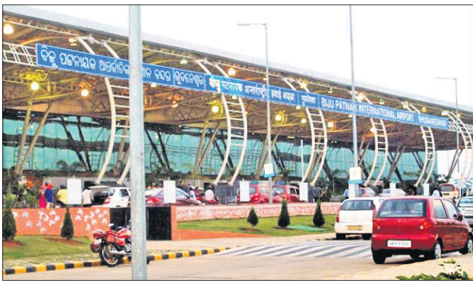
ଭୁବନେଶ୍ୱର ବିମାନବନ୍ଦରରେ ନୂତନ ପାର୍କିଂ ପଲିସି ଲାଗୁ ହେଲା

ବସିଥିବାର ଦେଖିବାକୁ ମିଳୁଛି। ଏଭଳିସ୍ଥିତି ଲାଗି ରହିଲେ ବିଜେଡି ଭୋଟ ମଧ୍ୟ ଭାଗ ହେବାର ସମ୍ଭାବନା ଅଧିକ ରହିଛି।