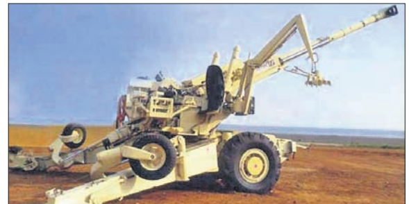
ଧନୁ ପ୍ରକାର ଜଳବାୟୁରେ ଏହାକୁ ବ୍ୟବହାର କରାଯାଇପାରିବ।

କଟକପୁର, ୮୪ (ପି.ଟି.)-ସୁଦେଶୀ ଜ୍ଞାନକୌଶଳରେ ନିର୍ମିତ ଓଡ଼ିଆ ଧନୁଷ୍ କମାଣ୍ଡ ସୈନ୍ୟବାହିନୀରେ ସୋମବାର ସାମିଲ ହୋଇଛି।