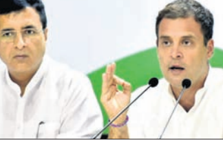
ରାହୁଲ ଗାନ୍ଧୀ ଓ ରାହୁଲ ଗାନ୍ଧୀ।