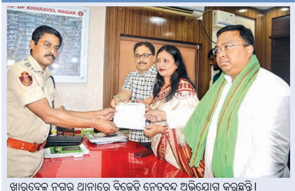
ଖାରବେଳ ନଗର ଥାନାରେ ବିଜେଡି କେଡ଼ୁବୁଦ୍ ଅଭିଯୋଗ କରୁଛନ୍ତି