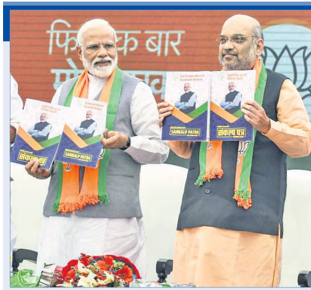
ପ୍ରଧାନମନ୍ତ୍ରୀ ନରେନ୍ଦ୍ର ମୋଦିଙ୍କ ସହ ଭାଜପା ରାଷ୍ଟ୍ରୀୟ ଅଧ୍ୟକ୍ଷ ଅମିତ ଶାହ।

୨୦୧୯ ସାଧାରଣ ନିର୍ବାଚନ ପାଇଁ ସବୁ ରାଜନୈତିକ ଦଳ ପକ୍ଷରୁ ମତବାତାକୁ ଆକର୍ଷିତ କରିବା ପାଇଁ ଯଥାସାଧ୍ୟ ଉଦ୍ୟମ କରାଯାଉଛି। ପ୍ରଥମ ପର୍ଯ୍ୟାୟ ଭୋଟଗ୍ରହଣକୁ ୩ ଦିନ ବାକି ଥିବାବେଳେ ସୋମବାର ଭାରତୀୟ ଜନତା ପାର୍ଟି (ଭାଜପା) ଏହାର ବହୁପ୍ରତୀକ୍ଷିତ ଇସ୍ତାହାର ଛାଡି କରୁଛି। ଏଥିରେ ଅଯୋଧ୍ୟାରେ ରାମମନ୍ଦିର ନିର୍ମାଣ, ଜମ୍ମୁ-କଶ୍ମୀରରେ ସମିଧାନର ଅନୁଚ୍ଛେଦ ୩୭୦ ଉଚ୍ଛେଦ ଓ ସମାନ ନାଗରିକ ସଂହିତା ଲାଗୁ କରିବା ଭଳି ଦକ୍ଷିଣ ୭୫ଟି ମୌଳିକ ବିଚାରଧାରା ସ୍ଥାନ ପାଇଛି। ସେହିପରି କ୍ଷୁଦ୍ର ଓ ନାମମାତ୍ର ଚାଷୀ ଏବଂ ଛୋଟ ବ୍ୟବସାୟୀଙ୍କୁ ମଧ୍ୟ ପ୍ରଲୋଭିତ କରିବା ପାଇଁ ଏଥିରେ ଉଦ୍ୟମ କରାଯାଇଛି। ଭାଜପା ଇସ୍ତାହାର କମିଟି ମୁଖ୍ୟ ତଥା ସ୍ୱରାଷ୍ଟ୍ରମନ୍ତ୍ରୀ ରାଜନାଥ ସିଂହ ତତ୍ତ୍ୱାବଧାନରେ ପ୍ରସ୍ତୁତ ୪୫ ପୃଷ୍ଠା ସମ୍ବଳିତ ଏହି ଘୋଷଣାପତ୍ରର ନାମ ରଖାଯାଇଛି ସଂକଳ୍ପପତ୍ର। ୨୦୧୪ ସୁଦ୍ଧା ଭାରତକୁ ଏକ ବିକଶିତ ରାଷ୍ଟ୍ରରେ ପରିଣତ କରିବା ଲକ୍ଷ୍ୟ ନେଇ ଭାଜପା ଏହାର ଇସ୍ତାହାରରେ ଗୁରୁତ୍ୱ ଦେଇଛି ବୋଲି ପ୍ରଧାନମନ୍ତ୍ରୀ ନରେନ୍ଦ୍ର ମୋଦି କହିଛନ୍ତି। ଅନ୍ୟପକ୍ଷରେ ଏହା ୨୦୧୪ ସାଧାରଣ ନିର୍ବାଚନ ବେଳେ ଛାଡି କରାଯାଇଥିବା ଘୋଷଣାପତ୍ରର ନକଲ ଏବଂ ଏଥିରେ କିଛି ନୂତନତ୍ୱ ନାହିଁ