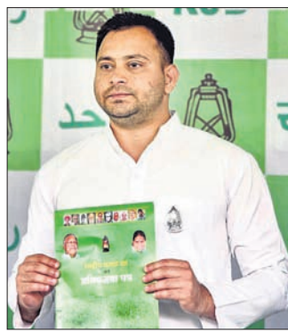
ଦିଆଯିବା ଉଚିତ୍ତ ବୋଲି ଆରଜେଡି ନେତା ତେଜସ୍ୱୀ ସାହୁ କହିଛନ୍ତି।

ଆରଜେଡି ପକ୍ଷରୁ ସୋମବାର ନିର୍ବାଚନ ଲଢ଼ାଉଥିବା 'ପ୍ରତିବନ୍ଧିତାପତ୍ର' ଜାରି କରାଯାଇଛି। ଉଚ୍ଚଶିକ୍ଷା, ନ୍ୟାୟପାଳିକା ଓ ଘରୋଇ ଖେତ୍ରରେ ଏସ୍.ଏସ୍.ଏସ୍. ଉପରେ ଏହା ଉପରେ ଆଧାର ଦେବା ପାଇଁ ଏଥିରେ ଘୋଷଣା କରାଯାଇଛି।