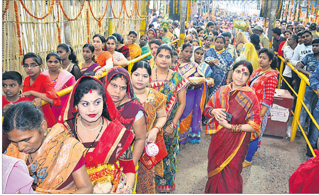
ଅସଂଖ୍ୟ ପାଠରେ ପୂଜା ପାଇଥିବା ମା' ବୁଢ଼ୀଠାକୁରାଣୀଙ୍କ ଘଟ ଦର୍ଶନ ପାଇଁ ଲମ୍ବାଧାଡ଼ି ।

ବ୍ରହ୍ମପୁର ପ୍ରସିଦ୍ଧ ମା' ବୁଢ଼ୀଠାକୁରାଣୀ ଯାତ୍ରା ଅବଧି କମୁଥିବା ବେଳେ ମା'ଙ୍କ ଦର୍ଶନ ପାଇଁ ଏବେ ଅସଂଖ୍ୟ ମଞ୍ଜୁପୁର ଶ୍ରଦ୍ଧାଳୁ ଓ ମାନସିକଧାରୀଙ୍କ ଭିଡ଼ ବଢ଼ିବାରେ ଲାଗିଛି । ଭିଡ଼କୁ ଦୃଷ୍ଟିରେ ରଖି ବ୍ରହ୍ମପୁର, ଆସିଲୁ ଏବେ ବିଭିନ୍ନ ଉଦ୍ୟୋଗସାଧକୀଙ୍କ ପୁଅ ଛୁଟୁଛି । ଅସଂଖ୍ୟ ପାଠରେ ହସ୍ତମାନ, କୃଷି, ବଳରାମ ଭଳି ବିଭିନ୍ନ ମାନସିକ ବେଶଧାରୀଙ୍କ ସଂଖ୍ୟା ବଢ଼ୁଛି ।