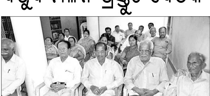
ବିଷୁବ ମିଳନ ପ୍ରସ୍ତୁତି ବୈଠକରେ ଯୋଗଦେଇଥିବା ଅତିଥି ଓ ଅନ୍ୟମାନେ।