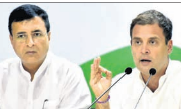
ରଣଦୀପ୍ ସୁଜେଣ୍ଡାଲୀ ଓ ରାହୁଲ ଗାନ୍ଧୀ