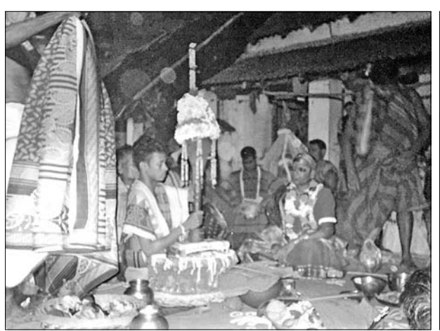
ବାଙ୍କୀ: ମାଟିଛଡ଼ି ଘଟଣାପ୍ରା ପାଇଁ ପୂର୍ବକାର୍ଯ୍ୟ କରାଯାଇଛି।