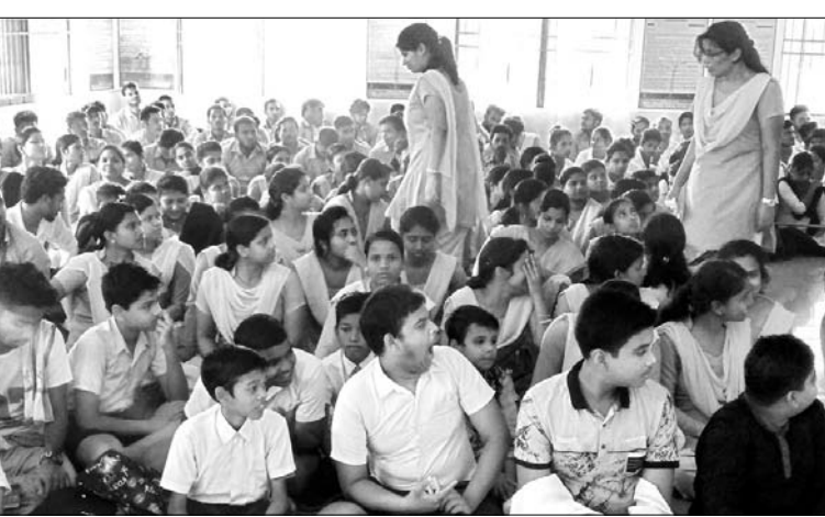
ନରସିଂହପୁର ଯୁବ ପରିଷଦ ପକ୍ଷରୁ ଆୟୋଜିତ ବିଭିନ୍ନ ପ୍ରତିଯୋଗିତାରେ ଭାଗ ନେଇଥିବା ଛାତ୍ରଛାତ୍ରୀ।