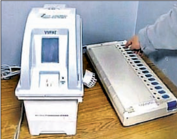
ନିର୍ଦ୍ଦେଶ କାର୍ଯ୍ୟକାରୀ କରିବାକୁ ସମସ୍ତ ଭବିଷ୍ୟ କରିବାକୁ ନିର୍ଦ୍ଦେଶ ଦେଇଛନ୍ତି।

ବର୍ତ୍ତମାନର ବ୍ୟବସ୍ଥା ଅନୁଯାୟୀ ପ୍ରତି ବିଧାନସଭା ନିର୍ବାଚନମଣ୍ଡଳରେ ଗୋଟିଏ ବୁଧୁର ଭିଜିପିଏଟି ସ୍ୱିପ୍‌କ୍ସ ଛାଡ଼ିବା ଫଳାଫଳ ସହ ଯାଞ୍ଚ କରାଯାଉଛି। ଆନ୍ଧ୍ରପ୍ରଦେଶ ପୁଣ୍ୟମନ୍ତ୍ରୀ ଏନ୍‌. ଚନ୍ଦ୍ରାବାବୁ ନାଲୁଙ୍କ ନେତୃତ୍ୱରେ ୨୧ ବିରୋଧୀ ଦଳର ନେତା ଅନୁ୍ୟନ ୫୦ ପ୍ରତିଶତ ଭିଜିପିଏଟି ଯାଞ୍ଚ ଲାଗି ନିର୍ଦ୍ଦେଶ ଦେବାକୁ ଆଦେଶ ଦେଇଥିଲେ। ତେବେ ବର୍ତ୍ତମାନ ପରିସ୍ଥିତିରେ ଗାହା ସମ୍ଭବ ନୁହେଁ ଏବଂ ଏଥିପାଇଁ ନିର୍ବାଚନ ଫଳାଫଳ ପ୍ରକାଶରେ ପାଖାପାଖି ୬ ଦିନ ବିଳମ୍ବ ହେବ ବୋଲି ଭବିଷ୍ୟବାନୀ କରିବାକୁ ସମସ୍ତ ଭବିଷ୍ୟ କରିବାକୁ ନିର୍ଦ୍ଦେଶ ଦେଇଛନ୍ତି।