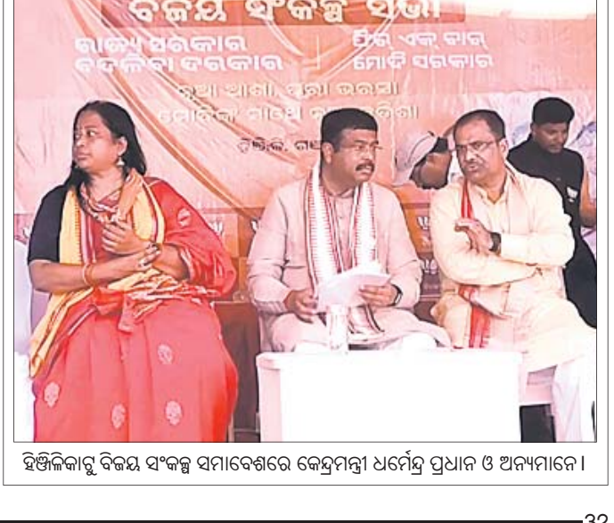
ହରିଜିନୀକୁ ବିଜୟ ସଂକଳ୍ପ ସମାବେଶରେ କେନ୍ଦ୍ରମନ୍ତ୍ରୀ ପ୍ରଧାନ ଧର୍ମେନ୍ଦ୍ର ପ୍ରଧାନ ଓ ଅନ୍ୟମାନେ।