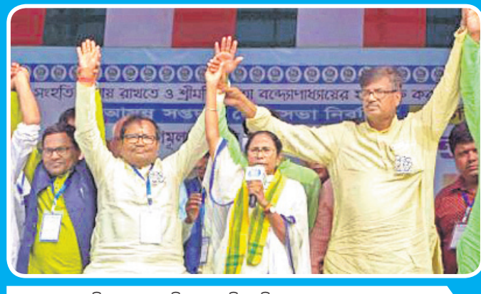
ପଶ୍ଚିମବଙ୍ଗର କୁର୍ଦ୍ଦିହାରରେ ବିଧାନସଭା ସଭାରେ ପୁଣ୍ୟମନ୍ତ୍ରୀ ମମତା ବାନାର୍ଜୀ ଓ ନେତୃତ୍ୱ।

ମୁମ୍ବାଇ, ୮୪ (ପି.ଟି.)-ମହାରାଷ୍ଟ୍ରରେ ବୃତ୍ତୀ ପର୍ଯ୍ୟାୟ ଲୋକ ସଭା ନିର୍ବାଚନ ଲାଗି ମୁମ୍ବାଇ କଂଗ୍ରେସ ସଭାପତି ମିଲିକ ଦେଓରା, ଦଳୀୟ ପ୍ରାର୍ଥୀ ଉର୍ଦ୍ଧ୍ୱାଧିକ, ପ୍ରିୟା ଦତ୍ତ, ଶିବସେନା ପ୍ରାର୍ଥୀ ଅରବିନ୍ଦ ସାହୁଙ୍କ ପ୍ରମୁଖ ଯୋଗଦାନ ନାମାଙ୍କନପତ୍ର ଦାଖଲ କରିଛନ୍ତି। ଉର୍ଦ୍ଧ୍ୱାଧିକ ଏକ ମୋଟରଯାନକେଲରେ ଯାଇ ନାମାଙ୍କନପତ୍ର ଦାଖଲ କରିଥିଲେ। ଉତ୍ତର ମୁମ୍ବାଇରେ ସେ ଭାଇପାର ଗୋପାଳ ସେଠାକ ବିରୋଧରେ ପ୍ରାର୍ଥୀ ହୋଇଛନ୍ତି। ସେହିପରି ମୁମ୍ବାଇ ଉତ୍ତର-କେନ୍ଦ୍ରୀୟ ଆସନରେ ଭାଇପାର ପୁନଃ ମହାଜନଙ୍କ ବିରୋଧରେ କଂଗ୍ରେସରୁ ପ୍ରାର୍ଥୀ ହୋଇଥିବା ପ୍ରିୟା ଦତ୍ତ ତାଙ୍କ ଭାଇ ତଥା ବଲିଉଡ୍ ଅଭିନେତା ସଞ୍ଜୟ ଦତ୍ତଙ୍କ ସହ ଯାଇ ନାମାଙ୍କନପତ୍ର ଦାଖଲ କରିଥିଲେ। ମୁମ୍ବାଇ କଂଗ୍ରେସର ପୂର୍ବତନ ସଭାପତି ତଥା ମୁମ୍ବାଇ ଉତ୍ତରପଶ୍ଚିମ ଆସନରୁ ପ୍ରାର୍ଥୀ ହୋଇଥିବା ସଞ୍ଜୟ ନିରୁପମ ନାମାଙ୍କନ ପତ୍ର ଦାଖଲ କରିଛନ୍ତି। ତାଙ୍କ ବିରୋଧରେ ଶିବସେନାରୁ ଲଢ଼ୁଛନ୍ତି ଗଜାନନ କାର୍ଡିକାର। ମୁମ୍ବାଇର ଦକ୍ଷିଣ ଆସନରୁ ପ୍ରାର୍ଥୀ ହୋଇଥିବା କଂଗ୍ରେସ ପ୍ରାର୍ଥୀ ଦେଓରା ଓ ଶିବସେନାର ସାଂସଦ ସୋମନାଥ ସୋମନାଥ ପ୍ରାର୍ଥୀପତ୍ର ଦାଖଲ କରିଛନ୍ତି।