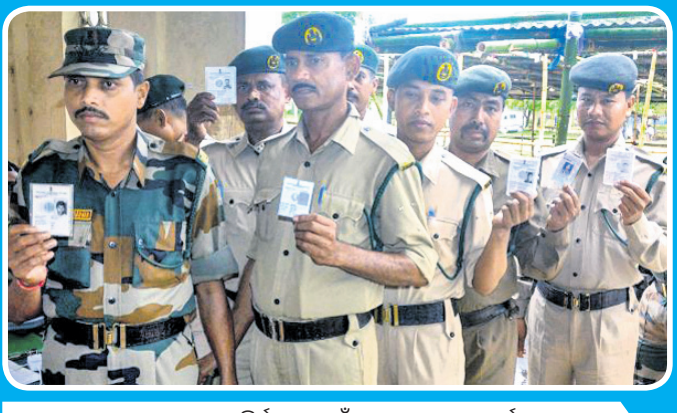
ଅଗରତାଲାରେ ଲୋକ ସଭା ନିର୍ବାଚନ ପାଇଁ ମୁଦ୍ରଣ ପୁରଣ କର୍ମୀ ପୋଷ୍ଟାଲ ଭୋଟ ଦେବା ପୂର୍ବରୁ ସେମାନଙ୍କ ଭୋଟର ପରିଚୟପତ୍ର ଦେଖାଉଛନ୍ତି।