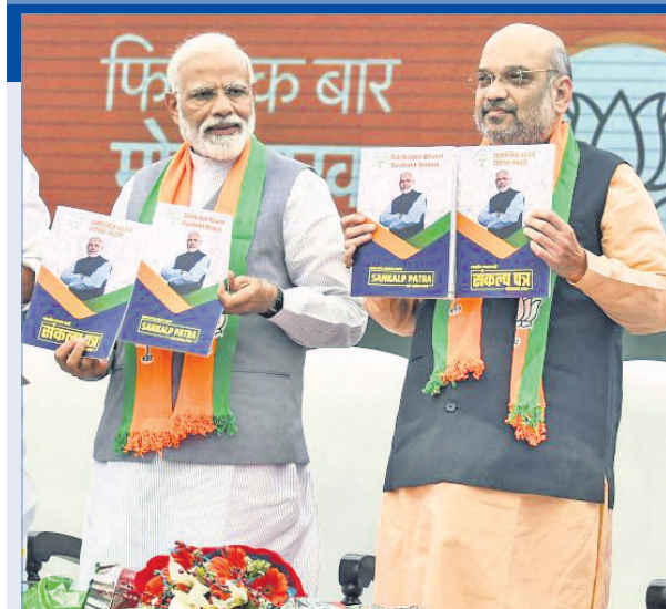
ପ୍ରଧାନମନ୍ତ୍ରୀ ନରେନ୍ଦ୍ର ମୋଦିଙ୍କ ସହ ଭାଜପା ରାଷ୍ଟ୍ରୀୟ ଅଧ୍ୟକ୍ଷ ଅମିତ ଶାହ।

୨୦୧୯ ସାଧାରଣ ନିର୍ବାଚନ ପାଇଁ ସବୁ ରାଜନୈତିକ ଦଳ ପକ୍ଷରୁ ମତଦାତାଙ୍କୁ ଆକର୍ଷିତ କରିବା ପାଇଁ ଯଥାସାଧ୍ୟ ଉଦ୍ୟମ କରାଯାଉଛି। ପ୍ରଥମ ପର୍ଯ୍ୟାୟ ଭୋଟଗ୍ରହଣକୁ ୩ ଦିନ ବାକି ଥିବାବେଳେ ସୋମବାର ଭାରତୀୟ ଜନତା ପାର୍ଟି (ଭାଜପା) ଏହାର ବହୁପ୍ରତୀକ୍ଷିତ ଇସ୍ତାହାର ଛାଡ଼ି ଦେଇଛି। ଏଥିରେ ଅଯୋଧ୍ୟାରେ ରାମମନ୍ଦିର ନିର୍ମାଣ, ଜମ୍ମୁ-କଶ୍ମୀରରେ ସମିଧାନର ଅନୁଚ୍ଛେଦ ୩୭୦ ଉଚ୍ଛେଦ ଓ ସମାନ ନାଗରିକ ସଂହିତା ଲାଗୁ କରିବା ଭଳି ଦକ୍ଷିଣ ୭୫ଟି ମୌଳିକ ବିଚାରଧାରା ସ୍ଥାନ ପାଇଛି। ସେହିପରି କ୍ଷୁଦ୍ର ଓ ନାମମାତ୍ର ଚାଷୀ ଏବଂ ଛୋଟ ବ୍ୟବସାୟୀଙ୍କୁ ମଧ୍ୟ ପ୍ରଲୋଭିତ କରିବା ପାଇଁ ଏଥିରେ ଉଦ୍ୟମ କରାଯାଇଛି। ଭାଜପା ଇସ୍ତାହାର କମିଟି ମୁଖ୍ୟ ତଥା ସ୍ୱରାଷ୍ଟ୍ରମନ୍ତ୍ରୀ ରାଜନାଥ ସିଂହ ଚଣ୍ଡାବଧାନରେ ପ୍ରସ୍ତୁତ ୪୫ ପୃଷ୍ଠା ସମ୍ବଳିତ ଏହି ଘୋଷଣାପତ୍ରର ନାମ ରଖାଯାଇଛି ସଂକଳ୍ପପତ୍ର। ୨୦୧୭ ସୁଦ୍ଧା ଭାରତକୁ ଏକ ବିକଶିତ ରାଷ୍ଟ୍ରରେ ପରିଣତ କରିବା ଲକ୍ଷ୍ୟ ନେଇ ଭାଜପା ଏହାର ଇସ୍ତାହାରରେ ଗୁରୁତ୍ୱ ଦେଇଛି ବୋଲି ପ୍ରଧାନମନ୍ତ୍ରୀ ନରେନ୍ଦ୍ର ମୋଦି କହିଛନ୍ତି। ଅନ୍ୟପକ୍ଷରେ ଏହା ୨୦୧୪ ସାଧାରଣ ନିର୍ବାଚନ ବେଳେ ଛାଡ଼ି କରାଯାଇଥିବା ଘୋଷଣାପତ୍ରର ନକଲ ଏବଂ ଏଥିରେ କିଛି ନୂତନତ୍ୱ ନାହିଁ