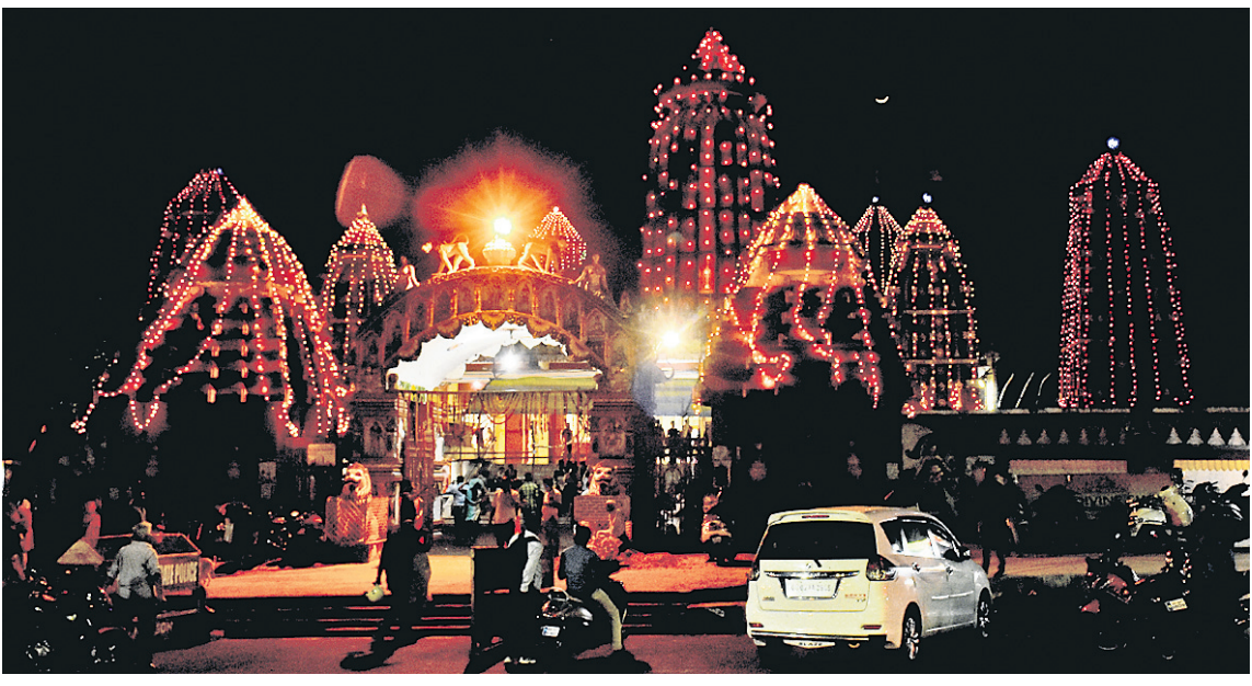
ଆସକ୍ଷା ୧୩ ତାରିଖ ରାମନବମୀ ଉପଲକ୍ଷେ ଭୁବନେଶ୍ୱରସ୍ଥିତ ରାମ ମନ୍ଦିରକୁ ଆଲୋକମାଳାରେ ସଜାଯାଇଛି।