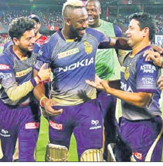
ଆନ୍ଦ୍ରେ ରସେଲ (ନେଟ୍) । ଦଳ ୫ଟି ଲେଖାଏ ମ୍ୟାଚ୍ ଖେଳି ୪ ବିଜୟ ହାସଲ କରିଛନ୍ତି । ଚେବେ ଚଳିତ ଆଇପିଏଲରେ ଦମ୍ଭାବ ଫର୍ମରେ ଥିବା ରସେଲଙ୍କୁ ରୋକିବା ଲକ୍ଷ୍ୟରେ ଆଗ୍ରହ ରଖିଛନ୍ତି । ଚେନାଇ ଦଳ ମଧ୍ୟରେ ଫରକ ଆସିବ । ଗତ କେତୋଟି ମ୍ୟାଚ୍ରେ ଅବିଶ୍ୱସନୀୟ ବ୍ୟାଟିଂ କରିଥିବା ରସେଲଙ୍କୁ ରୋକିବା ଲକ୍ଷ୍ୟରେ ଏହି ମ୍ୟାଚ୍ରେ ବେଶ୍ କଷ୍ଟସାଧ୍ୟ ହେବ । ପ୍ରତିଯୋଗିତାରେ ବର୍ତ୍ତମାନ ସୁଦ୍ଧା ଉଭୟ ପ୍ରଥମ କିଙ୍ଗ୍ସ ଓ ନାଇଟ୍ ରାଇଡର୍ସ

ଚେନାଇ, ୮୪(ପି.ଟି.): ଆଇପିଏଲ୍ ଦ୍ୱାଦଶ ସଂସ୍କରଣର ଏକ ମ୍ୟାଚ୍ରେ ମଙ୍ଗଳବାର ଦୁଇ ଶତାବ୍ଦୀ ଦଳ ଚେନାଇ ପ୍ରଥମ କିଙ୍ଗ୍ସ (ସିଏସି) ଓ କୋଲକାତା ନାଇଟ୍ ରାଇଡର୍ସ ପରସ୍ପରକୁ ଭେଟିବାକୁ ଯାଉଛନ୍ତି । ସ୍ଥାନୀୟ ଫର୍ମ୍-ଏ. ଚିତାଭିନୟ ଷ୍ଟୁଡିୟମରେ ଏହି ହାଇଭୋଲଟେଜ ମ୍ୟାଚ୍ ଖେଳାଯିବ । ଉଭୟ ଦଳରେ କିଛି ବିଶ୍ୱସ୍ତରୀୟ ଖିଳରୀ ରହିଥିବାରୁ ମ୍ୟାଚ୍ରେ ବେଶ୍ ରୋମାଞ୍ଚ ଦେଖିବାକୁ ମିଳିବ ବୋଲି କ୍ରିକେଟପ୍ରେମୀ ଆଶା ରଖିଛନ୍ତି । ଚେବେ ଚଳିତ ଆଇପିଏଲରେ ଦମ୍ଭାବ ଫର୍ମରେ ଥିବା ରସେଲଙ୍କୁ ରୋକିବା ଲକ୍ଷ୍ୟରେ ଆଗ୍ରହ ରଖିଛନ୍ତି । ଚେନାଇ ଦଳ ମଧ୍ୟରେ ଫରକ ଆସିବ । ଗତ କେତୋଟି ମ୍ୟାଚ୍ରେ ଅବିଶ୍ୱସନୀୟ ବ୍ୟାଟିଂ କରିଥିବା ରସେଲଙ୍କୁ ରୋକିବା ଲକ୍ଷ୍ୟରେ ଏହି ମ୍ୟାଚ୍ରେ ବେଶ୍ କଷ୍ଟସାଧ୍ୟ ହେବ । ପ୍ରତିଯୋଗିତାରେ ବର୍ତ୍ତମାନ ସୁଦ୍ଧା ଉଭୟ ପ୍ରଥମ କିଙ୍ଗ୍ସ ଓ ନାଇଟ୍ ରାଇଡର୍ସ