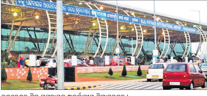
ଭୁବନେଶ୍ୱର ବିକ୍ରମ ପଟ୍ଟନାୟକ ଅନ୍ତର୍ଜାତୀୟ ବିମାନବନ୍ଦର।