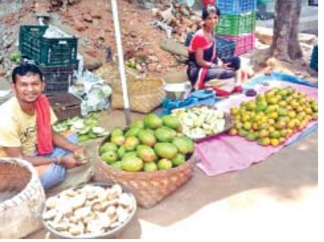
ପାଟିଲା ଆମ୍ବ ଓ ଆମୁଳ ଧରି ବସିଛନ୍ତି ବେପାରୀ।

କ୍ରୟପୁର ସହରର ବଜାରରେ ଆମୁଳ ଓ ପାଟିଲା ଆମ୍ବର ବିକ୍ରୀ ଆରମ୍ଭ ହୋଇଛି। ସହରର ରତ୍ନନଗର ଛକଠାରୁ ବୈରାସାହି ଛକ ପର୍ଯ୍ୟନ୍ତ ମୁଖ୍ୟମାର୍ଗରେ ପୂର୍ବାହ୍ନ ଓ ସନ୍ଧ୍ୟାରେ ପାଟିଲା ଆମ୍ବ, ଆଚାର ପ୍ରସ୍ତୁତ ପାଇଁ କଞ୍ଚାଆମ୍ବ ଏବଂ ଆମୁଳ (କୁଣ୍ଡଳୀଶା କଟାଆମ୍ବ) ବିକ୍ରୀ କରାଯାଉଛି। ସ୍ଥାନୀୟ ଗ୍ରାମାଞ୍ଚଳର ମହିଳା ରାସ୍ତାପାର୍ଶ୍ଵରେ ଏହି ପସରା ଧରି ବସିଛନ୍ତି। ପାଟିଲା ଆମ୍ବ ଠେଲ ଓ ଅନ୍ୟ ଫଳ ଦୋକାନରେ ବିକ୍ରୀ ହେଉଛି। ଆମୁଳ ଓ ଆଚାର ପାଇଁ ସ୍ଥାନୀୟ ବ୍ୟବସାୟୀ ସହରକୁ ଆମ୍ବ ବିକ୍ରୀ କରିବାକୁ ଆଣିଆଣ୍ଟି। ଏଥିରେ ବାଉଁଶପତ୍ର, ଦାସିରି, ନିଲମ, କଲମୀ କିସମର କଞ୍ଚା ଆମ୍ବ ଥାଏ। ସେଥିରୁ ସ୍ଥାନୀୟ ଗ୍ରାମାଞ୍ଚଳ ସମେତ ପଡୋଶୀ ଆନ୍ଧ୍ରପ୍ରଦେଶକୁ ପାଟିଲା ଆମ୍ବ ଆସିଥାଏ। ବାର୍ଦ୍ଧକ ଡୋଳାରେ