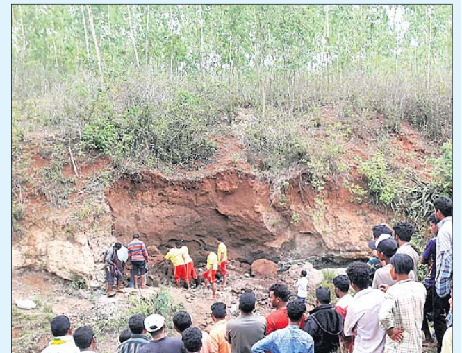
ଲିଟିପାବଳି ପାହାଡ଼ ତଳୁ ମୃତ୍ୟୁକୁ ଉଦ୍ଧାର କରାଯାଇଛି।

କୋରାପୁଟ ଜିଲ୍ଲା ପଟାଳି ବ୍ଲକ୍ ପୁଲାଇ ପଞ୍ଚାୟତରେ ଶନିବାର ଏକ ଦୁଃଖଦ ଘଟଣା ଘଟିଛି। ଏହି ପଞ୍ଚାୟତର ବଡୁଗୁଡ଼ା-କରଞ୍ଜୁଡ଼ା ନିକଟସ୍ଥ ଲିଟିପାବଳି ପାହାଡ଼ରେ ରୂନମାଟି ଖୋଲୁଥିବା ବେଳେ ଅତଡ଼ା ଖସି ୩ଜଣଙ୍କ ମୃତ୍ୟୁ ହୋଇଛି। ଅନ୍ୟ ୨ଜଣ ଆହତ ହୋଇଛନ୍ତି। ଆଉ କେତେଜଣ ମାଟି ତଳେ ଚପିଥିବା ଆଶଙ୍କା କରାଯାଇଛି। ମିଳିଥିବା ସୂଚନା ଅନୁଯାୟୀ, ପଟାଳି ବ୍ଲକ୍ ଅଧୀନ ଚନ୍ଦକା ପଞ୍ଚାୟତର ଦଳପଡ଼ିଗୁଡ଼ା, ନୂଆଗୁଡ଼ା ଓ ବେନିଜିଗୁଡ଼ା ୧୫ରୁ ୨୦ ଜଣ ଲୋକ ରୂନମାଟି ଆଣିବା ପାଇଁ ଶନିବାର ଗାଁଠାରୁ ପ୍ରାୟ ୫ କି.ମି ଦୂର ଲିଟିପାବଳି ପାହାଡ଼କୁ ଯାଇଥିଲେ। ଦିନ ପ୍ରାୟ ସାଢ଼େ ବାରଟା ବେଳେ ମାଟି ଖୋଳା ଚାଲିଥିବା ବେଳେ ହଠାତ୍