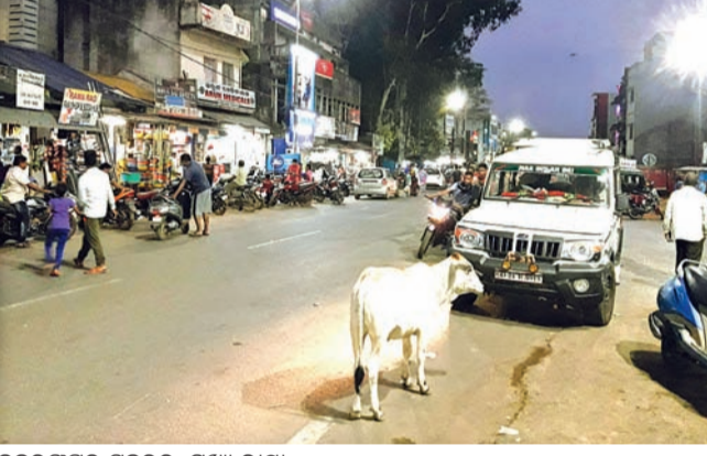
ନବରଙ୍ଗପୁର ସହରର ମୁଖ୍ୟ ରାସ୍ତା

ନବରଙ୍ଗପୁର ସହର ମଧ୍ୟ ଭାଗରେ ରହିଛି ୨୬ ନମ୍ବର ଜାତୀୟ ରାଜପଥ । ସହରର ଧର୍ମ ସାହିର ରାସ୍ତା ଓ ଛକ ଜାତୀୟ ରାଜପଥକୁ ସଂଯୋଗ କରୁଛି ।