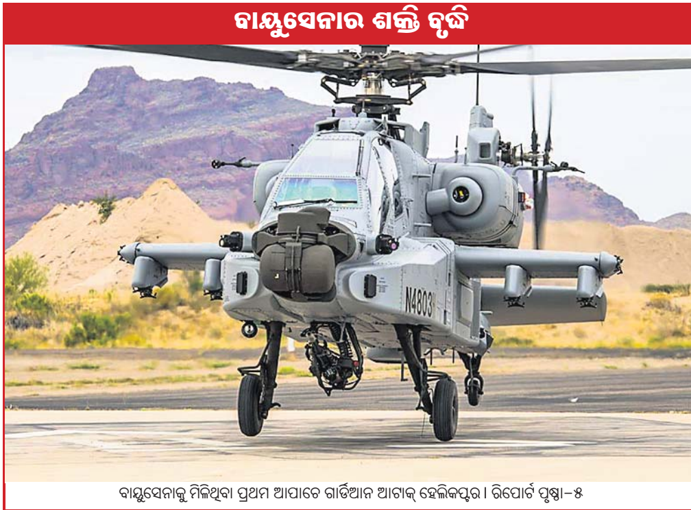
ବାୟୁସେନାକୁ ମିଳିଥିବା ପ୍ରଥମ ଆପାଡେ ଗାର୍ଡଆନ ଆବାଜ୍ ହେଲିକପ୍ଟର। ରିପୋର୍ଟ ପୃଷ୍ଠା-୫

ଓଡ଼ିଶା ଓ ଛତିଶଗଡ଼ ମଧ୍ୟରେ ଲାଗିରହିଥିବା ମହାନଦୀ ଜଳ ବିବାଦର ସମାଧାନ ପାଇଁ ଗଠିତ ତ୍ରିଭୁନାଳ ଶନିବାର ଏ ସମ୍ପର୍କରେ ଶୁଣାଣି କ୍ରମାଳ ୧୩କୁ ଘୁଞ୍ଚିଲା ବେଳେ ଛତିଶଗଡ଼ ଶନିବାର ହେବାର ଥିଲା। ବାତ୍ୟା ଫନୀ ଯୋଗୁ ଓଡ଼ିଶା ଉପକୂଳରେ ବ୍ୟାପକ କ୍ଷୟକ୍ଷତି ହୋଇଥିବାରୁ ଛତିଶଗଡ଼ ମଧ୍ୟରେ ତୃତୀୟ ସମୟରେ ବିକୂ ମୁବ ବାହିନୀରୁ ଓଡ଼ିଶା ଓ ଛତିଶଗଡ଼ ତ୍ରିଭୁନାଳକୁ ୪ ସପ୍ତାହ ସମୟ ମାଗିଥିଲେ। ତ୍ରିଭୁନାଳ ଏହାକୁ ଗ୍ରହଣ କରି ଉଭୟ