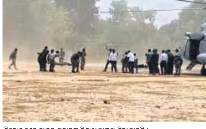
ବିଝୋରଣରେ ଆହତ ଯବାନଙ୍କୁ ବିଶାଖାପାଟଣା ନିଆଯାଇଛି।