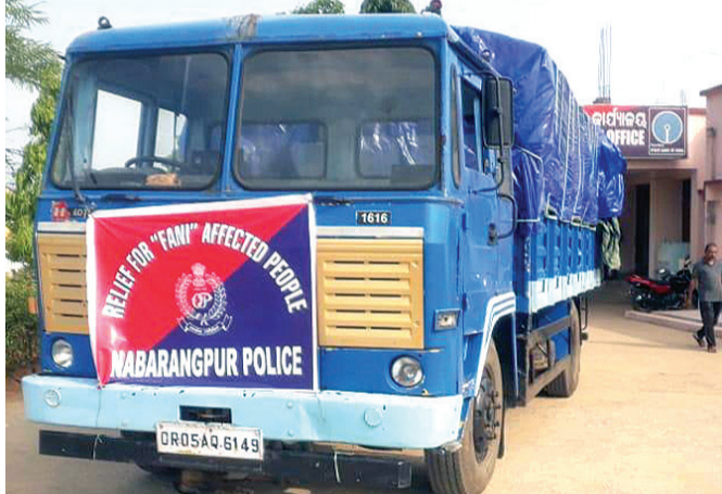
ରିଲିଫ୍ ସାମଗ୍ରୀ ବୋର୍ଡ଼େଇ ହୋଇଥିବା ଟ୍ରକ ।

ଫନୀ ବାତ୍ୟାରେ କ୍ଷତିଗ୍ରସ୍ତ ପରିବାରଙ୍କ ପାଇଁ ନବରଙ୍ଗପୁର ଜିଲ୍ଲା ପୋଲିସ୍ ପକ୍ଷରୁ ରିଲିଫ୍ ସାମଗ୍ରୀ ପଠାଯାଇଛି ।