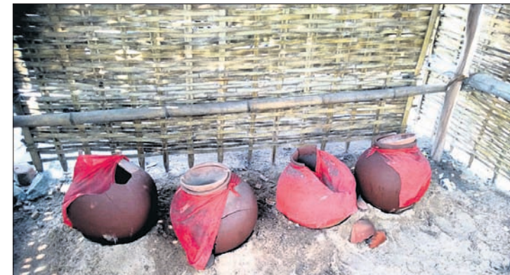
ବଅଁରପାଳ ବ୍ଲକ୍ ସମ୍ମୁଖ ଜଳଛତ୍ର କେନ୍ଦ୍ରରେ ଫଟା, ଭଙ୍ଗା ମାଠିଆ ରଖାଯାଇଛି।

ଖରା ବଡ଼ିଲେ ପ୍ରଶ୍ନାତ୍ମକ ଚେତ ଉଠେ। ବାଟୋଇଙ୍କ ପାଇଁ ଜଳଛତ୍ର ବ୍ୟବସ୍ଥା କରେ। ଚଳିତବର୍ଷ ଅନୁଗୋଳ ଜିଲ୍ଲାରେ କେବେବୁ ପାରବ ୪୦ ଡିଗ୍ରୀ ଚପିରଲାଣି। ଅସହ୍ୟ ଗୁରୁତ୍ୱି ସାଜକୁ ଝାଞ୍ଜି ପବନରେ ଜନଜୀବନ ଅସୁବିଧ ହୋଇପଡ଼ିଲାଣି। ଦିନ ୧୦ଟାରୁ ରାସ୍ତାଘାଟ ଜନଗୁଣ୍ୟ ହୋଇପଡ଼ୁଥିବା ବେଳେ କାଁ ଭାଁ ଗାଡ଼ି ଯିବାଆସିବା କରୁଛି। ଏପରି କି ଜିଲ୍ଲାରେ ଏକାଧିକ ଅଂଶୁଆତଜନିତ ମୃତ୍ୟୁ ମଧ୍ୟ ହୋଇଥିବା ଅଭିଯୋଗ ହେଉଛି। ଚଫାପି ପ୍ରଶ୍ନାତ୍ମକର ଜଳଛତ୍ର ବ୍ୟବସ୍ଥା ପଥଚାରୀଙ୍କ ଶୋଷ ମେଣ୍ଟାଇପାରୁ ନାହିଁ। ବିଶେଷକରି ବଅଁରପାଳ ବ୍ଲକ୍‌ରେ ଏହା ସମ୍ପୂର୍ଣ୍ଣ ବାଟବଣା ହୋଇଥିବା ଅଭିଯୋଗ ହେଉଛି। ଫଟା ମାଠିଆରେ ଏଠି ଜଳସେବା ଚାଲିଥିବା କୁହାଯାଉଛି। ବଅଁରପାଳ ବ୍ଲକ୍ ପ୍ରଶ୍ନାତ୍ମକ ପକ୍ଷରୁ ବ୍ଲକ୍ କାର୍ଯ୍ୟାଳୟ ସମେତ ବିଭିନ୍ନ ପଞ୍ଚାୟତ ମହକୁମା, ବସ୍‌ଷ୍ଟାଣ୍ଡ, ହାଟ, ମାର୍କେଟ୍ ସମେତ ଛକ ସ୍ଥାନରେ ୧ ଶହରୁ ଊର୍ଦ୍ଧ୍ୱ ଜଳଛତ୍ର କେନ୍ଦ୍ର ଖୋଲାଯାଇଛି। ହେଲେ ବ୍ଲକ୍ ସମ୍ମୁଖରେ ଖୋଲାଯାଇଥିବା ଜଳଛତ୍ର କେନ୍ଦ୍ରରେ ଫଟା, ଭଙ୍ଗା ମାଠିଆ