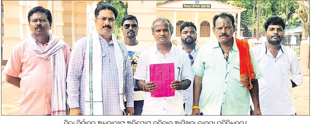
ଜିଲା ନିର୍ବାଚନ ଅଧିକାରୀଙ୍କୁ ଅଭିଯୋଗ କରିବାକୁ ଆସିଥିବା ଭାଜପା ପ୍ରତିନିଧିଦଳ।

ପ୍ରକାଶଟି ଅଧିକାରୀମାନେ ଲିଖିତ ଭାବେ ପ୍ରଶ୍ନାବଳୀକୁ ଜଣାଇଛନ୍ତି। ତେବେ କାହା ନିର୍ଦ୍ଦେଶ ଓ କେଉଁ ଉଦ୍ଦେଶ୍ୟ ନେଇ ଏହି ନିର୍ବାଚନ କରାଯାଇଛି ବୋଲି ମଧ୍ୟ ସେ ପ୍ରଶ୍ନ କରିଛନ୍ତି। ଗତ ୨୯ ତାରିଖରେ ମତଦାନ ବେଳେ ତ୍ରୁଟି ପରିଲକ୍ଷିତ ହୋଇଥିବାରୁ ସାନି ମତଦାନ ହୋଇପାରେ ବୋଲି