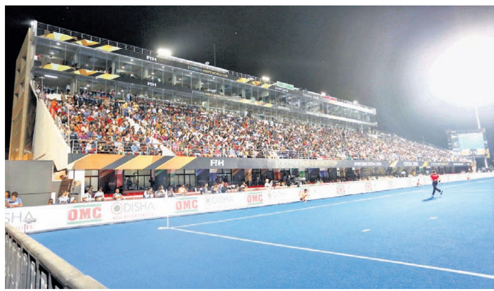
ଲେଖାଏ ଧାର୍ଯ୍ୟ କରାଯାଇଛି ।

ଏହି ଚୁର୍ନାମେଣ୍ଟ ୨୦୨୦ ଅଲିମ୍ପିକ୍ କ୍ୱାଲିଫାୟିଂ ଚୁର୍ନାମେଣ୍ଟ ପାଇଁ ଯୋଗ୍ୟତା ପର୍ଯ୍ୟାୟ ଭାବେ ବିବେଚିତ । ଏଥିରେ ଏସିଆନ ଗେପୁ ଗୋଲ୍ ମେଡାଲିଷ୍ଟ କାପାନ, ମେକ୍ସିକୋ, ଆମେରିକା, ପୋଲାଣ୍ଡ, ଦକ୍ଷିଣ ଆଫ୍ରିକା, ରୁଷିଆ, ଉତ୍ତରକୋରୀୟା ଓ ଆୟୋଜକ ଭାରତ ଅଂଶଗ୍ରହଣ କରିବ । ଅଲିମ୍ପିକ୍ ଯୋଗ୍ୟତା ହାସଲ ଲକ୍ଷ୍ୟରେଥିବା ଭାରତ ଅନ୍ୟ ୭ ଦଳ ଭୁଜନାରେ ଉଚ୍ଚ ର୍ୟାଙ୍କିଂ ପାଇଁ ଲିଭି ପର୍ଯ୍ୟାୟ ପାଇଁ ଟିକେଟ ଦର ଇଷ୍ଟ ଷ୍ଟାଣ୍ଡ ଲାଗି ୨୦୦ଟଙ୍କା ଲେଖାଏ ରଖା ଯାଇଛି । ସେହିପରି ନର୍ଥ ଓ ସାଉଥ ଷ୍ଟାଣ୍ଡ ପାଇଁ ଟିକେଟ ମୂଲ୍ୟ ୧୦୦ଟଙ୍କା ରଖା ଯାଇଛି । ସେମିଫାଇନାଲ ଓ ଫାଇନାଲ ପାଇଁ ଇଷ୍ଟ ଷ୍ଟାଣ୍ଡ ଟିକେଟ ମୂଲ୍ୟ ୨୫୦ ଓ ନର୍ଥ ଓ ସାଉଥ ଷ୍ଟାଣ୍ଡ ଲାଗି ୧୫୦ ଟଙ୍କା