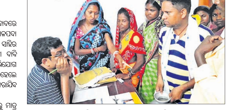
ମହିଳାମାନେ ଦାବିପତ୍ର ପ୍ରଦାନ କରୁଛନ୍ତି।

ରଖି ପଞ୍ଚାୟତର କିଛି ନେତୃତ୍ୱ ସହି ସାହିରେ କିଛି ଉନ୍ନୟନମୂଳକ କାମ କରାଇ ଦେଖାନାହିଁ। ଏହି ସାହିରେ ୫୦୦୦ ଉର୍ଦ୍ଧ୍ୱ ଆଦିବାସୀ ପରିବାର ବସବାସ କରୁଥିବା ବେଳେ ଜନସଂଖ୍ୟା ୧୮୭। ଗ୍ରାମରେ ଏକ ଅଜ୍ଞାନଶକ୍ତି କେନ୍ଦ୍ର ଓ ପ୍ରାଥମିକ ବିଦ୍ୟାଳୟ ଅଛି। ତେବେ ବିଭିନ୍ନ ଅବ୍ୟବସ୍ଥା ଲାଗି ରହିଥିବାରୁ ସାହିର ପିଲାମାନେ ଉଚିତ