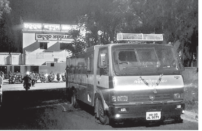
ରେଳଷ୍ଟେ ଷ୍ଟେଶନରେ ପହଞ୍ଚିଥିବା ଅଗ୍ନିଶମ ବିଭାଗ ଗାଡ଼ି।