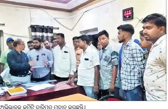
ଅଭିଭାବକ କମିଟି ଦାବିପତ୍ର ପ୍ରଦାନ କରୁଛନ୍ତି।

ଡି.ଏ.ଭି ସ୍କୁଲ କର୍ତ୍ତୃପକ୍ଷ ସାଧାରଣ ଛାତ୍ରଛାତ୍ରୀ (ଏମ୍.ସି.ଏଲ୍. କର୍ମଚାରୀଙ୍କ ପିଲାଙ୍କ ବ୍ୟତୀତ)ଙ୍କ ନିମନ୍ତେ ଆଡ଼ମିଶନ ଓ ଟ୍ୟୁଶନ ଫି ହାତ ଝରୁଣ ବୁକ୍ସ କରି ଦେଇଛନ୍ତି। ଏହାକୁ ନେଇ ଅଭିଭାବକ ମହଲରେ ତୀବ୍ର ନିମନ୍ତେ ଏକ ବୈଠକ କରାଯିବାକୁ ଅଞ୍ଚଳର ଶକ୍ତିଗ୍ରହ ଓ ପାର୍ଶ୍ୱବର୍ତ୍ତୀ ଗ୍ରାମର ପିଲାମାନେ ଏଠାରେ ପାଠ ପଢ଼ନ୍ତି। ହାତ ଏତେ ପରିମାଣର ଦେୟ