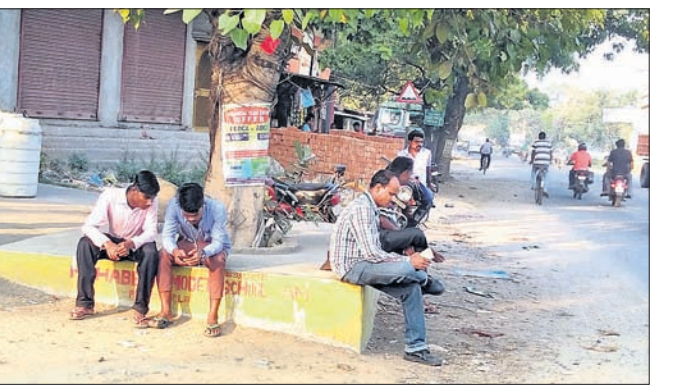
ବିଶ୍ୱାସୀନାଗର ନ ଥିବାରୁ ଯାତ୍ରୀମାନେ ଏକ ମଣ୍ଡପ ଉପରେ ବସିଛନ୍ତି।

ବଅଁରପାଳ, ୧୩୫ (ଡି.ଏନ୍.ଏ.) ନାଲକୋ ଏପ୍‌ସିଆଇ ଛକ ଠାରେ ରହିଛି ଏକ ବସ୍‌ଷ୍ଟାଣ୍ଡ। କୁଳଡ଼ା, ଗିରାଙ୍ଗ, ବଳରାମପ୍ରସାଦ, ନାଲକୋ କଲୋନୀ ସମେତ ଆଖପାଖ ଅଞ୍ଚଳର ଶତାଧିକ ଯାତ୍ରୀ ଏହା ଉପରେ ନିର୍ଭର କରନ୍ତି। ଦୈନିକ ଏଠାରୁ ବହୁ ବ୍ୟାଧକ ଯାତ୍ରୀ ବିଭିନ୍ନ କାମରେ କଟକ, ଭୁବନେଶ୍ୱର, ଦେଢ଼ାମାଲ, କେନ୍ଦୁଝର, ସମ୍ବଲପୁର, ତାଳଚେର, ଅନୁଗୋଳ, ମୟୂରଭଞ୍ଜ, ପୁରୀ ସମେତ ବିଭିନ୍ନ ଅଞ୍ଚଳକୁ ଯାତାୟତ କରନ୍ତି। କିନ୍ତୁ ଏହି ବସ୍‌ଷ୍ଟାଣ୍ଡଟି ସମ୍ପୂର୍ଣ୍ଣ