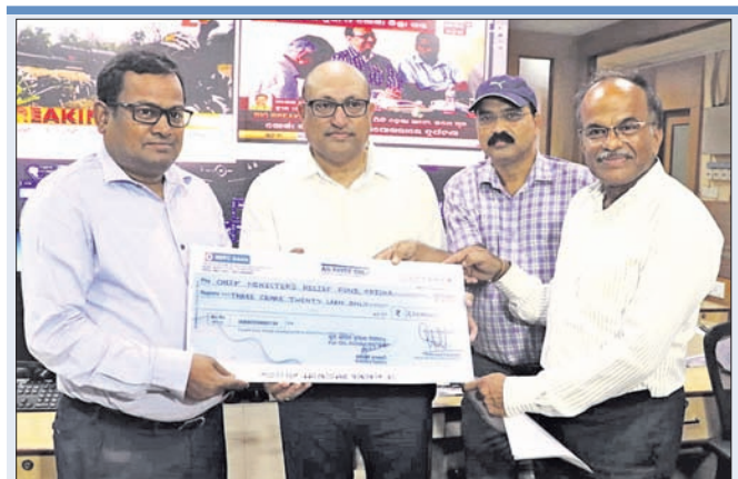
ଓଆଇଏଲ୍ ଅଧିକାରୀ ସ୍ୱତନ୍ତ୍ର ରିଲିଫ୍ କମିଶନରଙ୍କୁ ଚେକ୍ ପ୍ରଦାନ କରୁଛନ୍ତି । ■ ପୁଣ୍ୟମନ୍ତ୍ରୀଙ୍କ ଅନୁରୋଧ ରକ୍ଷା କଲେ କେନ୍ଦ୍ରମନ୍ତ୍ରୀ ଧର୍ମେନ୍ଦ୍ର ■ ସହଯୋଗ ପାଇଁ କେନ୍ଦ୍ରମନ୍ତ୍ରୀଙ୍କୁ ସିଏମ୍‌ଫରେ ଧନ୍ୟବାଦ ■ ମାଗଣା କିରୋସିନ ବାବଦରେ ୩.୨ କୋଟି ଟଙ୍କା ଦେଲା ଓଆଇଏଲ୍