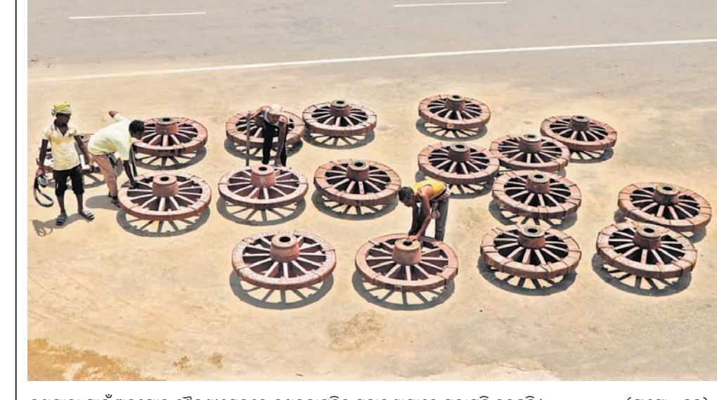
ରଥଯାତ୍ରା ପାଇଁ ଅନୁଗୋଳ ଶୈଳଶ୍ରୀକ୍ଷେତ୍ରରେ ରଥଚକାଗୁଡ଼ିକୁ ମହାରଣାମାନେ ମରାମତି କରୁଛନ୍ତି।