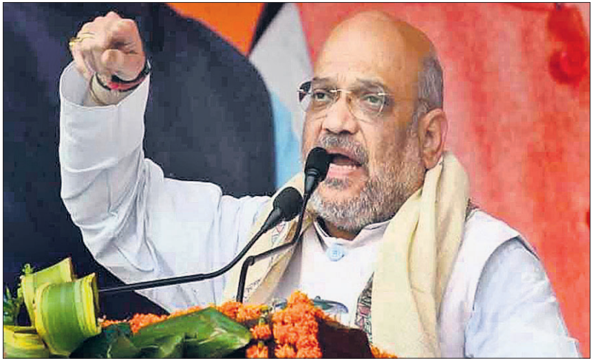
କାନ୍ତି ନିର୍ବାଚନ ରାଲିରେ ଭାଜପା ରାଷ୍ଟ୍ରୀୟ ଅଧ୍ୟକ୍ଷ ଅମିତ ଶାହ ଉଦ୍‌ବୋଧନ ଦେଉଛନ୍ତି।

ପଶ୍ଚିମବଙ୍ଗର ଯାଦବପୁରରେ ଭାଜପା ଅଧ୍ୟକ୍ଷ ଅମିତ ଶାହଙ୍କ ରାଲିକୁ ସୋମବାର ବାତିଲ କରାଯାଇଛି। ଶାହଙ୍କ ହେଲିକପ୍ଟର ଅବତରଣ ଲାଗି ପଶ୍ଚିମବଙ୍ଗ ସରକାର ଅନୁମତି ନ ଦେବାରୁ ଏହାକୁ ବାତିଲ କରାଯାଇଥିବା ଭାଜପା ପକ୍ଷରୁ ଅଭିଯୋଗ କରାଯାଇଛି। ଟିଏମ୍ପି ସରକାର ଗଣତନ୍ତ୍ରକୁ ବଳିଦେଇ ରାଜ୍ୟରେ ଏକଲୁତ୍ରବାଦ ଚଳାଇଛି ଓ ନିର୍ବାଚନ କମିଶନ ରୁପହୋଇ ବସି ରହିଛନ୍ତି ବୋଲି ଭାଜପା କହିଛି। ତେବେ ଏଭଳି ଅଭିଯୋଗରେ କୌଣସି ସତ୍ୟତା ନାହିଁ କି ରାଲି ବାତିଲ ହେବା ପଛରେ ଟିଏମ୍ପିର କୌଣସି ଭୂମିକା ନାହିଁ ବୋଲି ଦକ୍ଷ ସାଧାରଣ ସମ୍ପାଦକ ପାର୍ଥ ଚାଟାର୍ଜୀ ପ୍ରକାଶ କରିଛନ୍ତି। ଏନେଇ ଟିଏମ୍ପି ଓ ଭାଜପା ମଧ୍ୟରେ ବାକ୍ସପୁଲ ଆରମ୍ଭ ହୋଇଛି। ପଶ୍ଚିମବଙ୍ଗରେ ମୋ