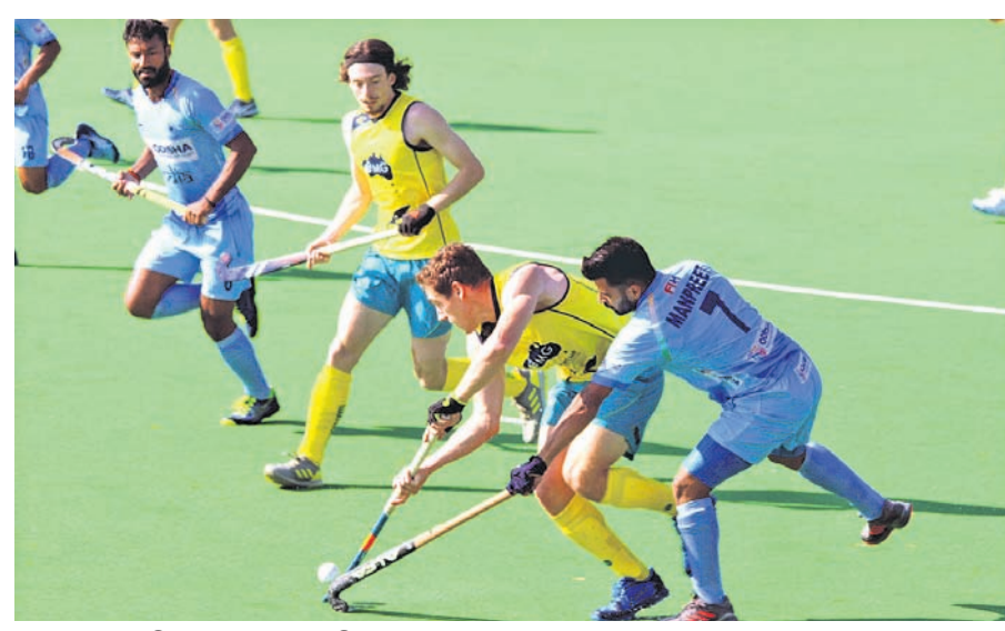
ଭାରତ ଓ ଅଷ୍ଟ୍ରେଲିଆ-ଏ ମଧ୍ୟରେ ଅନୁଷ୍ଠିତ ମ୍ୟାଚ ।