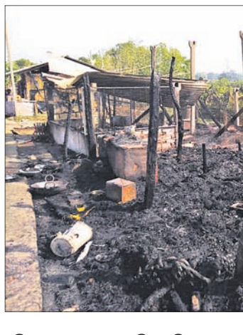
ଅଗ୍ନିକାଣ୍ଡରେ ଦୋକାନ ଜଳିଯାଇଛି।