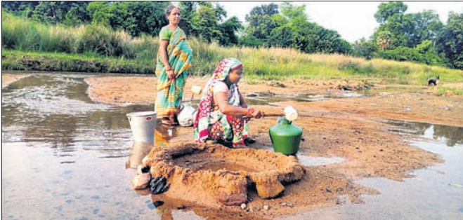
ମହିଳାମାନେ ରୁଆକୁ ପାଣି ସଂଗ୍ରହ କରୁଛନ୍ତି।

ଶିଳ୍ପ ନଗରୀ ତାଳଚେରରେ ପାନୀୟ ଜଳ ସମସ୍ୟା ଧୀରେ ଧୀରେ ଉକ୍ତ ହେବାରେ ଲାଗିଛି। ବର୍ଷ ଧାରା ଜଳାଭାବ ରହିଥିଲେ ବି ଖରାଦିନେ ତାହା ଡେରହୁଣ୍ଡା ବଢ଼ିଯାଉଛି। ବାରମ୍ବାର ପ୍ରଶାସନ ନିକଟରେ ଅଭିଯୋଗ ହେଉଥିଲେ ମଧ୍ୟ ଘୁଣ୍ଟା ସମାଧାନ ବ୍ୟବସ୍ଥା କରାଯାଇ ନ ଥିବାରୁ ଲୋକେ ପିଇବା ପାଣି ପାଇଁ ବଡ଼ ଦହଗଞ୍ଜ ହେଉଛନ୍ତି। ପ୍ରଶାସନ ଓ ଶିଳ୍ପସଂସ୍ଥା ଯୋଗାଉଥିବା ଜଳ ପିଇବା ଉପଯୋଗୀ ହେଉ ନ ଥିବାରୁ କିଏ ଦୀର୍ଘ ପଥ ଚାଲି ପାଣି ସଂଗ୍ରହ କରୁଛନ୍ତି ତ ଆଉ କିଏ ରୁଆ ଜଳରେ ଘରର ଆବଶ୍ୟକତା ମୋଟାଇବାକୁ ବାଧ୍ୟ ହେଉଛନ୍ତି।