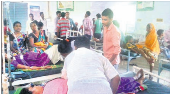
ତାନ୍ତ୍ରଣାରେ ଆହତ କରିବା ଚାଲିଛି।