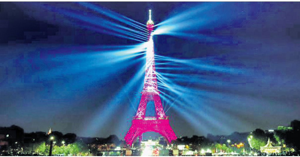
ପ୍ରାନ୍ତ ରାଜଧାନୀ ପ୍ୟାରିସର ଉଚ୍ଚତମ ଇମେଲ୍ ଟାଉରକୁ ଗୁରୁବାର ୧୩୦ ବର୍ଷ ଛୁଇଁଛି। ଏହି ଅବସରରେ ଲେକର ଶୋ ସହିତ ଏହାର ପ୍ରତିଷ୍ଠା ଉତ୍ସବ ପାଳନ କରାଯାଇଛି। (ରିପୋର୍ଟ: ପୃଷ୍ଠା-୨)