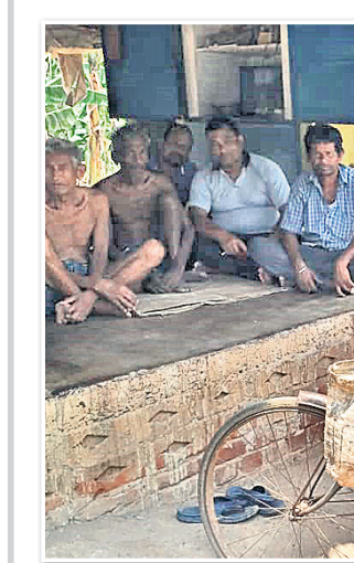
ମନ୍ଦରଧର ସାହୁଙ୍କେଲେ କାକୁଡି ବିକ୍ରେତ୍ତି।