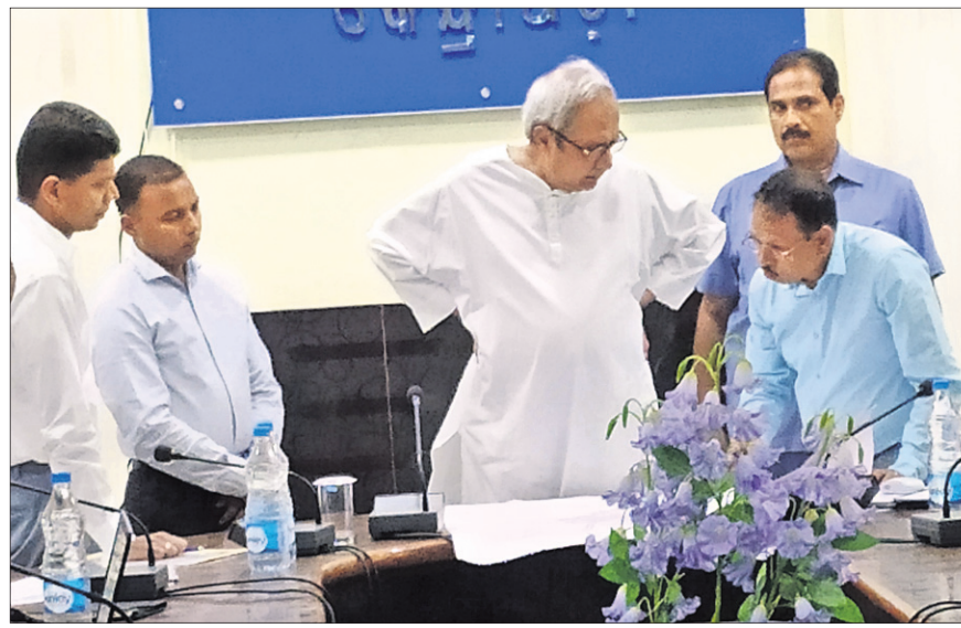
ଜିଲ୍ଲାପାଳଙ୍କ କାର୍ଯ୍ୟାଳୟରେ ବାଚ୍ୟା 'ଫନା' ନେଇ ସମାକ୍ଷା କରୁଛନ୍ତି ମୁଖ୍ୟମନ୍ତ୍ରୀ ନବୀନ ପଟ୍ଟନାୟକ।