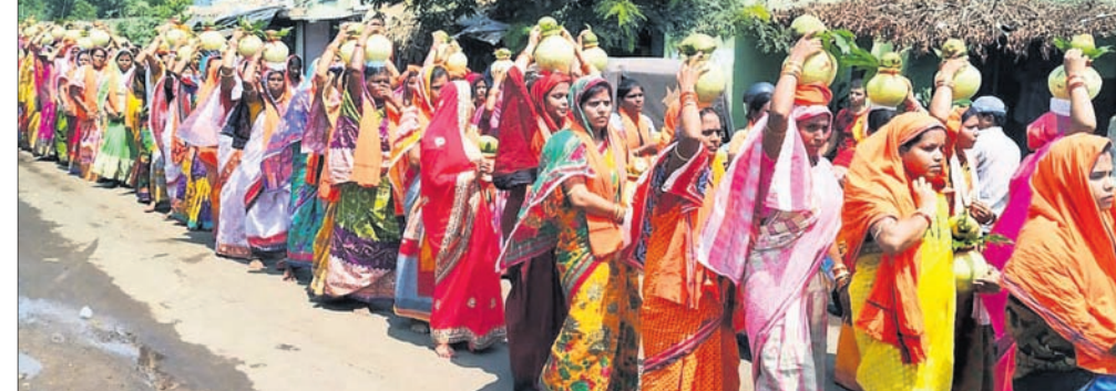
ମହିଳାମାନେ କବସ ଶୋଭାଯାତ୍ରାରେ ଯାଉଛନ୍ତି।

ଚାଳଚେର, ୧୬/୫(ଡି.ଏନ.ଏ.): ଚାଳଚେର ବ୍ଲକ୍ ତଅଁରା ପଞ୍ଚାୟତ କାମ୍ବୋହାଳା ଗ୍ରାମରେ ଜମ୍ବେଶ୍ୱର ମନ୍ଦିର ପ୍ରତିଷ୍ଠା ଉତ୍ସବ ପାଳିତ ହେଉଛି। ସୁଧାବାର ସୂର୍ଯ୍ୟପୂଜା, ମନ୍ଦିର ପ୍ରତିଷ୍ଠା ସହ ଯଜ୍ଞ ଆରମ୍ଭ ହୋଇଥିଲା। ଗୁରୁବାର ଠାକୁରଙ୍କ ମହାସ୍ନାନ, ଯଜ୍ଞକର୍ମ, ରୁଦ୍ରାଭିଷେକ