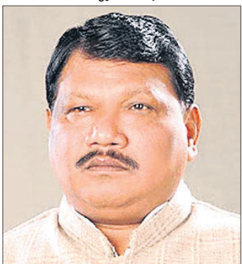
କୁଂଭଳ ଓରାମ ଭାଜପା