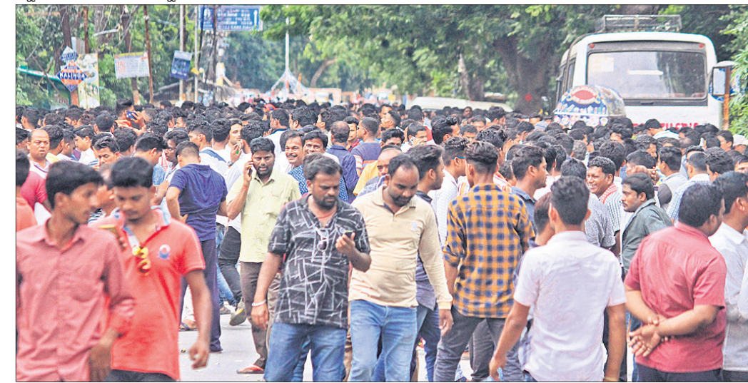
ନିର୍ବାଚନ ଫକୀଫକ ଜାଣିବା ପାଇଁ ଅନୁଗୋଳ କଲେଜ ସମ୍ମୁଖରେ ଲୋକଙ୍କ ଭିଡ଼।