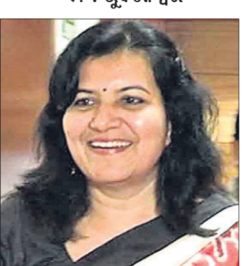
ଅନୁଭବ ମହାନ୍ତି ଭାଜପା