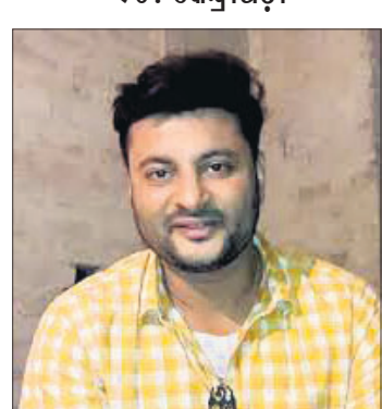
ଅନୁଭବ ମହାନ୍ତି ବିଜେଡି