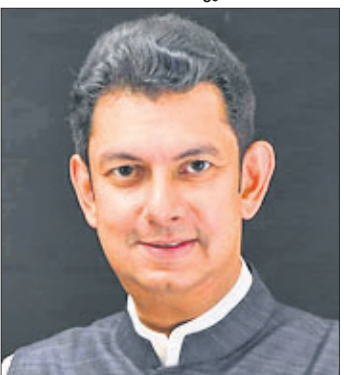
ନୀତେଶ ଗଜପତି ଭାଜପା