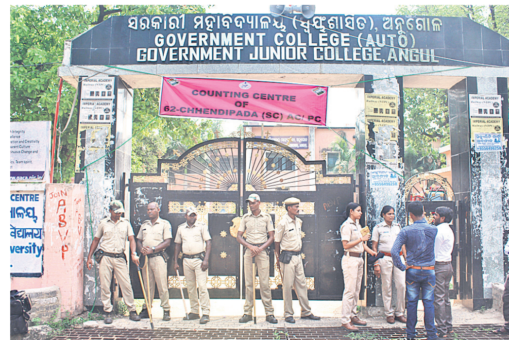
ଭିତରେ ଭୋଟ ଗଣତି ଚାଲିଥିବାରୁ ଅନୁଗୋଳ କଲେଜ ବାହାରେ କଡ଼ା ପୁରୁଷା ବ୍ୟବସ୍ଥା।