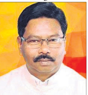
ବିଶେଷ୍ଠର ଚନ୍ଦ୍ର ଭାଜପା