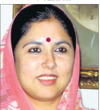
ସଙ୍ଖାତା କୁମାରୀ ସିଂହ ଭାଜପା