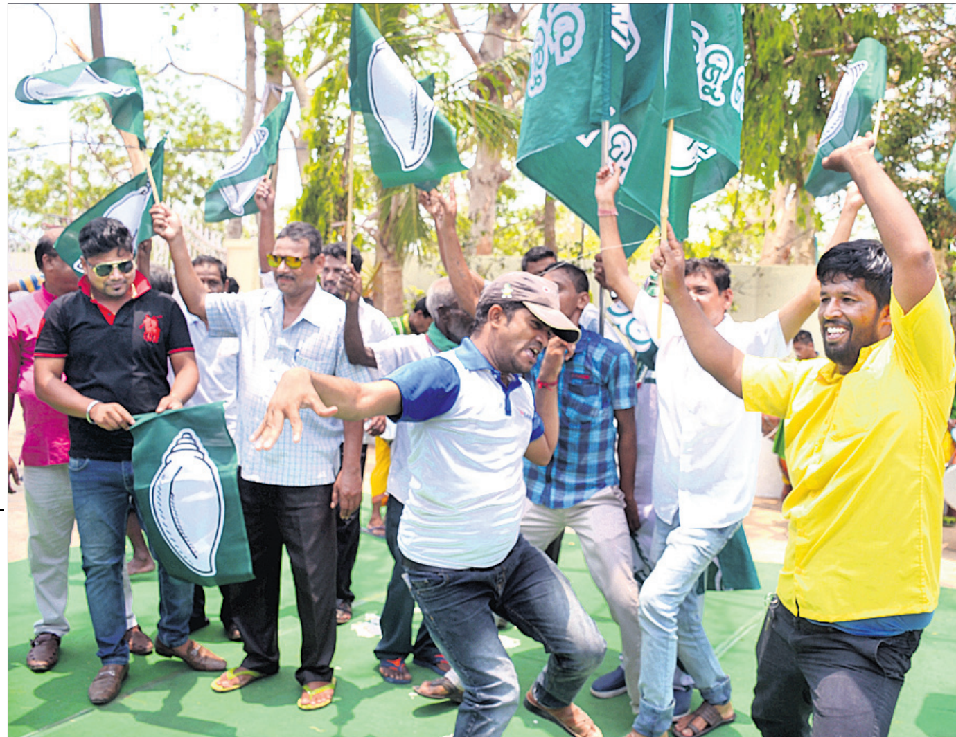
ଭୁବନେଶ୍ୱର ବିଜେଡି କର୍ମୀମାନେ ନାଚି ଖୁସି ମନାଉଛନ୍ତି।