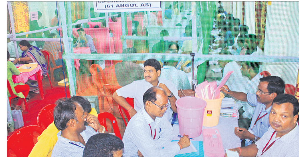
ଅନୁଗୋଳ କଲେଜଠାରେ ଅନୁଗୋଳ ଓ ଛେଡ଼ିପଦା ନିର୍ବାଚନ ମଣ୍ଡଳର ଭୋଟ ଗଣତି କରାଯାଉଛି।