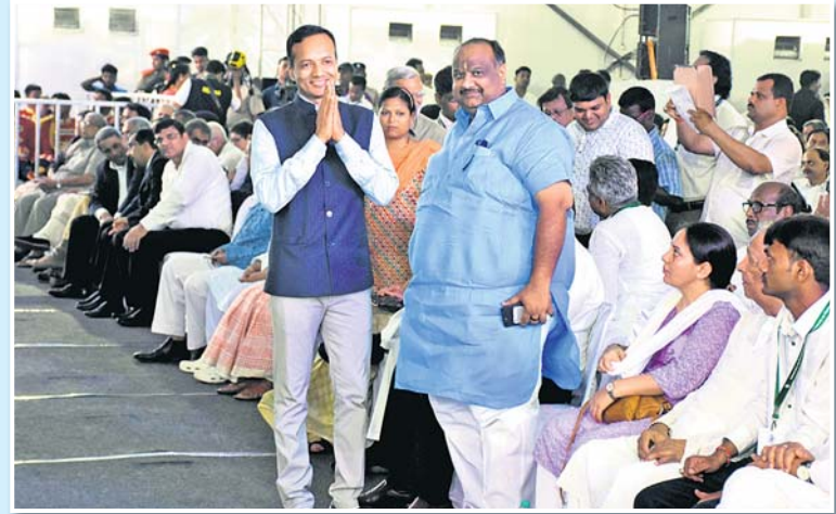
ସମାରୋହରେ ଯୋଗ ଦେଇଥିବା ବିଶିଷ୍ଟ ଶିଳ୍ପପତି ନବୀନ ଜିନ୍ଦା ।