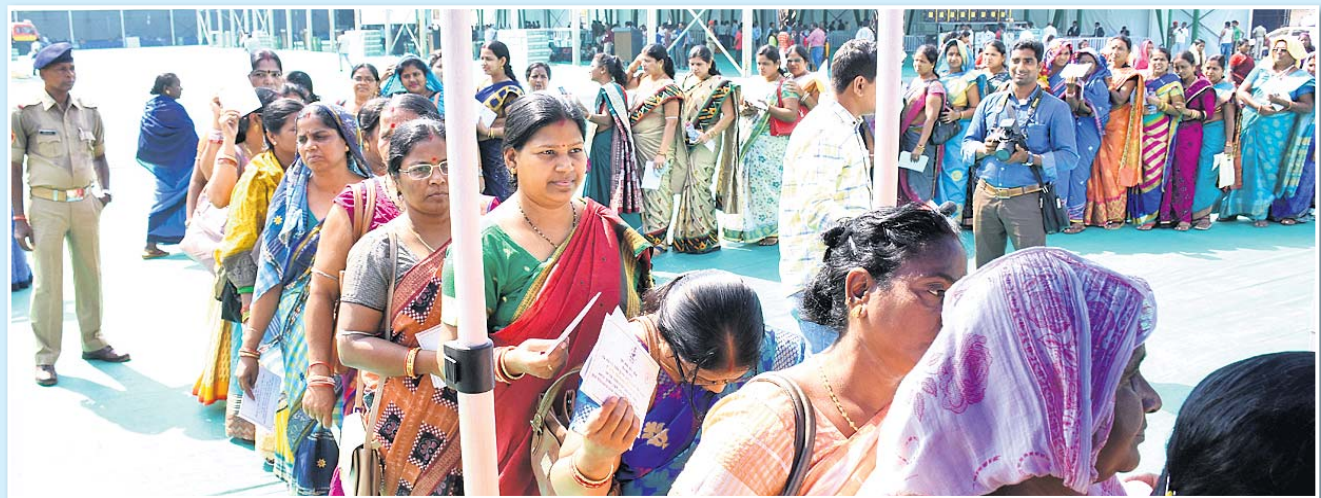
ସମାରୋହକୁ ଆସିଥିବା ମହିଳାମାନେ ଧାଡ଼ିରେ ଅପେକ୍ଷା କରିଛନ୍ତି ।