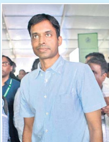
ଭାରତୀୟ ବ୍ୟାଡମିଣ୍ଟନ ଚାରକା ଗୋପା ଚାନ୍ଦ ।