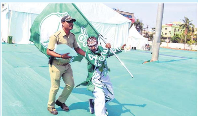
ଜଣେ ବିକେତ ସମର୍ପକଙ୍କୁ ସୁରକ୍ଷା କର୍ମୀ ବାହାରକୁ ନେଇଛନ୍ତି ।