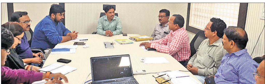
ବୈଠକରେ ଉପସ୍ଥିତ ଜିଲାପାଳ, କମିଶନର ଓ ଅନ୍ୟ ଅଧିକାରୀ ।