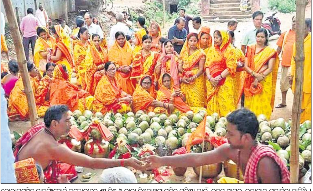
କୋରାପୁଟସ୍ଥିତ ହାରସିଂବୋର୍ଡ କଲୋନୀରେ ଶ୍ରୀ ବିଷୁ ଓ ବାବା ବିଶ୍ୱନାଥଙ୍କ ମନ୍ଦିର ପ୍ରତିଷ୍ଠା ପାଇଁ କଳସ ସ୍ଥାପନ କରାଯାଇ ପୂଜାର୍ଚ୍ଚନା ଚାଲିଛି ।

ଭାରତୀୟାବେଳେ ଏହି ଜିଲାର ବହୁ ବ୍ୟକ୍ତି ସେମାନଙ୍କ ସଫଳ କାର୍ଯ୍ୟ ପାଇଁ ଦେଶ ବିଦେଶରେ ପରିଚିତ ହୋଇ ଜିଲ୍ଲା ପାଇଁ ଗୌରବ ଆଣିଛନ୍ତି।