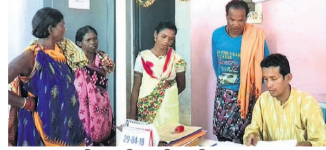
ଅଧ୍ୟୁତ୍ସମ୍ୟାନଙ୍କୁ ଅଭିଯୋଗ କରିବାକୁ ଆସିଥିବା ଶ୍ରମିକମାନେ ।