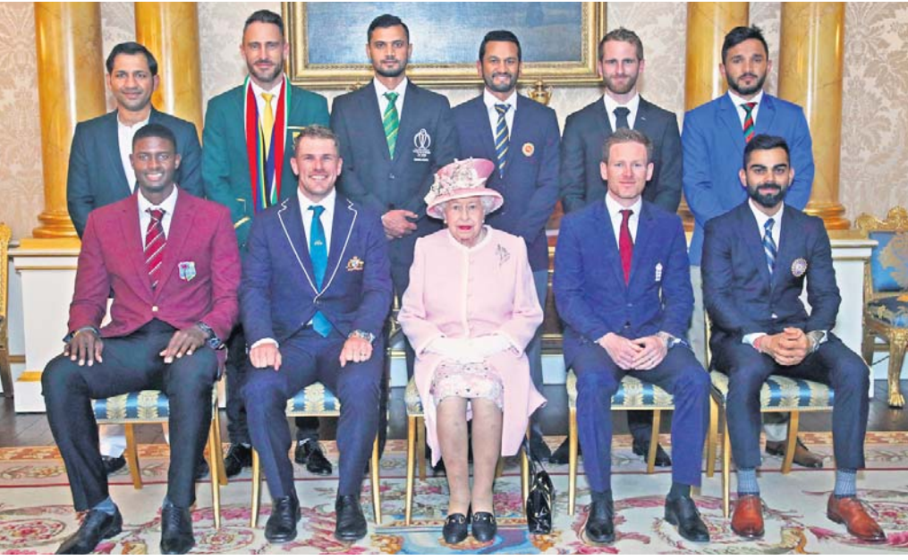
ଇଣ୍ଡନର ବକିଙ୍ଗହାମ ପ୍ୟାଲେସରେ ବ୍ରିଟେନ ରାଣୀ ଏଲିଜାବେଥଙ୍କ ସହ ବିଶ୍ୱକପରେ ଅଂଶଗ୍ରହଣକାରୀ ୧୦ ଦଳର ଅଧିନାୟକ।

ସର୍ବାଧିକ ଦଳୀୟ ଷୋର ହାସଲ କରିଛି। ୬ ଉଲକେଟ୍ ହରାଇ ଇଂଲଣ୍ଡ ୪୮୧ ରନ କରି ବିଶ୍ୱ ରେକର୍ଡ୍ ସ୍ଥାପନ କରିଛି। ଇଂଲଣ୍ଡ ବ୍ୟାଟିଂ ଲାଇନ୍ ଜବରଦସ୍ତ ରହିଛି। ଜାସନ ରଏ, ଜୋ ରୁଟ, ମୋର୍ଗନ ଓ ଡାଜନାମିକ୍ ଜୋସ ବଟଲର ଆଖି ପଛୁଳାକେ ଇନିଂସରେ ଇନିଂସରେ ପରିବର୍ତ୍ତନ କରିପାରିବେ ଓ ପ୍ରତିପକ୍ଷ ଦଳର ବୋଲିଂ ଲାଇନ୍‌କୁ ଧ୍ୟାୟ କରିବାର କ୍ଷମତା ରଖିଛନ୍ତି। ପ୍ରତିପକ୍ଷ ଦଳ ୩୭୦ ରନ ସଂଗ୍ରହ କଲେ ମଧ୍ୟ ଆମେ ତାଙ୍କୁ ସଫଳତାର ସହ ଚେକ୍ କରିପାରିବୁ ଓ ଏହି ବିଶ୍ୱାସ ଦଳ ନିକଟରେ ରହିଛି ବୋଲି ଇଂଲଣ୍ଡ ଲେଗ୍ ସ୍ପିନର ଆଦିଲ ରସିଦ୍ କହିଛନ୍ତି। ଦଳ ଯେକୌଣସି ବଡ଼ ଚାଟିଂଗୁ ଚେକ୍ କରିପାରିବ ବୋଲି ଆମ ପାଖରେ ଆମ୍ଭ ବିଶ୍ୱାସ ରହିଛି ବୋଲି ସେ କହିଛନ୍ତି। ଗତ ୪ ବର୍ଷ ହେବ ଆମେ ଯେଉଁ ଭଳି ପ୍ରଦର୍ଶନ କରିଆସିବୁ