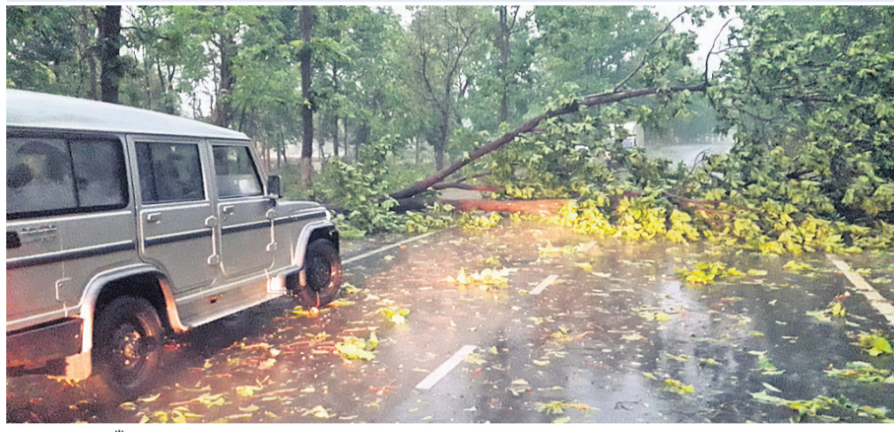
ଗଛ ପଡ଼ି ଡାକୁଆଁ-ଉପରକୋଟ ରାସ୍ତା ଅବରୋଧ ହୋଇଛି ।