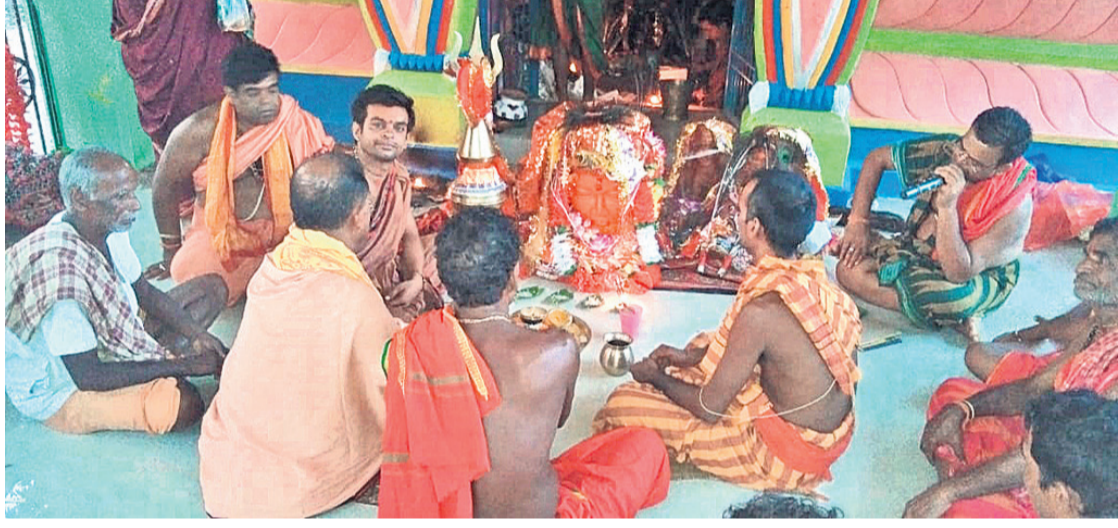
ମନ୍ଦିର ପ୍ରତିଷ୍ଠା ଉତ୍ସବରେ ପୂଜାର୍ଚ୍ଚନା ଚାଲିଛି।

ହୋଇଥିଲା। ଏହାକୁ ଦେଖିବାପାଇଁ ଶ୍ରଦ୍ଧାଳୁଙ୍କ ପ୍ରବଳ ଭିଡ଼ ଦେଖିବାକୁ ମିଳିଛି। ପୂର୍ଣ୍ଣସୂତ ପରେ ତଦାରିଂ ଅଞ୍ଚଳର ପ୍ରସିଦ୍ଧ ରାମାୟଣ ନାଟକ ମଞ୍ଚସ୍ଥ ହେବ। ତେବେ ୪ ଦିନ ଧରି ଅନୁଷ୍ଠିତ ଉତ୍ସବରେ ଅଞ୍ଚଳରେ ଏକ ଆଧ୍ୟାତ୍ମିକ କାର୍ଯ୍ୟକ୍ରମମାନ ପରିବେଶିତ ହୋଇଥିଲା।