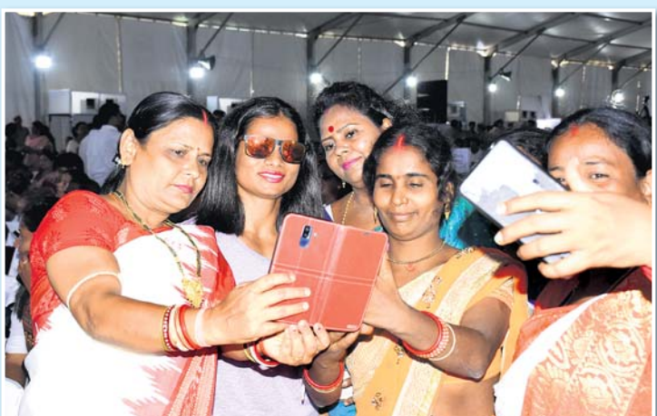
ସ୍ତ୍ରୀଙ୍କ ଦୂତୀ ଗାୟକ ଗହଣରେ ମହିଳାମାନେ ସେଲ୍ଫି ଉଠାଇଛନ୍ତି ।