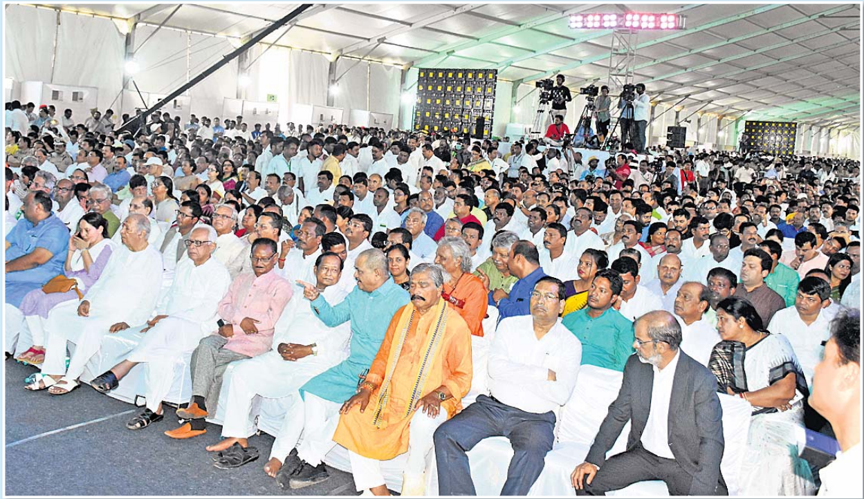
ଶପଥଗ୍ରହଣ ଉତ୍ସବରେ ଯୋଗ ଦେଇଥିବା ବିଶିଷ୍ଟ ବ୍ୟକ୍ତି ।