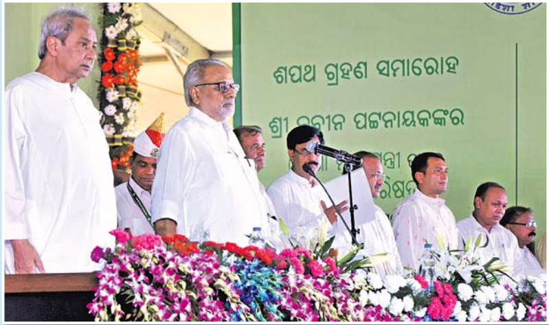
ଜାତୀୟ ସଙ୍ଗୀତ ଗାନ ବେଳେ ରାଜ୍ୟପାଳ ଓ ମୁଖ୍ୟମନ୍ତ୍ରୀଙ୍କ ସମେତ ମନ୍ତ୍ରୀମଣ୍ଡଳ ଛିଡ଼ା ହୋଇ ସମ୍ମାନ ଜଣାଇଛନ୍ତି ।