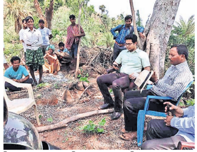
ତିଡ଼ିଲିରେ ପ୍ରାଣ ହରାଇଥିବା ସ୍ଥାନରେ ଉପସ୍ଥିତ ଗ୍ରାମବାସୀ ଓ ପ୍ରଶାସନିକ ଅଧିକାରୀମାନେ ।

ନେତୃତ୍ୱ ଦେଖାଇ ନିଆଯାଇଛି । ଏହି ନୂତନ ସ୍ଥାନରେ ଭୟଙ୍କର ବାତ୍ୟା ସମୟରେ ମଧ୍ୟ ଭୟାନକ ଅଭାବ କମ୍ ରହିବ ।