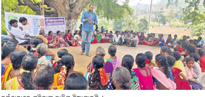
କର୍ମଶାଳାରେ ମହିଳାଙ୍କୁ ତାଲିମ ଦିଆଯାଇଛି ।

ପଟାଳି, ୨୯/୫(ଡି.ଏନ୍.ଏ.): ପଟାଳି ବ୍ଲକ୍ ଅନ୍ତର୍ଗତ ରାଜେନ୍ଦ୍ରପୁର ପଞ୍ଚାୟତରେ ଏକ ସଂସ୍କାର କରାଯିବା ପରେ ସୂର୍ଯ୍ୟପୂଜା, ଅଗ୍ନିସଂସ୍କାର ଓ ହୋମଯଜ୍ଞ ଆରମ୍ଭ ହୋଇଥିଲା।