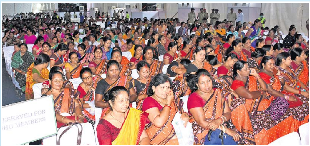
ସମାରୋହରେ ଯୋଗ ଦେଇଥିବା ସ୍ୱୟଂ ସହାୟିକା ଗୋଷ୍ଠୀର ସଦସ୍ୟା ।