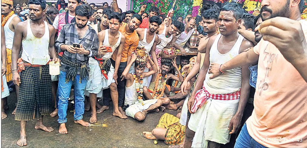
ଘଟସହ ଶୋଭାଯାତ୍ରା ଅଞ୍ଚଳ ପରିକ୍ରମା କରୁଛି ।