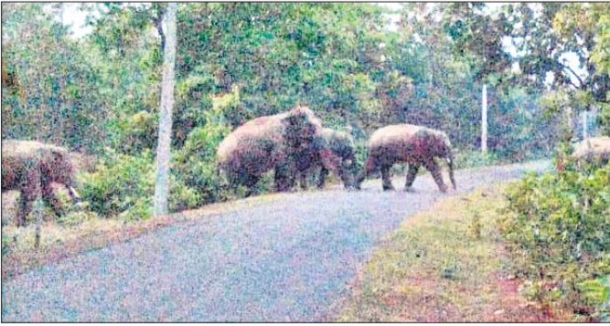
ନୀଳଗିରିକୁ ପଶିଲେ ଝାଡ଼ିଘଣ୍ଟ ହାତୀପଲ ।

ବାଲେଶ୍ୱର ଜିଲା ନୀଳଗିରି ଅଞ୍ଚଳକୁ ୨୮ଟି ଝାଡ଼ିଘଣ୍ଟ ହାତୀ ପୁଣି ପଶି ଆସିଛନ୍ତି। ଦନ୍ତାହାତୀ ଏହି ହାତୀ ପଲକୁ ବାଟ କଡ଼ାଇ ନେଉଥିବା ବେଳେ ପ୍ରାୟଦଳରେ ୫ଛୁଆ ହାତୀରହିଛନ୍ତି । ୨୦୧୦ରୁ ଝାଡ଼ିଘଣ୍ଟ ହାତୀପଲ ପ୍ରତିବର୍ଷ ଓଡ଼ିଶା ସୀମା ପାର ହୋଇ ମୟୂରଭଞ୍ଜ ଦେଇ ନୀଳଗିରି ବନାଞ୍ଚଳକୁ ନିୟମିତ ଭାବେ ଆସି ପୁଣି ଫେରି ଯାଉଛନ୍ତି । ପୂର୍ବରୁ ବର୍ଷକୁ ଥରେ କିମ୍ବା ଦୁଇଥର ଆସୁଥିବା ବେଳେ ଚଳିତ ବର୍ଷ ସେମାନେ ୩ ଥର ଆସିଥିବା ବନାଞ୍ଚଳବାସୀ ଓ ବନ କର୍ମଚାରୀଙ୍କ ନିଦ ହଜାଇଛି । ବନ ବିଭାଗ ସୂତ୍ରରୁ ମିଳିଥିବା ସୂଚନା ଅନୁଯାୟୀ ଏହି ହାତୀପଲ ଝାଡ଼ିଘଣ୍ଟର ଦଲମା ଅଜୟାରଣ୍ୟରୁ ଚିରାଚରିତ ଚଲାପଥରେ ମୟୂରଭଞ୍ଜର ନଡ଼ପୁର