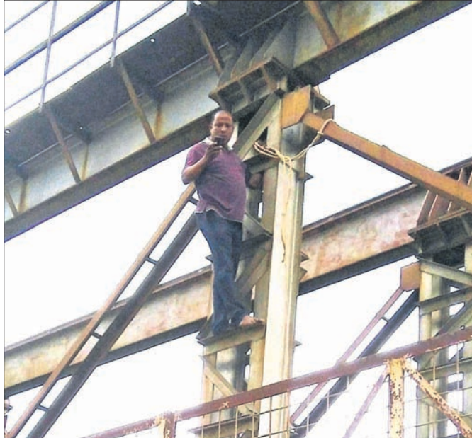
ବ୍ୟାରେଜ ଉପରୁ ଚଢ଼ିଯାଇଛନ୍ତି ପୁଣ୍ୟାତ୍ମ।

ଅନୁଗୋଳ ଜିଲ୍ଲା କଟକରୁ ନିକଟରେ ସମଲ ବ୍ୟାରେଜକୁ ନିକଟରେ ପାଣି ମିଳୁ ନ ଥିବା ଉପରୁ ଉପରୁ ଆତ୍ମହତ୍ୟା ଚେତାବନୀ ଦେଇଥିଲେ।