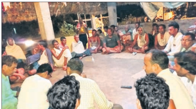
ସାହିବାସୀ ବୈଠକ କରୁଛନ୍ତି।

ଅନୁଗୋଳ ଜିଲ୍ଲା ବଡ଼କା ଥାନା ଅଞ୍ଚଳରେ ଚୋରି ଘଟଣା ବୃଦ୍ଧି ପାଇଛି। ପୋଲିସ ଗ୍ରାମାଞ୍ଚଳବାସୀଙ୍କ ଧନକ୍ଷତିରୁ ରକ୍ଷା ଉପରେ ଗୁରୁତ୍ୱ ଦେଇ ନ ଥିବାରୁ ଗାଁ ଲୋକେ ଏଣିକି ନିଜେ ରାତି ଉଜାଗର ହୋଇ ସାହି ଜଗିବାକୁ ବିଭିନ୍ନ ଗ୍ରାମରେ ବୈଠକ କରି ନିଷ୍ପତ୍ତି ନେଉଥିବା ଜଣାପଡ଼ିଛି।