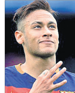
ନେଲ ଖବରଦାତା ସମ୍ବିଳନୀରେ ସୂଚନା ଦେବାର କାର୍ଯ୍ୟକ୍ରମ ରହିଛି।

ସାଓ ପାଉଲୋ, ୩୦।୭ (ଏସପି): ବ୍ରାଜିଲ ଫୁଟବଲ ପୁସ୍ତକାଳୟ ନେମାରଙ୍କ ବିରୋଧରେ ଆସିଥିବା ବଳାଙ୍ଗାର ଅଭିଯୋଗର ତଦନ୍ତ ଶେଷ ହୋଇଛି।