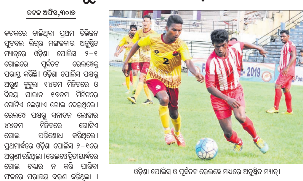
ଓଡ଼ିଶା ପୋଲିସ ଓ ପୂର୍ବତତ ରେଲଝେ ମଧ୍ୟରେ ଅନୁଷ୍ଠିତ ମ୍ୟାଚ୍।