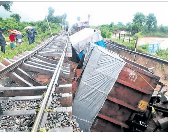
ରାୟଗଡା ଅଫିସ୍/ପୁନିଗୁଡା/ ଅଧ୍ୟାପକା ଡା. (ଡି.ଏ.ଏ.ଏ.)

ରାୟଗଡ଼ା ଜିଲ୍ଲାରେ ଗତ ୪୦ ଘଣ୍ଟା ଅଧିକ ସମୟ ଧରି ଲଗାଣ ବର୍ଷା ଯୋଗୁ ବନ୍ୟା ପରିସ୍ଥିତି ସୃଷ୍ଟି ହୋଇଛି।