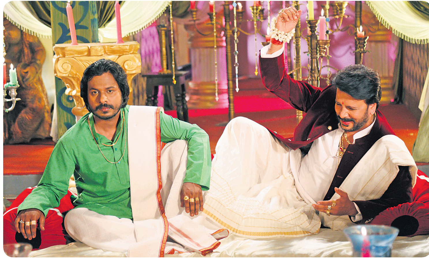
'ନାୟକର ନାଁ ଦେବଦାସ' ଚଳଚ୍ଚିତ୍ରରେ ଅସିଦ୍-ବବି ।

ପାଲଟି ଯାଆନ୍ତି । ଚଳିତ ଯାତ୍ରା ସିକନରେ ଅପେରା ସୂର୍ଯ୍ୟମନ୍ଦିର ଦ୍ୱାରା ପରିବେଷିତ ହେବାକୁ ଯାଉଥିବା ନାଟକ 'କାହାଣୀ କହୁଛି ସୂର୍ଯ୍ୟମନ୍ଦିର, ପୁଅ ଯିବ ଶାଶୁଘର, ମାୟାବିନୀ ମୌସୁମୀ, ଭିତ୍ତି କଥା'ରେ ବୁଦ୍ଧିକୁ ମିଳିଛି ମନଲାଖି ଭୂମିକା । ଏହି ଯୋଡ଼ି ଅଭିନୀତ ପ୍ରମୁଖ ନାଟକଗୁଡ଼ିକ ମଧ୍ୟରେ ରହିଛି, 'ହସୁଛି କେବଳ କାହିବା ପାଇଁ, ସାତା ଦେବେ ଆଜି ଅଗ୍ନି ପରୀକ୍ଷା, ରାଖୀ ଦେବଗଲା ଆଖିରେ ଲୁହ ଏବଂ ଦିନକ ପାଇଁ ପୁଁ ଟ୍ରୋପିକା ହେବି' ଆଦି ନାଟକ । ନାଟକ ଅନୁସାରେ କମେଡିକୁ ଅଧିକ ପ୍ରାଧାନ୍ୟ ଦିଆଯିବା ଉପରେ ଗୁରୁତ୍ୱାରୋପ କରନ୍ତି ଏହି ଚର୍ଚ୍ଚିତ କମେଡି ଯୋଡ଼ି ।