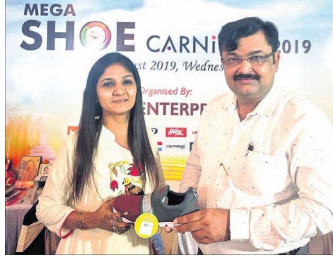
ଭୁବନେଶ୍ୱର, ୭-୮ (ବ୍ୟୁରୋ)