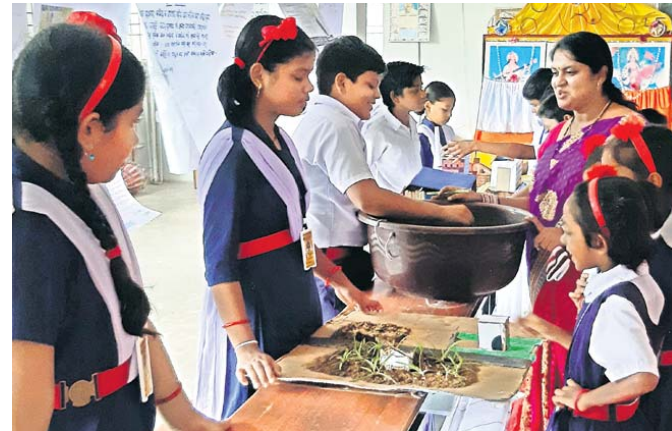
ପ୍ରକଳ୍ପଗୁଡ଼ିକୁ ଛାତ୍ରା ଓ ଅନ୍ୟମାନେ ଭୁଲି ଦେଖୁଛନ୍ତି ।