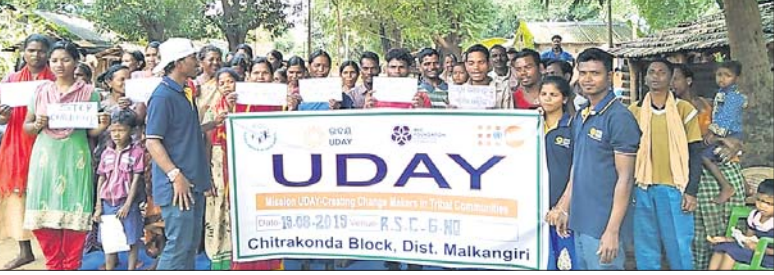
ସଚେତନତା କାର୍ଯ୍ୟକ୍ରମରେ ବାହାରିଥିବା ଶୋଭାଯାତ୍ରା।