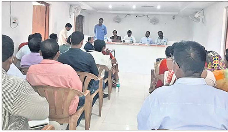
ପଞ୍ଚାୟତ ସମିତି ବୈଠକରେ ମହାଧାରଣ ଅତିଥି।

ମାଲକାନଗିରି ଜିଲ୍ଲା କୋରୁକୋଣ୍ଡା ବ୍ଲକରେ ପଞ୍ଚାୟତ ସମିତି ବୈଠକ ଅନୁଷ୍ଠିତ ହୋଇଯାଇଛି।