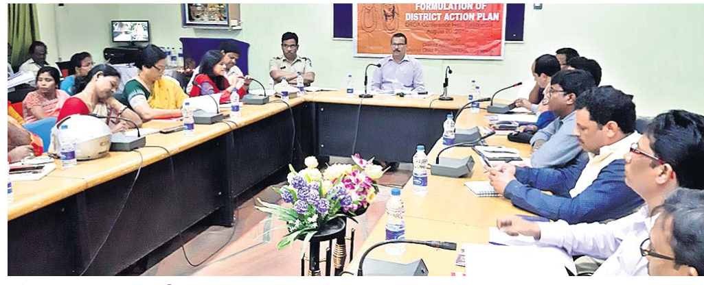
ବୈଠକରେ ଯୋଗ ଦେଇଥିବା ଜିଲ୍ଲାପାଳ ଓ ଅନ୍ୟମାନେ ।