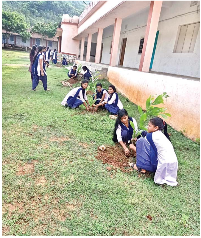
ଗୁଣପୁର କଲେଜଠାରେ ତାପାୟ ସେବାଯୋଜନା ଗତି ଯୁକ୍ତି ପକ୍ଷରୁ ଆୟୋଜିତ ବୃକ୍ଷରୋପଣ କାର୍ଯ୍ୟକ୍ରମରେ ଛାତ୍ରମାନେ ତାପାୟୋପଣ କରୁଛନ୍ତି ।