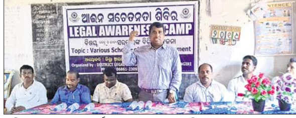
ଅତିଥି ଆଇନସେବା ସମ୍ପର୍କରେ ଅବଗତ କରାଉଛନ୍ତି।

ଜିଲ୍ଲା ଆଇନ ସେବା ପ୍ରାଧିକାରୀ ମାଲକାନଗିରି ପକ୍ଷରୁ ମାଲକାନଗିରି ଜିଲ୍ଲା ଆଇନ ସେବା ପ୍ରାଧିକାରୀଙ୍କ ଦ୍ୱାରା ଆଇନ ସଚେତନତା ଶିବିର ଅନୁଷ୍ଠିତ ହୋଇଯାଇଛି।