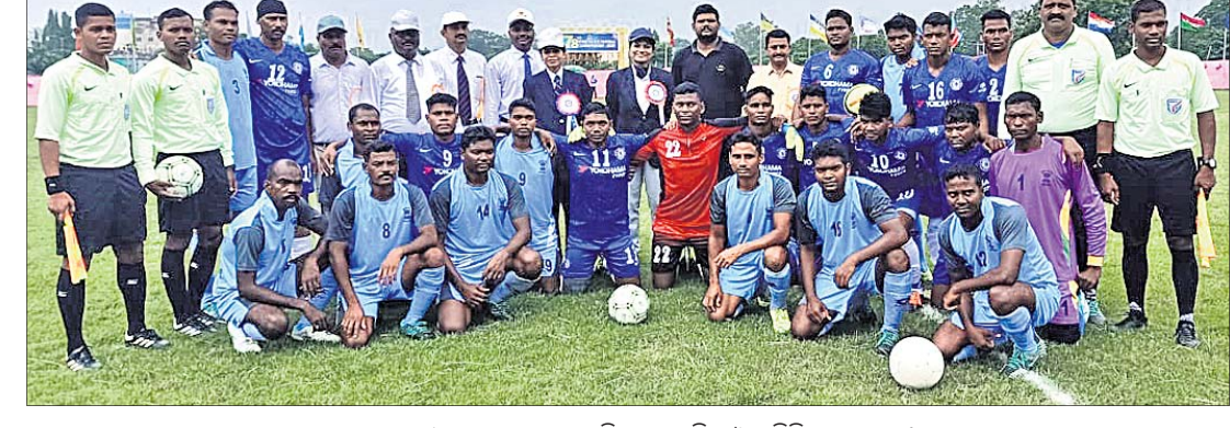
ଉନ୍‌ସାଟିତ ଅବସରରେ ଖେଳାଳିମାନେ ଅତିଥି ଓ ଅତିସାଥୀଙ୍କ ସହ।

ଖାରବୁଡୁଆ ଓଏସଏପି ୨ୟ ବାଗାଲିୟନ ୨-୦ ଗୋଲରେ ବିଜୟୀ ହୋଇଛି। ତୃତୀୟ ମ୍ୟାଚ୍ ୧ମ ଆଇଆରବିଏନ୍ କୋରାପୁଟ ଏବଂ ଜଗତସିଂହପୁର ପୋଲିସ୍ ଦଳ ମଧ୍ୟରେ ଖେଳ ଅନୁଷ୍ଠିତ ହୋଇଥିଲା। ଏଥିରେ ଗ୍ରାଜବେକର ଜିଆରେ ଜଗତସିଂହପୁର ଦଳ ବିଜୟୀ ହୋଇଥିଲେ। ଚତୁର୍ଥ ମ୍ୟାଚ୍ ଓଏସଏପି ଷଷ୍ଠ ବାଗାଲିୟନ କଟକ ବନାମ ରାଉରକେଲା ଏସଆରପି ମଧ୍ୟରେ ଅନୁଷ୍ଠିତ ମ୍ୟାଚରେ ଓଏସଏପି ଷଷ୍ଠ ବାଗାଲିୟନ କଟକ ୬-୦ରେ ବିଜୟୀ ହୋଇଛି। ପଞ୍ଚମ ମ୍ୟାଚ୍ ଓଏସଏପି ତୃତୀୟ ବାଗାଲିୟନ କୋରାପୁଟ ବନାମ ୫ମ ଆଇଆରବିଏନ୍ ବୌଦ ମଧ୍ୟରେ ଅନୁଷ୍ଠିତ ହୋଇଥିଲା। ଏଥିରେ ଓଏସଏପି ୩