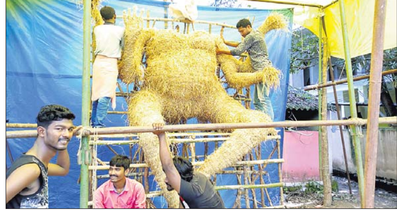
ଗଣେଶ ପୂର୍ଣ୍ଣ ନିର୍ମାଣରେ ମନ୍ତ୍ର ଶିଳ୍ପୀ।

ପାଖେଇ ଆସୁଛି ଗଣେଶ ପୂଜା। ମାଲକାନଗିରି ଜିଲ୍ଲାରେ ଗଜନିନକ ପୂଜାର୍ଚ୍ଚନା ପାଇଁ ଆରମ୍ଭ ହୋଇଗଲାଣି ପ୍ରସ୍ତୁତି।