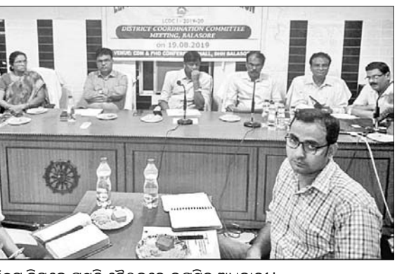
କୁଷ୍ଠ ରୋଗୀ ଚିହ୍ନଟ ନିମନ୍ତେ ପ୍ରସ୍ତୁତ ବୈଠକରେ ଉପସ୍ଥିତ ଅଧିକାରୀ।

ବାଲେଶ୍ୱର ଜିଲ୍ଲା ପୁଖ୍ୟ ଚିକିତ୍ସାଳୟ ସମ୍ମିଳନୀ କକ୍ଷରେ କୁଷ୍ଠ ରୋଗୀ ଚିହ୍ନଟକରଣ ନିମନ୍ତେ ଜିଲ୍ଲା ସଂଯୋଜନା କମିଟି ବୈଠକ ଅନୁଷ୍ଠିତ ହୋଇଯାଇଛି।