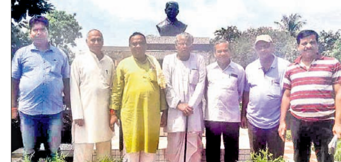
ବିଧାୟକଙ୍କ ସହିତ କର୍ମକର୍ମୀମାନେ।

କଟୁପଦା, ୨୦୧୮ (ଡି.ଏନ୍.ଏ.)- ଆସନ୍ତା ୧୦ ତାରିଖରେ କଟୁପଦା ରୁକ୍ ଅଧୀନ ମୟୂରଭଞ୍ଜର ବାଲ୍ୟାୟତୀଙ୍କୁ ସ୍ମୃତି ପୀଠରେ ବନ୍ଦୀଦାନ ଦିବସ ପାଳିତ ହେବ।