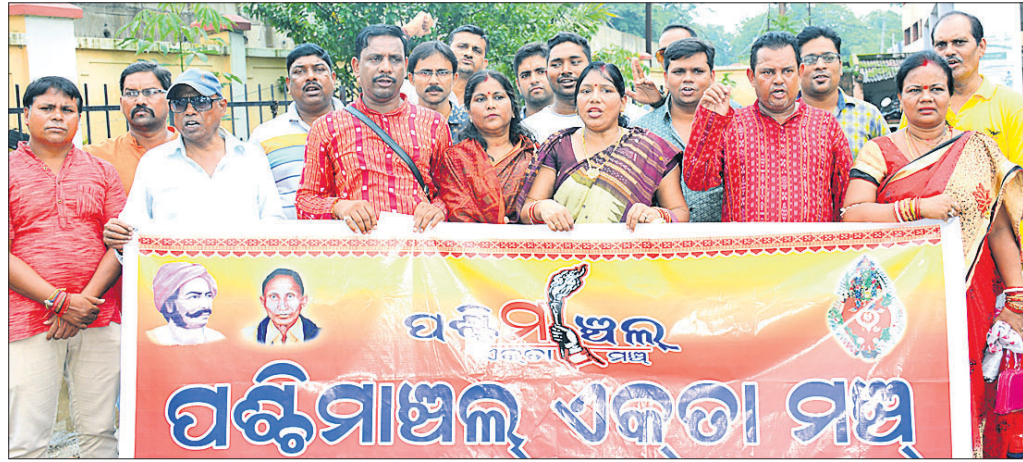
ସମ୍ବଲପୁର ସମ୍ବିମାନଙ୍କ ଏକତାମଞ୍ଚ ପକ୍ଷରୁ ବିକ୍ଷୋଭ ଓ ରାଲି।

ଏଣିକି ବିଦ୍ୟୁତ୍ ଚୋରି ରୋକିବା ପାଇଁ ରାଜ୍ୟରେ ସ୍ମାର୍ତ୍ତ ପ୍ରସାରଣ କାର୍ଯ୍ୟ ଆରମ୍ଭ ହେଉଛି। ସମ୍ବଲପୁର ଓ ରାଉରକେଲାକୁ ପ୍ରଥମେ ଲାଗିବ ବୋଲି କେନ୍ଦ୍ର ସରକାରର ପକ୍ଷରୁ କୁଳନେତ୍ରୀଙ୍କୁ ସୂଚନା ଦିଆଯାଇଛି।