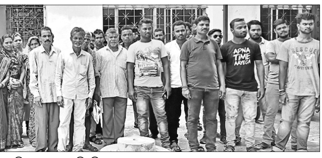
ମଦ ଦୋକାନକୁ ବିରୋଧ କରି ଗ୍ରାମବାସୀ ଅବକାରୀ ଅଫିସ୍ ଯେଉଁଠାରେ କରୁଛନ୍ତି।

ବାଲେଶ୍ୱର ଅଫିସ, ୨୦୧୮: ରାଜ୍ୟ ସରକାରଙ୍କ ଗ୍ରାମୀଣ ଓ ଯୁବସେବା ବିଭାଗ ଦ୍ୱାରା ଜିଲ୍ଲାରେ ଥିବା ଯୁବକ ସଂଘଗୁଡ଼ିକୁ ଆର୍ଥିକ ସହାୟତା ଭାଗି ଦରଖାସ୍ତ ଆହ୍ୱାନ କରାଯାଇ ଥିବାବେଳେ ଏହାର ଆବେଦନ ସମୟସୀମାକୁ ବୃଦ୍ଧି କରାଯାଇଛି।