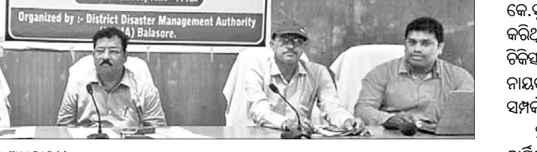
ବିପର୍ଯ୍ୟୟ ମୁକାବିଲା ତାଲିମ ଶିବିରରେ ଉପସ୍ଥିତ ଅଧିକାରୀ।

ରହିବେ। ଅଭିଯାନକୁ ଅଧିକ କ୍ରିୟାଶୀଳ କରିବା ପାଇଁ ପୂର୍ବରୁ ଉପସ୍ଥିତ ଅଧିକାରୀଙ୍କୁ ଏକ ସ୍ୱତନ୍ତ୍ର ତାଲିମ କାର୍ଯ୍ୟକ୍ରମ ଅନୁଷ୍ଠିତ ହେବ। ଅଭିଯାନରେ ସଚେତନ ତଥ୍ୟ ସେପ୍ଟେମ୍ବର ୩୦ତାରିଖ ସୁଦ୍ଧା ରାଜ୍ୟ କାର୍ଯ୍ୟାଳୟରେ ଦାଖଲ କରାଯିବ ବୋଲି ଜଣାପଡ଼ିଛି।