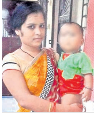
ମା' କୋଳରେ ଉତ୍ତର ଶିଶୁ।

ଜଣେ ମହିଳା ନିଜ ଦେହବର୍ତ୍ତୀ ନାତିକୁ ୨୦ହଜାର ଟଙ୍କାରେ ବିକି କରିବା ଘଟଣା ବାଲେଶ୍ଵର ଜିଲ୍ଲା ଖଇରା ଥାନା ଅଞ୍ଚଳରେ ଘଟଣା ସୃଷ୍ଟି କରିଛି।