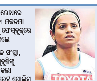
ପ୍ରମୁଖ ବିରୋଧରେ ମାନ୍ଦିରୀ ମନକମା କରିବାକୁ ଫେସ୍‌ବୁକ୍‌ରେ ପୋଷ୍ଟ କଲେ। ପ୍ରଯୋଜକ ସଂସ୍ଥା, ଲିଙ୍ଗନ ସ୍ତୁରୁକିଙ୍କୁ ନେତୃତ୍ଵ କରି କମିଶନରେଟ୍ ପୋଲିସ୍

କୌଣସି ଶତ୍ରୁତା ନାହିଁ କିମ୍ବା ତାଙ୍କ ସହ କଥାବାର୍ତ୍ତା ମଧ୍ୟ ହୁଅନ୍ତି ନାହିଁ। ଫିଲ୍ମ ପୋଷ୍ଟରଟି ନାରୀ ସମାଜକୁ ବଦନୀୟ କରୁଥିବାରୁ ପୁଁ ଏହାକୁ ବିରୋଧ କରିଥିଲି।