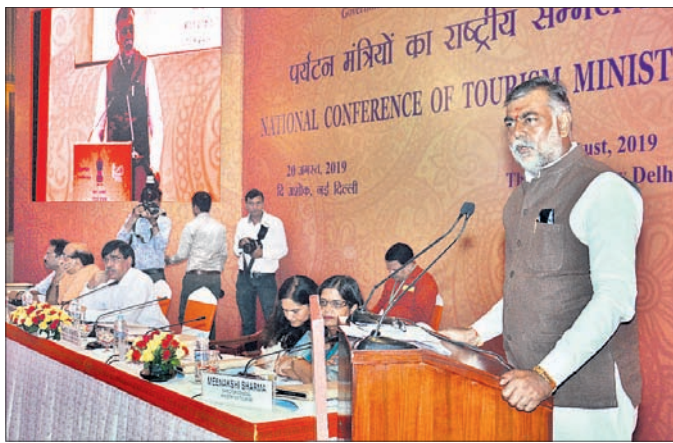
କାତାୟ ସମ୍ମିଳନୀରେ କେନ୍ଦ୍ର ପର୍ଯ୍ୟଟନ ମନ୍ତ୍ରୀ ପ୍ରହ୍ଲାଦ ସିଂ ପଟେଲ ଭଦ୍ରାଧ୍ୟାୟନ ଦେଉଛନ୍ତି।

ଆଦର୍ଶ ପର୍ଯ୍ୟଟନସ୍ଥଳୀ ତାଲିକାରେ ସାମିଲ ହେବ ଓଡ଼ିଶା। ଖୁବ୍ଶୀଘ୍ର ରାଜ୍ୟର ଗୋଟିଏ କିମ୍ବା ଦୁଇଟି ପର୍ଯ୍ୟଟନସ୍ଥଳୀକୁ ମିଳିବ ଆଦର୍ଶ ପର୍ଯ୍ୟଟନସ୍ଥଳୀର ମାନ୍ୟତା।