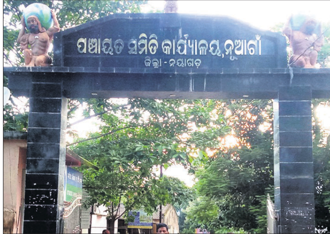
ନୂଆଗାଁ ବୁକ କାର୍ଯ୍ୟକ୍ରମ ।

ସ୍ୱଚ୍ଛ ଭାରତ ମିଶନ ମାଧ୍ୟମରେ ଦେଶର ପ୍ରତ୍ୟେକ ପରିବାରକୁ ଘରୋଇ ପାଇଖାନା ଯୋଗାଇଦେବା ପାଇଁ ସରକାର ପ୍ରତିଜ୍ଞିତବନ୍ଧ । ହେଲେ କେତେଜଣ କର୍ମଚାରୀଙ୍କ ଅବହେଳା ଯୋଗୁ ଏହାର ସୁଫଳ ଲୋକମାନେ ପାଇପାରୁ ନାହାନ୍ତି । ନୟାଗଡ଼ ଜିଲ୍ଲା ନୂଆଗାଁ ବୁକରେ ଏହାର ନମୁନା ଦେଖିବାକୁ ମିଳିଛି । ବୁକ ଅନ୍ତର୍ଗତ ଜାକେଡା, ଗୁମା, କାପ୍ତାପଲ୍ଲୀ ପଞ୍ଚାୟତରେ ଅନେକ ଆଦିବାସୀ ପରିବାର ଏହି କାର୍ଯ୍ୟକ୍ରମ କରିଆରେ ଘରୋଇ ପାଇଖାନା ପାଇବାରୁ ବଞ୍ଚିତ ହୋଇଛନ୍ତି । ଘରୋଇ ପାଇଖାନା ନିର୍ମାଣ କାର୍ଯ୍ୟ ପୁରାତୁରୁପେ କୁଲାଇବା ପାଇଁ ପ୍ରଥମେ ଏକ ବେସ୍ ଲାଇନ ସର୍ଭେ କରାଯାଇଥିଲା । ସେଥିରେ ନୂଆଗାଁ ବୁକର ୨୫୯୨୩ ହିତାଧିକାରୀଙ୍କ ନାମ ପଞ୍ଜୀକୃତ ହୋଇ ପ୍ରଥମ ପର୍ଯ୍ୟାୟରେ ୪୯୯୦ ହିତାଧିକାରୀଙ୍କ ପାଇଖାନା ନିର୍ମାଣ କାର୍ଯ୍ୟ ଶେଷ ହୋଇଥିଲା । ଦ୍ୱିତୀୟ ପର୍ଯ୍ୟାୟ ତାଲିକାରେ ୨୦୯୨୩ ହିତାଧିକାରୀଙ୍କ ପାଇଖାନା ନିର୍ମାଣ ୨୦୧୯ ଅକ୍ଟୋବର ପୂର୍ଣ୍ଣା କରାଯାଇବ ।