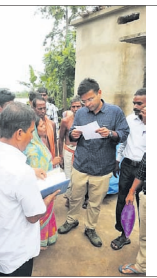
ଜିଲାପାଳ ସମର୍ଥ ବର୍ମା ଗ୍ରାମବାସୀଙ୍କ ସମସ୍ୟା ରୁଝିଛନ୍ତି। ଷ୍ଟ୍ରକ୍ଚରାଲ ଗ୍ଲାପନ, ଏମ୍ବ୍ଲିକ୍ଷନ ଆରକ୍ଷିତ୍ୱରେ ଅନୁମୋଦିତ ହୋଇଥିବା କାର୍ଯ୍ୟାରମ୍ଭ ପାଇଁ ନିର୍ଦ୍ଦେଶ ଦେଇଥିଲେ।

ପ୍ରତିଷ୍ଠିତ ଦେଇଥିଲେ। ଏଥିସହ ବିଦ୍ୟାଳୟର ପାଠେଇ ନିର୍ମାଣ ଓ କୁମ୍ଭୀର ଉପଦ୍ରବ୍ୟରୁ ରକ୍ଷା ପାଇବା ପାଇଁ ନଜର ରାଖିଥିଲେ। ଟୁରେ ଡାକ ଲାଗି ଲଗାଇବାକୁ ବନ ବିଭାଗକୁ ନିର୍ଦ୍ଦେଶ ଦେଇ ଥିଲେ। ଏଥିସହ ନଜିରେ ଅଧିକ ୪ଟି ଗାଧୁଆ ଟୁର ନିର୍ମାଣ କରିବାକୁ ରୁଝି ଦେଇଥିଲେ। ଏ ଥି ସ ହ ଆଇ.କା.କା.ର ଗ ପାଇଁ ୧୫ ଦିନ ମଧ୍ୟରେ ଏକ ଜିଲାପାଳ ସମର୍ଥ ବର୍ମା ଗ୍ରାମବାସୀଙ୍କ ସମସ୍ୟା ରୁଝିଛନ୍ତି। ଷ୍ଟ୍ରକ୍ଚରାଲ ଗ୍ଲାପନ, ଏମ୍ବ୍ଲିକ୍ଷନ ଆରକ୍ଷିତ୍ୱରେ ଅନୁମୋଦିତ ହୋଇଥିବା କାର୍ଯ୍ୟାରମ୍ଭ ପାଇଁ ନିର୍ଦ୍ଦେଶ ଦେଇଥିଲେ। ଗ୍ରାମର କଂକ୍ରିଟ