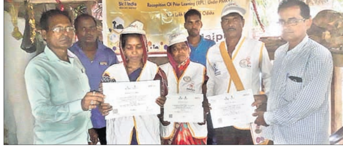
ସଫଳ କୃଷି ଉଦ୍ୟୋଗୀଙ୍କୁ ପ୍ରମାଣପତ୍ର ପ୍ରଦାନ କରାଯାଇଛି।