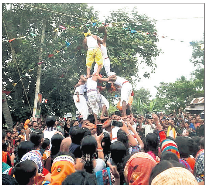
ଈଚ୍ଛାପୁରରେ ଯୁବକମାନେ ଦଧିହାଣ୍ଡି ଭାଙ୍ଗୁଛନ୍ତି।