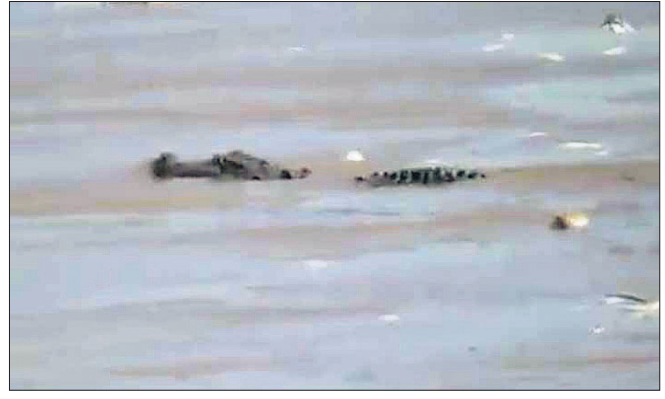
ମହାନଦୀରେ ଦେଖାଯାଇଥିବା କୁମ୍ଭୀର ।

ମହାନଦୀରେ ବନ୍ୟା ପରିସ୍ଥିତି ସୃଷ୍ଟି ହେବା ସମୟରେ ସାତକୋଶିଆ ବନ୍ୟପ୍ରାଣୀ ଅଭୟାରଣ୍ୟରେ ରହୁଥିବା କେତେକ କୁମ୍ଭୀର ଗଭୀର ଜଳ ସ୍ରୋତରେ ନଦୀର ତଳ ପୁଖୁକୁ ଚାଲି ଆସିଥିବା ଜଣାପଡ଼ିଛି । ଶୁକ୍ରବାର ପ୍ରାୟ ୭୦୦ ଟୁଣ୍ଡ ଲହରୀ ଗୋଟିଏ ଗୋମୁହାଁ କୁମ୍ଭୀର ହରୁମୁହୁସ୍‌ସାଏ ଗ୍ରାମ ନିକଟ ମହାନଦୀରେ ଦେଖିବାକୁ ମିଳିଥିଲା । ଏ ଘଟଣା ସ୍ଥାନୀୟ ଲୋକଙ୍କ ମଧ୍ୟରେ ଆତଙ୍କ ଖେଳାଇ ଦେଇଛି । ଏଭଳି ପରିସ୍ଥିତିରେ ବନ ବିଭାଗ କିମ୍ବା ବନ୍ୟ ପ୍ରାଣୀ ବିଭାଗ ପକ୍ଷରୁ କୁମ୍ଭୀରକୁ ସାତକୋଶିଆ ଗଣ୍ଡକୁ ଫେରାଇ ନେବା ପାଇଁ ପଦକ୍ଷେପ ଗ୍ରହଣ କରିବା ନିମନ୍ତେ ସାଧାରଣରେ ଦାବି ହୋଇଛି । ତେବେ ବନ୍ୟା