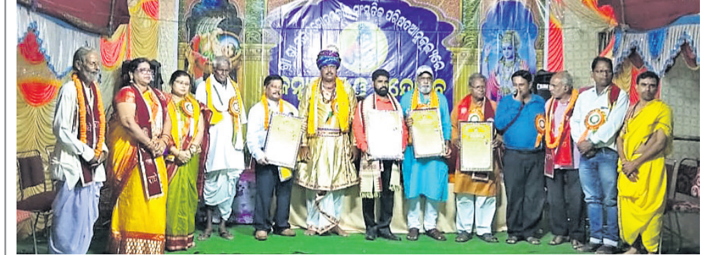
ମଦନମୋହନ ଜୀଉ ସାଂସ୍କୃତିକ ପରିଷଦ ପକ୍ଷରୁ ବିଭିନ୍ନ ବ୍ୟକ୍ତିଗଣଙ୍କୁ ସମ୍ମାନିତ କରାଯାଇଛି।

ଏଦିଗରେ ଗ୍ରାମର ଆବାଳକୃଷ୍ଣ ବ, ନିତାଳ ମଧ୍ୟରେ ବିଶେଷ ଉତ୍ସାହ ପରିଲକ୍ଷିତ ହୋଇଥିଲା। ସନ୍ଧ୍ୟାରେ ମଞ୍ଚରେ ପୂଜ୍ୟପୂଜାକୁ ସମ୍ମାନିତ କରାଯାଇଥିଲା। କଳା, ସାହିତ୍ୟ, ବିଜ୍ଞାନ, କ୍ରୀଡ଼ା, ଚିକିତ୍ସା, ସାମାଜିକ ସେବା ଆଦି କ୍ଷେତ୍ରରେ ପାରଦର୍ଶିତା ଲାଭକରିଥିବା ୪ଜଣ ବ୍ୟକ୍ତିଙ୍କୁ ପୂଜ୍ୟପୂଜା ସମ୍ମାନ ମିଳିଥିଲା।