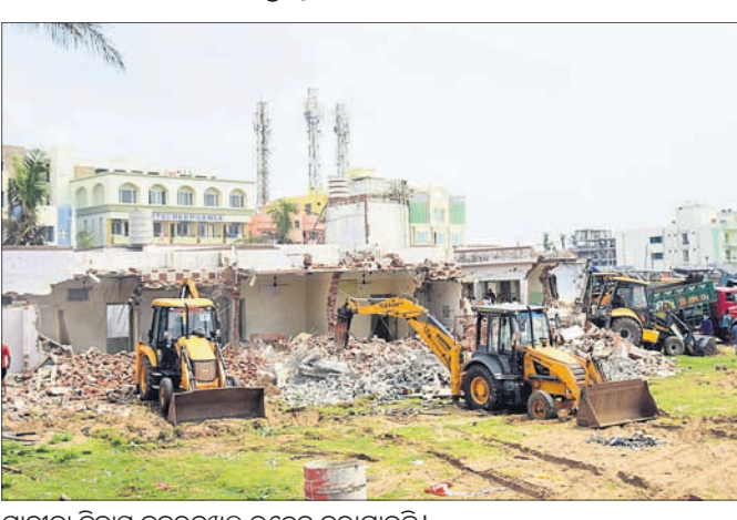
ଯାତ୍ରାକା ନିବାସ ଜବରଦଖଲ ଉଚ୍ଛେଦ କରାଯାଇଛି।

ପୁରୀ ଅଫିସ, ୨୪।୮ : ଏବେ ରାଜ୍ୟ ସରକାରଙ୍କ ଫୋକସରେ ପୁରୀ। ଏହି ପର୍ଯ୍ୟଟନ ସହରର ବିକାଶ ପାଇଁ ଶୁକ୍ରବାର ପୁଖ୍ୟମନ୍ତ୍ରୀ ୫୦୦ କୋଟି ଟଙ୍କା ପ୍ୟାକେଜ ଘୋଷଣା କରିବା ପରେ ଜିଲା ପ୍ରଶାସନ ଆହୁରି ତତ୍ପର ହୋଇପଡ଼ିଛି। ପୂର୍ବରୁ ପୁରୀ ପାଇଁ ମଧ୍ୟ ରାଜ୍ୟ ସରକାର ୨୬୫ କୋଟି ଟଙ୍କା ଘୋଷଣା କରିଥିଲେ। ୫ଟି ପ୍ରକଳ୍ପ ଲାଗି ଖର୍ଚ୍ଚ କରାଯିବାକୁ ଥିବା ଏହି ଅର୍ଥରେ ବୈଆପଣ୍ଡା ସମୁଦ୍ରକୂଳ ନିକଟସ୍ଥ ଯାତ୍ରାକା ନିବାସରେ ବହୁତଳ କାର୍ଯ୍ୟ ପାଇଁ ଏବଂ ଭେଣ୍ଟି ଜୋନ କରାଯିବାକୁ ଯୋଜନା ହୋଇଛି। ତେଣୁ ଶନିବାର ଜିଲା ପ୍ରଶାସନ ଯାତ୍ରାକାରେ ଥିବା ଜବରଦଖଲ ଉଚ୍ଛେଦ କରିଛି। ଏହା ପରିସରକୁ କୋଠା ଭାଙ୍ଗିଦେଇଛି। ଏହାକୁ ଲିଫ୍ଟ ନେଇଥିବା ଘରୋଇ ସଂସ୍ଥା ପ୍ରଶାସନର ନୋଟିସ୍ ପାଇବା ପରେ ମଧ୍ୟ କୋଠା ଖାଲି କରି ଦେଇ ବେଆଇନ ଭାବେ ସମ୍ପୂର୍ଣ୍ଣ ସଂସ୍ଥା ସରକାରୀ ଜମିକୁ ଜବରଦଖଲ କରି ରହିଥିଲା। ୧ ଏକର ୫୩ ଡେସିମିଟର ଏହି ସରକାରୀ ଜାଗାକୁ ଜବରଦଖଲରେ ରଖିଥିବାକୁ ଏହାକୁ ଉଚ୍ଛେଦ କରାଯାଇଛି। ସମ୍ପୂର୍ଣ୍ଣ ସଂସ୍ଥାକୁ ଜିନିଷପତ୍ର ଖାଲି ପୋଲିସ୍ ଫୋର୍ସ, ୨୭୫ ଏକ୍ସକ୍ସିକ୍ୟୁଟିଭ ମାଜିଷ୍ଟ୍ରେଟ୍ ଏବଂ ବରିଷ୍ଠ ପୋଲିସ୍ ଅଧିକାରୀମାନେ ଉପସ୍ଥିତ ଥିଲେ। ଏ ସମ୍ପର୍କରେ ଉପଜିଲାପାଳ