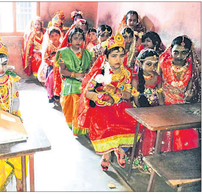
ନନ୍ଦ ଉତ୍ସବ ଉପଲକ୍ଷେ ଶନିବାର ରାଜନଗର ବ୍ଲକ୍ ସାନ୍ତବତ ଗୋପାଳପୁରରୁ ଶିବାନନ୍ଦ ବିଦ୍ୟାଳୟର ଛାତ୍ରାଛାତ୍ରୀଙ୍କୁ ରାଧାକୃଷ୍ଣ ବେଣା ।

ଏକ ସପ୍ତାହର କାର୍ଯ୍ୟକ୍ରମ ପ୍ରସଙ୍ଗରେ ଯଦି କୌଣସି କାର୍ଯ୍ୟକ୍ରମ ସ୍ଥାନିତ କରିବାକୁ ଚାହୁଁଛନ୍ତି ତେବେ ନିକଟସ୍ଥ ଧରିତ୍ରୀ ପ୍ରତିନିଧିଙ୍କ ସହ ଉପରୋକ୍ତ ମୋବାଇଲ୍ ନମ୍ବରରେ ଯୋଗାଯୋଗ କରନ୍ତୁ ।