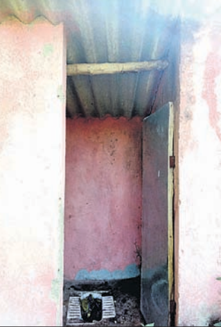
ସ୍ୱଚ୍ଛ ଭାରତ ମିଶନରେ ନିର୍ମିତ ପାଇଖାନା ।

ଯୋଜନା ରହିଥିବା ବେଳେ ଅଦ୍ୟାବଧି ପ୍ରାୟ ୭ ହଜାର ହିତାଧିକାରୀଙ୍କ ପାଇଖାନା ନିର୍ମାଣ ହୋଇପାରି ନାହିଁ । ସେହିପରି ବୁକଟି ଯାକ ତାଲିକାରୁ ବାଦ୍ ପଡ଼ିଥିବା ବଡ଼ଜିରି, ତାକୁଡା, ଲୁଣି, ବୁକର ୨୫୯୨୩ ହିତାଧିକାରୀଙ୍କ ନାମ ପଞ୍ଜୀକୃତ ହୋଇ ପ୍ରଥମ ପର୍ଯ୍ୟାୟରେ ୪୯୯୦ ହିତାଧିକାରୀଙ୍କ ପାଇଖାନା ନିର୍ମାଣ କାର୍ଯ୍ୟ ଶେଷ ହୋଇଥିଲା । ଦ୍ୱିତୀୟ ପର୍ଯ୍ୟାୟ ତାଲିକାରେ ୨୦୯୨୩ ହିତାଧିକାରୀଙ୍କ ପାଇଖାନା ନିର୍ମାଣ ୨୦୧୯ ଅକ୍ଟୋବର ପୂର୍ଣ୍ଣା କରାଯାଇବ ।