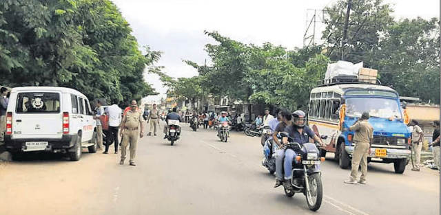
ଗଭୀର ପୋଲିସ ପକ୍ଷରୁ ଯାଞ୍ଚ କରାଯାଇଛି ।

ନୟାଗଡ଼ ସହରର ଓଡ଼ିଆ ଛକଠାରୁ କୋଏନା ହୋଟେଲ ପର୍ଯ୍ୟନ୍ତ ରାସ୍ତାରେ ବୁଡ଼ ଗତିରେ ବାଇକ୍ ଚାଳନା ନେଇ ଖବର ପ୍ରକାଶ ପାଇବା ପରେ ଶନିବାର ପୋଲିସ ପକ୍ଷରୁ ଯାଞ୍ଚ କରାଯାଇଛି । ନୟାଗଡ଼ ସ୍ୱୟଂଶାସିତ ମହାବିଦ୍ୟାଳୟ ସମ୍ମୁଖରେ ଶନିବାର ଯାଞ୍ଚ କରାଯାଇ ଜରିମାନା ବାଦଦକୁ ୩୯୦୦ ଟଙ୍କା ଆଦାୟ କରାଯାଇଛି । ସେହିଭଳି ସିଡ଼ରେ ଯାଉଥିବା ଜଣେ ଯୁବକ ନିଜ ବାଇକ୍ ଛାଡ଼ି ଫେରାର ହୋଇଯାଇଥିବାରୁ ଉକ୍ତ ବାଇକ୍ ଜବତ କରାଯାଇଛି । ପ୍ରକାଶ ଯେ, ଉକ୍ତ ରାସ୍ତାରେ ଯୁବକମାନେ ସିଡ଼ ବାଇକ୍ ଚଳାଇବା ଦ୍ୱାରା ବିଭିନ୍ନ ସମୟରେ