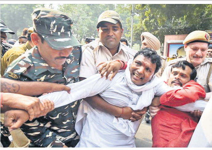
ବିପ୍ରମୁଖରାଜକୁ ୩ ବର୍ଷ ପୂରିତହେବାବେଳେ ନୂଆଦିଲ୍ଲୀରୁ ଆର୍ଦ୍ଧଶତାବ୍ଦୀ ସମ୍ମୁଖରେ କେନ୍ଦ୍ର ବିରୋଧରେ ବିରୋଧରତ ଯୁବ କଂଗ୍ରେସ ଅଧ୍ୟକ୍ଷ ଶ୍ରୀନିବାସ ଦି.ଭି.ଙ୍କୁ ପୋଲିସ ରିଟ ଫ କରନେଇଛି।