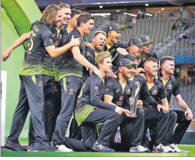
ସିରିଜ ବିଜୟ ପରେ ଗ୍ରୁପ୍ ସହ ଅଷ୍ଟ୍ରେଲିଆ ଖେଳାଳି ଷ୍ଟିଭ୍ ମନାଉଛନ୍ତି।

ବିରଳ ସଫଳତା ହାସଲ କରିଛି। ଏହି ବର୍ଷ ୮ଟି ଟି୨୦ ମ୍ୟାଚ୍ ଖେଳି ଅଷ୍ଟ୍ରେଲିଆ ୭ଟି ବିଜୟ ହାସଲ କରିଛି ଓ ଗୋଟିଏ ମ୍ୟାଚ୍ ବର୍ଷା କାରଣରୁ ବିନା ଫଳାଫଳରେ ଶେଷ ହୋଇଥିଲା।