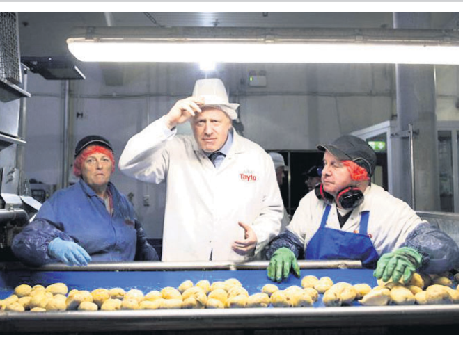
ସାଧାରଣ ନିର୍ବାଚନ ପାଇଁ ପ୍ରଚାରରେ ନର୍ଦନ ଆୟଲିଂ ଯାଇଥିବା ବ୍ରିଟେନ ପ୍ରଧାନମନ୍ତ୍ରୀ ବୋରିସ୍ ଜନ୍ସନ ତାହାଗୋଟିଏ କେସେଲ କ୍ରିସ୍ ଫ୍ୟାକ୍ଟିରେ।