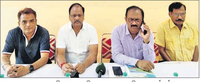
ଖବରବାତୀ ସମ୍ମିଳନୀରେ ଇଣ୍ଡିଆନ ଗେଟ୍‌ବଲ୍ ଯୁନିୟନର କର୍ମଚାରୀ।

ଗ୍ଲାନାୟ ରେଲଫ୍ରେ ଷ୍ଟାଡିୟମରେ ଇଣ୍ଡିଆନ ଗେଟ୍‌ବଲ୍ ଯୁନିୟନ ଆନୁକୂଲ୍ୟରେ ଶନିବାରଠାରୁ ଇଣ୍ଡିଆନ ଓପନ ଗେର୍ ବଲ୍ ଚୁନିମେଣ୍ଟ ଆରମ୍ଭ ହେବ। ଦୁଇଦିନ ଧରି ଆୟୋଜନ ହେବାକୁ ଥିବା ଏହି ଚୁନିମେଣ୍ଟରେ ଦେଶର କେତୋଟି ଦଳ ସହ କେତୋଟି ବିଦେଶୀ ଦଳ ମଧ୍ୟ ଅଂଶଗ୍ରହଣ କରିବେ। ଏଥି ସହ ଭୁବନେଶ୍ଵରରେ ଅଷ୍ଟମପଥର ପାଇଁ ଅନ୍ତର୍ଜାତୀୟ ଚୁନିମେଣ୍ଟ ଆୟୋଜନ ହେବାକୁ ଯାଉଛି। ବିଭିନ୍ନ ଦେଶର ୨୦-୩୦ ଖେଳାଳି ଏହି ଚୁନିମେଣ୍ଟରେ ଅଂଶଗ୍ରହଣ କରିବେ। ଏଥିରେ ହରିୟାଣା, ଚଣ୍ଡିଗଡ଼, ଦିଲ୍ଲୀ, ପଶ୍ଚିମବଙ୍ଗ, ଆସାମ ଓ ତ୍ରିପୁରା ଅଂଶଗ୍ରହଣ କରିବେ। ତେବେ ମହାରାଷ୍ଟ୍ର ଦଳ ବାତ୍ୟା 'ମହା' କାରଣରୁ ଚୁନିମେଣ୍ଟରେ ଅଂଶଗ୍ରହଣ କରିବାକୁ ଆସିପାରିନାହିଁ। ସେହିପରି ଓଡ଼ିଶାର ୭ଟି ଦଳ ମଧ୍ୟ ଏଥିରେ ଭାଗନେବେ। ଏଥିରେ ଗତ ୩ ଚାରିଖରେ ଅନୁଷ୍ଠିତ ଆନ୍ତର୍ଜାତୀୟ ଚୁନିମେଣ୍ଟର ୪ଟି ବିଜେତା ଦଳ ମଧ୍ୟ ସାମିଲ ରହିଛି। ଚୁନିମେଣ୍ଟରେ ଭାଗନେବାକୁ ଇଣ୍ଡୋନେସିଆ, ତାଇଫ୍, ଜାପାନ ଓ ଜାପାନ ଦଳ ମଧ୍ୟ ଏଠାରେ ପହଞ୍ଚି ସାରିଛନ୍ତି। ତେବେ ଆଇଲାଣ୍ଡ ବାତ୍ୟା 'ହୁଲ୍‌ହୁଲ୍' କାରଣରୁ ଆସିପାରିନାହିଁ