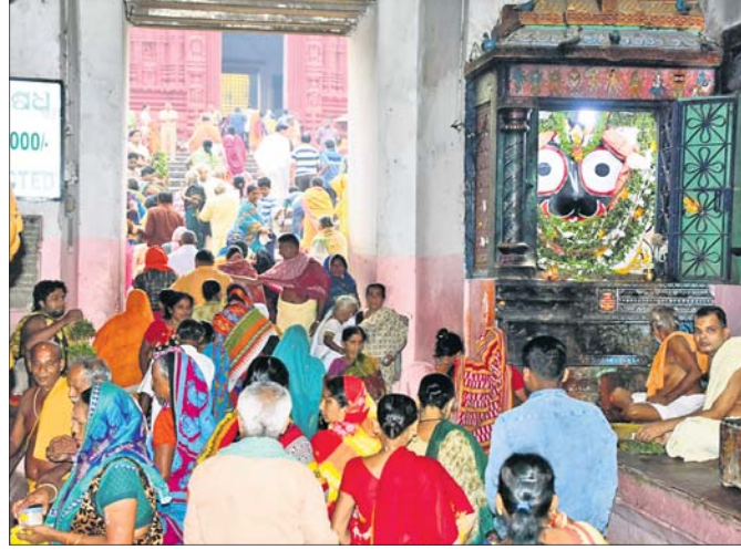
ପଞ୍ଚୁଲ ଅବସରରେ ଶ୍ରୀମନ୍ଦିରରେ ଶ୍ରଦ୍ଧାଳୁଙ୍କ ଭିଡ୍ ।

ପବିତ୍ର କାର୍ତ୍ତିକ ଶୁକ୍ଳ ଏକାଦଶୀଠାରୁ ଆରମ୍ଭ ହୋଇଛି ପଞ୍ଚୁଲ ବ୍ରତ । ଚଳଚ୍ଚିତ୍ର ହୋଇପାରିଛି ଶ୍ରୀକ୍ଷେତ୍ର । ବାଦ୍ୟ ବୁଲ୍‌ବୁଲ୍‌ର ଭାସ୍ ସହେ ହଜାର ହଜାର ଭକ୍ତଙ୍କ ଗହଳ ହୋଇଥିଲା । ପଞ୍ଚୁଲ ବ୍ରତ ପ୍ରଥମ ଦିନ ଅର୍ଥାତ୍ ଶୁକ୍ରବାର ମହାପ୍ରଭୁ ରତ୍ନସିଂହାସନରେ ଲକ୍ଷ୍ମୀନାରାୟଣ ବେଶ ତଥା ଠିଆକିଆ ବେଶରେ ଦର୍ଶନ ଦେଇଛନ୍ତି । ଦାରୁଦିଆଁଙ୍କ ଲକ୍ଷ୍ମୀନାରାୟଣ ବେଶ ଦର୍ଶନ ଲାଗି ଶ୍ରୀମନ୍ଦିରରେ ଶ୍ରଦ୍ଧାଳୁଙ୍କ ପ୍ରବଳ ଭିଡ୍ ହୋଇଥିଲା । ଶନିବାର କାର୍ତ୍ତିକ ଶୁକ୍ଳ ଦ୍ୱାଦଶୀ ତିଥିରେ ରତ୍ନସିଂହାସନରେ ମହାପ୍ରଭୁଙ୍କ ବାଙ୍କଚୂଡ଼ା ବେଶ ଅନୁଷ୍ଠିତ ହେବ । ସେହିପରି ୧୦ ତାରିଖରେ ତ୍ରିବିକ୍ରମ ବେଶ, ୧୧ରେ ଲକ୍ଷ୍ମୀନୃସିଂହ ବେଶ ଏବଂ ୧୨ ତାରିଖ ଅର୍ଥାତ୍ କାର୍ତ୍ତିକ ପୂର୍ଣ୍ଣିମାରେ ରାଜାଧିରାଜ ତଥା ମହାପ୍ରଭୁଙ୍କ ଦୁର୍ଲ୍ଲଭ ସୁନାବେଶ ଅନୁଷ୍ଠିତ ହେବ । ଭୋରକୁ ଦ୍ୱାର ଫିଟି ଶ୍ରୀମନ୍ଦିରରେ ଭିତର ଶୋଧ ଓ ମଙ୍ଗଳ ଆକତି କରାଯାଇଥିଲା । ଏହାପରେ ମଇଲମ ଓ ଚତୁର୍ଥାରି କରାଯାଇ ଅବକାଶ ନାତି ସମ୍ପନ୍ନ ହୋଇଥିଲା । ପରେ ଲକ୍ଷ୍ମୀନାରାୟଣ ବେଶ କରାଯାଇଥିଲା । ବନ୍ୟାପ୍ରାଣୀ ସାମଗ୍ରୀର ଦାମ୍ ମୂଲ୍ୟାଙ୍କନ ଏହି ବେଶରେ ଭୃଷ୍ଟ କରାଯାଇଥିଲା । ଏଥିରେ ଠାକୁର ୨୩ ପ୍ରକାର ସ୍ୱର୍ଣ୍ଣ ଅଳଙ୍କାର ଧାରଣ କରିଥିଲେ । ୪ଟି ସୁବର୍ଣ୍ଣ ଶ୍ରୀଭୁଜ,