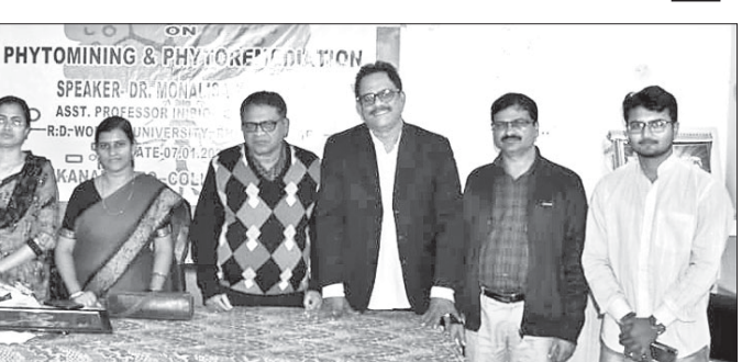
ପାଠକ୍ରମରେ ଅତିଥି ଏବଂ ଅଧ୍ୟାପିକାଅଧ୍ୟାପକମାନେ।

ଦେଶାନ୍ତର ଅଧିକାରୀ, ୧୩୧୧ ସ୍ୱୟଂଶାସିତ ମହାବିଦ୍ୟାଳୟର ଉଦ୍ଭିଦ ବିଜ୍ଞାନ ବିଭାଗ ଆନୁକୂଲ୍ୟରେ ଏମ୍.ଏସ୍. ସ୍ୱାମୀନାଥନ୍ କକ୍ଷରେ ବିଭାଗୀୟ ମୁଖ୍ୟ ଡା.ଏ.କେ. ଖୁଲାରଙ୍କ ଅଧିକାରରେ ଆଲୋଚନାଚକ୍ର ଅନୁଷ୍ଠିତ ହୋଇଯାଇଛି।