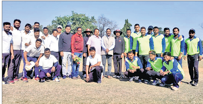
ଅତିଥିଙ୍କ ସହ ଉଭୟ ଦଳର ଖେଳାଳି।

ଅନୁଗୋଳସ୍ଥିତ କଦମ ପଢ଼ିଆ ଠାରେ ମନିଂ ଷ୍ଟାର ପକ୍ଷରୁ ଚାଳିଥିବା ରାଜ୍ୟସ୍ତରୀୟ କ୍ରିକେଟ ଟୁର୍ନାମେଣ୍ଟର ଦ୍ୱିତୀୟ କ୍ରମର ଫାଇନାଲ ମ୍ୟାଚ ପାଳଲହଡ଼ା ଆଇଆରଭି ଓ ଭୃଷଣ ଚାଟା ଷ୍ଟିଲ ମଧ୍ୟରେ ଅନୁଷ୍ଠିତ ହୋଇଥିଲା। ଏହି ମ୍ୟାଚରେ ପାଳଲହଡ଼ା ଆଇଆରଭି ପ୍ରଥମେ ବ୍ୟାଟିଂ କରି ୮୧ ରନ ସଂଗ୍ରହ କରିଥିଲା। ଜବାବରେ ଭୃଷଣ ଚାଟା ଷ୍ଟିଲ ଆବଶ୍ୟକ ରନ କରି ୬ ଉଇକେଟରେ ବିଜୟୀ ହୋଇଥିଲା। ଭୃଷଣ ଚାଟା ଷ୍ଟିଲର ରଭିସ୍ କୁମାର ମ୍ୟାନ ଅଫ୍ ଦି