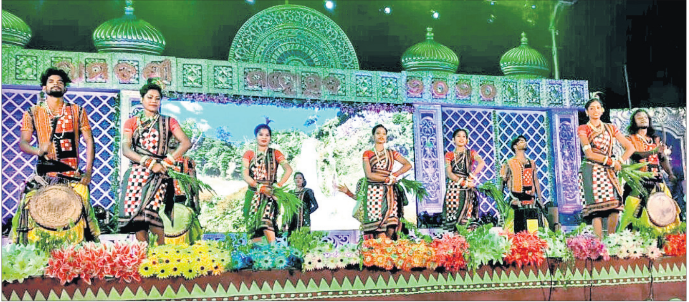
ରାମଚଣ୍ଡୀ ମହୋତ୍ସବର ଦ୍ୱିତୀୟ ସନ୍ଧ୍ୟାରେ ଆୟୋଜିତ ସାଂସ୍କୃତିକ କାର୍ଯ୍ୟକ୍ରମ।

ଆଧ୍ୟାତ୍ମିକତା ସହ ସଂସ୍କୃତିର ନିଆରା ସୁରାଳବନ୍ଦୀ ହେଉଛି ରାମଚଣ୍ଡୀ ମହୋତ୍ସବ। ପୁଣ୍ୟ ପୁରୀର ସମାଜ ଗଠନ ଲକ୍ଷ୍ୟ ନେଇ ଆରମ୍ଭ ହୋଇଥିବା ଏହି କାର୍ଯ୍ୟକ୍ରମ ୩ୟ ବର୍ଷରେ ପହଞ୍ଚିଛି। ଦେଢ଼ାମାଲ ଜିଲ୍ଲା ଓଡ଼ିଆପଢ଼ା ବୃକ୍ଷ ନାଥରା ପ୍ରସିଦ୍ଧ ଶକ୍ତିକ୍ଷେତ୍ର ମା' ରାମଚଣ୍ଡୀଙ୍କ ପୀଠ ନିକଟ ବ୍ରାହ୍ମଣୀ ପୂଜାଳାଗ ରଙ୍ଗମଞ୍ଚରେ ରବିବାର ମହୋତ୍ସବ ଉଦ୍‌ଘାଟିତ ହୋଇଛି। ଏହାପାଇଁ ୨୪ତମ ବିଶ୍ୱଶକ୍ତି ଶ୍ରୀବିଷ୍ଣୁ ମହାଯଜ୍ଞ ସମଗ୍ର ଅଞ୍ଚଳରେ ସୃଷ୍ଟି କରାଯାଇ ଆଧ୍ୟାତ୍ମିକ ବାତାବରଣ। ମହୋତ୍ସବ ମାଧ୍ୟମରେ ଆଧ୍ୟାତ୍ମିକତାର ଉଚ୍ଚତର ସଂସ୍କୃତି ପରମ୍ପରାକୁ ବାଣ୍ଟିବାକୁ କରାଯାଇଛି ପ୍ରୟାସ। ଦେବତା ମା' ରାମଚଣ୍ଡୀଙ୍କ ଯଜ୍ଞବେଦୀରେ ବିଶ୍ୱକର୍ମାଣୀ ଉଦ୍‌ଦେଶ୍ୟରେ ଆହୁତି ପ୍ରଦାନ କରାଯାଇଛି। ସଞ୍ଜ ନର୍ଦ୍ଦଳେ ପୂଜିତ ହୋଇଉଠୁଛି ପୂଜାଳାଗ ରଙ୍ଗମଞ୍ଚ। କଳାସଂସ୍କୃତିର ପ୍ରଦର୍ଶନ କଳାକାର ଏବଂ କଳାପ୍ରେମୀଙ୍କ ଭିତରେ ଭବିଷ୍ୟତର ଆନନ୍ଦ ସ୍ଥାନୀୟ ଅଞ୍ଚଳ ସମେତ ରାଜ୍ୟର ବିଭିନ୍ନ ସ୍ଥାନରୁ କଳାକାରଙ୍କ ସମାଗମ ହୋଇଛି। ରଙ୍ଗିନୀ ଆଲୋକମାଳାର ବର୍ଣ୍ଣାଳୀ ସାଙ୍ଗକୁ ନୃତ୍ୟସଙ୍ଗୀତର ଅର୍ପଣ ହେଉଛି ପୂଜିତ ହୋଇଉଠୁଛି ବ୍ରାହ୍ମଣୀନଦୀ କୂଳରେ ଥିବା ବିଶ୍ୱାସ୍ତ୍ରୀ ଆମ୍ବକାନନ। ଏହାକୁ ଦେଖିବାକୁ ହଜାର ହଜାର ସଂଖ୍ୟାରେ ଦର୍ଶକ ଭିଡ଼ ଜମାଉଛନ୍ତି। ସମ୍ଭଲପୁରୀ ନୃତ୍ୟ, ଗୀତ, ଯତୁକ ନୃତ୍ୟ, ଗୋଟିପୁଅ ନୃତ୍ୟ, ବଜାସାଲ ନୃତ୍ୟ ଚଳିତ ମହୋତ୍ସବର ପ୍ରମୁଖ ଆକର୍ଷଣ ସାଜିଛି। ବିଭିନ୍ନ କ୍ଷେତ୍ରରେ ଉତ୍କର୍ଷ ଲାଭ କରିଥିବା ପ୍ରତିଭାଧାରୀଙ୍କୁ ସମ୍ମାନିତ କରାଯାଇଛି ବୋଲି ଆୟୋଜକ ମା' ରାମଚଣ୍ଡୀ ବିଶ୍ୱଶକ୍ତି ଆୟୋଜକ କମିଟି, ରାମଚଣ୍ଡୀ ସେବା ପରିଷଦ ଏବଂ ନାଥରା ଗ୍ରାମବାସୀ କହିଛନ୍ତି।