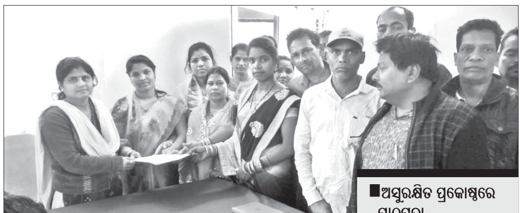
ଅଭିଭାବକମାନେ ଦାବିପତ୍ର ପ୍ରଦାନ କରୁଛନ୍ତି।

ହିନ୍ଦୋଳ ବ୍ଲକ୍ ସଦର ମହକୁମାରେ ବର୍ଷେ ତଳେ ଖୋଲିଥିଲା ଆଦର୍ଶ ବିଦ୍ୟାଳୟ। ଉଦ୍ଦେଶ୍ୟ ଥିଲା କେନ୍ଦ୍ରୀୟ ଡାହାଣରେ ଛାତ୍ରାଛାତ୍ରୀମାନେ ଗୁଣାତ୍ମକ ଶିକ୍ଷା ଲାଭ କରିବେ।