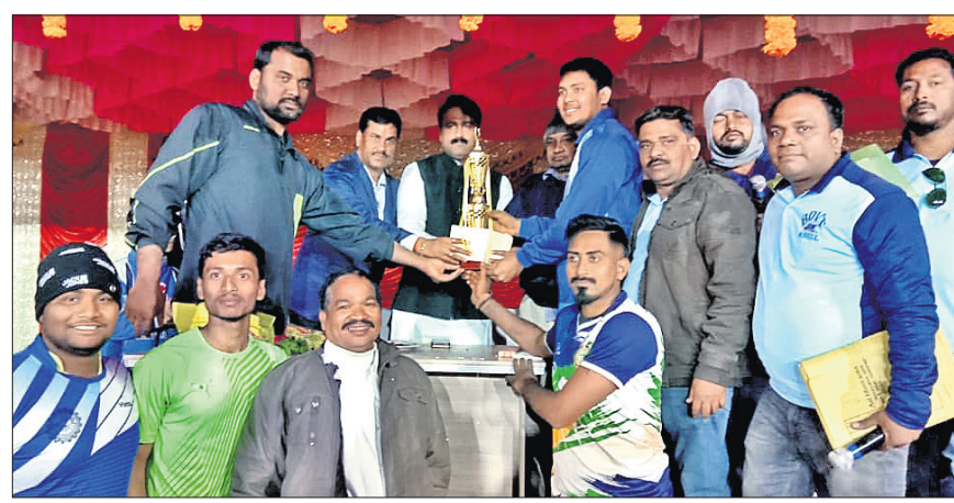
ଚାମ୍ପିୟନ ଦଳକୁ ଅତିଥି ରୂପେ ପ୍ରଦାନ କରୁଛନ୍ତି।