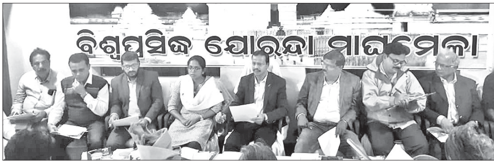
ବୈଠକରେ ଜିଲାପାଳ ଭୃଗୁନାଥ ଚନ୍ଦ୍ର ବେହେରା, ଏସପି ଅନୁପମା ଜେନାଙ୍କ ସମେତ ଅନ୍ୟମାନେ।

ବିଶ୍ୱପ୍ରସିଦ୍ଧ ଯୋରନ୍ଦା ମାଘମେଳା ଫେବୃଆରୀ ୭ରୁ ୯ ଯାଏ ଅନୁଷ୍ଠିତ ହେବ। ଏହି ଉପଲକ୍ଷେ ଯୋଗଦାନ ଅପରାଧ ଗଣାରେ ଯୋରନ୍ଦା ପଞ୍ଚାୟତ କାର୍ଯ୍ୟାଳୟରେ ପ୍ରଶାସନିକ ପ୍ରସ୍ତୁତି ବୈଠକ ଅନୁଷ୍ଠିତ ହୋଇଯାଇଛି।