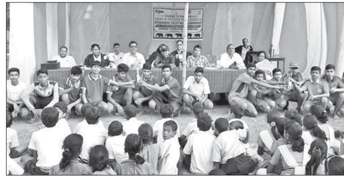
ପ୍ରତିଯୋଗିତାରେ ଭାଗ ନେଇଥିବା ଖେଳାଳିମାନେ।