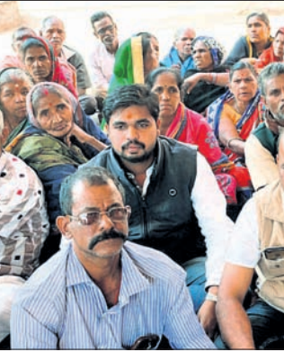
ବୁକ୍ କାର୍ଯ୍ୟାଳୟ ଆଗରେ ବିକ୍ଷୋଭରେ ସାମିଲ ହୋଇଥିବା କନ୍ଧମାଗଡ଼ ବାସିନ୍ଦା।