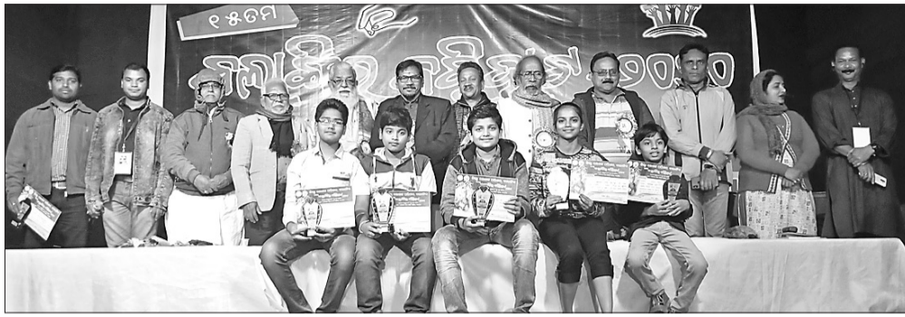
ବହିଷ୍କାର ଶିକ୍ଷା ସମ୍ପାଦନାରେ କୃତ ପ୍ରତିଯୋଗୀଙ୍କ ସହ ଅତିଥି ଓ ଆଲୋଚକମାନେ।

ଜିଲ୍ଲା ଲୋକସଭା ପରିଷଦ ପକ୍ଷରୁ ଆୟୋଜିତ ବଲାଙ୍ଗୀର ବହିଷ୍କାର ଶିକ୍ଷା ସମ୍ପାଦନା ଲୋକସଭା ସଭାରେ ଦଣ୍ଡନୂତ୍ୟ ସମ୍ପର୍କରେ ଆଲୋଚନା କରାଯାଇଥିଲା।