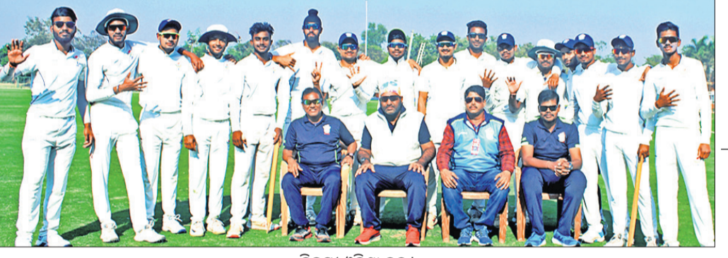
ବିଜୟ ଓଡ଼ିଶା ଦଳ।

ବରଗଡ଼ସ୍ଥିତ ବିକାଶ ଗ୍ରାଉଣ୍ଡରେ ଓଡ଼ିଶା ଏର୍ପିସି ଅଭିଯାନ ପ୍ରଦର୍ଶନ ମଧ୍ୟରେ ୨୩ବର୍ଷରୁ କମ୍ ବୟସ୍କ ଯିବେ ନାଲିରୁ ପ୍ରତିଯୋଗିତା ପାଇଁ ମ୍ୟାଚ୍‌ ପାଇଁ ନିଷ୍ପତ୍ତି ଭାବେ ଏକ ଟ୍ୟାଲେଣ୍ଟ ମ୍ୟାଚ୍ ରହିବ' ବୋଲି ଓଡ଼ିଶା ଏର୍ପିସି କୋର୍ଟ ଗୋଷ୍ଠୀର ଖବରଦାତା ସମ୍ବଳନାରେ କହିଛନ୍ତି।