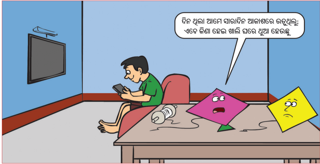
ଦିନ ଥିଲା ଆମେ ସାରାଦିନ ଆକାଶରେ ଉଡ଼ୁଥିଲୁ; ଏବେ କିଣା ହେଲ ଖାଲି ଘରେ ଥିବା ହେଉଛି

ଭୁବନେଶ୍ୱର, ୧୫୧୧(ଖୁଲ୍ୟା): ସ୍ଫୁଲ୍ଲ ଛାତ୍ରଛାତ୍ରୀଙ୍କ ପାଇଁ ପରୀକ୍ଷା ନିୟମ କଡ଼ାକଡ଼ି କରିଛନ୍ତି ରାଜ୍ୟ ସରକାର। ଏଣିକି ସ୍ଫୁଲ୍ଲ ପ୍ରଥମ ବର୍ଷ ପରୀକ୍ଷାରେ ପାସ୍ କଲେ ନିତ୍ୟାୟ ବର୍ଷକୁ ଯାଇପାରିବେ ନାହିଁ। ହିତାୟତ ବର୍ଷକୁ ଯିବାକୁ ହେଲେ ଛାତ୍ରଛାତ୍ରୀଙ୍କୁ ପ୍ରଥମ ବର୍ଷରେ ୩୩% ନମ୍ବର ରଖିବା ଜରୁରୀ ବୋଲି ବ୍ୟାପକ ଏବଂ ଶିକ୍ଷଣ ଯୋଗ୍ୟ ସମସ୍ତ ରାଜ୍ୟ ଦଫ୍ତର କହିଛନ୍ତି। ତେବେ ପରୀକ୍ଷା ପାସ୍ ପାଇଁ ପ୍ରଥମ ବର୍ଷ ପଢ଼ାକୁ ୨୫ ପ୍ରତିଶତ ମିଳିବା ଫେରୁଥିବା ୧୫୭୯ ୨୯ ମଧ୍ୟରେ ପ୍ରଥମ ପରୀକ୍ଷା ପାଇଁ ସୁଯୋଗ ଦିଆଯିବ। ଏଥିରେ ୩୩%ରୁ କମ୍ ରଖିଥିବା ପଢ଼ାକ ପାଇଁ ରିମେଡିଆଲ କ୍ୟୁ ହେବ। ଏହାପରେ ହିତାୟତ ସୁଯୋଗ ଭାବେ ମେଁ ଶେଷ ସପ୍ତାହରେ ପରୀକ୍ଷା କରାଯିବ। ହିତାୟତ ବର୍ଷ ଛାତ୍ରୀଙ୍କ ପ୍ରଥମ ବର୍ଷ ପରୀକ୍ଷା ହେବ। ଏହି ପରୀକ୍ଷାକୁ ସମ୍ପୂର୍ଣ୍ଣ କଲେ ଅଧିକାରୀ ନିଜେ ପରୀକ୍ଷା କରିବେ। କଲେଜଗୁଡ଼ିକ ପ୍ରଥମ ବର୍ଷରେ କେବଳ ନିର୍ଦ୍ଦେଶାଳୟକୁ ଉପସ୍ଥାପନ କରିବାକୁ ନିର୍ଦ୍ଦେଶ ଦିଆଯାଇଛି। ଶିକ୍ଷାନୁଷ୍ଠାନ ନିଜେ ପରୀକ୍ଷା କରିବେ। ଏହାର କୌଣସି ପ୍ରଭାବ ପଡ଼ିବ ନାହିଁ ବୋଲି ମତ ଦେଇଛନ୍ତି। ଶିକ୍ଷାନୁଷ୍ଠାନ କହିବା ହେଲେ, ହିତାୟତ ବର୍ଷ ପରୀକ୍ଷାକୁ ଯେପରି ଉଚ୍ଚ ମାଧ୍ୟମିକ ଶିକ୍ଷା ପରିଷଦ ପରିଚାଳିତ କରୁଛି, ପ୍ରଥମ ବର୍ଷ ପରୀକ୍ଷା ବି ଯଦି ସେହିଭଳି ପରିଷଦ ପକ୍ଷରୁ ହୁଏ, ତେବେ ଏହାର ପ୍ରଭାବ ପଡ଼ିବ।