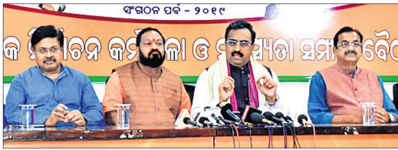
ଖବରଦାତା ସମ୍ମିଳନୀରେ ଭାଗ୍ୟ ରାଷ୍ଟ୍ରୀୟ ସାଧାରଣ ସମ୍ପାଦକ ରାମ ମାଧବ ଏବଂ ଅନ୍ୟମାନେ ।