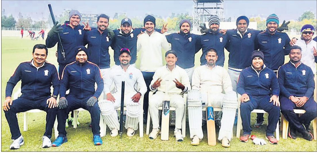
ବିଜୟ ହାସଲ ପରେ ଓଡ଼ିଶା ଦଳର ଖେଳାଳି ଓ ସପୋର୍ଟ ସ୍ଟାଫ୍।

ରୋହତକର ଚୌଧୁରୀ ବ୍ୟାଣାଲ କ୍ରିକେଟ ଷ୍ଟାଡ଼ିୟମରେ ଅନୁଷ୍ଠିତ ଚଳିତ ରଣଜୀ ପ୍ରତିଯୋଗିତାରେ ଓଡ଼ିଶା ରୋମାଞ୍ଚକ ବିଜୟ ହାସଲ କରିଛି।