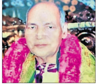
ପ୍ରଫେସର ପଞ୍ଚେ ରଜାଧର ଷଡ଼ଙ୍ଗୀ ଅନୁବାଦ, ମହାନାଟକର ମହାଅନୁବାଦ, ଚିତ୍ରନାଟ୍ୟ ରଚନାକାର, ଶ୍ରୀକୃଷ୍ଣ ପ୍ରେମ ସଂସ୍କୃତି ଅଧିକାରୀ ଶୁକ୍ଳ ସାହିତ୍ୟ, ଲୋକକଳା ଉପଦେଶାଳୟ ଅଧିକାରୀ ମିଶ୍ର ପ୍ରଭାକର ଶ୍ରୀକୃଷ୍ଣ ଲେଖକ ଶ୍ରୀକୃଷ୍ଣ ମାନସର ସଂସ୍କୃତି ଅନୁବାଦ, ଜଗତରୁ ନିଜ ଦକ୍ଷତାର ପ୍ରତିପାଦନ କରିଥିଲେ ।