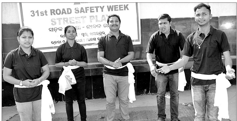
ମଙ୍ଗଳସନ୍ଧ୍ୟାରେ ସମ୍ବଲପୁର ଗଣାଧର ମେହେର ବିଶ୍ୱବିଦ୍ୟାଳୟ ମୁଖ୍ୟପାଟକରେ 'ସ୍ୱର' ଅନୁଷ୍ଠାନର କଳାକାରମାନେ ସତକ ସୁରକ୍ଷା ସଚେତନତା ଧର୍ମୀ ପଥପ୍ରାଚ ନାଟକ ପରିବେଷଣ କରୁଛନ୍ତି (ବାମ) । ମହାନଗର ନିଗମ ପକ୍ଷରୁ ସିନ୍ଦୂରପଙ୍କରେ 'ଆମ ଶୌଚାଳୟ' ଉଦ୍ଘାଟନ ପରେ ଏହାର ପରିଚାଳନା ଦାୟିତ୍ୱ ନେଇଥିବା ମହିଳା ସ୍ୱୟଂ ସହାୟିକା ଗୋଷ୍ଠୀର ସଦସ୍ୟାମାନେ (ମଝି) । କ୍ଷେତରାଜପୁରଠାରେ ପଞ୍ଜାବି ସଂପ୍ରଦାୟ ପକ୍ଷରୁ ଲୋହରି ଉତ୍ସବ ।