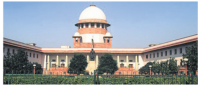
ରାଜନୈତିକ ଦଳକୁ ପୁସ୍ତିକାକୋର୍ଟ ନିର୍ଦ୍ଦେଶ