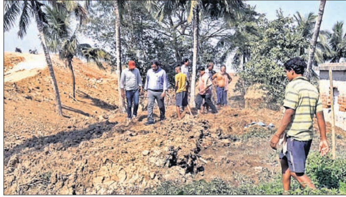
ଗୋସାଇଁବନ୍ଧ ନିକଟରେ ରେଳପଥ ଧର୍ମିକା ଗ୍ରାମକୁ ତହସିଲଦାର ପରିଦର୍ଶନ କରୁଛନ୍ତି ।