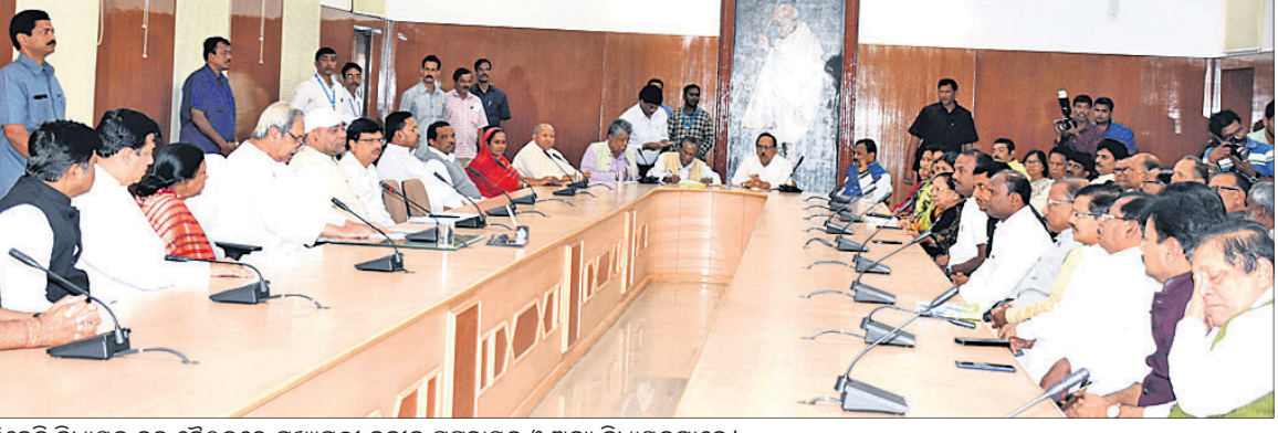
ବିଜେଡି ବିଧାୟକ ଦଳ ବୈଠକରେ ମୁଖ୍ୟମନ୍ତ୍ରୀ ନବୀନ ପଟ୍ଟନାୟକ ଓ ଅନ୍ୟ ବିଧାୟକମାନେ ।