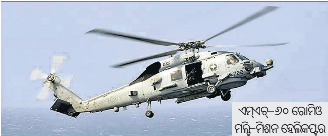
ଏମ୍ଏସ୍-୬୦ ରୋମିଓ ମିଲି-ମିଶନ ହେଲିକପ୍ଟର

ଆମେରିକା ରାଷ୍ଟ୍ରପତି ଡୋନାଲ୍ଡ୍ ଟ୍ରମ୍ପ୍ ୨୪ ତାରିଖରୁ ବୃଦ୍ଧିଦିଆ ଭାରତ ଗସ୍ତରେ ଆସୁଥିବାବେଳେ ଏହି ଅବସରରେ ବୁଲ୍‌ସେଣ୍ଟ ମଧ୍ୟରେ ୩.୫ ବିଲିୟନ ଡଲାର (୨୫,୦୦୦ କୋଟି ଟଙ୍କା)ରୁ ଉର୍ଦ୍ଧ୍ୱ ମୂଲ୍ୟର ବୃଦ୍ଧି ବୃହତ୍ ପ୍ରତିରକ୍ଷା ପାଇଁ ସ୍ୱାକ୍ଷର ହେବାକୁ ଯାଉଛି। ଏହି ବୃଦ୍ଧି ଅନୁଯାୟୀ ଆମେରିକା ୩୦ଟି ହେଲିକପ୍ଟର ଆପାରେ ଲଢ଼ୁଆ ଗୋପନ। ଆଗାମୀ ସପ୍ତାହରେ ପୁରୀ ସମ୍ପର୍କିତ କ୍ୟାମିନେଟ୍ କମିଟି ଏହି ବୃଦ୍ଧିମାତ୍ରକୁ ମଞ୍ଜୁରୀ ଦେବାକୁ ଯାଉଛି। ବୃଦ୍ଧି ଅନୁଯାୟୀ ଏମ୍ଏସ୍-୬୦ ଆର୍ ହେଲିକପ୍ଟର ମୂଲ୍ୟର ୧୫ ପ୍ରତିଶତ ଭାରତ ପ୍ରଥମ କିଣିବେ ପ୍ରସ୍ତାବ କରିବ। ଏହା ସ୍ୱାକ୍ଷର ହେବାର ୨ ବର୍ଷ ମଧ୍ୟରେ ପ୍ରଥମ ଦମ୍ପା ହେଲିକପ୍ଟର ଯୋଗାଇ