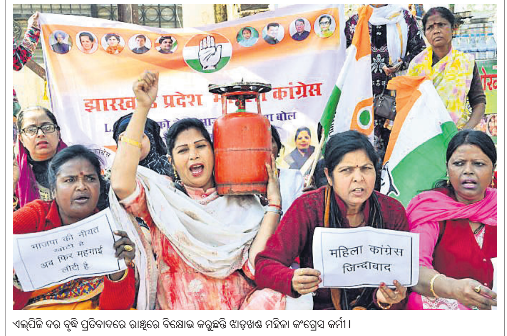
ଏକପିଟି ଦର ବୁକି ପ୍ରତିବାଦରେ ରାଜ୍ରେ ବିରୋଧ କରୁଛନ୍ତି ଖଡ଼ଖଣ୍ଡ ମହିଳା କଂଗ୍ରେସ କର୍ମୀ।