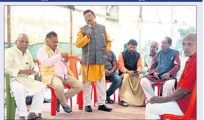
ଆୟୋଜନକାରୀଙ୍କ ସହ ଭାଜପା ନେତାମାନେ ଆଲୋଚନା କରୁଛନ୍ତି।