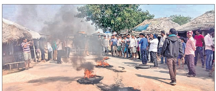
ଚାନ୍ଦାର ଜାଳି ଗ୍ରାମବାସୀଙ୍କ ରାସ୍ତାରେକୋ।