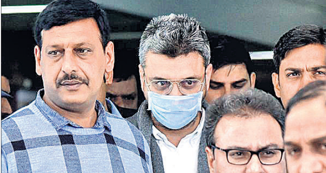
ନୂଆଦିଲ୍ଲୀ, ୧୩୨ (ପି.ଟି.)

ମାଟ୍ ପିକ୍ସି ମାମଲା ■ ବୁକି ସଞ୍ଚାରକୁ ପ୍ରତ୍ୟର୍ପଣ କଲା ତ୍ରିଟେନ ■ ୧୨ ଦିନିଆ ରିମାଣ୍ଡରେ ନେଲା ଦିଲ୍ଲୀ ପୋଲିସ