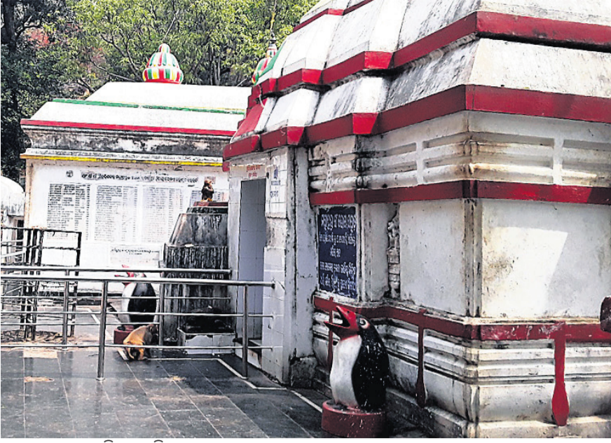
କଟକରେ ଏସିପିରେ ହେଉଥିବା ଅପରେଶନ

କରୋନା ବିଶ୍ୱରେ ମହାମାରୀ ଗୁପ୍ତ ନେଇ ପ୍ରଧାନମନ୍ତ୍ରୀଙ୍କ ଘୋଷଣା କରାଯାଇ ଥିବା କ୍ରମେ କର୍ମଚାରୀ ପ୍ରଭାବ ଏସିପି ମେଡିକାଲରେ ମଧ୍ୟ ପଡିବ। ଏହାକୁ ଦୃଷ୍ଟିରେ ରଖି ଏସିପି ମେଡିକାଲରେ ହେବାକୁ ଥିବା ସମସ୍ତ ନିୟମିତ ଅପରେଶନ ସ୍ଥିତିରେ ରଖାଯାଇଛି।