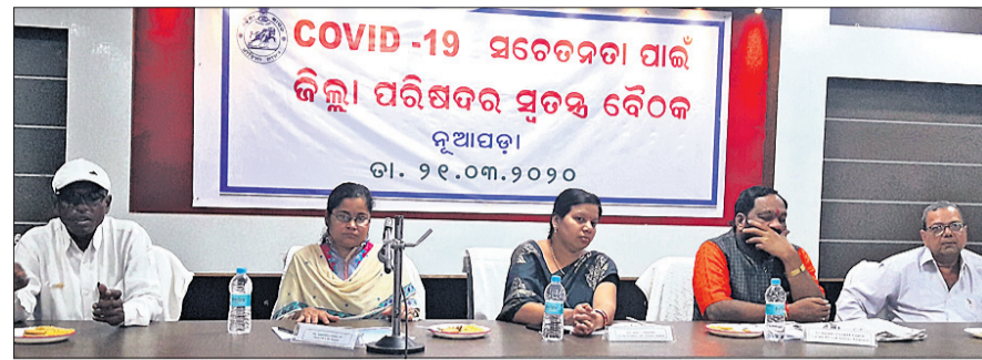
କରୋନା ମୁକାବିଲା ପାଇଁ ଅନୁଷ୍ଠିତ ଜିଲ୍ଲାପରିଷଦ ବୈଠକରେ ମଞ୍ଚାସୀନ ଅତିଥିବୃନ୍ଦ ।