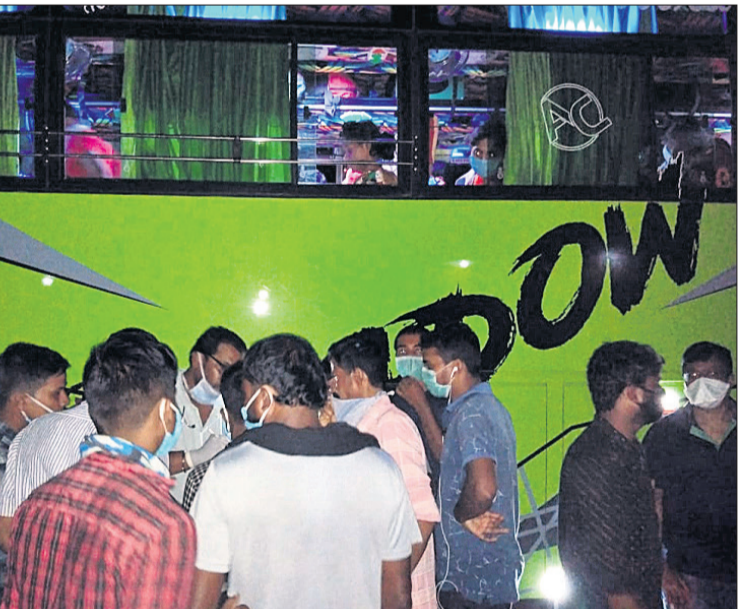
ସାତମାତ୍ରୀଙ୍କ ସ୍ୱାସ୍ଥ୍ୟ ପରୀକ୍ଷା କରାଯାଇଛି।

ସିପୁଲିଆ, ୨୧ମା(ଡି.ଏନ.ଏ.) ଡାକିଆମାନଙ୍କୁ ୫୧ଜଣ ଯାତ୍ରୀଙ୍କୁ ନେଇ ବାଲେଶ୍ୱର ଅଭିମୁଖେ ଆସୁଥିବା ଏକ ଘରୋଇ ବସ୍ (ନଂ. କେଏଲ୍ ୦୬୯୫-୯୫୮୨)କୁ ଶୁକ୍ରବାର ବିକଳିତ ରାତ୍ରିରେ ବାଲେଶ୍ୱର ଜିଲ୍ଲା ସିପୁଲିଆ ଥାନା କାମୁଡ଼ି ଛକ ନିକଟରେ ପ୍ରଶାସନ ପକ୍ଷରୁ ଅଟକାଯାଇଥିଲା।