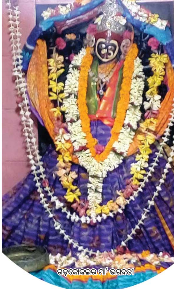
ଗଡ଼କୋକଲର ମାଁ ଭଗବତୀ