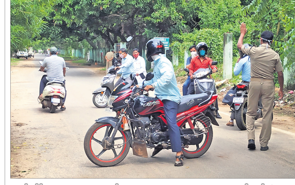
କଟକସ୍ଥିତ ସିଟିଏରେ କଠେଡ଼ନେଖି କୋର୍ଡ ସେକ୍ଟର-୯କୁ ଆସୁଥିବା ଲୋକମାନଙ୍କୁ ଫେରାଇଦେଇଛି ପୋଲିସ୍।