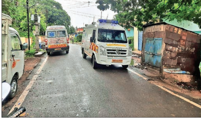
ବଲାଙ୍ଗୀର ହାତୀଶାଳପତ୍ରାରେ ମେଡିକାଲ ଟିମ୍ ଓ ଆୟୁର୍ବିଦ୍ୟାଳୟ ପହଞ୍ଚିଛି ।

କରୁଆଁରେ ପଞ୍ଚାୟତ ଧର୍ମସଭା କେନ୍ଦ୍ରରେ ରହିଥିଲେ । ସେଠାରେ ଗୋଟିଏ ଦିନ ରହିବା ପରେ ସେ ଗର୍ଭବତୀ ଥିବା ଜଣା ପଡ଼ିଥିଲା । ଏଥି ସହିତ ତାଙ୍କର ଏକ ଛୋଟ ଝିଅ ଥିବାରୁ ସରପଞ୍ଚ ଗୃହ ସଙ୍ଗରେ ପାଇଁ ପଠାଇଥିଲେ । କୁନି ୨୫ତାରିଖରେ ତାଙ୍କ ସ୍ବାବ ନମୁନା ପରୀକ୍ଷା ପାଇଁ ବଲାଙ୍ଗୀର ପଠାଯାଇଥିଲା । ସୋମବାର ତାଙ୍କ ରିପୋର୍ଟ ପଢିବାର ଆସିଥିଲା । ସେହିମାନେ ତାଙ୍କ ଖରଜାକୁ ଦାବି କରିବାକୁ ଯାଇ ପରାମର୍ଶ ଦେଇଥିଲେ । ସେହିମାନେ ତାଙ୍କ ଖରଜାକୁ ଦାବି କରିବାକୁ ଯାଇ ପରାମର୍ଶ ଦେଇଥିଲେ ।