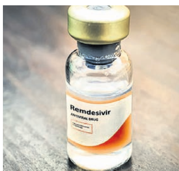
ସୂଚନାଯୋଗ୍ୟ, ମହାମାରୀ କରୋନାକୁ କେତେକାଂଶରେ ଆରୋଗ୍ୟ କରିପାରୁଥିବା ଆଣ୍ଟି ଭାଇରାଲ ଔଷଧ ରେମଡେସିଭିର୍ ନିକଟରେ ଡ୍ରାଗ କଣ୍ଠୋଲର ଜେନେରାଲ ଅଫ୍ ଇଣ୍ଡିଆ(ଡିଏସିଆଇ) ସର୍ବମୂଳକ ଭାବେ ବ୍ୟବହାର କରିବାକୁ ଅନୁମତି ଦେଇଥିଲା।

ଭୁବନେଶ୍ୱର, ୨୯।୬(ବୁଧବେ): ପଠାଯାଇଥିବାବେଳେ ଖୁବ୍ ଶୀଘ୍ର ଏହା ବାକି ହସ୍ପିଟାଲଗୁଡ଼ିକୁ ଯୋଗାଇ ଦିଆଯିବ। ଯେହେତୁ କାଟାମ୍ ଯୁଗରେ ଓଡ଼ିଶା ହଟସ୍ପଟ୍ ଏରିଆ ନୁହେଁ, ତେଣୁ ରାଜ୍ୟକୁ ଧାରଣ କରିବା ପାଇଁ ଓଡ଼ିଶା ଆସିବ ବୋଲି ମହାପାତ୍ର ସୂଚନା ଦେଇଛନ୍ତି।