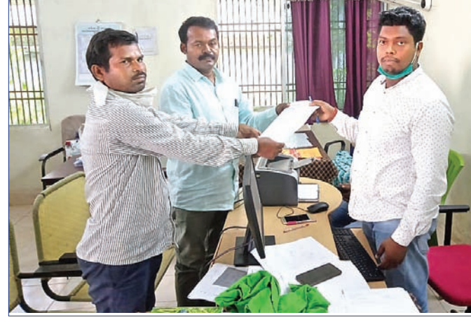
ଜିଲ୍ଲା କୃଷକ ସଂଘର୍ଷ ସଂଘ ପକ୍ଷରୁ ଜିଲ୍ଲା କୃଷି ଅଧିକାରୀଙ୍କୁ ଦାବିପତ୍ର ପ୍ରଦାନ କରାଯାଇଛି ।

ଦେବଗଡ଼, ୨୯।୬(ଡି.ଏନ.ଏ.) ଦିଆଯାଇଥିବା ଧାନ ବିହନ ଗଣ୍ଡାକୁ ଚାହିଦା ମୁତାବକ ମିଳୁ ନାହିଁ । ଅନ୍ୟପକ୍ଷେ ବୁଝାଯାଇଥିବା ଧାନ ବିହନ ଗଣ୍ଡା ହେଉନି ବୋଲି ମଧ୍ୟ ସୋମବାର ଏକ ଦାବିପତ୍ର ଜିଲ୍ଲା କୃଷି ଅଧିକାରୀଙ୍କୁ କାର୍ଯ୍ୟାଳୟରେ ଦିଆଯାଇଛି । ଜିଲ୍ଲାର ସମସ୍ତ ସେବା ସମବାୟ ସମିତି ମାଧ୍ୟମରେ ଦିଆଯାଇଥିବା ଧାନ ବିହନ ଗଣ୍ଡାକୁ ଚାହିଦା ମୁତାବକ ମିଳୁ ନାହିଁ । ଅନ୍ୟପକ୍ଷେ ବୁଝାଯାଇଥିବା ଧାନ ବିହନ ଗଣ୍ଡା ହେଉନି ବୋଲି ମଧ୍ୟ ସୋମବାର ଏକ ଦାବିପତ୍ର ଜିଲ୍ଲା କୃଷି ଅଧିକାରୀଙ୍କୁ କାର୍ଯ୍ୟାଳୟରେ ଦିଆଯାଇଛି । ଜିଲ୍ଲାର ସମସ୍ତ ସେବା ସମବାୟ ସମିତି ମାଧ୍ୟମରେ