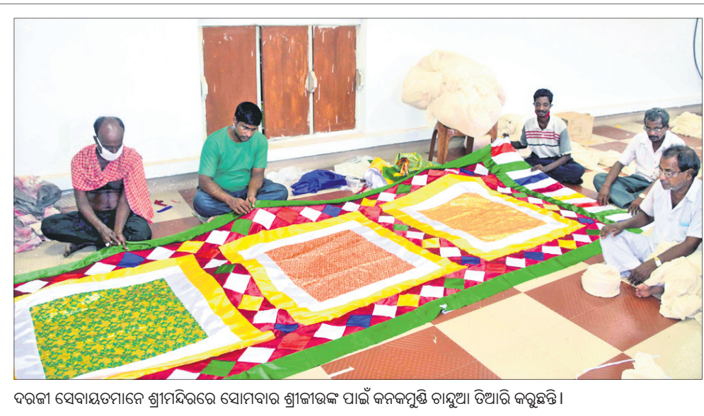
ଦରକା ସେବାୟତମାନେ ଶ୍ରୀମନ୍ଦିରରେ ସୋମବାର ଶ୍ରୀଜୀଉଙ୍କ ପାଇଁ କନକପୂଜା ଚାହୁଣା ତିଆରି କରୁଛନ୍ତି।

ଭୁବନେଶ୍ୱର, ୨୯।୬(ବୁଧବେ): ରାଜ୍ୟ ସରକାରଙ୍କ ସ୍ଥିତି ଓ ଗଣଶିକ୍ଷା ବିଭାଗର ଏକ ଜରୁରୀ ବୈଠକ ସୋମବାର ଅନୁଷ୍ଠିତ ହୋଇଯାଇଛି। ମହା ସମାଜ ରଞ୍ଜନ ଦାମ୍ଭକ ଅଧିକାରୀଙ୍କ ଅନୁମତି ଉପରେ ଉପସ୍ଥିତ ରହି ଆଗକୁ ଯୁକ୍ତ ୨ ପରୀକ୍ଷା ହେବା ଉପରେ ଆଲୋଚନା କରିଛନ୍ତି।