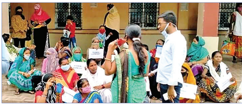
ଆରଜିଏସ୍ ସମ୍ମୁଖରେ ମୃତ ରୋଗୀଙ୍କ ସମ୍ପର୍କୀୟ ଧାରଣାରେ ବସିଛନ୍ତି ।

ରାଉରକେଲା ସରକାରୀ ଡାକ୍ତରଖାନା (ଆରଜିଏଚ୍) ରେ ସୋମବାର ପୂର୍ବାହ୍ନରେ କଣେ ରୋଗୀଙ୍କ ମୃତ୍ୟୁ ନେଇ ଉଡ଼େଜନା ପ୍ରକାଶ ପାଇଛି । ଚିକିତ୍ସାରେ ଅବହେଳା ଯୋଗୁ ତାଙ୍କର ମୃତ୍ୟୁ ଘଟିଥିବା ଅଭିଯୋଗ କରି ପରିବାର ଲୋକେ ଡାକ୍ତରଖାନା ଆଗରେ ବିରୋଧ ପ୍ରଦର୍ଶନ କରିଥିଲେ । ଦୋଷୀଙ୍କ ବିରୋଧରେ କଠୋର କାର୍ଯ୍ୟାନୁଷ୍ଠାନ ଦାବିରେ ମୃତକଙ୍କ ସମ୍ପର୍କୀୟ ଅତି ସହିଥିଲେ । ପରିସ୍ଥିତି ନିୟନ୍ତ୍ରଣ କରିବାକୁ ଡାକ୍ତରଖାନାରେ ୨ ପୁଲିସ୍ ପୋଲିସ୍ ମୁତୟନ କରାଯାଇଥିଲା । ଉପଯୁକ୍ତ