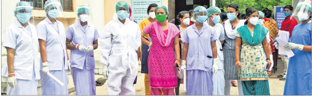
ସେବିକାମାନେ ପ୍ରତିଷ୍ଠାନ ନିର୍ଦ୍ଦେଶକ କାର୍ଯ୍ୟାଳୟ ଆଗରେ ଦାବି ଜଣାଉଛନ୍ତି।

ଅଫିସର ବିଦ୍ୟୁତ୍ ସହ ଯୋଗାଯୋଗରେ ରହିବେ। ଏହି ସମସ୍ତ କାର୍ଯ୍ୟର ପରିଚାଳନା ସମ୍ପୂର୍ଣ୍ଣ ମେଡିକାଲ କର୍ମଚାରୀ ନେତେ ବୋଲି ବିଦ୍ୟୁତ୍ ପକ୍ଷରୁ ଉଲ୍ଲେଖ କରାଯାଇଛି।