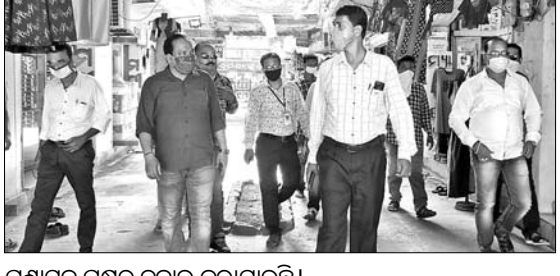
ପ୍ରଶାସନ ପକ୍ଷରୁ ଚଳାଯାଉଛି

ଡେକନାଲ ଅଧିକାରୀଙ୍କ ପକ୍ଷରୁ ନିୟମ ଭାଙ୍ଗି ଗଣିଲେ ଚଣ୍ଡ