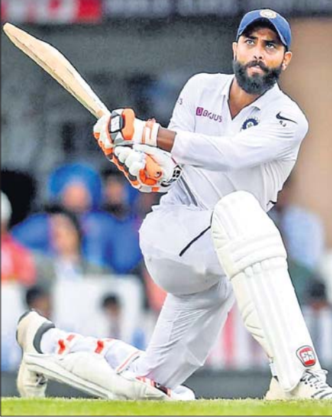
ଭାରତୀୟ ଟୀମର ମୁଖ୍ୟ ବ୍ୟାଟ୍ସମ୍ୟାନ୍ ବିରାଟ କୋହଲି

ବୋଲର ବିବେଚିତ ହୋଇଛନ୍ତି । ଏହା ବ୍ୟତୀତ ସେ ୬ ନମ୍ବର ପ୍ଲେୟର ବ୍ୟାଟି କରିବାକୁ ଆତୁଥିଲେ ହେଁ ଦଳପାଇଁ ତାଙ୍କ ଯୋଗଦାନ ଉଚ୍ଚକୋଟୀର ରହିଛି ବୋଲି କ୍ରିକେଟରମାନଙ୍କ ମତେ ।