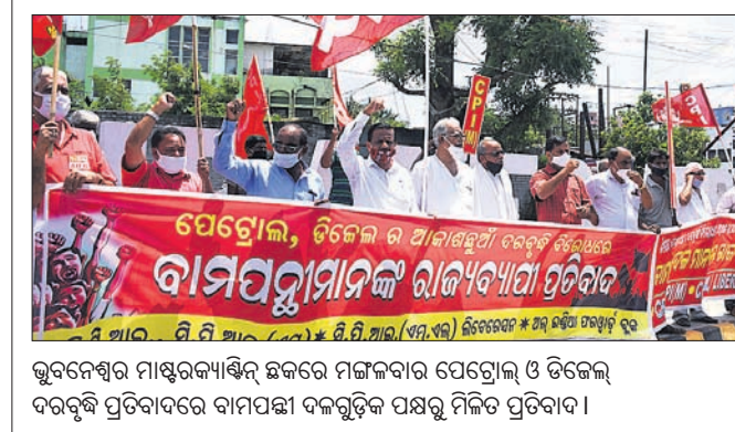
ଭୁବନେଶ୍ୱର ମାଷ୍ଟରକ୍ୟାଣ୍ଟିନ୍ ଛକରେ ମଙ୍ଗଳବାର ପେଟ୍ରୋଲ୍ ଓ ଡିଜେଲ୍ ଦରବୃଦ୍ଧି ପ୍ରତିବାଦରେ କାର୍ଯ୍ୟକାରୀ ପଦକ୍ଷେପ ଗ୍ରହଣ କରିବା ପାଇଁ ପ୍ରତିବାଦୀମାନଙ୍କୁ ଡାକରା ଦିଆଯାଇଛି।

୨୦ଗ୍ରାମ ବ୍ରାଉନସ୍ୱାଗାର ଜବତ ବାଲିପାଟଣା, ୩୦।୭(ବି.ଏନ୍.ଏ.) ବ୍ରାଉନସ୍ୱାଗାର ବିକ୍ରି କରିବା ଅଭିଯୋଗରେ ମଙ୍ଗଳବାର କମିଶନରେଟ ପୋଲିସର କ୍ୟୁଏଚି ଟିମ୍ ଜଣେ ବ୍ୟବସାୟୀଙ୍କୁ ଗିରଫ କରିଛି।