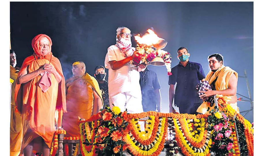
ମହୋଦଧି ଆଳତିରେ ଗୁରୁଜୀ ମହାରାଜ ଶଙ୍କରାଚାର୍ଯ୍ୟ ଏବଂ ରାଜ୍ୟପାଳ