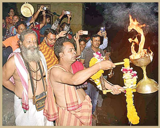
ଇନ୍ଦ୍ରଦ୍ୟୁମ୍ନ ପୁଷ୍କରିଣୀରେ ଆଳତି

୩. ବାରାଣସୀରେ ଗଙ୍ଗା ଆଳତି ସୂର୍ଯ୍ୟାସ୍ତ ପରେ କାଶୀ ବିଶ୍ୱନାଥ ମନ୍ଦିର ନିକଟସ୍ଥ ଦଶାଶ୍ୱମେଧ ଘାଟରେ ଆୟୋଜିତ ହୁଏ। ହରିଦ୍ୱାର ଓ ରକ୍ଷିକେଶର