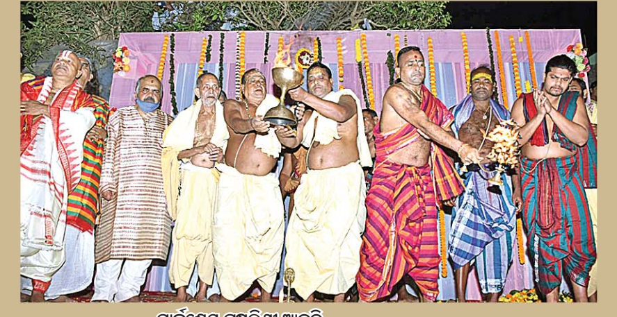
ମାର୍କଣ୍ଡେୟ ପୁଷ୍କରିଣୀ ଆଳତି