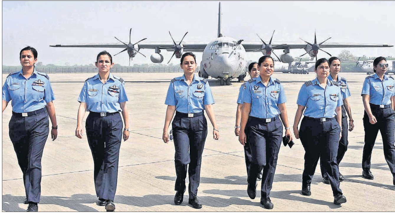
ଅନ୍ତର୍ଜାତୀୟ ମହିଳା ଦିବସ ଅବସରରେ ପୂର୍ବରୁ ଉତ୍ତରପ୍ରଦେଶର ଗାନ୍ଧିଆବାଦସ୍ଥିତ ଏୟାରଫୋର୍ସ ଷ୍ଟେଶନରେ ପରିବାର ଭାରତୀୟ ବାୟୁସେନାର ମହିଳା ଅଧିକାରୀମାନେ।

ଆଜିର ମନ୍ତବ୍ୟ ପ୍ରଧାନମନ୍ତ୍ରୀ ନରେନ୍ଦ୍ର ମୋଦି ସ୍ୱପ୍ନ ବିଜିବାକୁ ଆସିଛନ୍ତି ତାଙ୍କୁ ଭାରତରୁ ହଟାଇଦେବୁ। -ମମତା ବାନାର୍ଜୀ, ପଶ୍ଚିମବଙ୍ଗ ମୁଖ୍ୟମନ୍ତ୍ରୀ