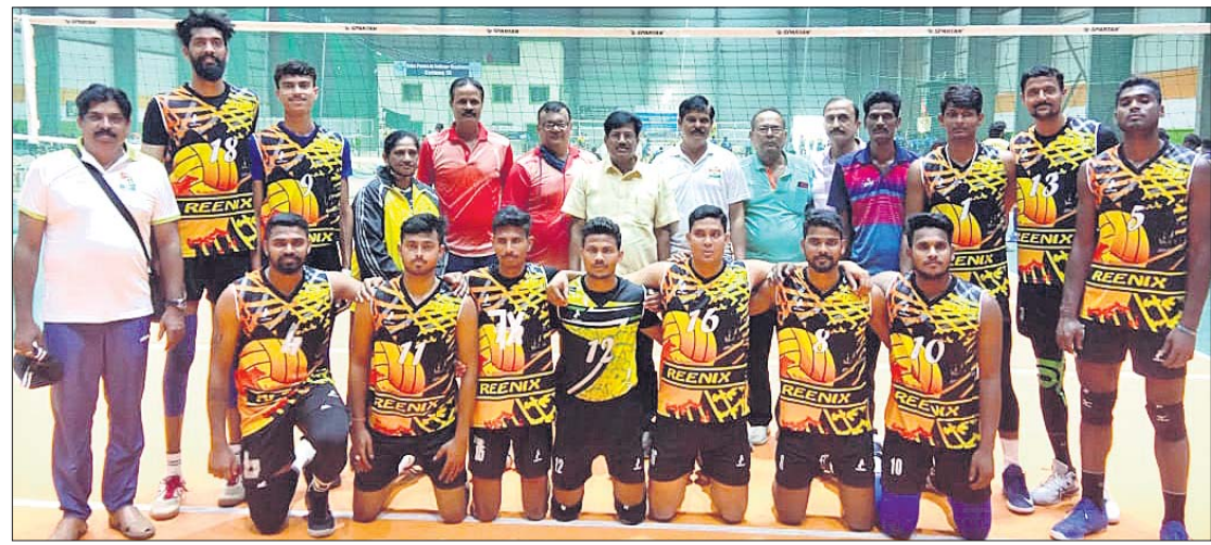
ଚଣ୍ଡିଗଡ଼ ବିପକ୍ଷରେ ବିଜୟୀ ଓଡ଼ିଶା ପୁରୁଷ ଭଲିବଲ୍ ଦଳର ଖେଳାଳିମାନେ କର୍ମକର୍ତ୍ତାଙ୍କ ସହ।