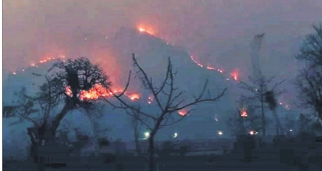
ଶିମିଳିପାଳ ରାମରଜା ପାହାଡ଼ ଶୀର୍ଷରେ ପହଞ୍ଚିଥିବା ନିଆଁ।

ହଜାର ହଜାର ବୃକ୍ଷଲତା ପୋଡ଼ି ପାଉଁଶ ହୋଇଯାଇଛି। ଅନେକ ସରୀସୃପ ଓ ଜୀବଜନ୍ତୁଙ୍କ ଜୀବନହାନି ଫ୍ରେପୁଷ୍ଟା-୪