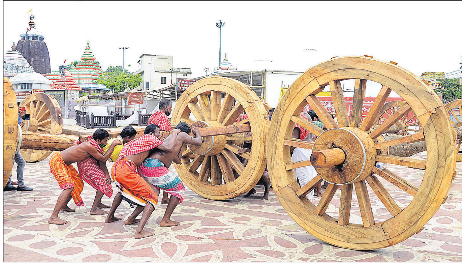
ପୁରୀ ଶ୍ରୀମନ୍ଦିର ସମ୍ମୁଖରେ ଶନିବାର ଶ୍ରୀଜଗନ୍ନାଥଙ୍କ ନନ୍ଦିଘୋଷ ରଥ ପାଇଁ ଚକ-ଅଞ୍ଜ ସଂଯୋଗ କରାଯାଇଛି।