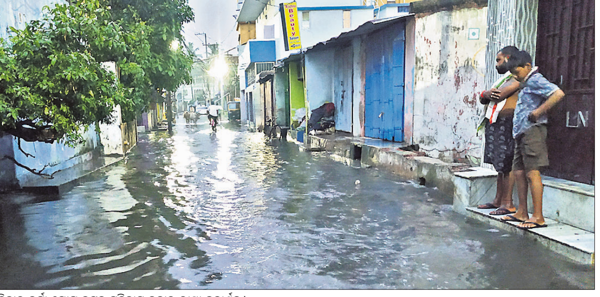
ଶନିବାର ବର୍ଷା ଯୋଗୁ କଟକ ମହିବାସ ବଜାର ରାସ୍ତା ଜଳାଣିବ।

ଭୁବନେଶ୍ୱର, ୧୨।୬ (ଭୁବନେଶ୍ୱର) ବିଦ୍ୟାଳୟ ଓ ଗଣଶିକ୍ଷା ବିଭାଗ ପକ୍ଷରୁ ଓଡ଼ିଶା ଶିକ୍ଷା ସେବା (ଓଇଏସ୍)ର ୫୨ ଜଣ ଅଧିକାରୀଙ୍କୁ ପ୍ରଥମ ଶ୍ରେଣୀ କନିଷ୍ଠ ବର୍ଗକୁ ପଦୋଚ୍ଚ୍ଚ୍ଚ ଦିଆଯାଇଛି।