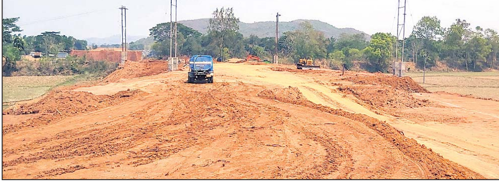
କେନାଲ କାମ ଚାଲିଛି।

ଭଞ୍ଜନଗର ଜଳସେଚନ ବିଭାଗ ପକ୍ଷରୁ ଚାଲିଥିବା ନୁଆଗାଁ ପୁଖ୍ୟ କେନାଲ କାମ ସାବରା ପର୍ଯ୍ୟନ୍ତ ୮୦% ଉପଯୋଗରେ ପହଞ୍ଚିଛି। ଚେନ୍ଦୁ ଚଳିତ ଖରିଫ ଋତୁରେ ପରାମ୍ପାମୂଳକ ଭାବେ ସାବରା ପର୍ଯ୍ୟନ୍ତ ପାଣି ଛଡ଼ାଯିବା ଯୋଜନା ଅଛି। କେନାଲ କାମ ସମ୍ପୂର୍ଣ୍ଣ ହେଲେ ହିଁ ଗାନ୍ଧୀମାନେ ଚା'ର ସୁଫଳ ପାଇବେ। ଅପରପକ୍ଷେ ଲୋକଙ୍କ ସହଯୋଗ ଆଭାବ, ଗଛ କାଟିବା ସମସ୍ୟା ସମେତ ଅନ୍ୟାନ୍ୟ କାରଣରୁ ଏବେବି କେତେକ ସ୍ଥାନରେ ଜମି ଅଧିଗ୍ରହଣରେ ଅପ୍ରତିଷ୍ଠା ଦେଖାଦେଇଛି। ଚେନ୍ଦୁ କେନାଲ କାମ ପୂର୍ଣ୍ଣାଙ୍ଗରେ ବିନୟ ହେଉଛି। ଯେଉଁଠି ପାଇଁ ଅନ୍ୟାନ୍ୟ ଖର୍ଚ୍ଚ ମଧ୍ୟ ବଢ଼ିଯାଉଛି। ଏହ ପୂର୍ଣ୍ଣାଙ୍ଗ ହେଲେ ୨୦ ଗ୍ରାମର ଗାନ୍ଧୀ ସୁଫଳ ପାଇବେ। ପୁଖ୍ୟ କେନାଲ ଏବଂ ଶାଖା କେନାଲ ମଧ୍ୟମରେ ପ୍ରାୟ ୨୫ଶହ ହେକ୍ଟର ଜମିକୁ ଜଳସେଚନ ଯୋଜନା ଅଛି। ବର୍ତ୍ତମାନ ପୁଖ୍ୟ କେନାଲର ପ୍ରାୟ ୬ କି.ମି. କାମ ସରିଥିବା ବେଳେ ଜମି ଅଧିଗ୍ରହଣ ସମସ୍ୟା ଯୋଗୁ ଆହୁରି ୫ କି.ମି. କାମ ଆଉଁସି