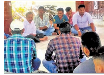
ନୟାଗଡ଼ ଅର୍ପିସ, ୨୫.୧୦

ଡାଟା ଏଣ୍ଟ୍ରି ଅପରେଟରଙ୍କ ଆନ୍ଦୋଳନ ନିଷ୍ପତ୍ତି