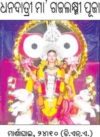
ମାଣିଘାଉ, ୨୪।୧୦ (ଡି.ଏନ୍.ଏ.) ମାଣିଘାଉ ବ୍ଲକର ବିଭିନ୍ନ ସ୍ଥାନରେ ଧନଦାତ୍ରୀ ମା' ଗଜଲକ୍ଷ୍ମୀଙ୍କ ପୂଜା କୋଉଡ଼ି କଟକଣା ମଧ୍ୟରେ ଅନୁଷ୍ଠିତ ହେଉଛି। ମାଣିଘାଉ ବଜାରରେ ଲକ୍ଷ୍ମି, ବନମାଳୀ ଛକ, କୁମ୍ଭୀର ସାହି, ବନ୍ଧ ସାହି, ମୁଣା ଛକ, ହାଟ ଗାଁ ମାଣିଘାଉ, କଣ କଷ୍ଟରେ ଚାଲିଛି। ଏଥିସହ ବ୍ଲକର ଡକସଙ୍ଗା, ଗରଜଙ୍ଗା, ବଡ଼ପାଳଗଡା, ମଙ୍ଗଳାକପୁର, କୁଆଁରପାଳ, ବଟିରା, ଆଉରା, ନେମରାଗାଁରେ ମା'ଙ୍କ ମୂର୍ତ୍ତୀ ପୂଜା ପାଉଛନ୍ତି।

ଶୁଣିବା ନେଇ ଆଶଙ୍କା ସୃଷ୍ଟି ହୋଇଥିବା ସେ ପ୍ରକାଶ କରିଛନ୍ତି। ଏ ସମ୍ପର୍କରେ ଜିଲ୍ଲା କୃଷି ଉପନିର୍ଦ୍ଦେଶକ ଶରତ ଚନ୍ଦ୍ର ଦାସଙ୍କୁ ପଚାରିବାରେ ଜିଲ୍ଲାର କେନ୍ଦ୍ରାପଡ଼ା ବ୍ଲକକୁ ଛାଡି ଅନ୍ୟ ୮ଟି ବ୍ଲକରେ ମାଟିଆ ପୋକ ଦେଖାଦେଇଛନ୍ତି। ଜମିରୁ ପାଣି ନିଷ୍କାସନ କରି ପୁନର୍ବାର ପାଣି ଭରିବା, ଏ ସମୟରେ ଯବସାରଯାନ ଜାତୀୟ ସାର ପ୍ରୟୋଗ ନ କରିବା, ଅନୁମୋଦିତ ଭାବେ ପତାସ ସାର ପ୍ରୟୋଗ କରିବା ଆଦି କେତେକ ପ୍ରତିକାର ବ୍ୟବସ୍ଥା ସମ୍ପର୍କରେ ଚାଷୀଙ୍କୁ ସଚର୍ଚ୍ଚ କରାଯାଇଛି। ଗୋଟିଏ ପ୍ରକାର କାଟନାଶକ ପ୍ରାୟ ୨୦୦ ଟଙ୍କା ପର୍ଯ୍ୟନ୍ତ ଦିଆଯାଇଛି। ୫୦ ପ୍ରତିଶତ ଚିତ୍ରାରେ ରାସାୟନିକ ଔଷଧ ଚାଷୀଙ୍କ ପାଇଁ ଯୋଗାଇ ଦିଆଯାଉଥିବା ଓ ସାରର ଅଭାବ ବିକ୍ରିକୁ ରୋକାଯାଉଛି ବୋଲି ସେ ସୂଚନା ଦେଇଛନ୍ତି।