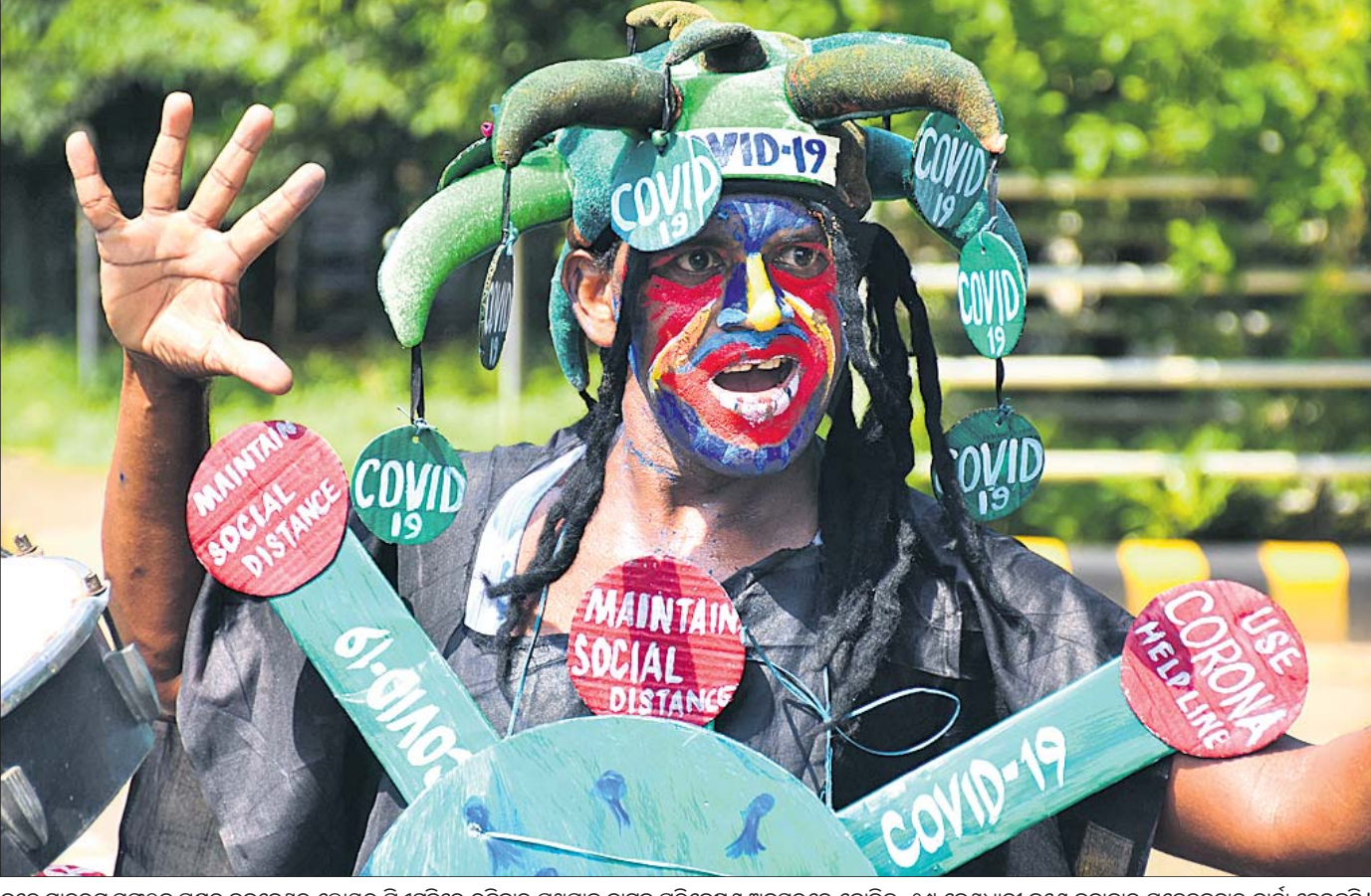
ବନ୍ଦେ ମାତରମ୍ ସଙ୍ଗଠନ ପକ୍ଷରୁ ଭୁବନେଶ୍ୱର ଲୋକସଭା ପିଏଲଏରେ ରବିବାର ପଥପ୍ରାନ୍ତ ନାଟକ ପରିବେଷଣ ଅବସରରେ କୋଭିଡ୍-୧୯ ବେଶଧାରୀ ଜଣେ କଳାକାର ସଚେତନତାର ବାଣୀ ଦେଉଛନ୍ତି।