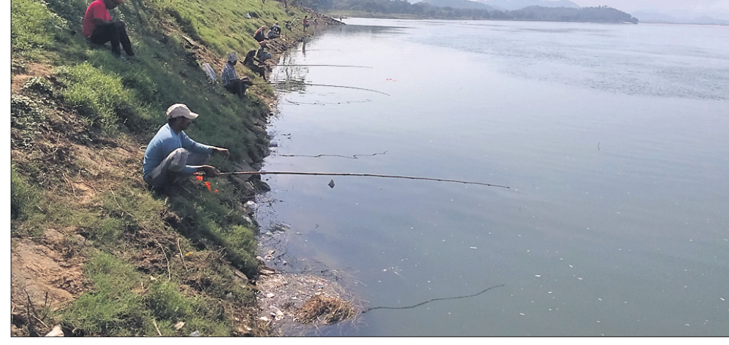
ମହାନଦୀ କୂଳରେ ବସି ବନିଶିରେ ଜଣେ ବ୍ୟକ୍ତି ମାଛ ମାଉଛନ୍ତି ।

ମଧୁର ମାଛର ଚାହିଦା ଦିନକୁଦିନ ବୃଦ୍ଧି ପାଇଛି । ମହାନଦୀରେ ମିଳୁଥିବା ମଧୁର ମାଛର ଚାହିଦା ସବୁଠୁ ଅଧିକ । କିନ୍ତୁ ବିଭିନ୍ନ କାରଣରୁ ମହାନଦୀରେ ମାଛସଂଖ୍ୟା କ୍ରମଶଃ ହ୍ରାସ ପାଇବାରେ ଲାଗିଛି । ଏପରି ସ୍ଥିତିରେ ଶତାଧିକ ଅଣକୈବର୍ତ୍ତ ଲୋକେ ମହାନଦୀରୁ ମାଛ ମାଉଛନ୍ତି । ଏହାକୁ ନେଇ କୈବର୍ତ୍ତ ସମ୍ପ୍ରଦାୟ ଲୋକେ ଚିନ୍ତାରେ ପଡ଼ିଛନ୍ତି । ସେମାନେ କେଉଁଠାରେ ହରାଇବେ ବୋଲି ଦର୍ଶାଇ ଆନ୍ଦୋଳନାତ୍ମକ ପଛା ଗ୍ରହଣ କରିବେ ବୋଲି ଚେତାବନୀ ଦେଇଛନ୍ତି । ଜିଲ୍ଲା ପ୍ରଶାସନ ଏ ସଂକ୍ରାନ୍ତିରେ ଭୂରାଜ କାର୍ଯ୍ୟାନୁଷ୍ଠାନ ଗ୍ରହଣ କରନ୍ତୁ, ଅଣକୈବର୍ତ୍ତ ଲୋକେ ମହାନଦୀରୁ ମାଛ ମାରିବା ଉପରେ ରୋକ ଲାଗାଇବାକୁ ଦାବି କରିଛନ୍ତି । ରାଜ୍ୟ ସରକାର ମହାବୀର ପାଇଁ