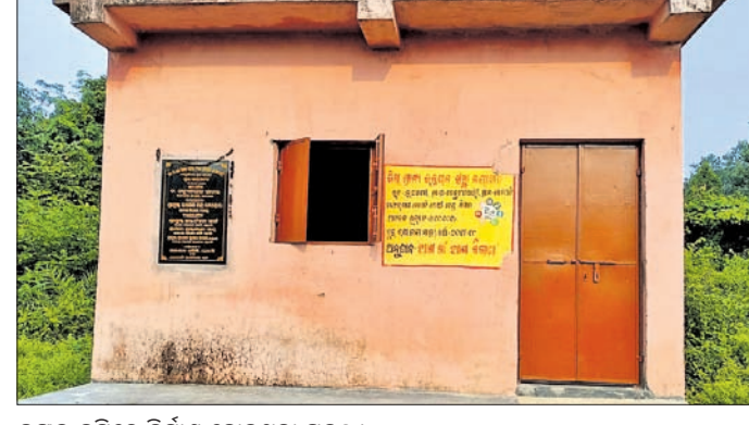
ଜଙ୍ଗଲ ଜମିରେ ନିର୍ମାଣ ହୋଇଥିବା ପ୍ରକଳ୍ପ ।

ନୂଆଗାଁ, ୨୫.୧୦(ଡି.ଏନ.ଏ.) ନୟାଗଡ଼ ଜିଲ୍ଲା ନୂଆଗାଁ କୁଳର ଆମ ଗାଁ ଆମ ବିକାଶ ପ୍ରକଳ୍ପ ଓଡ଼ିଶା ଜଙ୍ଗଲ ଜମିରେ ନିର୍ମାଣ ହୋଇଥିବା ଅଭିଯୋଗ ହୋଇଛି । ଏହାକୁ ନେଇ ବିବାଦ ଆରମ୍ଭ ହୋଇଛି । ନୂଆଗାଁ କୁଳ ବେଢ଼ୁଆଦିର ପଞ୍ଚାୟତ କେପେଟି ଗ୍ରାମରେ ଏକ ଗୋଷ୍ଠୀ କେନ୍ଦ୍ର ନିର୍ମାଣ ପାଇଁ ଆମବିକାଶ ଯୋଜନାରେ ୨୦୧୮-୧୯ରେ ୨ ଲକ୍ଷ ଟଙ୍କା ଅନୁଦାନ ପ୍ରଦାନ କରାଯାଇଥିଲା । ଉକ୍ତ ପ୍ରକଳ୍ପ ନିର୍ମାଣ ପାଇଁ ସେହି ଗ୍ରାମରେ ଜାଗା ନ ଥିବାରୁ ନିର୍ମାଣ କାର୍ଯ୍ୟ ହୋଇ ପାରୁ ନ ଥିଲା । ଫଳରେ ଉକ୍ତ ପ୍ରକଳ୍ପକୁ ଓଡ଼ିଶା ବନାଞ୍ଚଳ ବାହାଡ଼ାଖୋଲା ଫରେଷ୍ଟ ଅଧୀନରେ ଥିବା କେପେଟି ସଂରକ୍ଷିତ ଜଙ୍ଗଲରେ ନିର୍ମାଣ କରାଯାଇଛି । ସରକାରଙ୍କ ନିୟମ ପୂରାବଦ୍ଧ