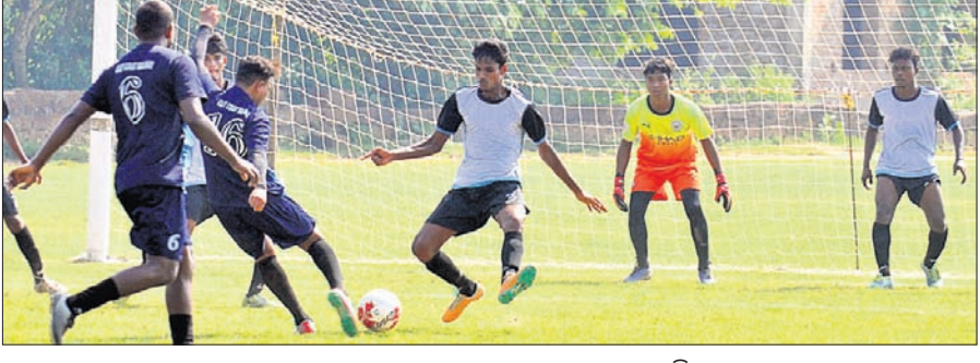
ଲକ୍ଷ୍ମକୋଷ୍ଠ ରେଲୱେ ଓ ଶ୍ରୀ ନାଳଚକ୍ର କ୍ଲବ ମଧ୍ୟରେ ଅନୁଷ୍ଠିତ ମ୍ୟାଚ୍।

ଭୁବନେଶ୍ୱର, ୨୪।୧୦ (କ୍ରୀଡ଼ା ପ୍ରତିନିଧି): ପୁରୀରୁ ଆସୋସିଏଟେଡ ଅଫ୍ ଓଡ଼ିଶା (ଫାଓ) ଏବଂ ରାଜ୍ୟ ସରକାରଙ୍କ କ୍ରୀଡ଼ା ଓ ଯୁବସେବା ବିଭାଗ ଆନୁକୁଲ୍ୟରେ କଟକରେ ଚାଲିଥିବା ଆନ୍ତର୍ଜାତୀୟ କ୍ଲବ ପୁରୀରୁ ଚାମ୍ପିୟନଶିପ୍‌ର ୩ୟ ଦିବସରେ ରବିବାର ୧୦ଟି ମ୍ୟାଚ୍ ଅନୁଷ୍ଠିତ ହୋଇଛି। ଏଥିରେ କଟକ ସୋର୍ସ୍ ହଷ୍ଟେଲ ୭-୦ ଗୋଲରେ ବାଲେଶ୍ୱର ଚାଉଁଡ଼ କ୍ଲବ, ଓଡ଼ିଶା ପୋଲିସ୍ ୪-୦ ଗୋଲରେ ବୌଦ୍ଧ ଗୋଲହାମା କ୍ଲବ, କଟକ