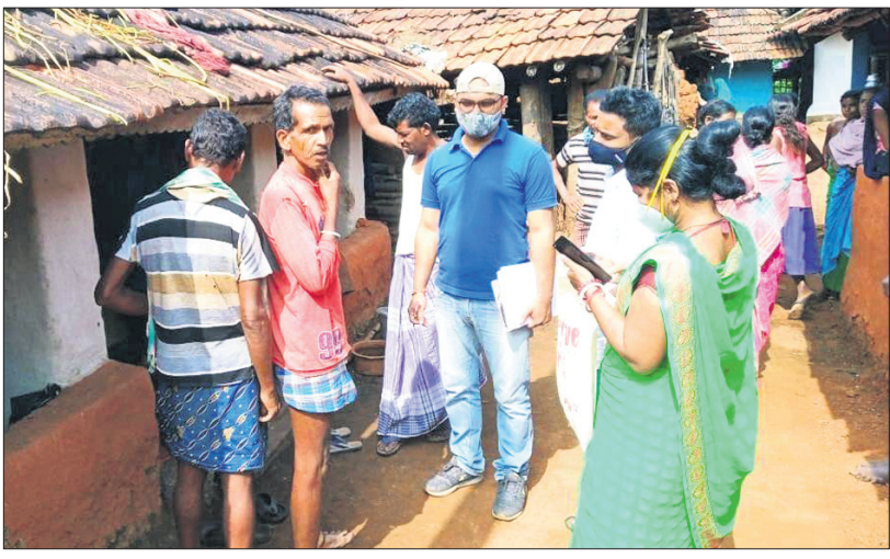
ଗ୍ରାମରେ ପହଞ୍ଚିଥିବା ଡାକ୍ତରୀ ଟିମ୍।