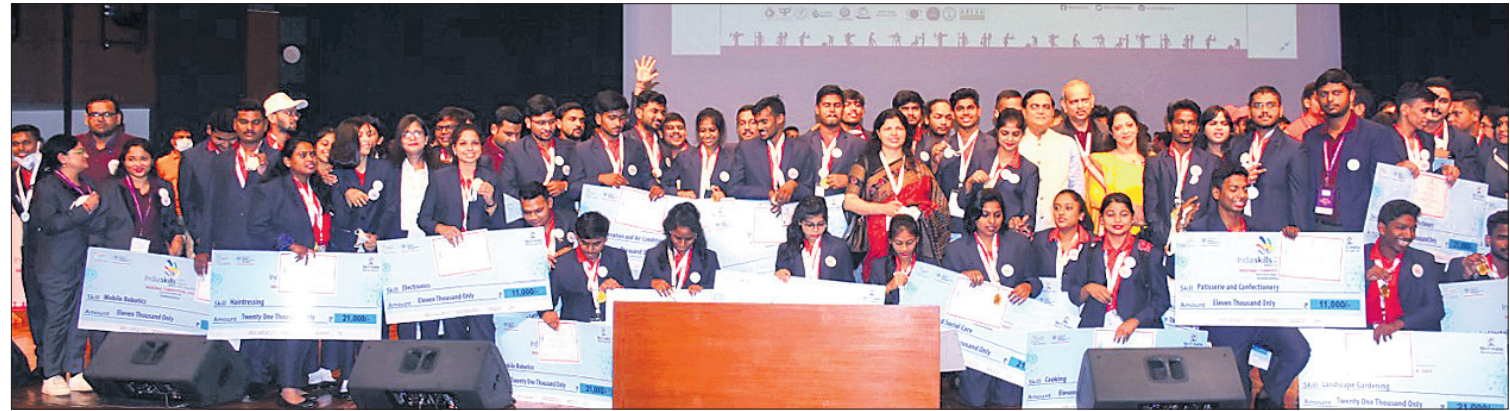
ପାଟଣାସ୍ଥିତ ବାପୁ ସଭାଗାରଠାରେ ଆୟୋଜିତ ପୂର୍ବାଞ୍ଚଳ ଲକ୍ଷ୍ମିଆ ସିଲ୍ଲୁ ପ୍ରତିଯୋଗିତାର ଉଦ୍‌ଘାଟନା ଦିବସରେ ଓଡ଼ିଶା କୃତୀ ପ୍ରତିଯୋଗୀମାନେ ।