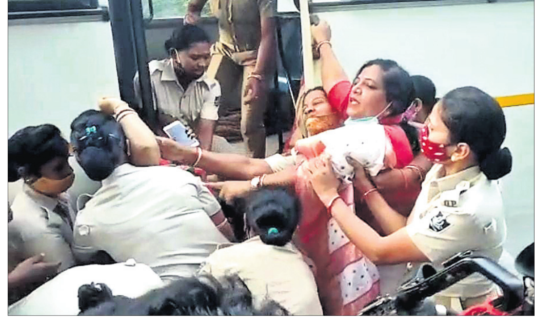
ମନ୍ତ୍ରୀ ଦିବ୍ୟଶଙ୍କର ମିଶ୍ରଙ୍କ ବାସଭବନ ଆଗରେ ବିରୋଧ କରୁଥିବା ଭଜପା ମୋର୍ଚ୍ଚା କର୍ମୀଙ୍କୁ ପୋଲିସ ଉଠାଇ ନେଉଛି।