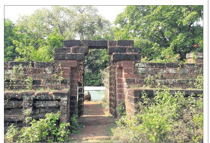
ରାଇବଣିଆ ଦୁର୍ଗର ମୁଖ୍ୟ ପ୍ରବେଶ ଦ୍ୱାର।

ଦୁର୍ଗରେ ଅବସ୍ଥାନ କରି ନିଜ ସାମ୍ରାଜ୍ୟକୁ ସୁରକ୍ଷା ଦେଇଆସୁଥିଲେ। ଉକ୍ତ ଦୁର୍ଗ ପାଖରେ ୧୮ଟି ଅନ୍ୟ ଛୋଟ ଦୁର୍ଗ ଥିଲା। ମୁଖ୍ୟ ଦୁର୍ଗର ଅନ୍ୟ ଦୁର୍ଗକୁ ଯିବା ପାଇଁ ସୁତଙ୍ଗପଥର ବ୍ୟବସ୍ଥା ରହିଥିଲା। ଏହି ଦୁର୍ଗର ବିଶେଷତ୍ୱ ହେଲା ବାହ୍ୟଶକ୍ତ ଆକ୍ରମଣ ହେଲେ ସୁତଙ୍ଗ ପଥରେ ଅନ୍ୟ ଗୁମୁକୁ ଯିବାର ବ୍ୟବସ୍ଥା ଥିଲା। ଦୁର୍ଗ ରାଜପଥ ଓ ଗତଗାଈ ଓ ମାଟି ନିର୍ମିତ