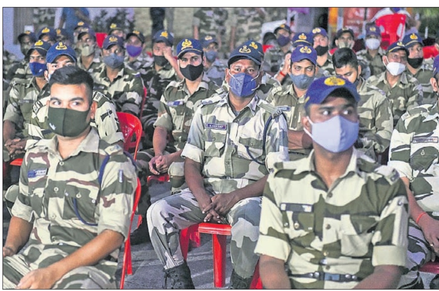
ପୁରୀରୁ ଯିଆଇଏସ୍‌ଏଫ୍ କ୍ୟାମ୍ପରେ ଯବାନମାନେ ରବିବାର ଭାରତ-ପାକିସ୍ତାନ ଚିନ୍ତା ବିଶ୍ୱକପ ମ୍ୟାଚ୍ ଦେଖୁଛନ୍ତି।

ରହିବା ସହ ଦଳକୁ ଜିତାଇଥିଲେ। ପଞ୍ଚମ ଉଇକେଟରେ ଅସଲଙ୍କା ଓ ରାଜପାକ୍‌ସେ ୫୨ ବଲ୍‌ରୁ ୧୧୨ ରୁଣ୍ଡ ୧୮୭ ରନ ସଂଗ୍ରହ କରିଥିଲେ। ବୋଲିଂରେ ବାଂଲାଦେଶ ତରଫରୁ ନସୁମ ଓ ଶିକ୍ଷକ ୨ଟି ଲେଖାଏ, ମହମ୍ମଦ ସେୟୁଦ୍‌ଦିନ ଗୋଟିଏ ଉଇକେଟ ଅଭିଆର କରିଥିଲେ। ଚ୍ୟୁ ହାରି ବ୍ୟାଟିଂ ପାଇଁ ଆମନ୍ତ୍ରଣ ପାଇଥିବା ବାଂଲାଦେଶ ତରଫରୁ ଓପନର ମହମ୍ମଦ ନଜମ ଓ ମୁସ୍‌ଫିକର ରହିମ ଅପରାଜିତ ଅର୍ଦ୍ଧଶତକ ଲାଭ କରିଥିଲେ। ସମ୍ପାନକନକ ଷୋର ପ୍ରଦାନ କରିଥିଲେ। ଅନ୍ୟତମ ଓପନର ଲିଟେନ ଦାସ ୧୬, ଅଲରାଉଣ୍ଡର ଶିକ୍ଷକ ୧୦, ଅପିଫ୍ ହୋସେନ ୭ ରନ କରି ପ୍ୟାଭଲିୟନ ଫେରିଥିଲେ।