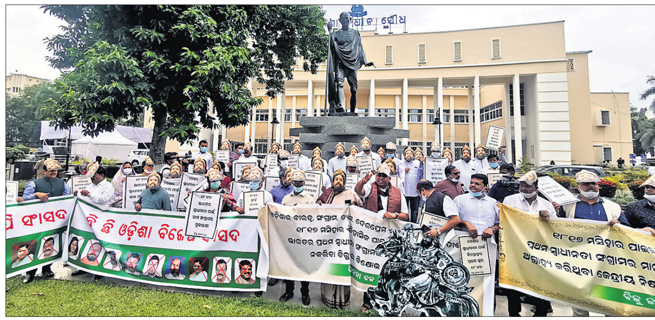
ପାଇକ ବିଦ୍ରୋହକୁ ଦେଖି ପ୍ରଥମ ସ୍ଵାଧୀନତା ସଂଗ୍ରାମ ମାନ୍ୟତା ପ୍ରଦାନ ପାଇଁ ସୋମବାର ବିଧାନସଭା ପରିସର ଗାନ୍ଧୀ ମୂର୍ତ୍ତି ତଳେ ବିଭେଦିତ ବିଧାୟକଙ୍କ ଧାରଣା ।