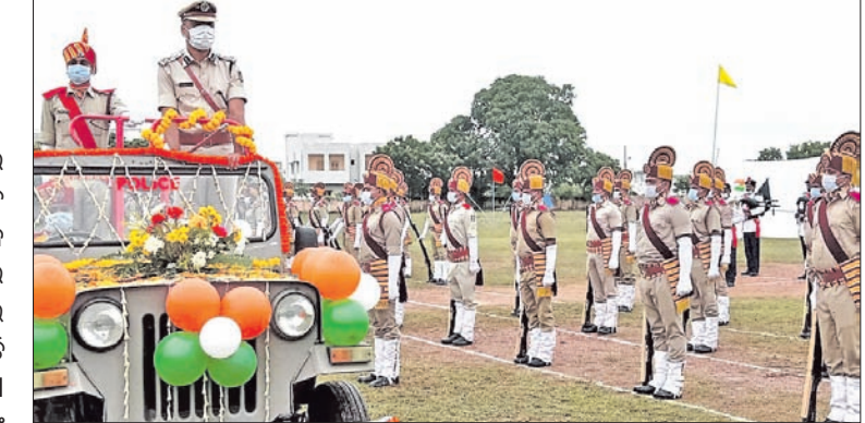
କାର୍ଯ୍ୟକ୍ରମରେ ଉପସ୍ଥିତ ଡିଆଇଜି ଓ ଗୃହରକ୍ଷା ।