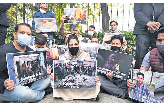
ଧରଣୀରେ ବସିଥିବା ମେହବୁବାଙ୍କୁ ଘେରି ରାଜନୀତିକ ଦଳର ଲୋକ ଥାଇଛନ୍ତି।

କମ୍ପ୍ୟୁଟର ଜନସାଧାରଣଙ୍କ ପ୍ରତି ହେଉଥିବା ଦମନଲୀଳା ପ୍ରତିବାଦରେ ପୂର୍ବତନ ମୁଖ୍ୟମନ୍ତ୍ରୀ ମେହବୁବା ନୂଆଦିଲ୍ଲୀର ଅଧିକାର କୋର୍ଟରେ ଧାରଣାରେ ବସିଛନ୍ତି।