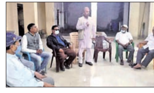
ଆଲୋଚନାରେ ସଂଘର ସଦସ୍ୟ ଓ ଅନ୍ୟମାନେ ।

ପୂଜ୍ୟ ପୂଜା ସମିତି ପକ୍ଷରୁ ବିକିପୁର କମ୍ୟୁନିଟି ହଲରେ ସୋମବାର ତ. ଭୀମରାଓ ଆୟତକରଙ୍କ ତିରୋଧାନ ଦିବସ ପାଳିତ ହୋଇଯାଇଛି । ସାମାଜିକ ପରିବର୍ତନ ଓ ଦେଶ ଗଠନରେ ଆୟତକରଙ୍କ ସମ୍ପର୍କରେ ଆଲୋଚନା ହୋଇଥିଲା ।