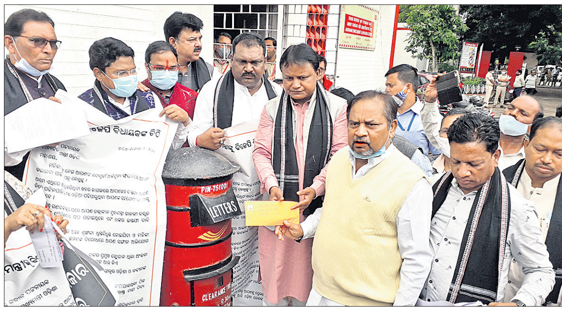
ମହିଳା ସୁରକ୍ଷା ନେଇ ମୁଖ୍ୟମନ୍ତ୍ରୀ ନବୀନ ପଟ୍ଟନାୟକଙ୍କ ପାଖକୁ ଭାଜପା ନେତୃବୃନ୍ଦ ପିଏମ୍‌ଜି ସୋଷ୍ଟ ଅଫିସରେ ଚିଠି ପଠାଇଛନ୍ତି ।