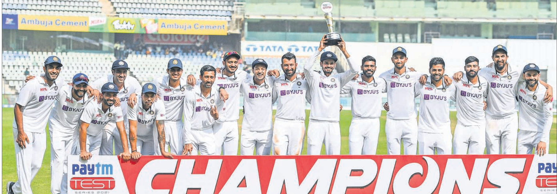
ନ୍ୟୁଜିଲାଣ୍ଡ ବିପକ୍ଷରେ ୧-୦ରେ ଚେଷ୍ଟା ସିରିଜ ଜିତିବାପରେ ଭାରତୀୟ ଦଳର ଖେଳାଳିମାନେ ଟ୍ରଫି ସହ ।

ମୁମ୍ବାଇରେ ଯୋଗବାର ଶେଷ ହୋଇଥିବା ଦ୍ୱିତୀୟ ଟିଷ୍ଟରେ ଚେଷ୍ଟାରେ ଭାରତ ୩୭୨ ରନରେ ନ୍ୟୁଜିଲାଣ୍ଡକୁ ପରାସ୍ତ କରିଛି । ଏଥିପରେ ୨ ମ୍ୟାଚ ବିଶିଷ୍ଟ ସିରିଜକୁ ଭାରତ ୧-୦ରେ ଜିତିଛି । ରେକର୍ଡ ଅନୁସାରେ ଭାରତ ମାଟିରେ କେବେହେଲେ ନ୍ୟୁଜିଲାଣ୍ଡ ଚେଷ୍ଟା ସିରିଜ ଜିତି ପାରିନାହିଁ । ଏଥରକୁ ମିଶାଇ ୧୨ ଥର ନ୍ୟୁଜିଲାଣ୍ଡ ଦଳ ଭାରତ ମାଟିରେ ଚେଷ୍ଟା ଖେଳିଥିଲେ ହେଁ କେବେ ସିରିଜ ଜିତିବାର ସୌଭାଗ୍ୟ ପାଇନାହିଁ ।