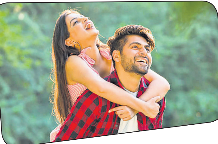
ଅନୁପମ ସମ୍ପର୍କର ମୂଳଦୁଆ ହେଉଛି ପରସ୍ପର ପ୍ରତି ଅତ୍ୟନ୍ତ ବିଶ୍ୱାସ; ଯାହା ଥରେ ଭାଙ୍ଗିଲେ ପୁନର୍ବାର ସୃଷ୍ଟି ହେବା ସ୍ତବ୍ଧ କଷ୍ଟ। ତେଣୁ ସର୍ବଦା ପରସ୍ପର ପ୍ରତି ବିଶ୍ୱାସନୀୟ ହେବାକୁ ଚେଷ୍ଟା କରନ୍ତୁ।

ମିଛ ବୋଲି ଭାବି ନିଅନ୍ତି; ଯାହାଦ୍ୱାରା ସମ୍ପର୍କର ତୋର ଦୁର୍ବଳ ହୋଇପଡ଼େ। ତେଣୁ ନିଜ ସମ୍ପର୍କକୁ ଏଭଳି ନିବିଡ଼ କରିବାକୁ ଚେଷ୍ଟା କରନ୍ତୁ, ଯେଉଁଠି ସନ୍ଦେହର ପ୍ରଶ୍ନ ହିଁ ଉଠିବ। ଅସମ୍ଭବ ହୋଇଯିବ। ସୁଅଳ୍ପ ପରସ୍ପର ପ୍ରତି ସଜାଗତା: ନିଜ ଜୀବନସାଥୀଙ୍କ ଆଗରେ କିଛି ଲୁଚାଇବାର ଅର୍ଥ ଅବିଶ୍ୱାସ ଏବଂ ସନ୍ଦେହର ମଞ୍ଜିବୁଣିବା; ଯାହା କି ସମ୍ପର୍କରେ ଫାଟ ସୃଷ୍ଟି କରିବା ଲାଗି ଯଥେଷ୍ଟ। ତେଣୁ ପରସ୍ପର ପ୍ରତି ସର୍ବଦା ସବୁବେଳେ ସୁଦୃଶ୍ୟ ଶୋଭା ରଖନ୍ତୁ ଏବଂ ସଜାଗତା ରଖନ୍ତୁ। ଏହା ସମ୍ପର୍କର ତୋରକୁ ହେଲେ ଅନେକ ଏଭଳି ପରିସ୍ଥିତିରେ ଖରାପର ସମାଧାନ କରିବା ବଦଳରେ ପରସ୍ପର ମଧ୍ୟରେ କଥାବାର୍ତ୍ତା ବଦଳିଯିବ। ଏହା ଦ୍ୱାରା କେବେ କେବେ କମ୍ପ୍ୟୁଟରରେ ଗାଧାଏ ତ କେବେ କେବେ ଦୂରତା ବଢ଼ିଥାଏ। ତେଣୁ ଏପରି ହେବାକୁ ଆସିବ ନ ଦେଇ ଖରାପ ପରିସ୍ଥିତି ଉତ୍ପତ୍ତିଲେ ଏହାର ସମାଧାନ ପାଇଁ ସହନଶୀଳତା ହିଁ ସବୁଠୁ ବଡ଼ ଚାକିରୀ। ତେଣୁ ଖରାପ ସମୟରେ ନାରୀ ରହି ପରବର୍ତ୍ତୀ ସମୟରେ ଏହାକୁ ଭୁଲି ପୁନର୍ବାର ପୂର୍ବ ପରି ହସ ଖୁସିରେ ଚଳିବା ଦ୍ୱାରା ସମ୍ପର୍କ ମଙ୍ଗଳୁତ ହୋଇଥାଏ। - ଯୌର୍ଣ୍ଣମାସୀ