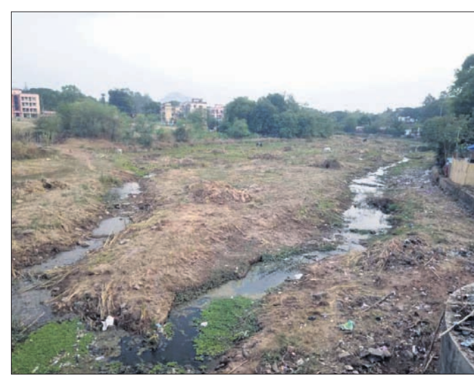
ଲକ୍ଷ୍ମଣାୟୋର ଠିକାଦାରପଡ଼ାଠାରେ ଲଟାଘର ଯାଇଛି, ମାତ୍ର ମାଟି ଉଠା ଯାଉନାହିଁ।

୨୦୧୯ ଅଗଷ୍ଟ ମାସରେ ବଲାଙ୍ଗୀର ସହରରେ ସାଂଘାତିକ ବନ୍ୟା ପରିସ୍ଥିତି ସୃଷ୍ଟି ହୋଇଥିଲା। ଅନେକଙ୍କ ଘର ଓ ଦୋକାନ ଭିତରକୁ ବନ୍ୟା ପାଣି ପଶି ଧନ ସମ୍ପଦ ନଷ୍ଟ ହୋଇଥିଲା। ଏହି ବନ୍ୟା ସମୟରେ ଲକ୍ଷ୍ମଣାୟୋର ସବୁରୁ ବେଶୀ ଚର୍ଚ୍ଚାରେ ରହିଥିଲା। ପ୍ରାୟ ୨୦କୋଟି ଟଙ୍କା ଅନୁଦାନରେ ଲକ୍ଷ୍ମଣାୟୋର ପୁନରୁଦ୍ଧାର ଏବଂ ସୌନ୍ଦର୍ଯ୍ୟକରଣ ଆରମ୍ଭ ହୋଇଥିବାବେଳେ ଉଚ୍ଚ ନିର୍ମାଣ କାମକୁ ନେଇ ଅନେକେ ପ୍ରଶ୍ନ ଉଠାଇଥିଲେ।