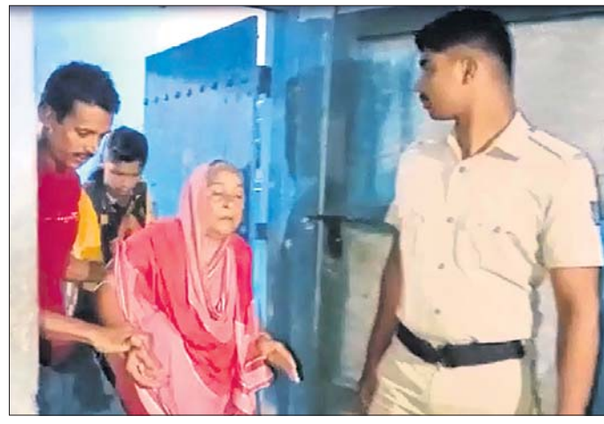
ପୋଲିସ୍ ଡାଲା ଭାଙ୍ଗି ସରକାରୀ କର୍ତ୍ତୃକୃତ୍ୟ

ରାଜ୍ୟ ସରକାର ମିଶନ ଶକ୍ତି ଯୋଜନାରେ ମହିଳାଙ୍କୁ ସ୍ୱାଧୀନତା ଦେବା ପାଇଁ ଉଦ୍ଦେଶ୍ୟ ରଖି ଏହାପାଇଁ ଗୋଷ୍ଠୀ (ଏସ୍‌ଏସ୍‌ସି) କ୍ରିୟାରେ କମ୍ପ୍ୟୁଟର ହାରରେ ବ୍ୟାଙ୍କ ରଣ ଯୋଗାଇ ଦେଇଛନ୍ତି। ଏହି ରଣ ଅର୍ଥକୁ ମହିଳାମାନେ ବିନିଯୋଗ କରି ଛେଳି, ମେଣ୍ଡା, କୁକୁଡ଼ା, ମାଛ ଚାଷ, ଛତୁ, ଛତୁଆ, ମଧ୍ୟାହ୍ନଭୋଜନ, ପାମ୍ପଡ, ବଡ଼ି, ଧୂପକାଠି ଆଦି ତିଆରି କରି ଅର୍ଥ ରୋଜଗାର କରିପାରିବେ। ହେଲେ କେତେକ ଏସ୍‌ଏସ୍‌ସି ଏହି ଅର୍ଥକୁ ନେଇ ମହାଜନୀ ବ୍ୟବସାୟ ଚଳାଇଛନ୍ତି। ସେମାନେ ଅର୍ଥକୁ ଚାଷୀ ଓ ମହିଳାଙ୍କୁ ରଣ ଆକାରରେ ଦେଇ ପୁଅ ଆଦାୟ କରୁଛନ୍ତି। ଏଭଳି ଏକ ଘଟଣା କେନ୍ଦ୍ରାପଡ଼ା ଜିଲ୍ଲା ରାଜକନିକା ଥାନା ଅଞ୍ଚଳରେ ଗୁରୁବାର ଦେଖିବାକୁ ମିଳିଛି। ଏକ ଏସ୍‌ଏସ୍‌ସିର