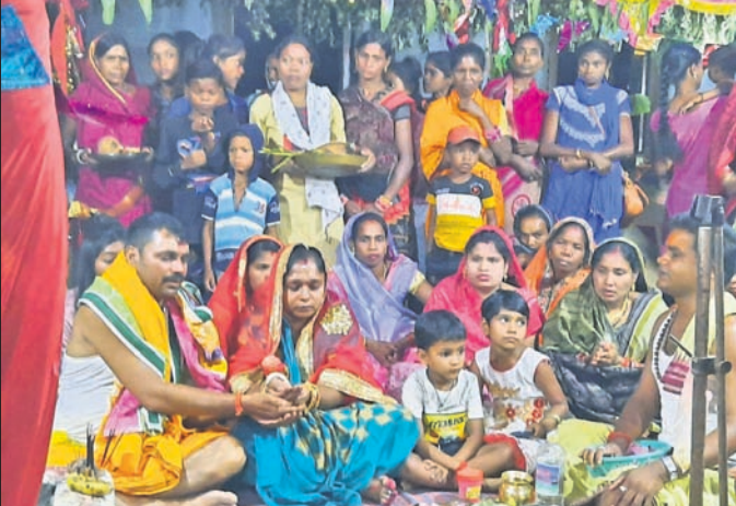
ନାମାୟଙ୍କରେ ପୂଜାର୍ଚ୍ଚନା କରାଯାଇଛି

ପାଠକମାଳା, ୨୬।୫(ତି.ଏନ.ଏ.) ବରଗଡ଼ ଜିଲ୍ଲା ପାଠକମାଳା ବ୍ଲକ୍ ବରକୁଞ୍ଚା ପଞ୍ଚାୟତରେ ପୁରୋକ୍ତ ଗ୍ରାମରେ ଚାଲିଥିବା ଷୋହଳ ପ୍ରସବ ଅଖଣ୍ଡ ନାମ ଯଜ୍ଞର ସୁରୁତାର ବୃତ୍ତାୟ ଦିବସ ଥିଲା। ଏହି ଦିବସରେ ନାମାୟଙ୍କ ପରିବେଷଣ ସହ ଭୋଗ ଓ ହୋମାୟଜ୍ ହୋଇଥିଲା। ନାମାୟଙ୍କ ସ୍ଥଳରେ ଆଖପାଖ ଗ୍ରାମର ଶତାଧିକ ଶ୍ରଦ୍ଧାଳୁ ଭକ୍ତ ଯୋଗଦେଇ ବିଭୁକୃପା