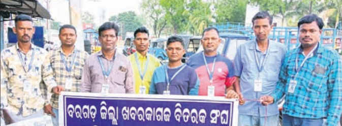
ବିଷ୍ଣୁ ହଜୁର ଦିବସରେ ଉପସ୍ଥିତ ଖବରକାରକ ବିତରକଙ୍କୁ

ପରିଚୟ ପତ୍ର, ୬ହଜାର ଟଙ୍କା ଲେଖାଏଁ କୋଭିଡ୍ ସହାୟତା ପ୍ରଦାନ କରିଥିବାରୁ ପୁଖ୍ୟମନ୍ତ୍ରୀଙ୍କୁ କୃତଜ୍ଞତା ଜ୍ଞାପନ କରାଯାଇଥିଲା। ଏହାସହିତ ଖବରକାରକ ବିତରକଙ୍କ ବିଭିନ୍ନ ସମସ୍ୟାର ସମାଧାନ ପାଇଁ ରାଜ୍ୟ ସରକାରଙ୍କ ଦୃଷ୍ଟି ଜିଲ୍ଲା ଖବରକାରକ ବିତରକ ସଂଘର କର୍ମକର୍ତ୍ତା, ସଭ୍ୟବୃନ୍ଦ ଉପସ୍ଥିତ ଥିଲେ। ସଂଘର ସାଙ୍ଗଠିକ ସ୍ଥିତିକୁ ସୁଦୃଢ଼ କରିବା ସହିତ ଆଗାମୀ କାର୍ଯ୍ୟପଦ୍ଧତି ଉପରେ ଆଲୋଚନା ହୋଇଥିଲା। ରାଜ୍ୟ ସରକାର ଖବରକାରକ ବିତରକଙ୍କୁ