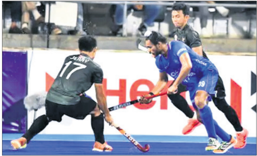
ଭାରତ ଓ ଇଣ୍ଡୋନେସିଆ ମଧ୍ୟରେ ଅନୁଷ୍ଠିତ ମ୍ୟାଚ।

ଏସିଆ କପ୍ ହକି ପ୍ରତିଯୋଗିତାରେ ଭାରତ ୧୬-୦ ଗୋଲରେ ଇଣ୍ଡୋନେସିଆକୁ ପରାସ୍ତ କରିଛି। ଏଥିପାଇଁ ଭାରତ ପ୍ରତିଯୋଗିତାର ନକ୍ସାଭର ପର୍ଯ୍ୟାୟକୁ ଉନ୍ନତ ହୋଇଛି। ନକ୍ସାଭର ପର୍ଯ୍ୟାୟକୁ ଉନ୍ନତ ହେବା ଲାଗି ପୁଲ୍ ଏବଂ ଏହି ମ୍ୟାଚରେ ଭାରତ ୧୫-୦ ଗୋଲରେ ଜିତିବା ଆବଶ୍ୟକ କରୁଥିଲା। ଯୁବ ଖେଳାଳିମାନେ ଚାପରେ ଥାଇ ସୁଦ୍ଧା ଚମତ୍କାର ପ୍ରଦର୍ଶନ କରିଥିଲେ। ପୁଲ୍ ଏବଂ ଲାପାନ୍ ପସ୍ତକ ଉଭୟ ପାକିସ୍ତାନ ଓ ଭାରତ ସମାନ ପଏଣ୍ଟ ଅର୍ଜନ କରିଥିଲେ। ହେଲେ ଉନ୍ନତ ଗୋଲ ବ୍ୟବଧାନ (୧) ଭିତ୍ତିରେ ଭାରତ ସୁପର ଟ୍ରଫି ପର୍ଯ୍ୟାୟକୁ ଉନ୍ନତ ହୋଇଥିଲା। ପୂର୍ବରୁ ଅନୁଷ୍ଠିତ ଏକ ମ୍ୟାଚରେ