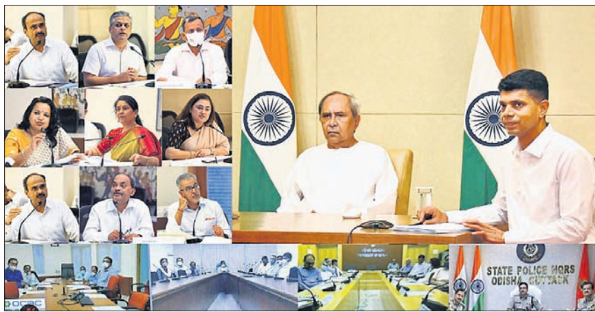
'ମୋ ସରକାର' ସମାକ୍ଷା ବୈଠକରେ ମୁଖ୍ୟମନ୍ତ୍ରୀ ନବୀନ ପଟ୍ଟନାୟକ, ୫-ଟି ସଚିବ ଭି.କେ. ପାଣିଗ୍ରାହୀ ଏବଂ ବରିଷ୍ଠ ଅଧିକାରୀମାନେ।