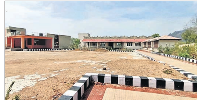
ନିର୍ମାଣଧାରୀ ହୋଇଥିବା ପର୍ଯ୍ୟଟନ କାର୍ଯ୍ୟାଳୟ।

କଳାହାଣ୍ଡି ଜିଲ୍ଲା ରାଜ୍ୟ ପର୍ଯ୍ୟଟନ ମାନଚିତ୍ରରେ ଏକ ପ୍ରମୁଖ ସ୍ଥାନ ନେଇଛି। ଜିଲ୍ଲାର ସବୁଜିମା ଇକୋଟୁରିଜମ୍, ଜଳ ପ୍ରପାତ ଓ ସୈନ୍ଦବ୍ୟ କାର୍ତ୍ତିକାଦି ଦେଖିବା ନିମନ୍ତେ ପ୍ରତିବର୍ଷ ପର୍ଯ୍ୟଟକ ସୁଅ ଛୁଟିଥାଏ। ପର୍ଯ୍ୟଟନ ବିଭାଗ ପକ୍ଷରୁ ଆନୁଷ୍ଠାନିକ ବ୍ୟବସ୍ଥା ନ ଥିବା ଯୋଗୁ ବ୍ୟୟବହୁଳ ଘରୋଇ ହୋଟେଲରେ ରହୁଛନ୍ତି। କିନ୍ତୁ ପର୍ଯ୍ୟଟକଙ୍କ ପାଇଁ ତିଆରି ହୋଇଥିବା କାମ ପର୍ଯ୍ୟଟନ ବିଭାଗ କାର୍ଯ୍ୟାଳୟ ଭୂତକାଳୀ ହୋଇ ପଡ଼ିରହିଛି। ଓଡ଼ିଶା ପର୍ଯ୍ୟଟନ ନିଗମ ପକ୍ଷରୁ ପ୍ରାୟ ୧ କୋଟି ଟଙ୍କା ବ୍ୟୟ ଅଟକଳରେ ଜିଲ୍ଲା ପର୍ଯ୍ୟଟନ କାର୍ଯ୍ୟାଳୟ ନିର୍ମାଣ କାର୍ଯ୍ୟ ଆରମ୍ଭ ହୋଇ ହସ୍ତାନ୍ତର ହୋଇଛି। ମାତ୍ର ଏବେ ବି ଜିଲ୍ଲା ସଂସ୍କୃତି କାର୍ଯ୍ୟାଳୟ ପ୍ରଥମ ମହଲାରେ ଜିଲ୍ଲା ପର୍ଯ୍ୟଟନ କାର୍ଯ୍ୟାଳୟ ଚାଲିଛି। ନୂଆ କୋଠା ଖଡ଼ ଖାଉଥିବା ବେଳେ ପର୍ଯ୍ୟଟନ ବିଭାଗ ସଂସ୍କୃତି କାର୍ଯ୍ୟାଳୟରେ କାମ ଚଳାଇବା